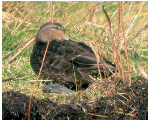
175 Short-billed Dowitcher / Kleine Grijsze Snip Limnodromus griseus , North Bull Island, Dublin, Ireland, 6 March 2005 (Paul & Andrea Kelly/irishbirdimages.com) 176 Oriental Turtle Dove / Oosterse Turtel Streptopelia orientalis , Drag, Nordland, Norway, 22 February 2005 (Thor Edgar Kristiansen) 177 Bonaparte's Gull / Kleine Kokmeeuw Larus philadelphia , adult-winter, with Black-headed Gull / Kokmeeuw L. ridibundus , adult-winter, Fraserburgh, Aberdeenshire, Scotland, February 2005 (Steve Young/Birdwatch) 178 American Black Duck / Amerikaanse Zwarte Eend Anas rubripes , male, Achill Island, Mayo, Ireland, 13 February 2005 (Paul & Andrea Kelly/irishbirdimages.com)

black neck transmitter at Borculo, Gelderland, the Netherlands, on 1-8 December 2004 was taken into care and sent back to Germany.