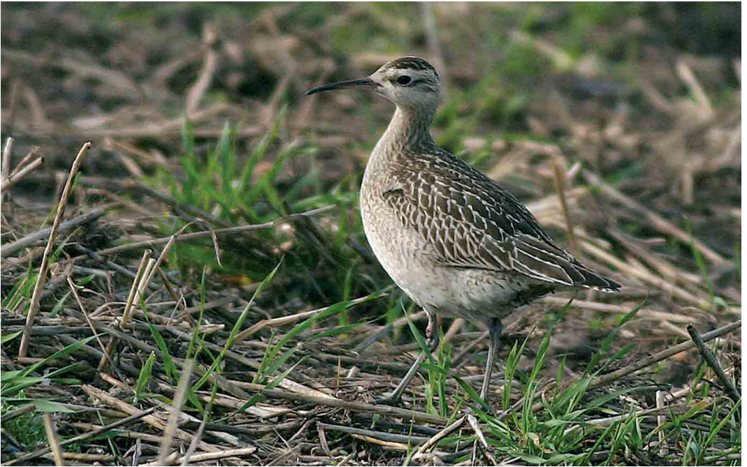
501 Little Curlew / Kleine Regenwulp Numenius minutus , juvenile, Ventlinge, Öland, Sweden, 18 October 2005