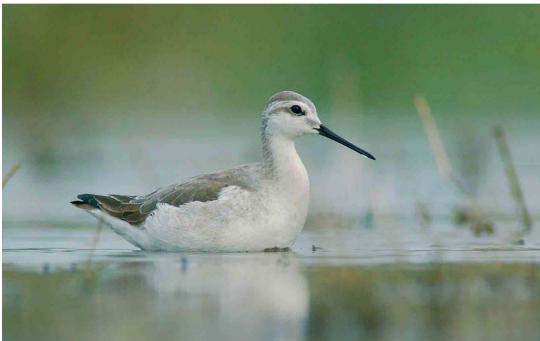
500 Wilson's Phalarope / Grote Franjepoot Phalaropus tricolor , first-winter, Balaton lake, Hungary, October 2005