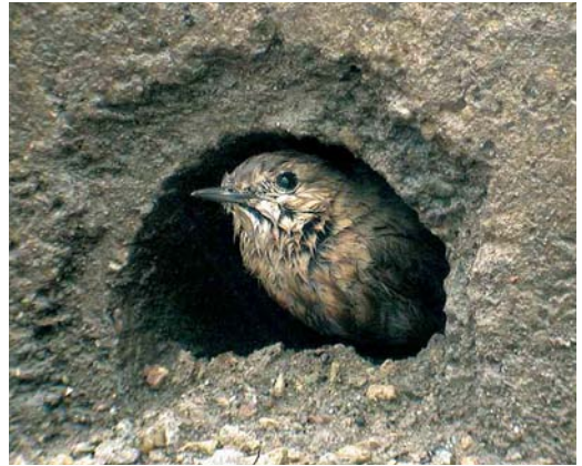
559 Izabeltapuit / Isabelline Wheatear Oenanthe isabellina , Aarschot, Vlaams-Brabant, oktober 2005 (Koen Verbanck)