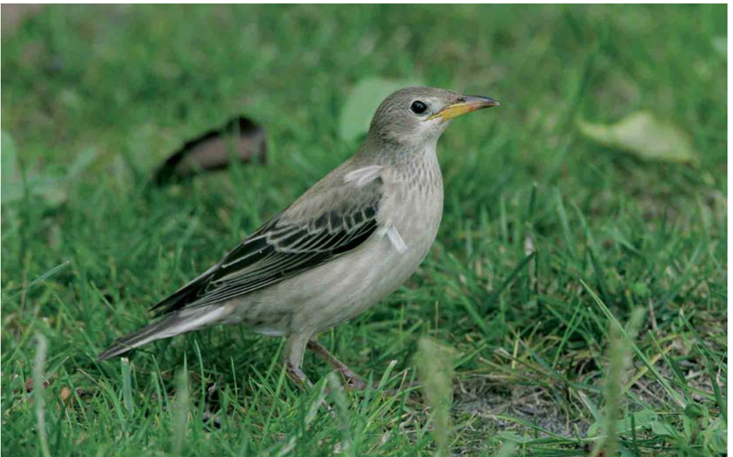
544 Roze Spreeuw / Rose-coloured Starling Sturnus roseus , juveniel, Terschelling, Friesland, 12 september 2005 (Arie Ouwerkerk)