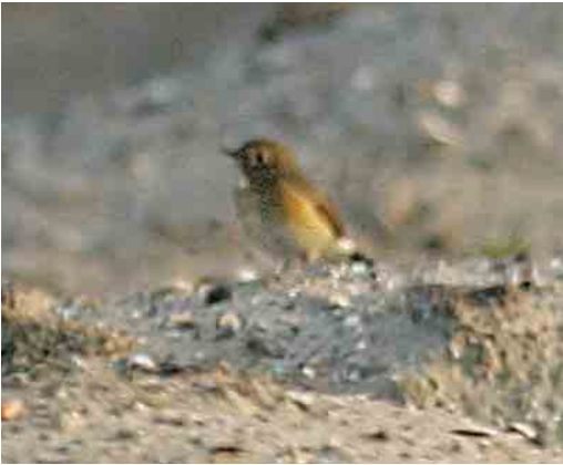
558 Blauwstaart / Red-flanked Bluetail Tarsiger cyanurus , Voorhaven, Zeebrugge, West-Vlaanderen, 15 oktober 2005