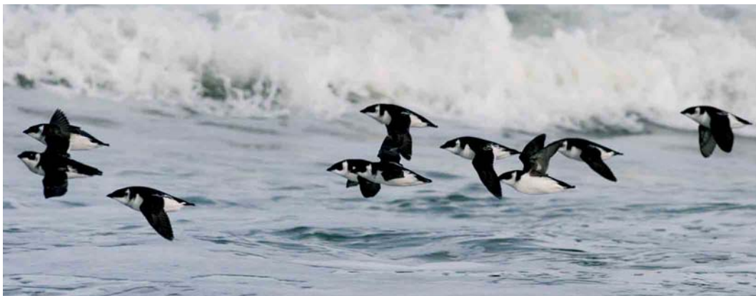
561 Kleine Alken / Little Auks Alle alle , Paal 7, Schiermonnikoog, Friesland, 23 oktober 2005

Nauwelijks nabij de vloedlijn aangekomen zagen