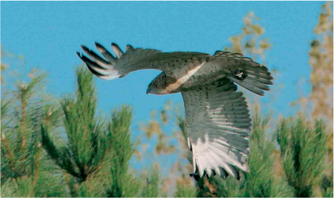
451 Short-toed Eagle / Slangenarend Circaetus gallicus , juvenile, Ilmeerdijk, Flevoland, 27 October 2004

Steyl, Limburg (via J J F J Jansen; Riotte 1922, 1923; Jaarber Club Nederl Vogelk 5: 97, 1915, Natuurh Maandbl 39: 90, 1950).