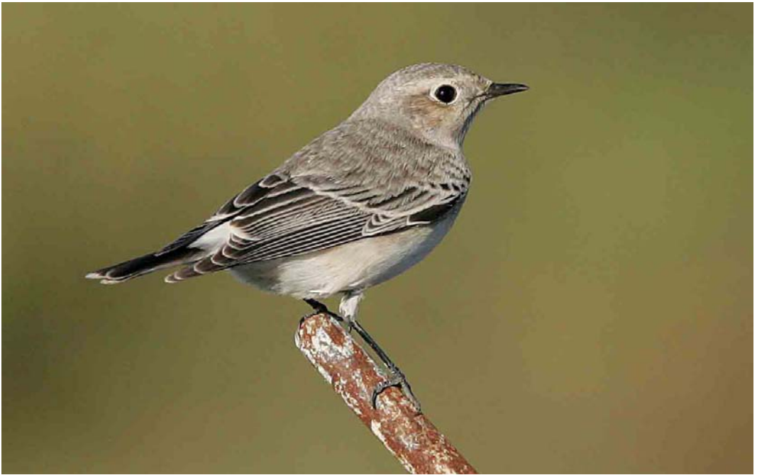
525 Pied Wheatear / Bonte Tapuit Oenanthe pleschanka , Esbjerg, Vestjylland, Denmark, 16 October 2005 ( Ole Krogh ) 526 Siberian Stonechat / Aziatische Roodborstapuit Saxicola maurus , first-year, Helgoland, Schleswig-Holstein, Germany, October 2005 ( Ole Krogh ) 527 Pine Bunting / Witkopgors Emberiza leucocephalos , male, Whalsay, Shetland, Scotland, 4 November 2005 ( Hugh Harrop )