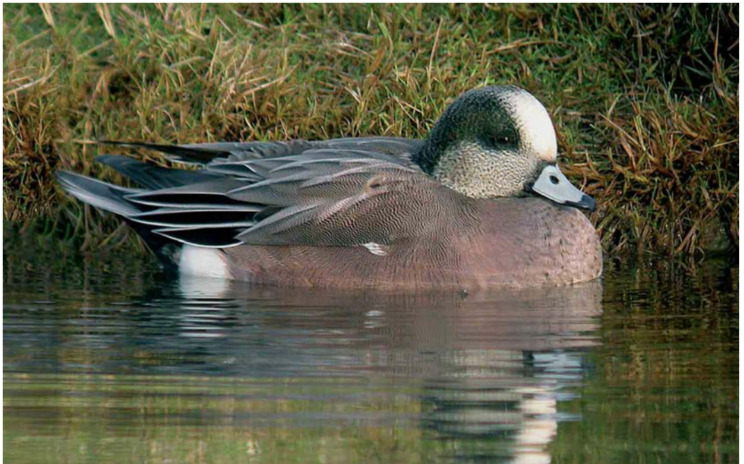
450 American Wigeon / Amerikaanse Smient Anas americana , male, Heerpolderweg, Zeeland, 6 January 2005