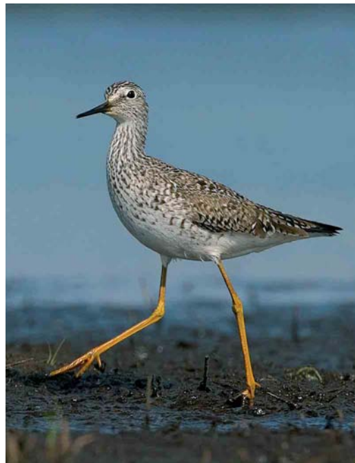
455 Long-billed Dowitcher / Grote Grijs Snip Limnodromus scolopaceus , first-year, Veerse Meer, Zeeland, 24 april 2004 ( Bas van den Boogaard ) 456 Lesser Yellowlegs / Kleine Geelpootruiter Tringa flavipes , Annermoeras, Spijkerboor, Drenthe, 21 May 2004 ( Bas van den Boogaard ) 457 Red-necked Stint / Roodkeelstrandloper Calidris ruficollis , adult, Slikken van Flakkee, Zuid-Holland, 6 July 2004 ( Pim A Wolf )