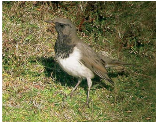
517 Myrtle Warbler / Mirtzanger Dendroica coronata , Smyrlabjörg, Suðursveit, Iceland, 17 October 2005 (Yann Kolbeinsson) 518 Blackpoll Warbler / Zwartkapzanger Dendroica striata , Heimaey, Vestmannaeyjar, Iceland, October 2005 (Yann Kolbeinsson) 519 Siberian Rubythroat / Roodkeelnachtegal Luscinia calliope , Utsira, Rogaland, Norway, 6 October 2005 (Christian Tiller) 520 American Buff-bellied Pipit / Amerikaanse Waterpieper Anthus rubescens rubescens , Gerðar, Garður, Iceland, 2 October 2005 (Yann Kolbeinsson) 521 Black-throated Thrush / Zwartkeellijster Turdus ruficollis atrogularis , female, Fair Isle, Shetland, Scotland, 22 October 2005 (Deryk Shaw) 522 Black-throated Thrush / Zwartkeellijster Turdus ruficollis atrogularis , male, Fair Isle, Shetland, Scotland, 23 October 2005 (Deryk Shaw)