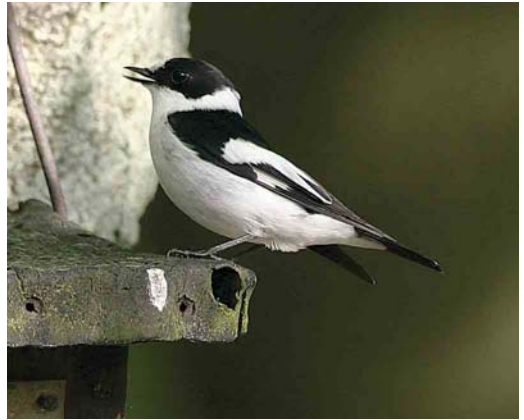
473 Collared Flycatcher / Withalsvliegenvanger Ficedula albicollis , male, Noord-Ginkel, Gelderland, May 2004 (Arjen Heeres)

2003 11-12 October, De Cocksdorp, Texel , Noord-Holland, photographed (D Kok, J de Bruijn, L B Steijn et al).