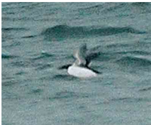
560 Kortbekzeekoet / Brünnich's Murre Uria lomvia, eerstejaars, Paal 7, Schiermonnikoog, Friesland, 23 oktober 2005