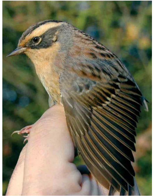
513 Brown Shrike / Bruine Klauwier Lanius cristatus , Utsira, Rogaland, Norway, 3 October 2005 514 Siberian Accentor / Bergheggenmus Prunella montanella , Schiffflange, Luxemburg, 2 November 2005 515 Paddyfield Warbler / Veldrietzanger Acrocephalus agricola , St Mary's, Scilly, England, October 2005 516 Booted Warbler / Kleine Spotvogel Acrocephalus caligatus , Helgoland, Schleswig-Holstein, Germany, 13 October 2005