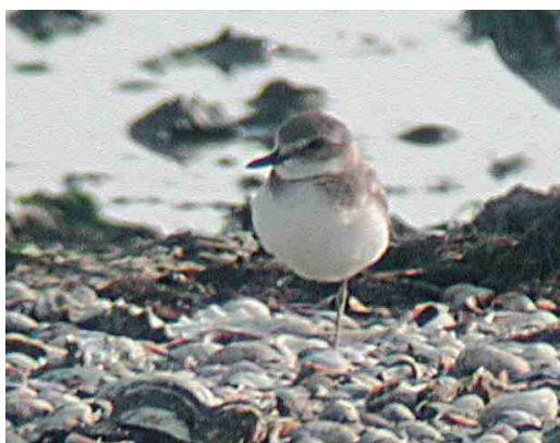
458 Pacific Golden Plover / Aziatische Goudplevier Pluvialis fulva , Grijskerke, Zeeland, 14 January 2004 ( Leo J R Boon/Cursorius ) 459 American Golden Plover / Amerikaanse Goudplevier Pluvialis dominica (centre), Grijskerke, Zeeland, 14 January 2004 ( Leo J R Boon/Cursorius ) 460 White-rumped Sandpiper / Bonapartes Strandloper Caldidris fuscicollis , De Hamert, Limburg, 22 May 2004 ( Patrick Palmen ) 461 Lesser Yellowlegs / Kleine Geelpootruiter Tringa flavipes , Eemshaven, Groningen, 10 August 2004 ( Martijn Bot ) 462 Buff-breasted Sandpiper / Blonde Ruiters Tryngites subruficollis , juvenile, De Hemmer, Texel, Noord-Holland, 28 September 2004 ( Ronald A van Dijk ) 463 Greater Sand Plover / Woestijnplevier Charadrius leschenaultii , adult, Battenoord, Zuid-Holland, 16 September 2004 ( Pim A Wolf )