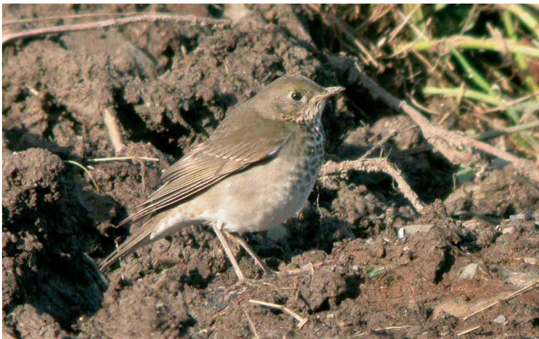
510 Grey-cheeked Thrush / Grijswangdwerglijster Catharus minimus , Cape Clear, Cork, Ireland, October 2005