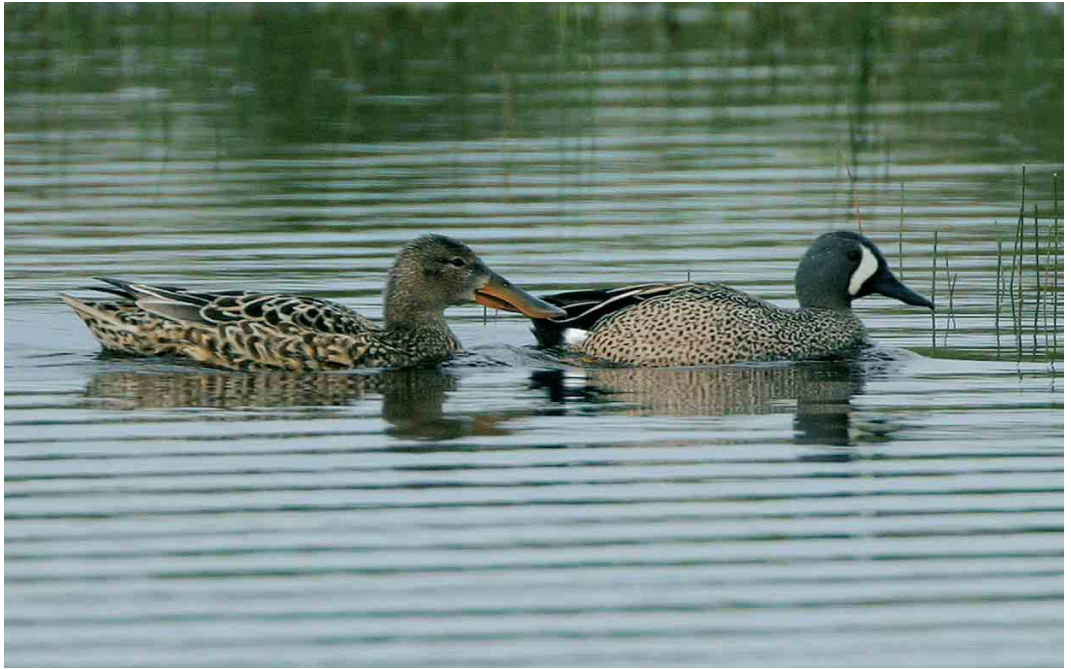
449 Blue-winged Teal / Blauwvleugeltaling Anas discors , male, with Northern Shoveler / Slobeend A clypeata , female, Grootte Vlak, Texel, Noord-Holland, 20 May 2004 ( Bas van den Boogaard )