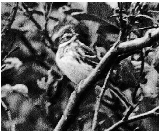
476 Rustic Bunting / Bosgors Emberiza rustica , Lies, Terschelling, Friesland, 29 September 1972