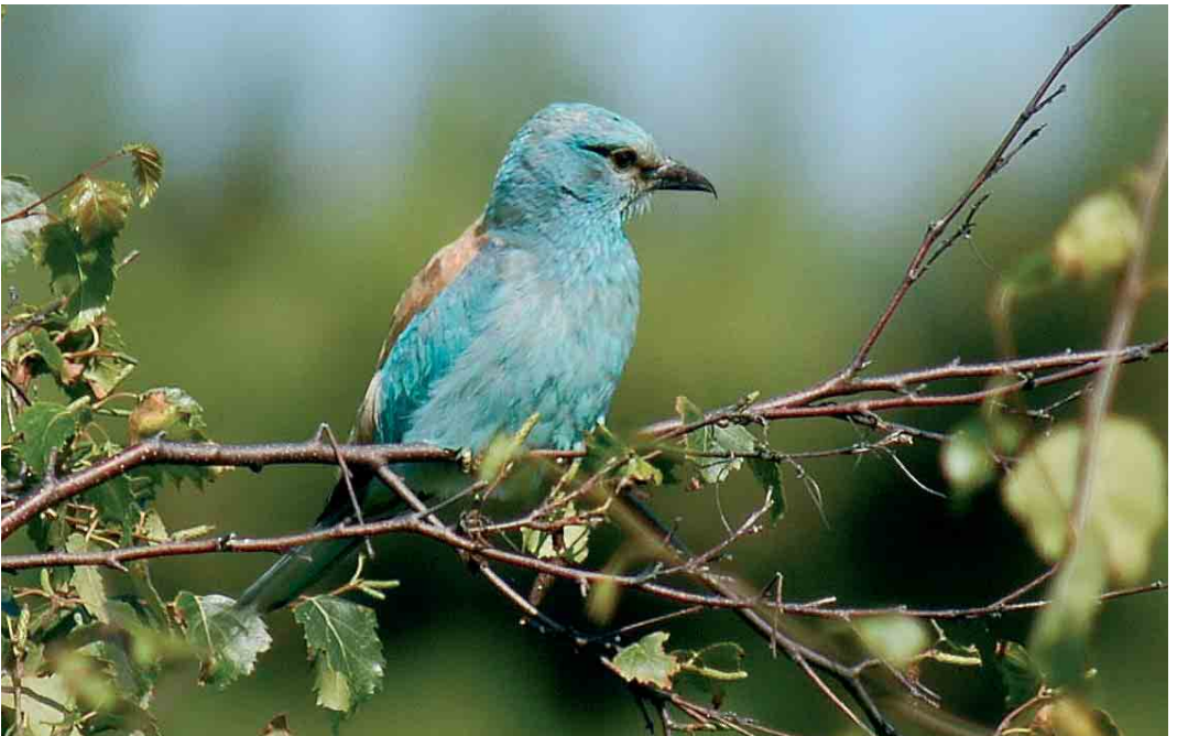
534 Scharrelaar / European Roller Coracias garrulus , adult, Texel, Noord-Holland, september 2005 (Harm Niesen)