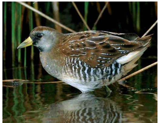
493 Chimney Swift / Schoorsteengierzwaluw Chaetura pelagica , Sein, Finistère, France, 30 October 2005 494 Chimney Swift / Schoorsteengierzwaluw Chaetura pelagica , Baltimore, Cork, Ireland, 30 October 2005 495 Chimney Swift / Schoorsteengierzwaluw Chaetura pelagica , St Mary's, Scilly, England, 31 October 2005 496 Leach's Storm-petrel / Vaal Stormvogeltje Oceanodroma leucorhoa , off Tazacorte, La Palma, Canary Islands, 6 October 2005 497 Yellow-billed Cuckoo / Geelsnavelkoekoek Coccyzus americanus , Ouessant, Finistère, France, 5 October 2005 498 Sora Rail / Soraral Porzana carolina , Lower Moors, St Mary's, Scilly, England, October 2005