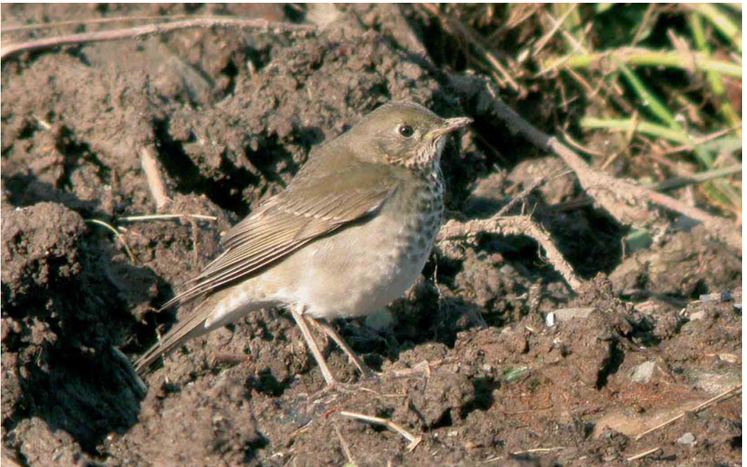
510 Grey-cheeked Thrush / Grijswangdwerglijster Catharus minimus , Cape Clear, Cork, Ireland, October 2005