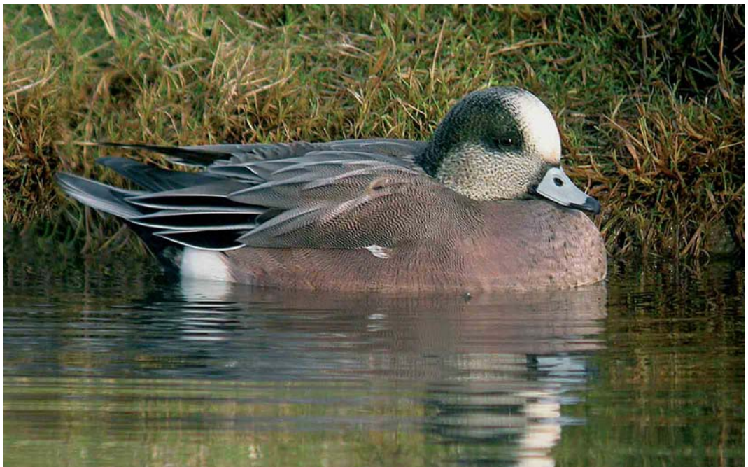
450 American Wigeon / Amerikaanse Smient Anas americana , male, Heerpolderweg, Zeeland, 6 January 2005