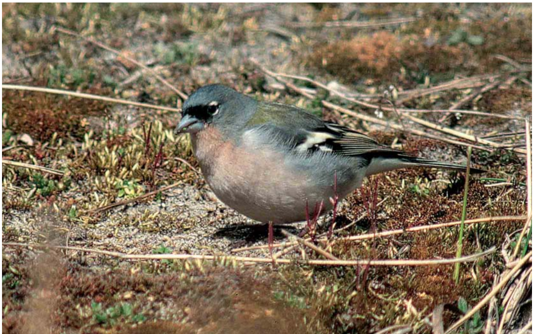
475 Atlas Chaffinch / Atlasvink Fringilla coelebs africana , first-summer male, Maasvlakte, Zuid-Holland, 5 April 2003