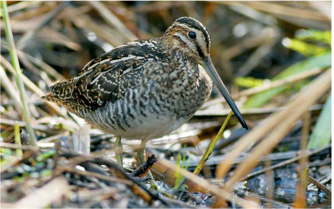
485 Wilson's Snipe / Amerikaanse Watersnip Gallinago delicata , Ty Crenn, Ouessant, Finistère, France, 19 October 2005