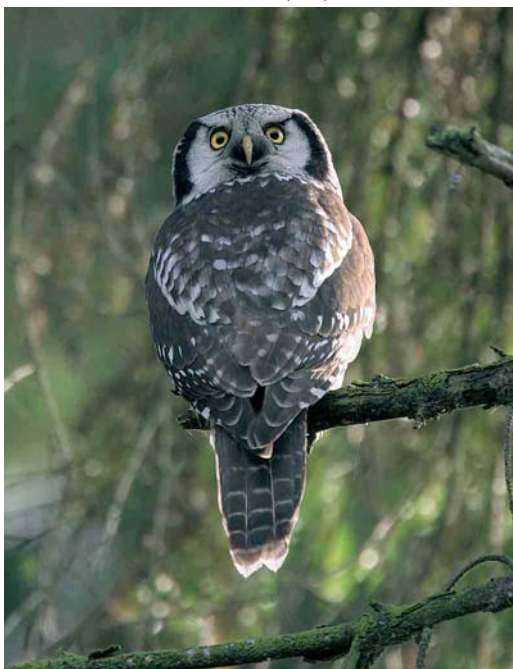
562 Sperweruil / Northern Hawk Owl Surnia ulula, eerstejaars, Westerbork, Drenthe, 31 oktober 2005