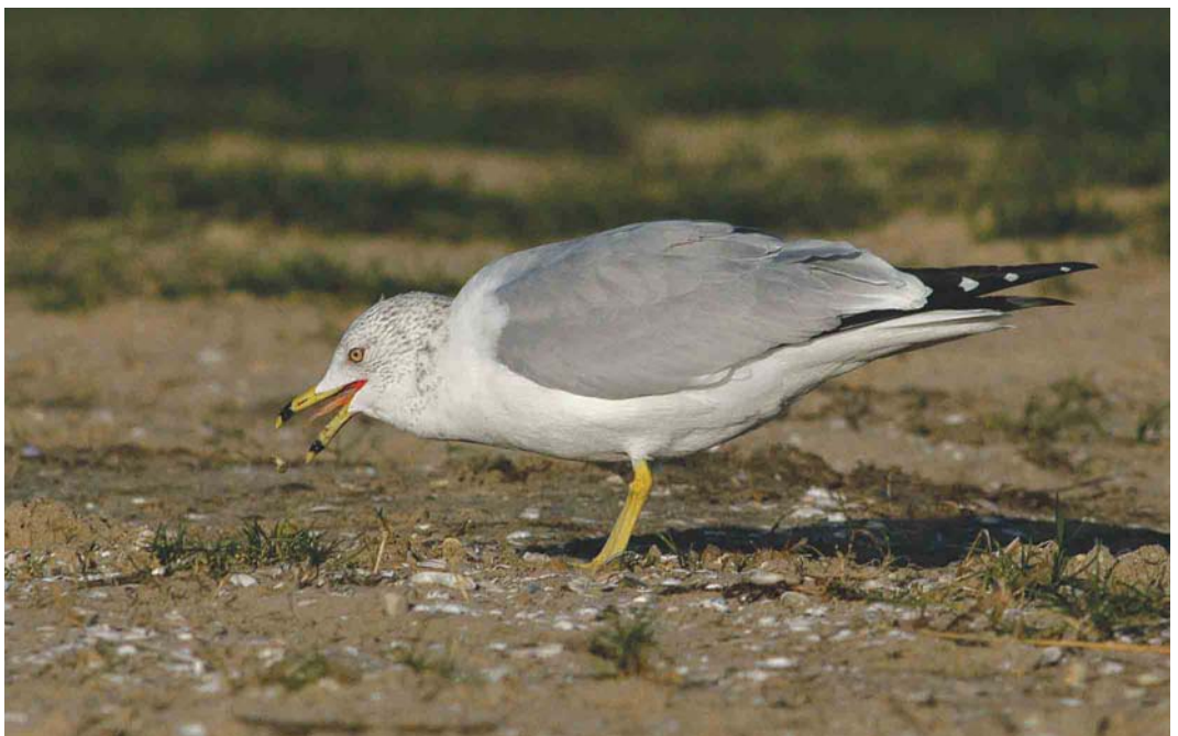
465 Ring-billed Gull / Ringsnavelmeeuw Larus delawarensis , adult, Tiel, Gelderland, 30 January 2004