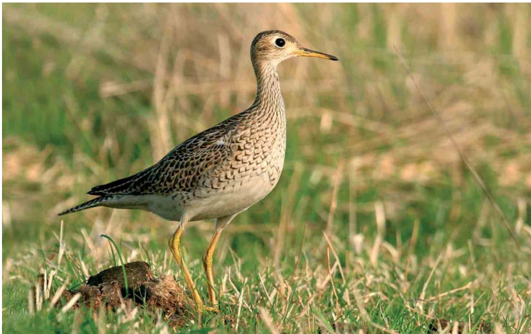
499 Upland Sandpiper / Bartrams Ruiters Bartramia longicauda , Ouessant, Finistère, France, 14 October 2005