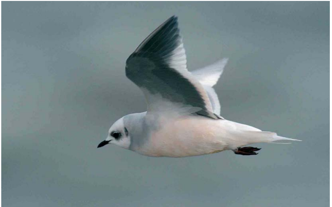
464 Ross's Gull / Ross' Meeuw Rhodostethia rosea , adult, Scheveningen, Zuid-Holland, 21 November 2004 (Marten van Dijl)