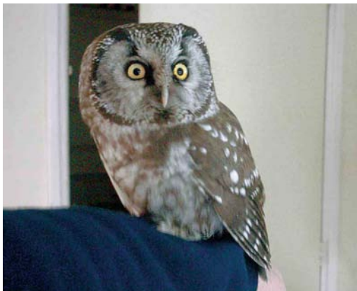
468 Tengmalm's Owl / Ruigpootuil Aegolius funereus , Hoogeveen, Drenthe, 2 April 2004 ( Will Pannekoek )