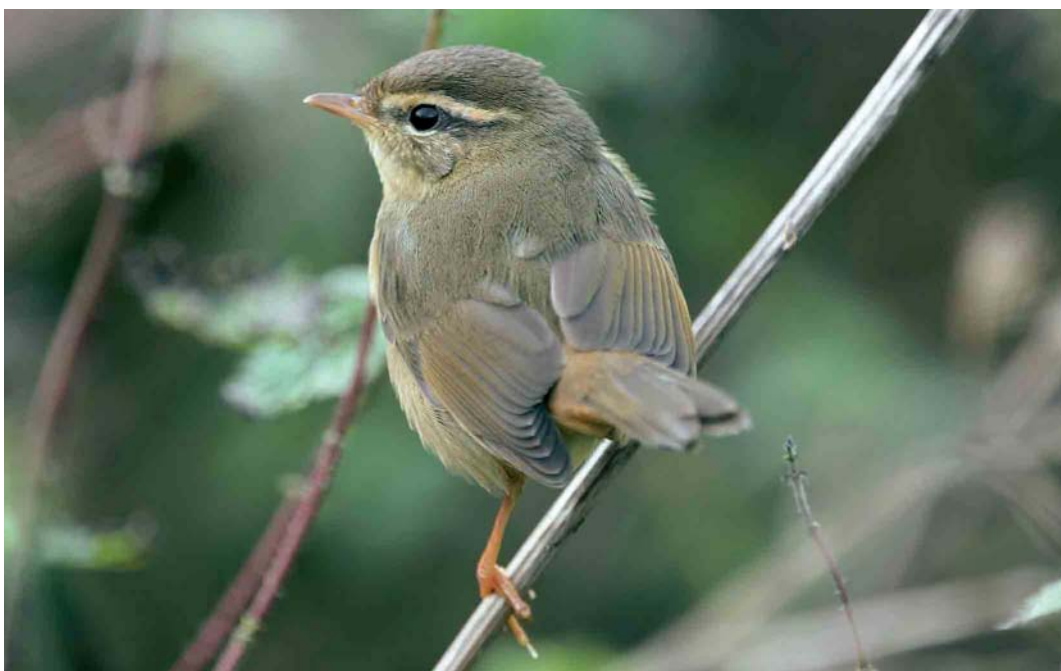
524 Radde's Warbler / Raddes Boszanger Phylloscopus schwarzi , Segerstad, Öland, Sweden, 13 October 2005 (Kris De Rouck)