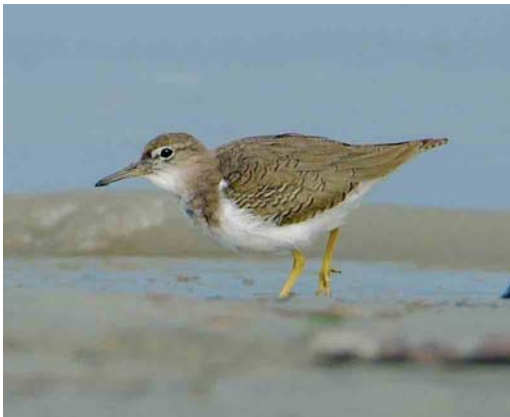
503 Spotted Sandpiper / Amerikaanse Oeverloper Actitis macularius , juvenile, Rheindelta, Austria, 2 November 2005 (Georg Juen)