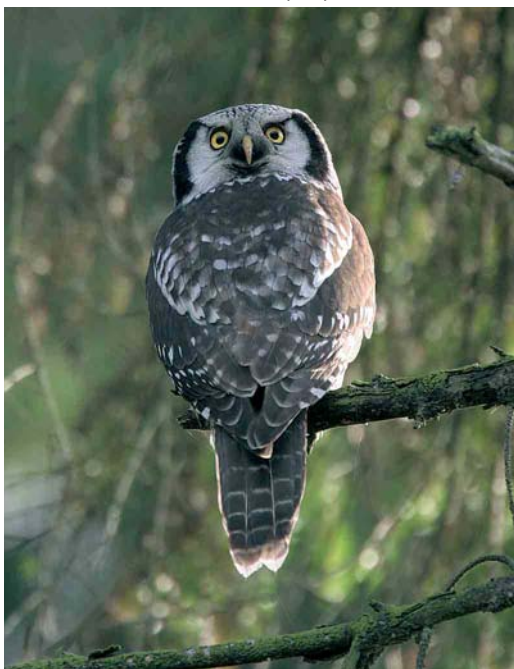
562 Sperweruil / Northern Hawk Owl Surnia ulula, eerstejaars, Westerbork, Drenthe, 31 oktober 2005