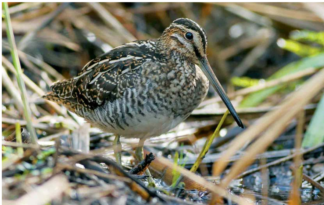
485 Wilson's Snipe / Amerikaanse Watersnip Gallinago delicata , Ty Crenn, Ouessant, Finistère, France, 19 October 2005 (Aurélien Audevard)