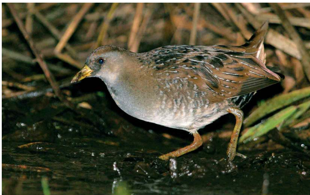
486 Sora Rail / Soraral Porzana carolina , Ty Crenn, Ouessant, Finistère, France, October 2005