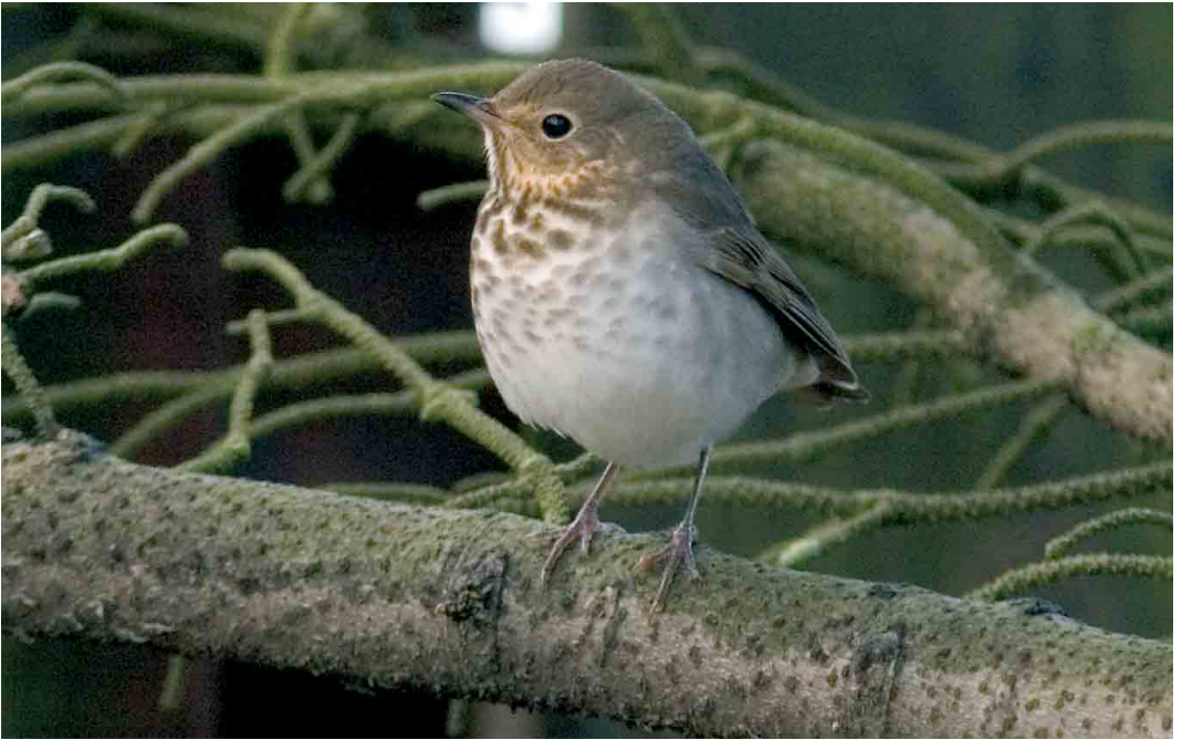
511 Swainson's Thrush / Dwerglijster Catharus ustulatus , Heimaey, Vestmannaeyjar, Iceland, 6 October 2005 (Yann Kolbeinnsson)