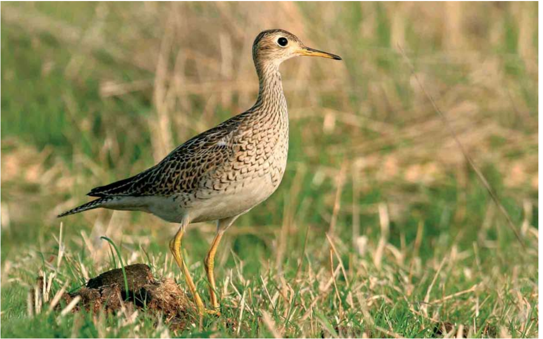
499 Upland Sandpiper / Bartrams Ruiters Bartramia longicauda , Ouessant, Finistère, France, 14 October 2005