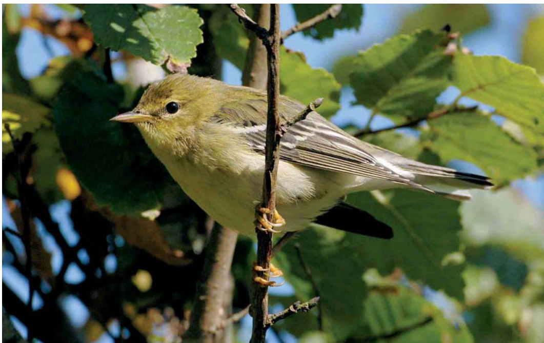
523 Blackpoll Warbler / Zwartkapzanger Dendroica striata , first-year, St Mary's, Scilly, England, October 2005