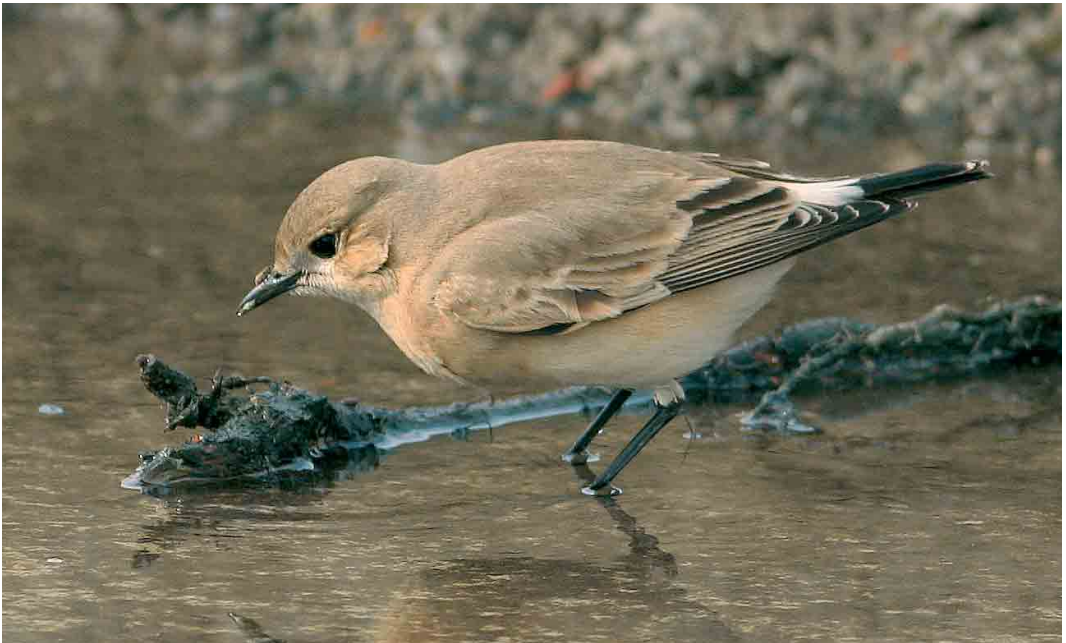
554 Izabeltapuit / Isabelline Wheatear Oenanthe isabellina , Aarschot, Vlaams-Brabant, 21 oktober 2005 (Raymond De Smet)