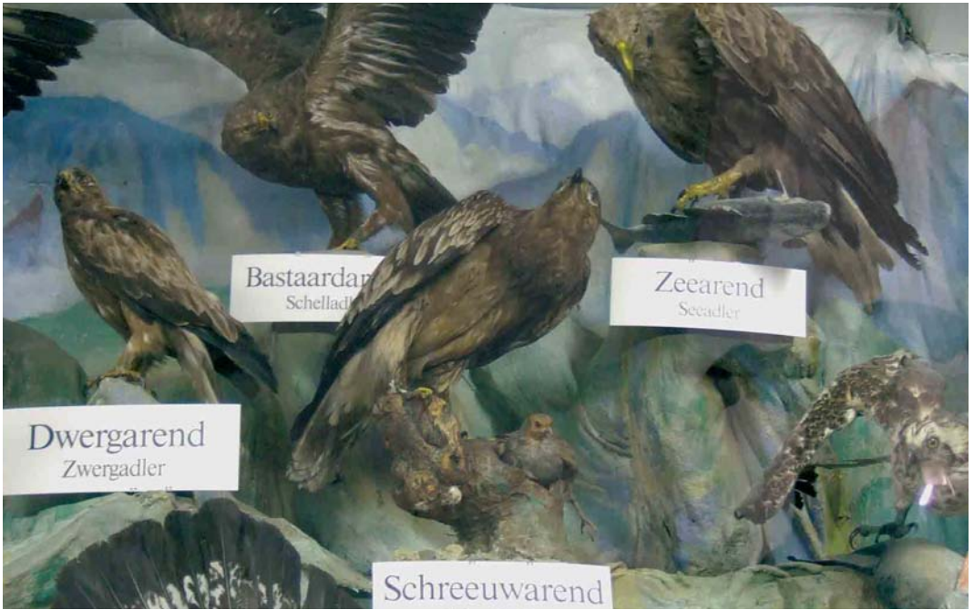
452 Greater Spotted Eagle / Bastaardarend Aquila clanga , centre (incorrectly labelled as Lesser Spotted Eagle / Schreeuwarend A pomarina ; collected at Boshoven, Limburg, on 5 November 1892), Missiemuseum, Steyl, Limburg, 8 September 2005 ( Justin J F J Jansen ) 453 Cream-coloured Courser / Renvogel Cursorius cursor , male (collected at Faan, Niekerk, Groningen, on 20 November 1909), Zwartsluis, Overijssel, 23 October 2005 ( Bert de Bruin ) 454 Stone-curlew / Griel Burhinus oedicnemus (found dead at Ohé en Laak, Limburg, on 2 May 1975), Broekhuizervorst, Limburg, 10 November 2005 ( Justin J F J Jansen )