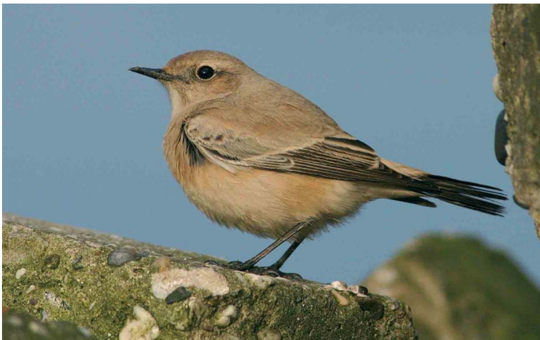
542 Woestijntapuit / Desert Wheatear Oenanthe deserti , vrouwtje, Wierum, Friesland, 30 oktober 2005 (Bart-Jan Prak)