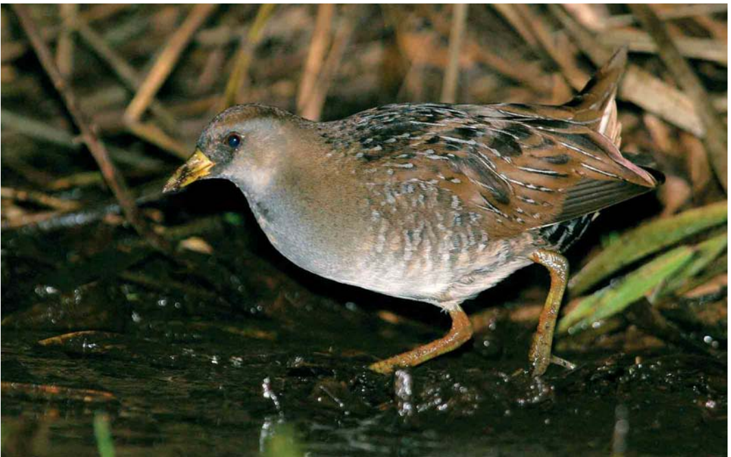
486 Sora Rail / Soraral Porzana carolina , Ty Crenn, Ouessant, Finistère, France, October 2005