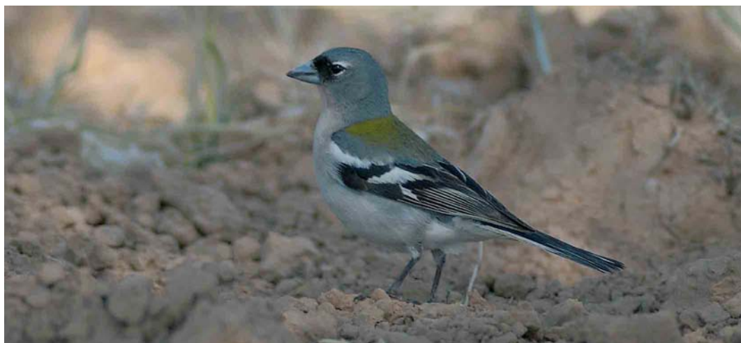
479 Tunisian Chaffinch / Tunesische Vink Fringilla coelebs spodiogenys , male, Arram, Gabès, Tunisia, 1 May 2005