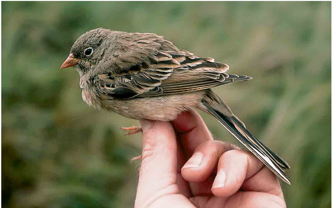
474 Grey-necked Bunting / Steenortolaan Emberiza buchanani , first-winter, Castricum, Noord-Holland, 16 October 2005 (Arnold Wijker)