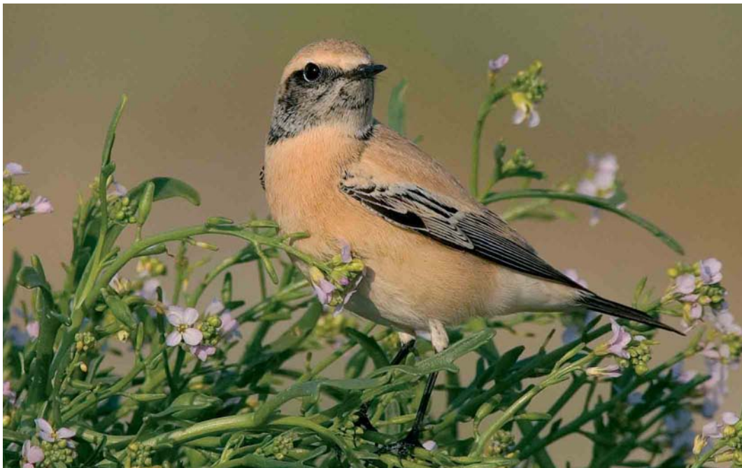
541 Woestijntapuit / Desert Wheatear Oenanthe deserti , eerstejaars mannetje, IJmuiden, Noord-Holland, 24 september 2005