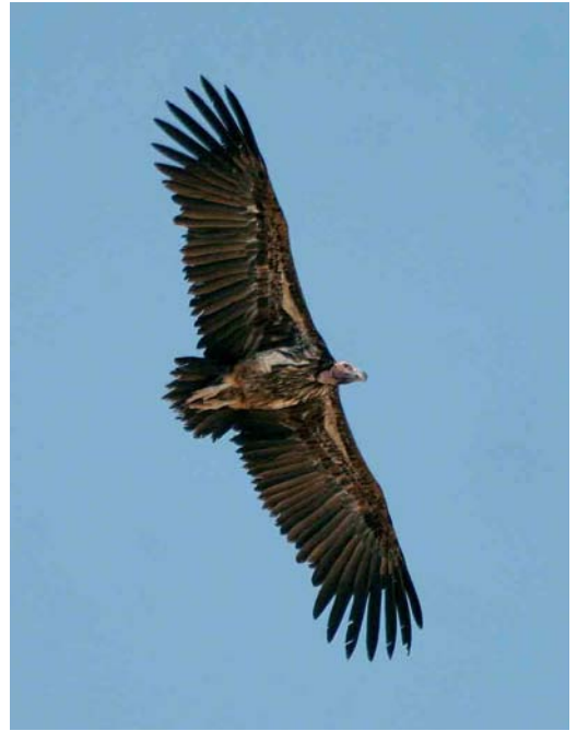
487 Magnificent Frigatebird / Amerikaanse Fregatvogel Fregata magnificens , Chester Zoo, Cheshire, England (found near Whitchurch, Shropshire, England, on 7 November 2005), 8 November 2005 (Mark Eaton) 488 Lappet-faced Vulture / Oorgier Torgos tracheliotus , Shalatin, Egypt, 18 October 2005 (Dominic Mitchell/Birdwatch) 489 Namaqua Dove / Maskerduif Oena capensis , female, Wadi Gimal, Egypt, 19 October 2005 (Dominic Mitchell/Birdwatch)