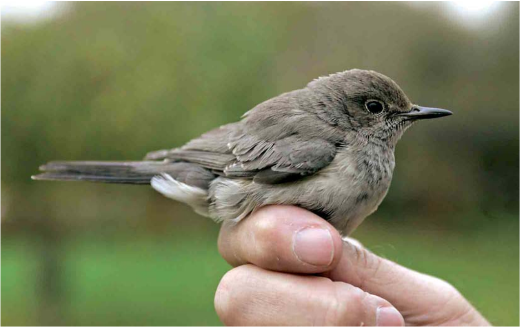
545 Perzische Roodborst / White-throated Robin Irania gutturalis , eerstejaars vrouwtje, Pietersbierum, Friesland, 31 oktober 2005