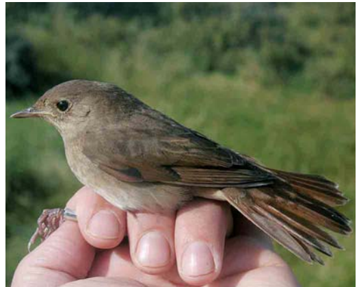
469 Melodious Warbler / Orpheusspotvogel Hippolais polyglotta , Ter Apel, Groningen, 20 May 2004 470 River Warbler / Krekelzanger Locustella fluviatilis , 't Twiske, Noord-Holland, 2 June 2004 471 Hume's Leaf Warbler / Humes Bladkoning Phylloscopus humei , Reusel, Noord-Brabant, 14 November 2004 472 Thrush Nightingale / Noordse Nachtegaal Luscinia luscinia , Bloemendaal, Noord-Holland, 9 September 2004