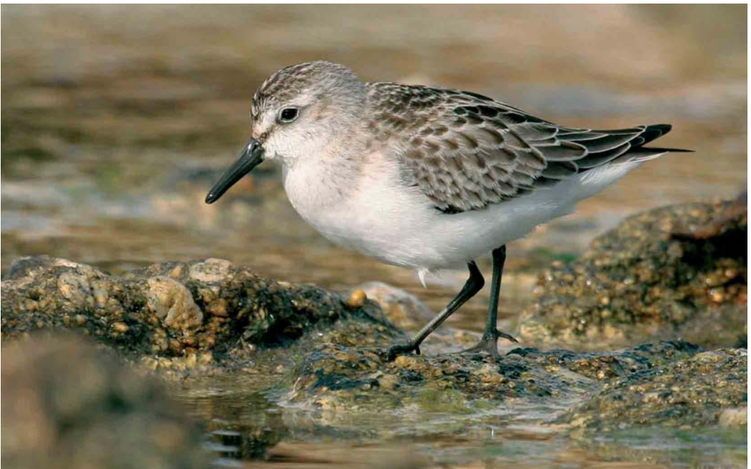
502 Semipalmated Sandpiper / Grijsze Strandloper Calidris pusilla , juvenile, Ouessant, Finistère, France, 26 September 2005