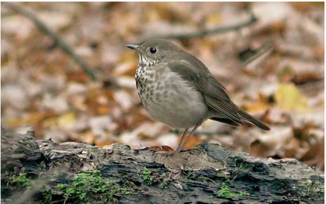
512 Grey-cheeked Thrush / Grijswangdwerglijster Catharus minimus , Northaw Great Wood, Hertfordshire, England, 14 November 2005 (Dave Stewart)