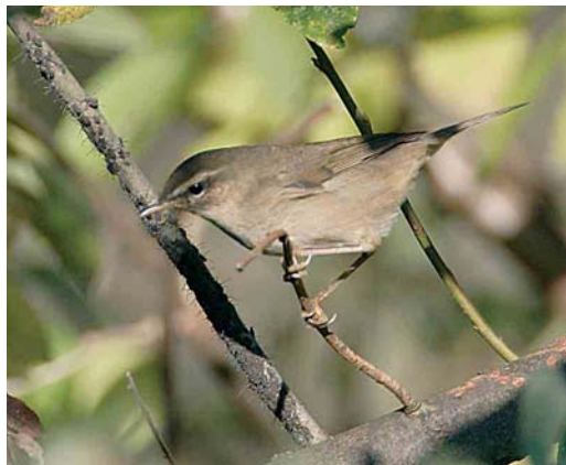
556 Bruine Boszanger / Dusky Warbler Phylloscopus fuscatus , Heist, West-Vlaanderen, 16 oktober 2005