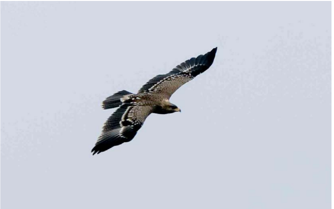
528 Schreeuwarend / Lesser Spotted Eagle Aquila pomarina , juveniel, Domburg, Zeeland, 25 september 2005 529 Schreeuwarend / Lesser Spotted Eagle Aquila pomarina , juveniel, Domburg, Zeeland, 24 september 2005 530 Schreeuwarend / Lesser Spotted Eagle Aquila pomarina , juveniel, Domburg, Zeeland, 25 september 2005