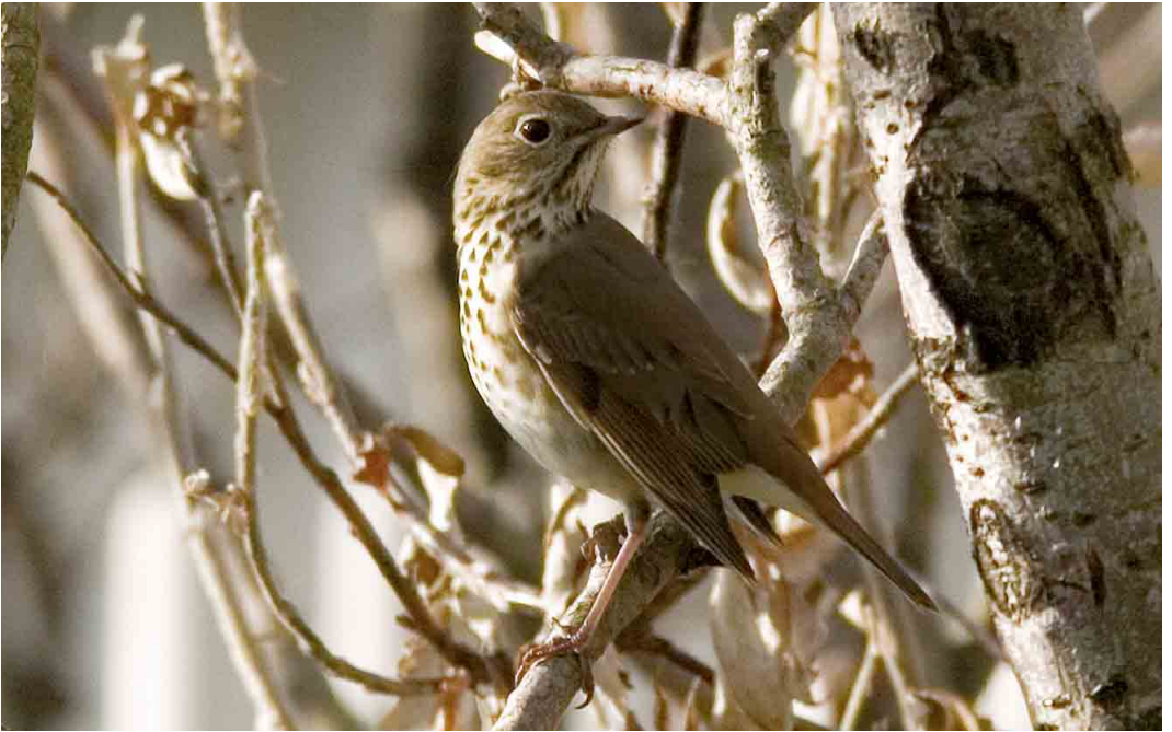
509 Hermit Thrush / Heremietlijster Catharus guttatus , Heimaey, Vestmannaeyjar, Iceland, 13 October 2005 (Yann Kolbeinsson)