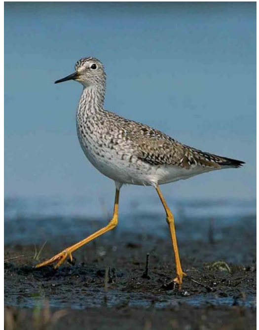
455 Long-billed Dowitcher / Grote Grijs Snip Limnodromus scolopaceus , first-year, Veerse Meer, Zeeland, 24 april 2004 ( Bas van den Boogaard ) 456 Lesser Yellowlegs / Kleine Geelpootruiter Tringa flavipes , Annermoeras, Spijkerboor, Drenthe, 21 May 2004 ( Bas van den Boogaard ) 457 Red-necked Stint / Roodkeelstrandloper Calidris ruficollis , adult, Slikken van Flakkee, Zuid-Holland, 6 July 2004 ( Pim A Wolf )