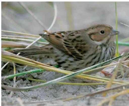
550 Kleine Klapekster / Lesser Grey Shrike Lanius minor , Grote Vlakte, Texel, Noord-Holland, 5 oktober 2005 (Leo J R Boon/Cursorius) 551 Aziatische Roodborsttapuit / Siberian Stonechat Saxicola maurus , eerstejaars, Westduinpark, Den Haag, Zuid-Holland, 26 oktober 2005 (Jeroen van der Zwan) 552 Bosgors / Rustic Bunting Emberiza rustica , Vlieland, Friesland, 16 oktober 2005 (Laurens B Steijn) 553 Dwerggors / Little Bunting Emberiza pusilla , Vlieland, Friesland, oktober 2005 (Bas van den Boogaard)

schaars met begin oktober drie en na 21 oktober 15 meldingen. Van de 39 gemelde Kleinste Jagers Stercorarius longicaudus vlogen er 19 langs tussen 28 september en 2 oktober. In het binnenland was er een waarneming bij Zwolle op 17 september. Op 29 september werden langs Terschelling 91 Grote Jagers S skua geteld en op 23 oktober langs Westkapelle 60 Middelste Jagers S pomarinus . Slechts 30 Vorkstaartmeeuwen Larus sabini werden opgemerkt, waarvan 15 tussen 28 september en 2 oktober. Van 18 september tot 1 oktober liet een juveniel exemplaar zich mooi bekijken op een akker bij Westkapelle. Op 29 september vloog er één langs Lelystad, Flevoland, en op 16 oktober één langs de Ketelbrug. De Ringsnavelmeeuw L delawarensis van Tiel, Gelderland, liet zich daar weer bekijken van 17 september tot 14 oktober. De subadulte Grote Burgemeester L hyperboreus werd de gehele periode gezien bij Katwijk aan Zee, Zuid-