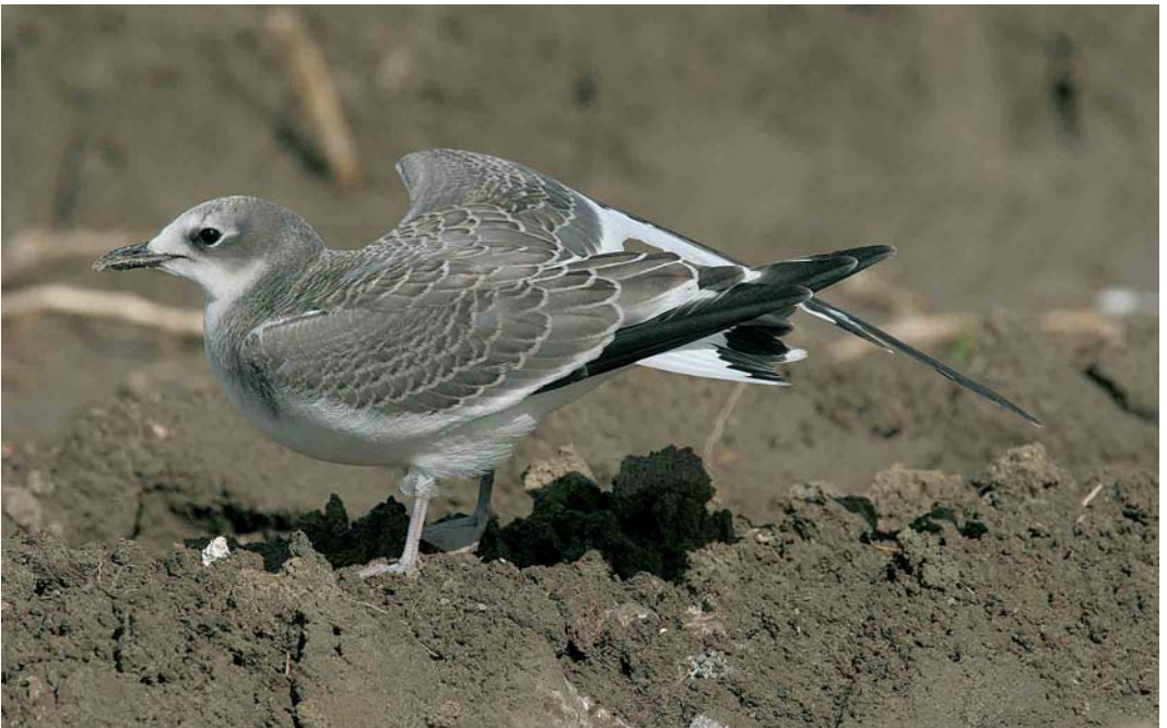
532 Vorkstaartmeeuw / Sabine's Gull Larus sabini , juveniel, Westkapelle, 29 september 2005 (Chris van Rijswijk)