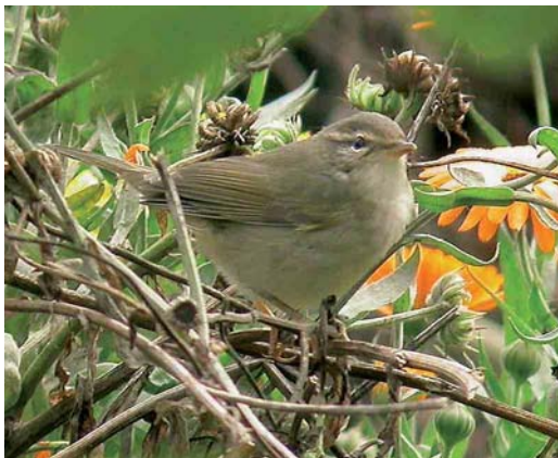
555 Raddes Boszanger / Radde's Warbler Phylloscopus schwarzi , Huldenberg, Vlaams-Brabant, Limburg, 8 oktober 2005 (Freek Fluyt)