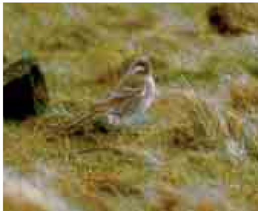
477 Pine Bunting / Witkopgors Emberiza leucocephalos , male, Kooioerdstuijdijk, Ameland, Friesland, 15 March 1998

at Natuurmuseum Fryslân, Leeuwarden), photographed (A Hoekstra; van Dijl & Bosma 2004, Bosma et al 2005; Dutch Birding 27: 316, plate 386-387, 2005); 16-20 November, Beijum, Groningen , Groningen, two, adult male and probably adult female, photographed, sound-recorded, videoed (J G Bosma, R Cazemier, E B Ebels et al; van Dijl & Bosma 2004, Bosma et al 2005, Schoonhoven 2005; Birding World 17: 461, 2004, Dutch Birding 26: 434, plate 612-613, 2004, 27: 74, plate 84, 86, 75, plate 87, 315, plate 385, 318, plate 390-391, 319, plate 392-393, 320, plate 394-395, 321, figure 1-2, 323, plate 396-398, 324, plate 399-401, 326, plate 402, 2005); 16-20 November, Huiswaard, Alkmaar , Noord-Holland, at least one, female-type, photographed (C Seijbel, J Hoedjes; Bosma et al 2005; Dutch Birding 27: 316, plate 388-389, 2005).