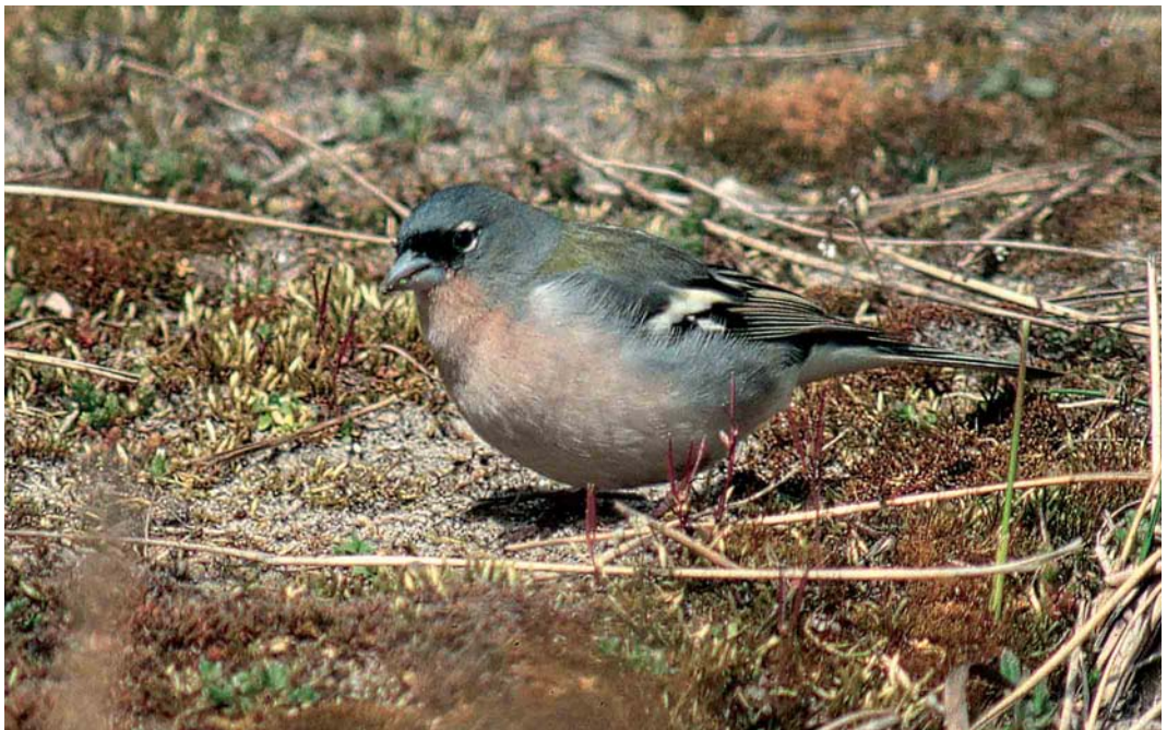
475 Atlas Chaffinch / Atlasvink Fringilla coelebs africana , first-summer male, Maasvlakte, Zuid-Holland, 5 April 2003