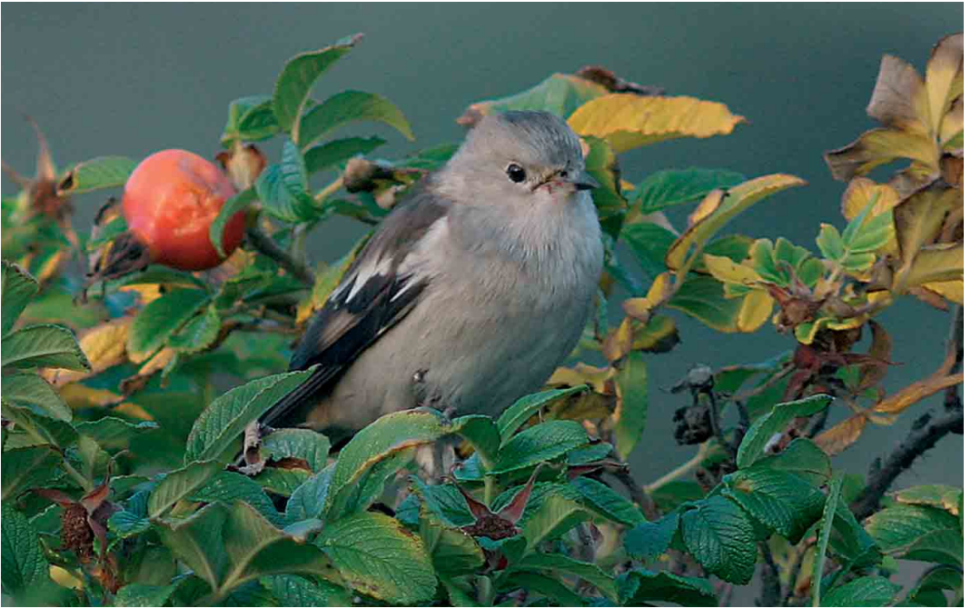
543 Daurische Spreeuw / Purple-backed Starling Sturnus sturninus , eerstejaars mannetje, Vlieland, Friesland, 12 oktober 2005 (Jan Bisschop)