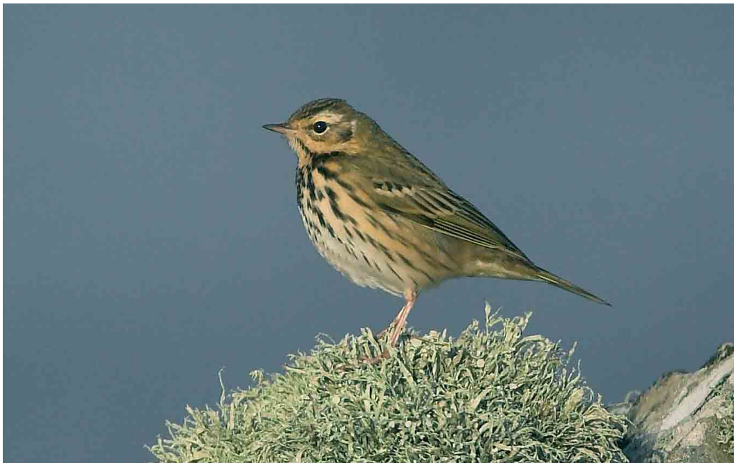
505 Olive-backed Pipit / Siberische Boompieper Anthus hodgsoni , Sumburgh, Mainland, Shetland, Scotland, October 2005