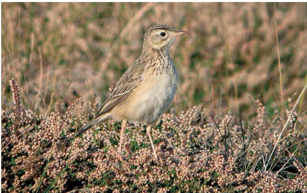
506 Blyth's Pipit / Mongoolse Pieper Anthus godlewskii , Ouessant, Finistère, France, 14 October 2005