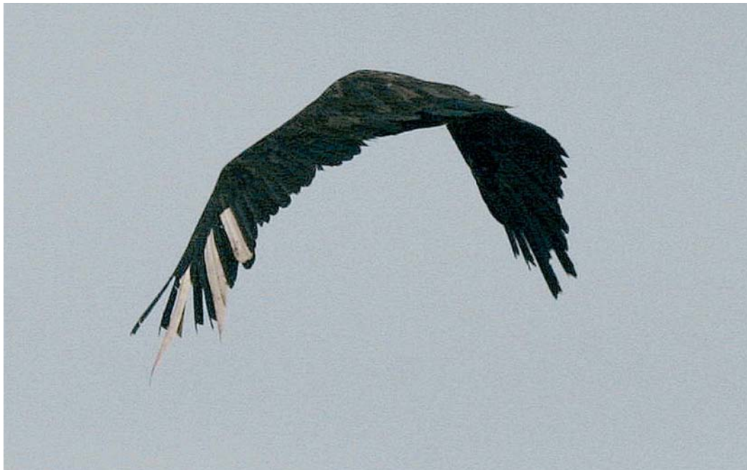
404 Monniksgier / Eurasian Black Vulture Aegypius monachus , adult vrouwtje ('Carmen'), Beers, Noord-Brabant, 17 maart 2005

Evelyn Tewes (in litt). Zij berichtte dat het om 'Carmen' ging, een adult vrouwtje Monniksgier dat op 2 mei 2003 als (vermoedelijk) wilde vogel in verzwakte toestand met vergiftigingsverschijnselen was binnengebracht bij een opvangcentrum in Extremadura, Spanje. Op 15 juli 2003 werd Carmen overgebracht naar het gierenstation van de Black Vulture Conservation Foundation (BVCF) op Majorca, Balearen, Spanje, en op 7 april 2004 met negen andere Monniksgieren overgebracht naar Les Baronnies, Drôme, Frankrijk. Dit is de tweede locatie (naast de Grandes Causses, Aveyron/Lozère) waar Monniksgieren in Frankrijk worden uitgezet. Na een verblijf van bijna 10 maanden in een acclimatisatiekooi werd zij hier op 2 februari 2005 vrijgelaten, voorzien van een kleurring en een radiozender met een antenne tussen de staartpenen. Na half februari is zij hier niet meer waargenomen. De afstand tussen Extremadura en de Baronnies is c 1000 km; de afstand tussen de Baronnies en Beers is c 800 km. De vogel heeft dus minder dan de helft van de afstand op eigen kracht en zonder hulp van de mens afgelegd. Of de vogel daarmee nog als 'wild' kan worden bestempeld en aanvaardbaar is voor de Neder-