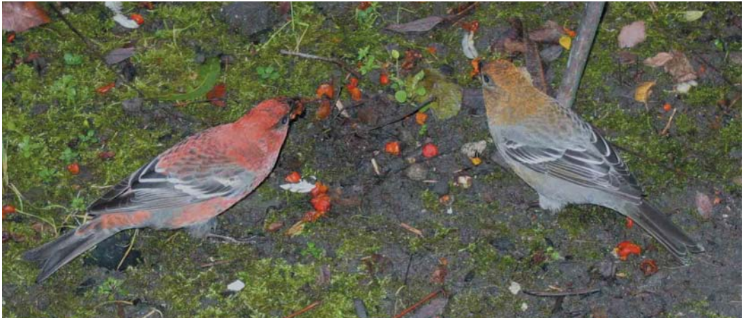
394 Haakbekken / Pine Grosbeaks Pinicola enucleator , adult mannetje en vermoedelijk adult vrouwtje, Beijum, Groningen, Groningen, 18 november 2004 (Roland Jansen) 395 Haakbekken / Pine Grosbeaks Pinicola enucleator , adult mannetje en vermoedelijk adult vrouwtje, Beijum, Groningen, Groningen, 17 november 2004 (Enno B Ebels)

foeragerend, meestal op de grond en soms in struiken tot enkele meters hoogte. Meestal dicht bij elkaar, vaak op minder dan 1 m onderlinge afstand. Foeragerend op bessen van Gewone Lijsterbes Sorbus aucuparia , zowel op afgevalen bessen op grasveld als aan boom; inhoud van bessen werd opgegeten (voornamelijk zaden), schil werd niet opgegeten. Beide vogels zeer tam, tot op minder dan 1 m en soms zelfs tot op enkele centimeters te benaderen. Vogels schijnbaar ongestoord door aanwezigheid van talloze waarnemers en fotografen. Wel alert bij langslipen van honden en katten, dan boom of struik invliegend en vaak roepend.