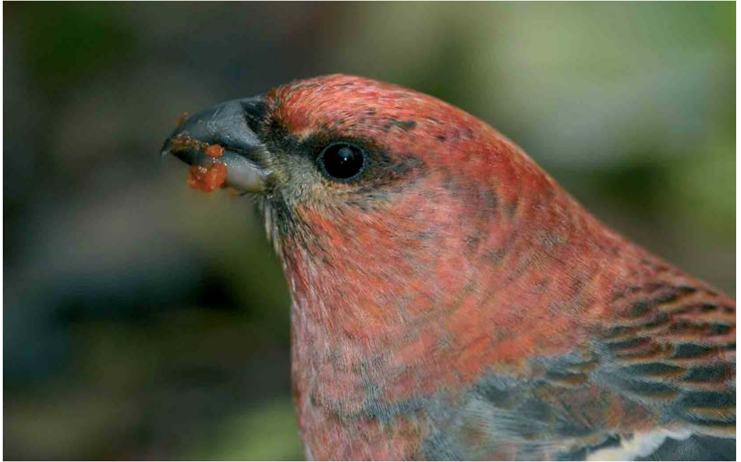
390 Haakbek / Pine Grosbeak Pinicola enucleator , adult mannetje, Beijum, Groningen, Groningen, 18 november 2004 ( Marten van Dijl )