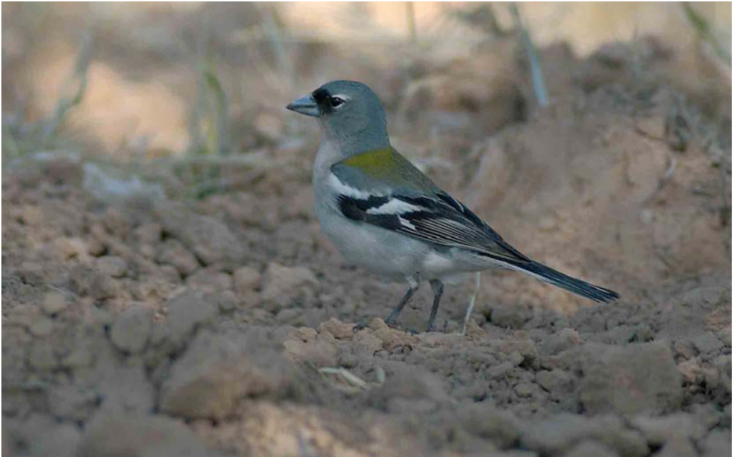
369 Tunisian Chaffinch / Tunesische Vink Fringilla coelebs spodiogenys , male, Arram, Gabès, Tunisia, 1 May 2005