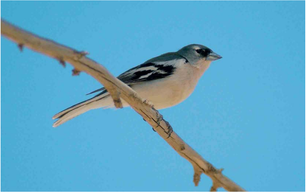
368 Tunisian Chaffinch / Tunesische Vink Fringilla coelebs spodiogenys , male, north of Skhira, Sfax, Tunisia, 1 May 2005 (René Pop)