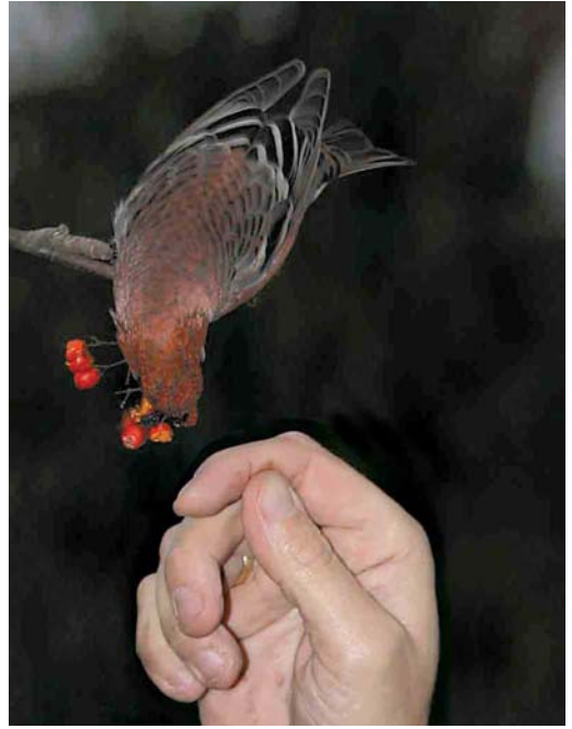
396 Haakbek / Pine Grosbeak Pinicola enucleator , adult mannetje, Beijum, Groningen, Groningen, 17 november 2004 ( Karel Zwaneveld ) 397 Haakbek / Pine Grosbeak Pinicola enucleator , adult mannetje, Beijum, Groningen, Groningen, 18 november 2004 ( Roland Jansen ) 398 Haakbek / Pine Grosbeak Pinicola enucleator , adult mannetje, Beijum, Groningen, Groningen, 19 november 2004 ( Berry van der Hoorn )