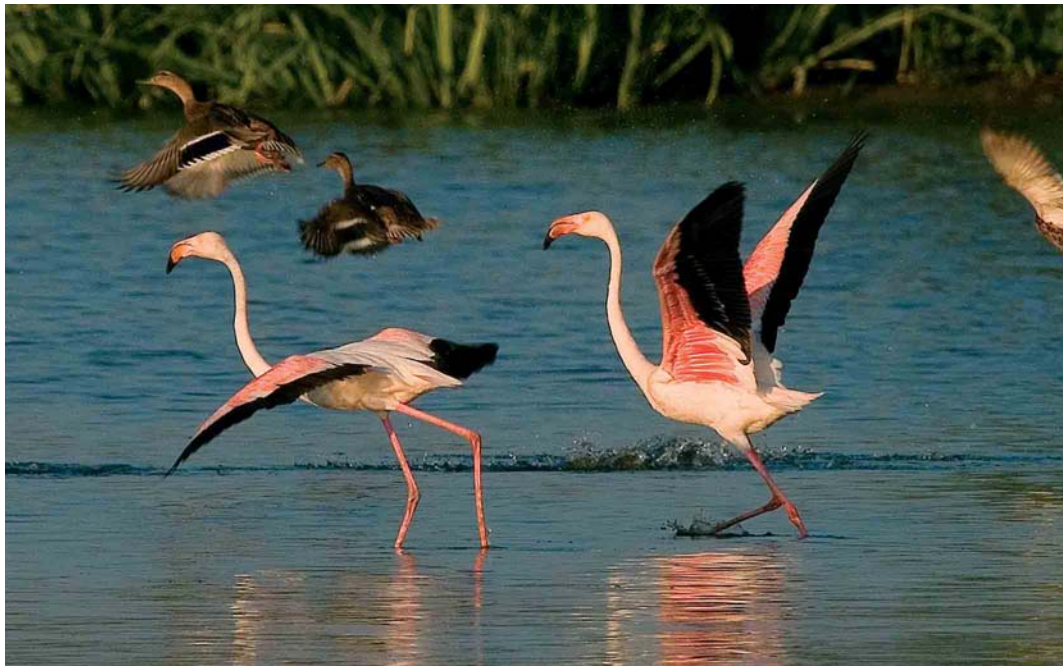
427 Flamingo's / Greater Flamingos Phoenicopterus roseus , adult, Buggenum, Limburg, juli 2005 (Otto Plantema)