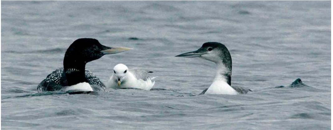
421 Spotted Sandpiper / Amerikaanse Oeverloper Actitis macularia , adult, Ølsemagle Revle, Sjælland, Denmark, 10 August 2005 422 Greater Sand Plover / Woestijnplevier Charadrius leschenaultii and Kentish Plover / Strandplevier C. alexandrinus , Boccasette, Po di Maistra, Veneto, Italy, 7 August 2005 423 Yellow-billed Loon / Geelsnavelduiker Gavia adamsii , with Great Northern Loon / IJsduiker G. immer and Northern Fulmar / Noordse Stormvogel Fulmarus glacialis , Holm Sound, Orkney, Scotland, 27 July 2005

c 60 Lesser Kestrels Falco naumanni , mostly juveniles and second-calendar-years, were watched and photographed near Santa Engracia, c 30 km west of Jaca, in the western Spanish Pyrenees. An Eleonora's Falcon F. eleonora flew over Baskemölla hamn, Skåne, Sweden, on 19 July. In Georgia, several Spotted Crakes Porzana porzana were singing at the Javakheti volcanic plateau on 21-22 July. In the Netherlands, the first proven breeding of Baillon's Crane P. pusilla intermedia since the 1970s took place this summer. A total of four families were observed in south-eastern Noord-Holland during August, two at Nieuwe Keverdijkse Polder and two at Polder Achteraf, while the number of singing individuals earlier this summer suggests that more families remained undetected. Both sites have been subject to recent changes in water level management, quickly resulting in colonisation by this species. On 17 August,