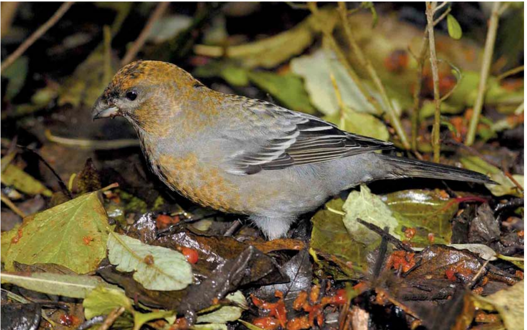
392 Haakbek / Pine Grosbeak Pinicola enucleator , vermoedelijk adult vrouwtje, Beijum, Groningen, Groningen, 17 november 2004