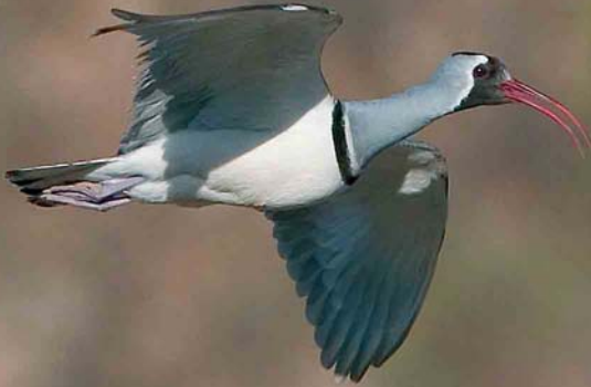
409 Ibisbill / Ibissnavel Ibidorhyncha struthersii , Baihe, north of Huairou, Beijing, China, 1 May 2005