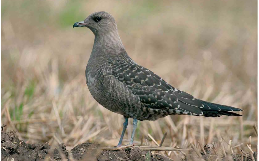
442 Kleinste Jager / Long-tailed Jaeger Stercorarius longicaudus , Ronse, Oost-Vlaanderen, 28 augustus 2005 (Luc Verroken)

Een Zwarte Ibis Plegadis falcinellus werd op 10 juli ontdekt in de Achterhaven van Zeebrugge en bleef tot 28 juli; hij werd op 12 en 24 juli ook opgemerkt in de Uitkerkse Polders, West-Vlaanderen. Op 30 juli vloog een Zwarte Wouw Milvus migrans over Leignon, Namur; op 24 augustus werd er één gezien in Vielsalm, Luxemburg; en op 29 augustus trok er één over Neervelp, Vlaams-Brabant. Rode Wouwen M. milvus werden opgemerkt in Damme, West-Vlaanderen, op 23 juli en in Tienen, Vlaams-Brabant, op 18 augustus. In Wallonië werden er 92 getotaliseerd, waaronder een groep van 20 tot 30 in de Ourthevallei, Liège. Op 2 augustus werd een tweede-zomer mannetje Steppiekiekendief Circus macrourus goed gefotografeerd bij Velaine-sur-Sambre, Namur. Op 9 juli trok een mannetje van dezelfde leeftijd langs het Groot Schietveld in Brecht, Antwerpen. Op 1 augustus vloog hier een Grauwe Kiekendief C. pygargus over. Vanaf 13 augustus kwam de trek van deze soort echt op gang en er volgden in totaal 27 waarnemingen. Visarenden Pandion haliaetus verschenen vanaf 28 juli met in totaal c. 87. Op 26 augustus werd een juveniele Roodpootvalk Falco vespertinus waargenomen in Gedinne, Namur. Er vlogen Smellekens F. columbarius over het Grenspark in Essen, Antwerpen, op 20 augustus; over Oostmalle, Antwerpen, op 26 augustus; en over Nieuwpoort, West-Vlaanderen.