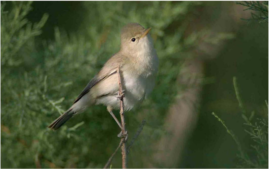
370-371 Saharan Olivaceous Warbler / Saharaanse Vale Spotvogel Acrocephalus pallidus reiseri , Ghidma, Kebili, Tunisia, 6 May 2005