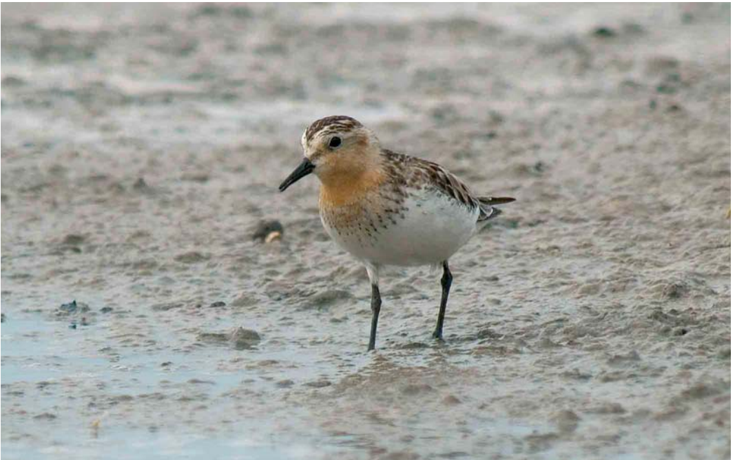
416 Red-necked Stint / Roodkeelstrandloper Calidris ruficollis , adult, Wagejot, Texel, Noord-Holland, Netherlands, 24 July 2005