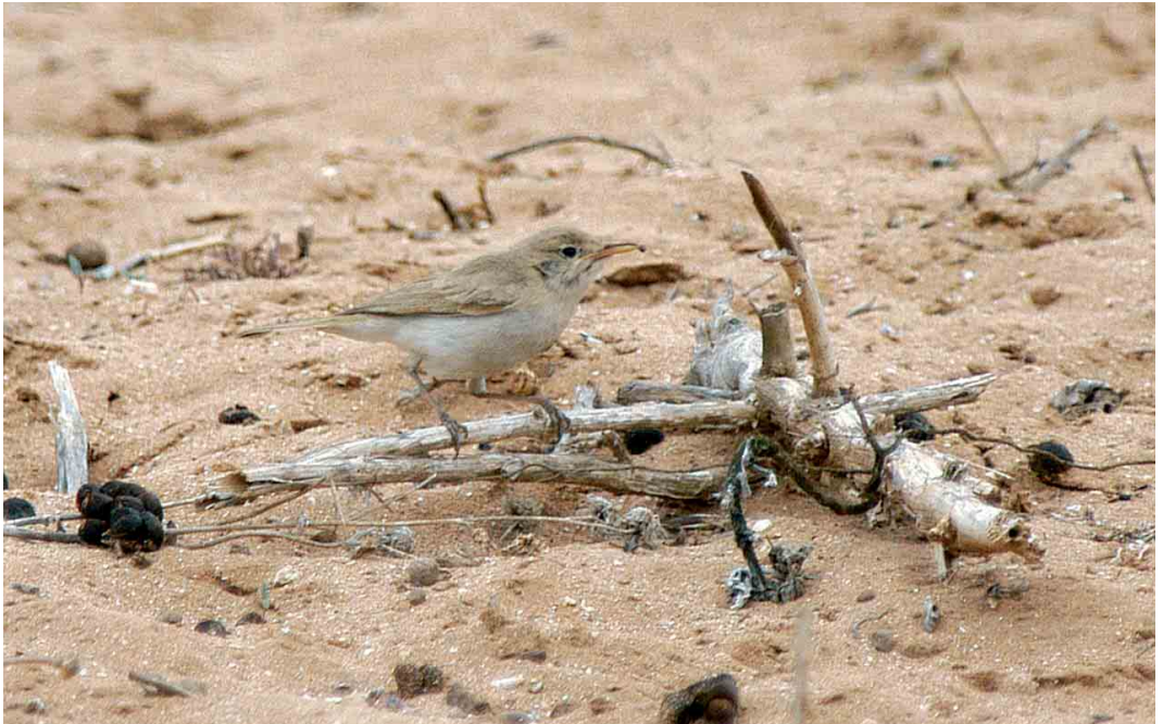
378 Western Olivaceous Warbler / Westelijke Vale Spotvogel Acrocephalus opacus , Sidi Rabat, Oued Massa, Souss, Morocco, 31 October 2003 ( Arnoud B van den Berg )