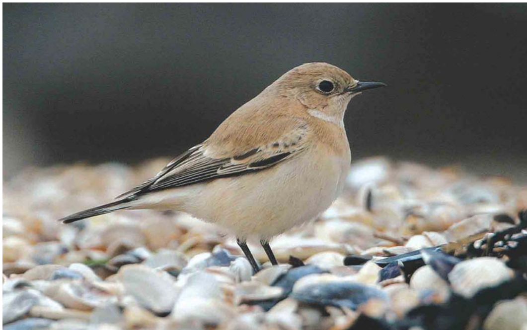
383 Westelijke Blonde Tapuit / Western Black-eared Wheatear Oenanthe hispanica , vrouwtje, Eemshaven, Groningen, 1 november 2004 (Roland Jansen)