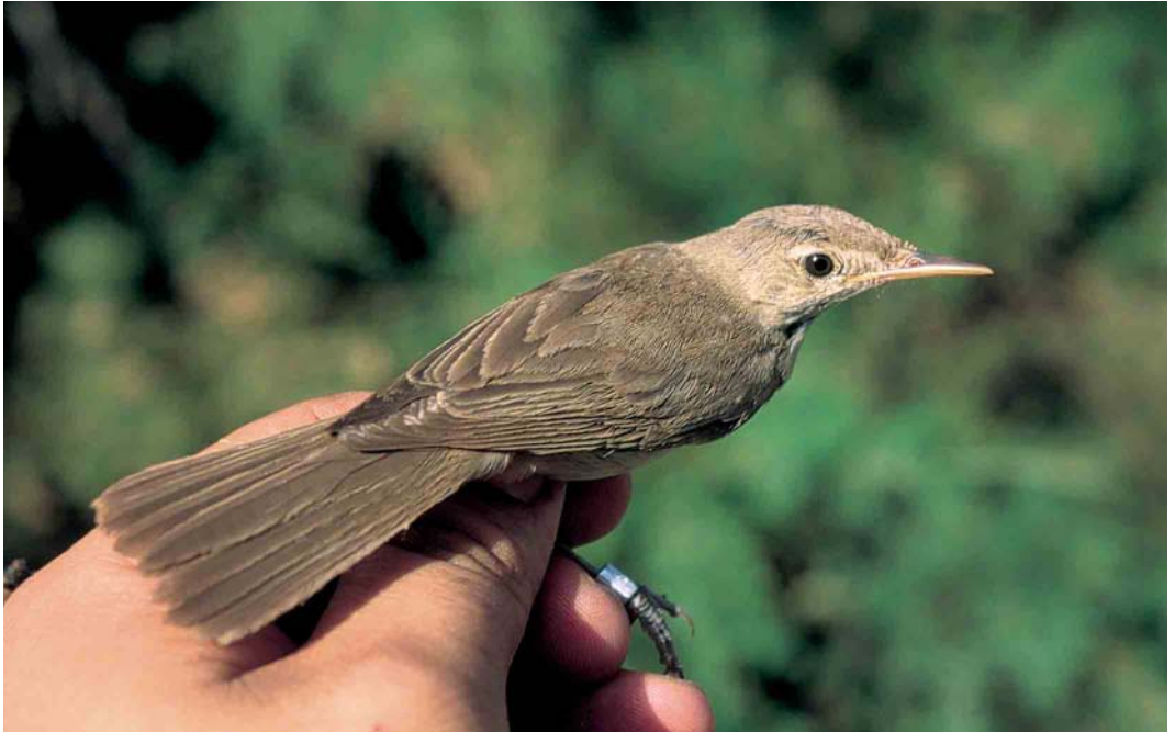
377 Western Olivaceous Warbler / Westelijke Vale Spotvogel Acrocephalus opacus , adult, Malaga, Andalucía, Spain, 14 July 2002