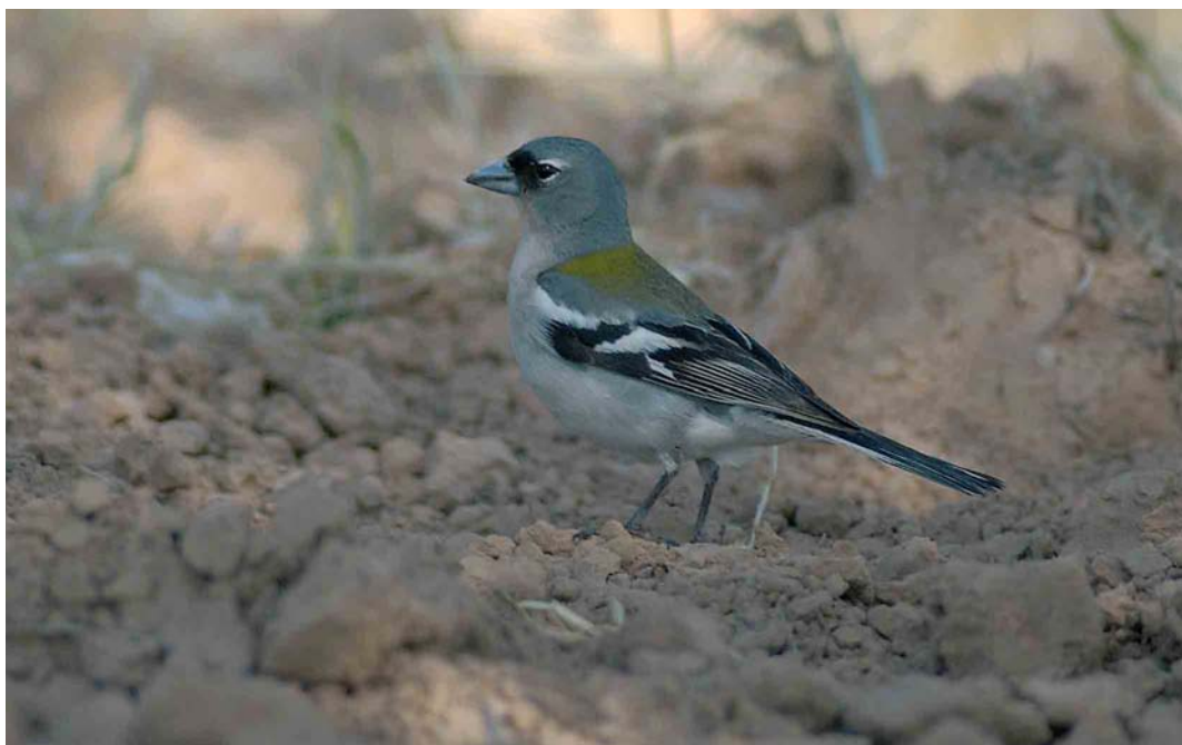
369 Tunisian Chaffinch / Tunesische Vink Fringilla coelebs spodiogenys , male, Arram, Gabès, Tunisia, 1 May 2005 (René Pop)