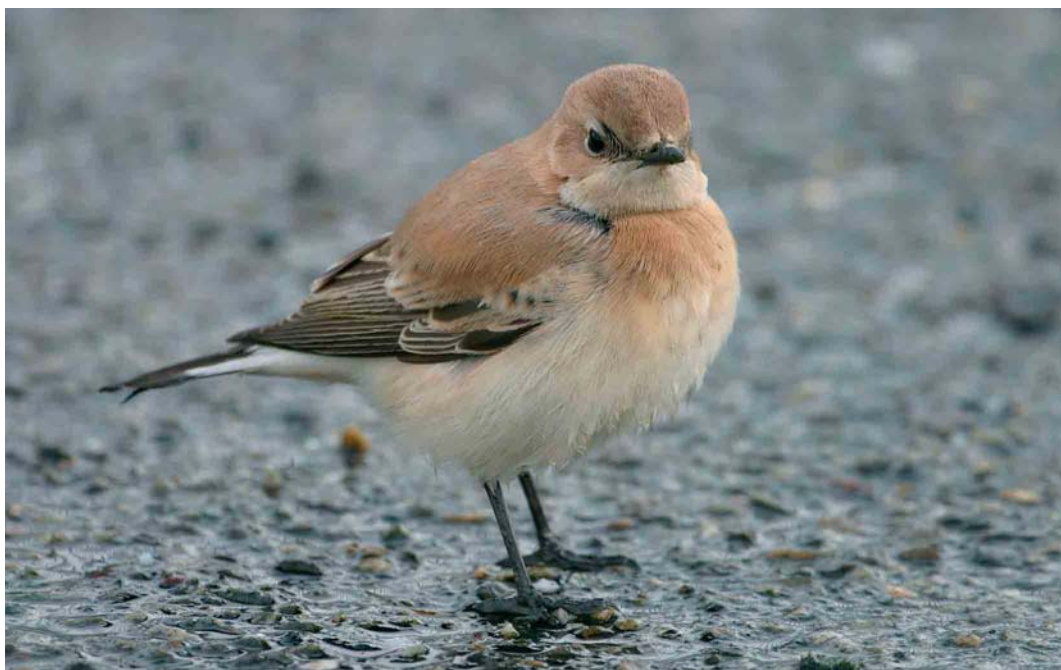
384 Westelijke Blonde Tapuit / Western Black-eared Wheatear Oenanthe hispanica , vrouwtje, Eemshaven, Groningen, 21 november 2004