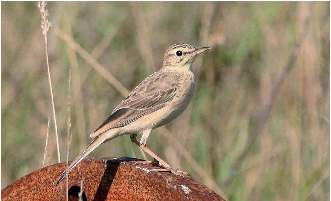
440 Duinpieper / Tawny Pipit Anthus campestris , Hessenpoort, Zwolle, Overijssel, 30 augustus 2005 (Edwin Winkel)

op 31 augustus op de Strabrechtse Heide, waarvan vier overvliegend. Na een melding van een Roodpootvalk Falco vespertinus op 10 juli bij Hardinxveld-Giessendam, Zuid-Holland, volgden er na half augustus nog eens zes.