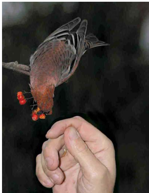
396 Haakbek / Pine Grosbeak Pinicola enucleator , adult mannetje, Beijum, Groningen, Groningen, 17 november 2004 397 Haakbek / Pine Grosbeak Pinicola enucleator , adult mannetje, Beijum, Groningen, Groningen, 18 november 2004 398 Haakbek / Pine Grosbeak Pinicola enucleator , adult mannetje, Beijum, Groningen, Groningen, 19 november 2004