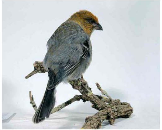
387 Haakbek / Pine Grosbeak Pinicola enucleator , eerste-winter mannetje (gevonden in Leeuwarden, Friesland, op 15 november 2004), Natuurmuseum Fryslân, Leeuwarden, 18 februari 2005 ( Bert de Bruin )

werd hij dood aangetroffen. De vogel is inmiddels opgezet en bevindt zich nu in het Natuurmuseum Fryslân in Leeuwarden. AH meldde per telefoon dat het niet zeker is dat de vogel tegen het raam is gevlogen. Dat was alleen haar veronderstelling toen ze hem versuft aantrof. Bij inspectie in het museum bleek hij de rechterhelft van zijn staart te missen. Het kan dus ook zijn dat er een kat in het spel is geweest (Peter Koomen in litt). Bij inspectie werd verder geconstateerd dat de vogel vermagerd was en geen vet-reserves had. Op 18 februari 2005 heeft Bert de Bruin de inmiddels opgezette vogel bestudeerd en gefotografeerd.