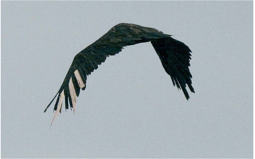
404 Monniksgier / Eurasian Black Vulture Aegypius monachus , adult vrouwtje ('Carmen'), Beers, Noord-Brabant, 17 maart 2005

Evelyn Tewes (in litt). Zij berichtte dat het om 'Carmen' ging, een adult vrouwtje Monniksgier dat op 2 mei 2003 als (vermoedelijk) wilde vogel in verzwakte toestand met vergiftigingsverschijnselen was binnengebracht bij een opvangcentrum in Extremadura, Spanje. Op 15 juli 2003 werd Carmen overgebracht naar het gierenstation van de Black Vulture Conservation Foundation (BVCF) op Majorca, Balearen, Spanje, en op 7 april 2004 met negen andere Monniksgieren overgebracht naar Les Baronnies, Drôme, Frankrijk. Dit is de tweede locatie (naast de Grandes Causses, Aveyron/Lozère) waar Monniksgieren in Frankrijk worden uitgezet. Na een verblijf van bijna 10 maanden in een acclimatisatiekooi werd zij hier op 2 februari 2005 vrijgelaten, voorzien van een kleurring en een radiozender met een antenne tussen de staartpenen. Na half februari is zij hier niet meer waargenomen. De afstand tussen Extremadura en de Baronnies is c 1000 km; de afstand tussen de Baronnies en Beers is c 800 km. De vogel heeft dus minder dan de helft van de afstand op eigen kracht en zonder hulp van de mens afgelegd. Of de vogel daarmee nog als 'wild' kan worden bestempeld en aanvaardbaar is voor de Neder-