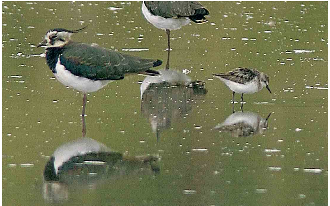
445 Grijze Strandloper / Semipalmated Sandpiper Calidris pusilla , adult, met Kieviten / Northern Lapwings Vanellus vanellus , Wagejot, Texel, Noord-Holland, 21 augustus 2005 (René Pop)