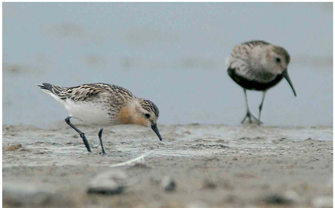
446 Roodkeelstrandloper / Red-necked Stint Calidris ruficollis , adult, met Bonte Strandloper / Dunlin C alpina , adult, Wagejot, Texel, Noord-Holland, 24 juli 2005 (René Pop)