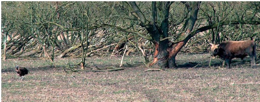
405 Monniksgier / Eurasian Black Vulture Aegypius monachus , adult vrouwtje ('Carmen'), Oostvaardersplassen, Flevoland, 21 maart 2005 (Hans Kampf)

Op 21 augustus werd Carmen tijdens een voor pers en publiek toegankelijke sessie in Naturalis ontleed en werd een begin gemaakt met het prepareren van de huid. De vogel zal worden opgezet en opgenomen in de collectie van Naturalis. Mede op verzoek van de BVCF werden door onderzoeksinstituut Alterra diverse monsters van het lichaam genomen ten behoeve van onderzoek aan de conditie, eventuele sporen van vergiftiging en de maaginhoud. Bij aanvang van de preparatie was het gewicht 7.62 kg. Een volwassen vrouwtje weegt volgens Ferguson-Lees & Christie (2001) 7.5-12.5 kg. De spanwijdte was c 2.65 m. De ontleding veroorzaakte opnieuw een grote toeloop van de media en werd vertoond in verschillende nieuwsrubrieken op televisie. Ook de schrijvende pers besteedde er ruim aandacht aan. De eerste resultaten van het verdere onderzoek gaven aan dat Carmen in goede conditie verkeerde met een ruime vetlaag (plaatselijk tot 2.5 cm dik). In de maag bevond zich een bijna volledige braakbal, vooral gevuld met rood haar (zeer waarschijnlijk van een Edelhert) en veel larven van vliegen; het