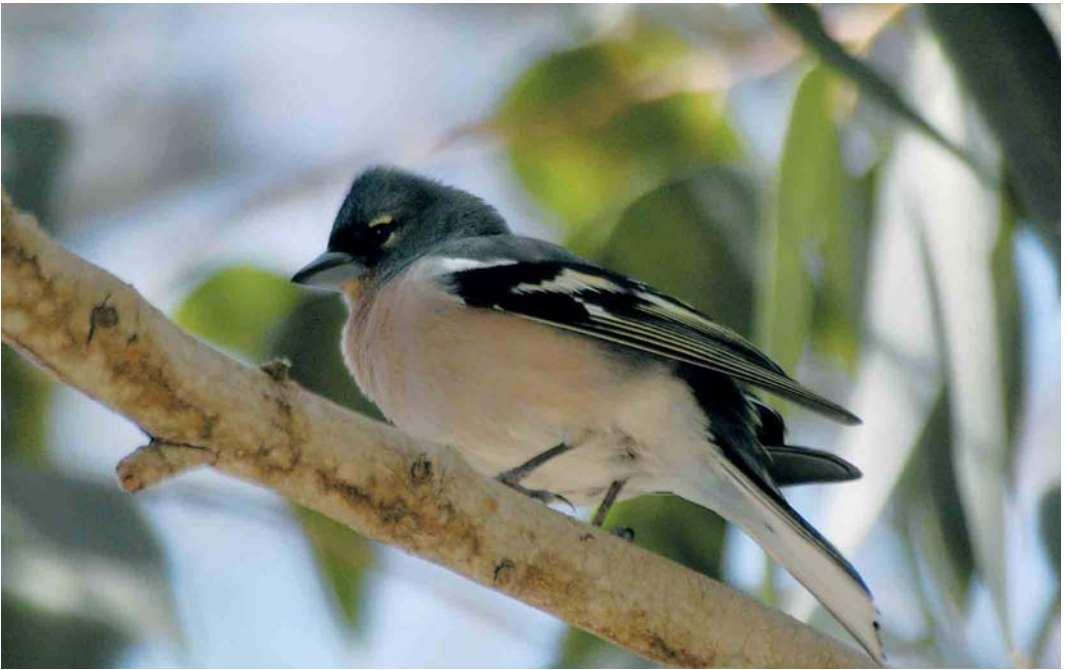
364-365 Atlas Chaffinch / Atlasvink Fringilla coelebs africana , male, Oued Massa, Souss, Morocco, 15 April 2005