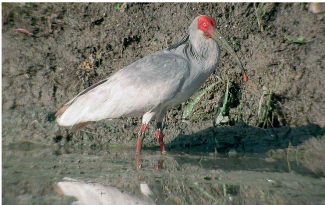
412 Crested Ibis / Japanese Kuifibis Nipponia nippon , adult, Yangxiang, Shaanxi, China, 17 May 2005 (Max Berlijn)