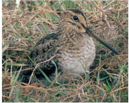
mystery photograph X (February)

Reed Bunting (3%). Those who overlooked the Emberiza tertial pattern, voted for Savannah Sparrow Passerculus sandwichensis (6%) and White-throated Sparrow Zonotrichia albicollis (3%).