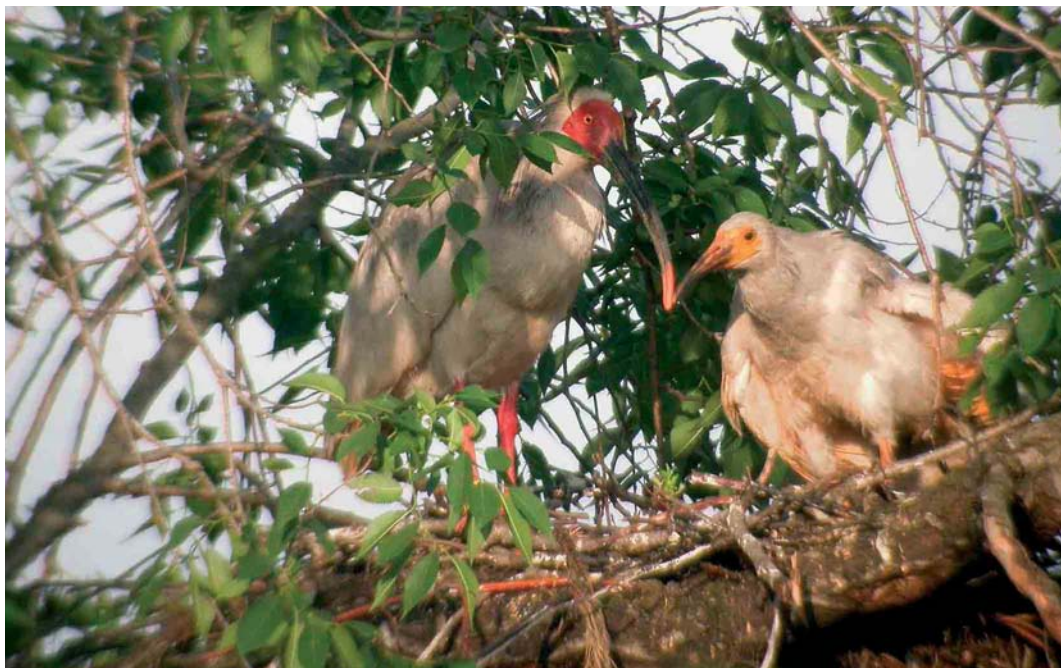
411 Crested Ibises / Japanese Kuifibissen Nipponia nippon , adult with young, Yangxiang, Shaanxi, China, 17 May 2005 (Max Berlijn)