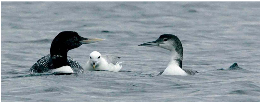
421 Spotted Sandpiper / Amerikaanse Oeverloper Actitis macularius , adult, Ølsemagle Revle, Sjælland, Denmark, 10 August 2005 ( Ole Krogh ) 422 Greater Sand Plover / Woestijnplevier Charadrius leschenaultii and Kentish Plover / Strandplevier C. alexandrinus , Boccasette, Po di Maistra, Veneto, Italy, 7 August 2005 ( Franco Trave ) 423 Yellow-billed Loon / Geelsnavelduiker Gavia adamsii , with Great Northern Loon / IJsduiker G. immer and Northern Fulmar / Noordse Stormvogel Fulmarus glacialis , Holm Sound, Orkney, Scotland, 27 July 2005 ( Keith Hague )

c 60 Lesser Kestrels Falco naumanni , mostly juveniles and second-calendar-years, were watched and photographed near Santa Engracia, c 30 km west of Jaca, in the western Spanish Pyrenees. An Eleonora's Falcon F. eleonora flew over Baskemölla hamn, Skåne, Sweden, on 19 July. In Georgia, several Spotted Crakes Porzana porzana were singing at the Javakheti volcanic plateau on 21-22 July. In the Netherlands, the first proven breeding of Baillon's Crake P. pusilla intermedia since the 1970s took place this summer. A total of four families were observed in south-eastern Noord-Holland during August, two at Nieuwe Keverdijkse Polder and two at Polder Achteraf, while the number of singing individuals earlier this summer suggests that more families remained undetected. Both sites have been subject to recent changes in water level management, quickly resulting in colonisation by this species. On 17 August,