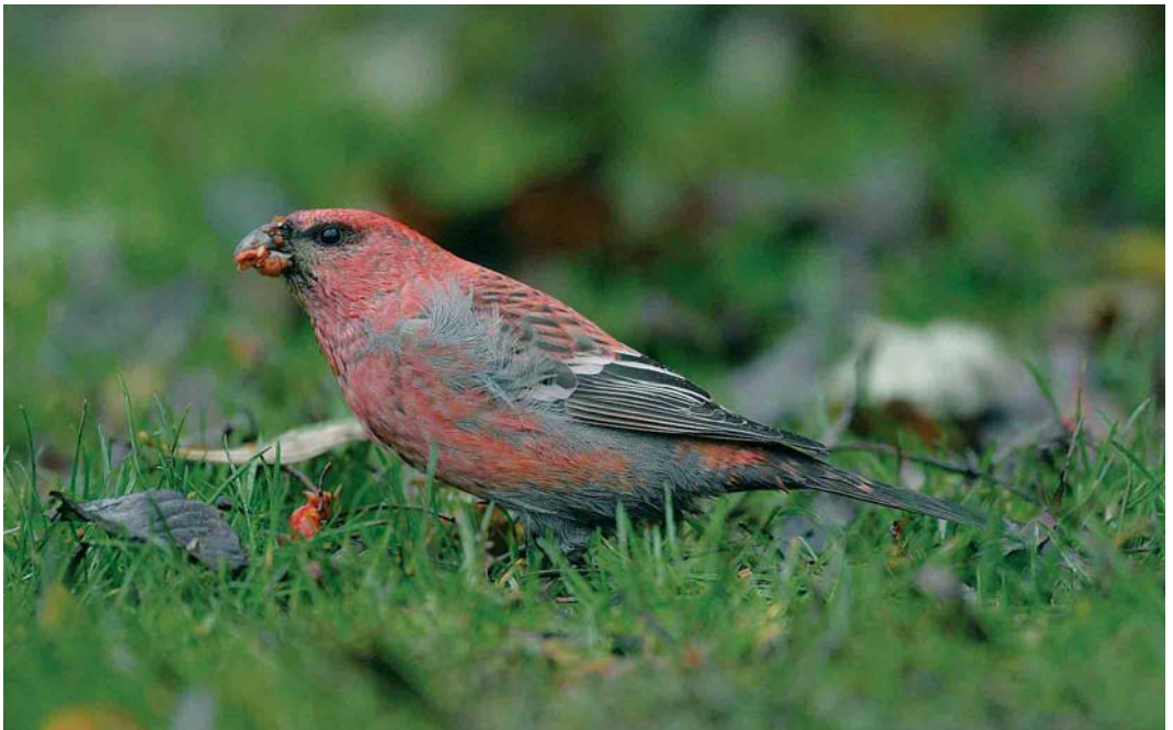
391 Haakbek / Pine Grosbeak Pinicola enucleator , adult mannetje, Beijum, Groningen, Groningen, 17 november 2004