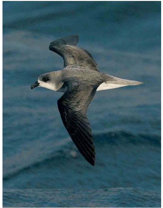
418 Lesser Crested Tern / Bengaalse Stern Sterna bengalensis , Happisburgh, Norfolk, England, 17 July 2005 ( Paul Hackett ) 419 Fea's Petrel / Gon-gon Pterodroma feae , Bugio, Madeira, August 2005 ( Hugh Harrop ) 420 Yellow-billed Loon / Geelsnavelduiker Gavia adamsii , Holm Sound, Orkney, Scotland, 30 July 2005 ( Paul Hackett )