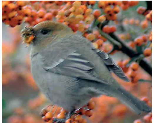
389 Haakbek / Pine Grosbeak Pinicola enucleator , vrouwtje of eerste-winter mannetje, Zandkreek, Alkmaar, Noord-Holland, 20 november 2004

Op 16 november 2004 liep Jacob Bosma in de regen te zoeken naar Pestvogels Bombycilla garrulus in Beijum, een groene buitenwijk aan de noordoostkant van de stad Groningen. Om ongeveer 16:00 zag hij tot zijn verbazing op enkele meters afstand op een grasveldje nabij de Bekemaheerd en de Kremersheerd een vrouw-tijstype Haakbek zitten. Zich bewust van het belang van deze ontdekking belde hij direct met Dušan Brinkhuizen om het nieuws te verspreiden. Ondertussen bleek het eerst ontdekte exemplaar vergezeld door een adult mannetje dat in eerste instantie door een passerende wandelaar