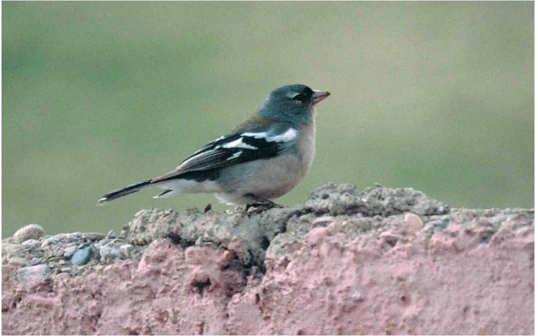
366 Atlas Chaffinch / Atlasvink Fringilla coelebs africana , male, Agadir-Taroudannt, Morocco, 24 January 1987. This bird shows a suggestion of the upper eye-crescent bleeding off into a very faint sort of supercilium which may be more typical of spodiogenys . 367 Atlas Chaffinch / Atlasvink Fringilla coelebs africana , male, Jendouba, Tunisia, 3 May 2005