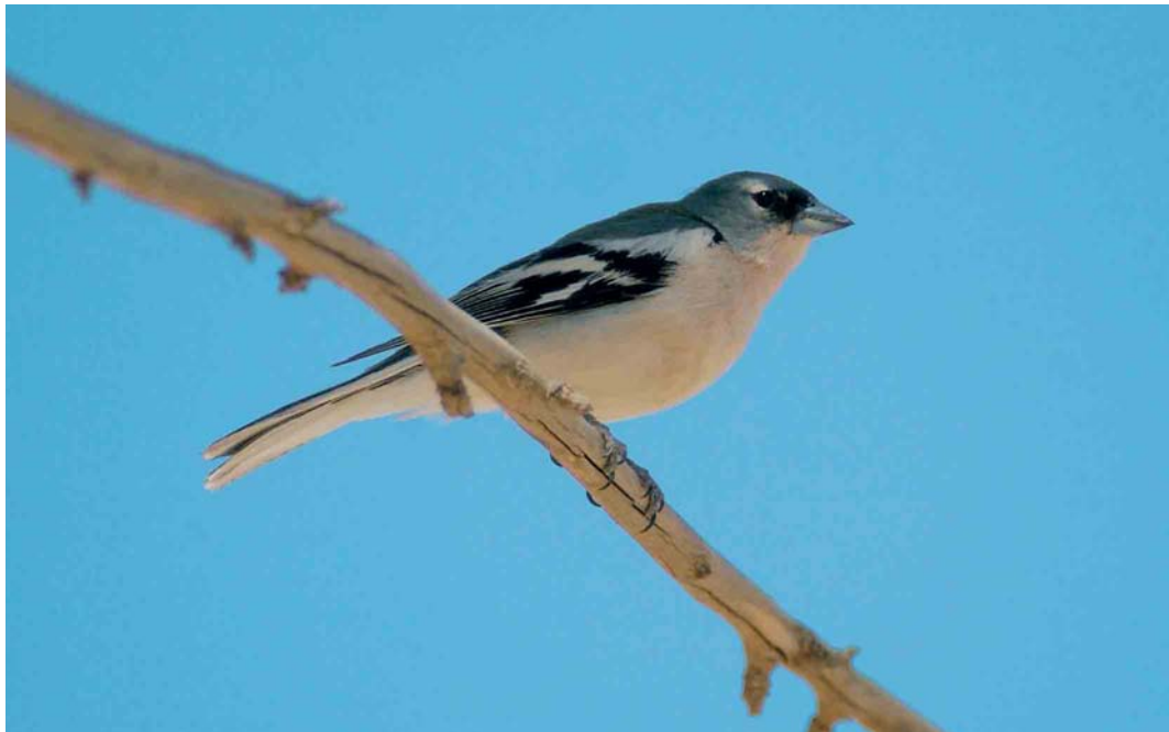
368 Tunisian Chaffinch / Tunesische Vink Fringilla coelebs spodiogenys , male, north of Skhira, Sfax, Tunisia, 1 May 2005 (René Pop)