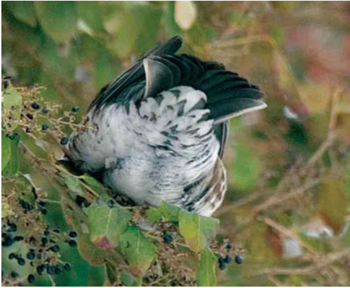
mystery photograph IX (September)