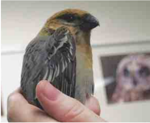
386 Haakbek / Pine Grosbeak Pinicola enucleator , eerste-winter mannetje (gevonden in Leeuwarden, Friesland, op 15 november 2004), Ureterp, Friesland, 15 november 2004 ( Oane Tol )