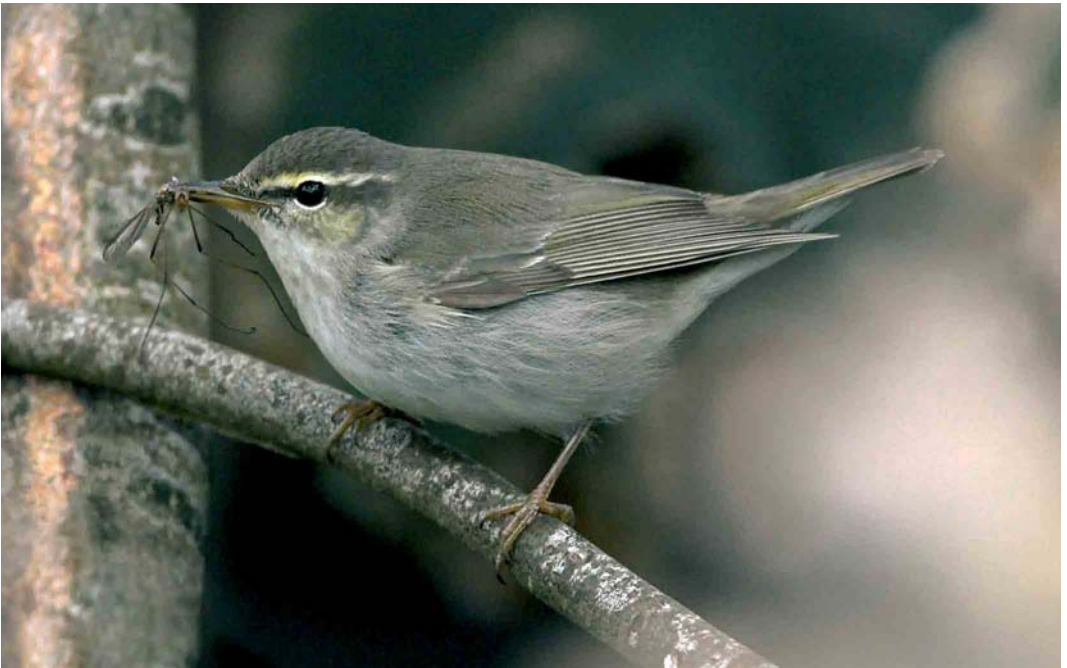
425 Arctic Warbler / Noordse Boszanger Phylloscopus borealis , Bressay, Shetland, Scotland, 6 September 2005