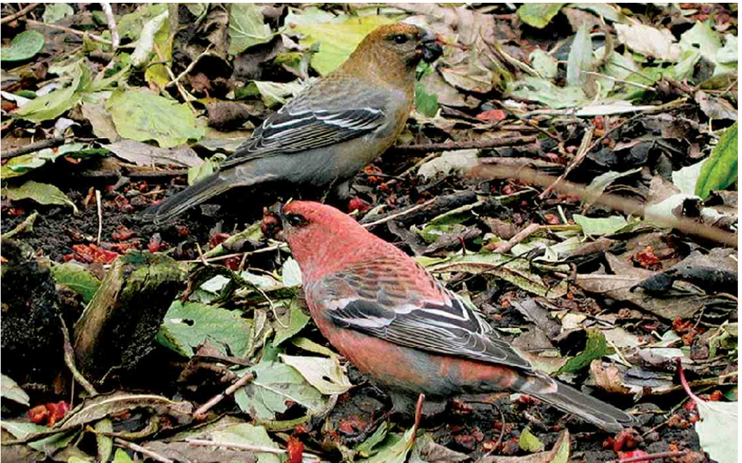
393 Haakbekken / Pine Grosbeaks Pinicola enucleator , adult mannetje en vermoedelijk adult vrouwtje, Beijum, Groningen, Groningen, 18 november 2004