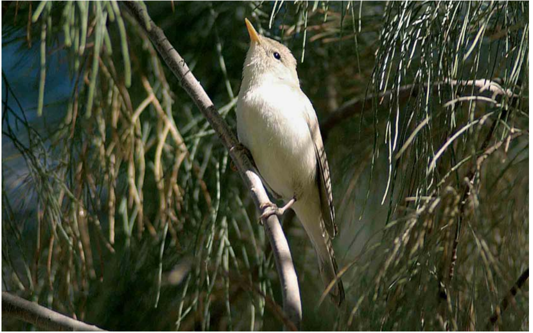
372-373 Saharan Olivaceous Warbler / Saharaanse Vale Spotvogel Acrocephalus pallidus reiseri , Arram, Gabès, Tunisia, 1 May 2005