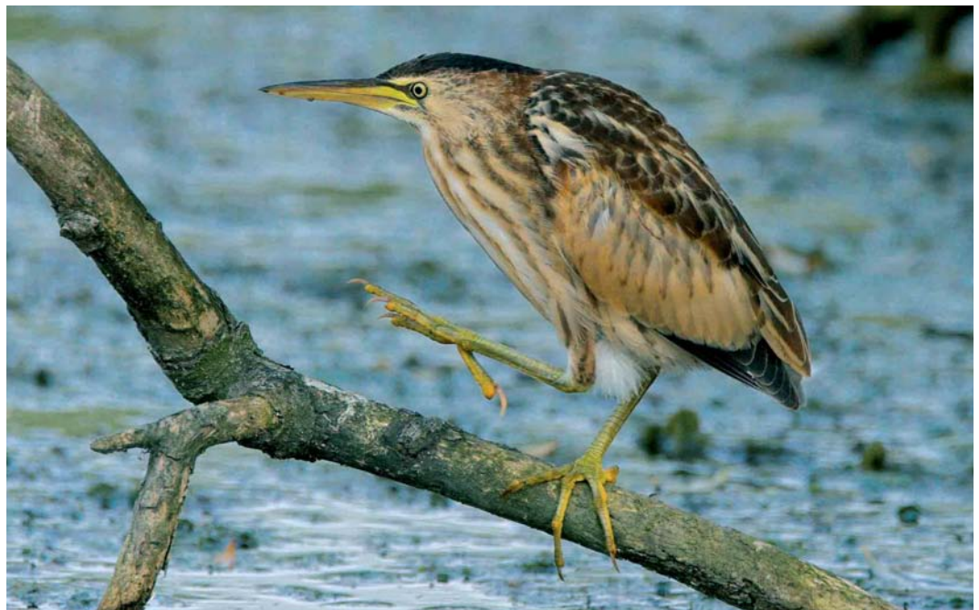
428 Woudaap / Little Bittern Ixobrychus minutus , juveniel, Illikhoven, Limburg, 18 augustus 2005