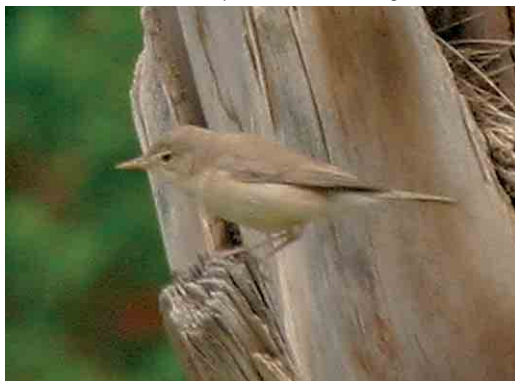
376 Saharan Olivaceous Warbler / Saharaanse Vale Spotvogel Acrocephalus pallidus reiseri , Tozeur, Tunisia, 17 May 2005 (Frederic Jiguet)

Photographs from Ghidma (6 May) and Arram (1 May) showed birds with quite a different appearance. The Ghidma birds seemed to have a more Phylloscopus -like appearance, a more obvious pale wing panel and a narrower and shorter