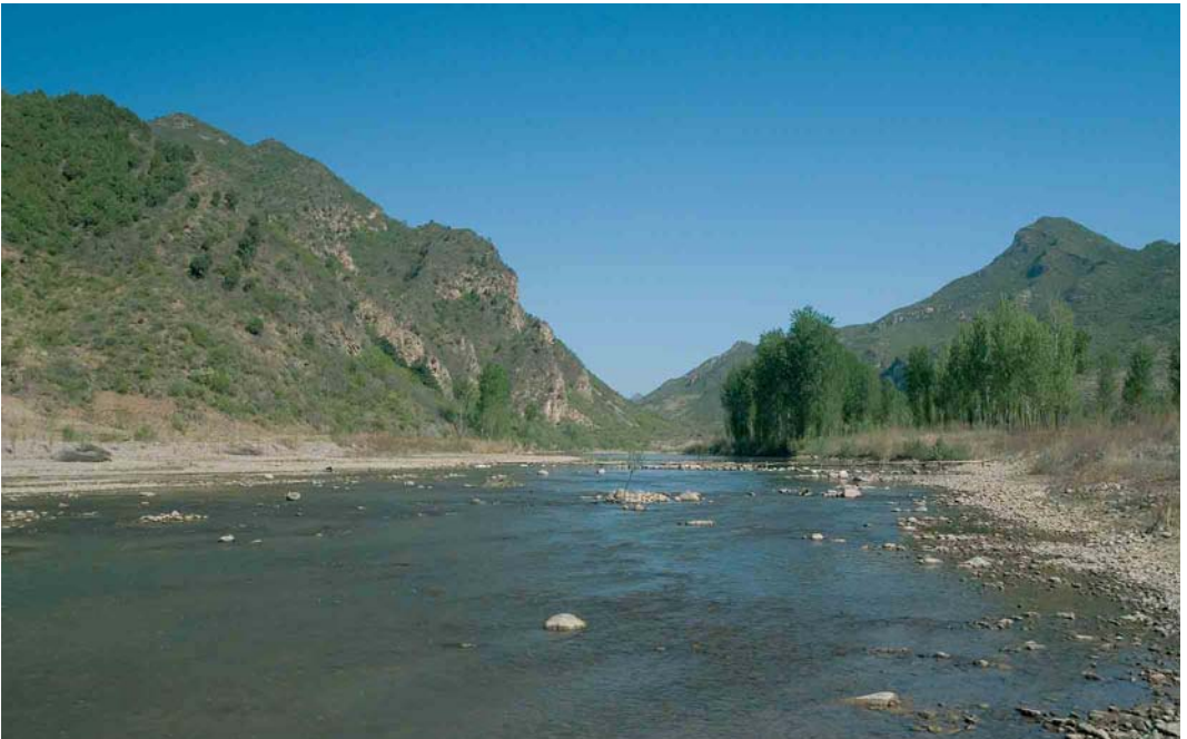
410 Habitat of Ibisbill / Ibissnavel Ibidorhyncha struthersii along Baihe, north of Huairou, Beijing, China, 1 May 2005 (Bas van den Boogaard)