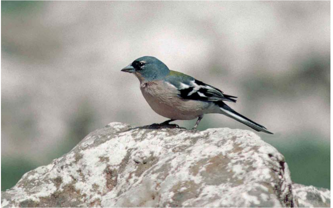
362 Atlas Chaffinch / Atlasvink Fringilla coelebs africana , male, Ifrane, Morocco, 27 March 2002 (Arnoud B van den Berg)