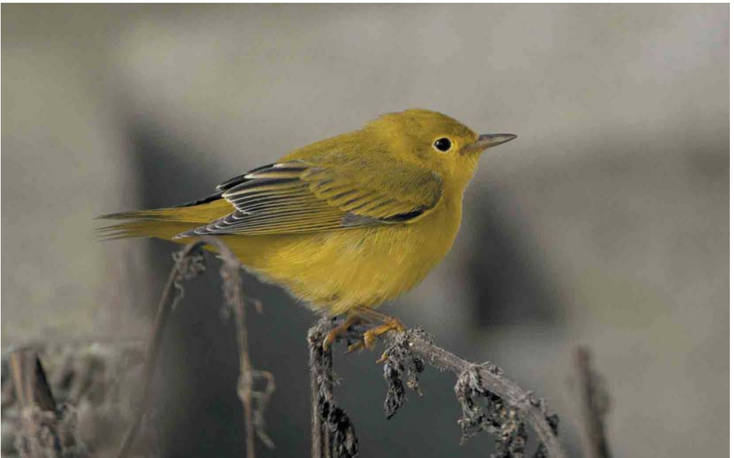
426 Yellow Warbler / Gele Zanger Dendroica petechia , Quendale, Mainland, Shetland, Scotland, 15 September 2005