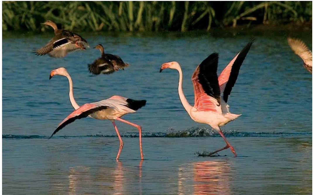
427 Flamingo's / Greater Flamingos Phoenicopterus roseus , adult, Buggenum, Limburg, juli 2005 (Otto Plantema)