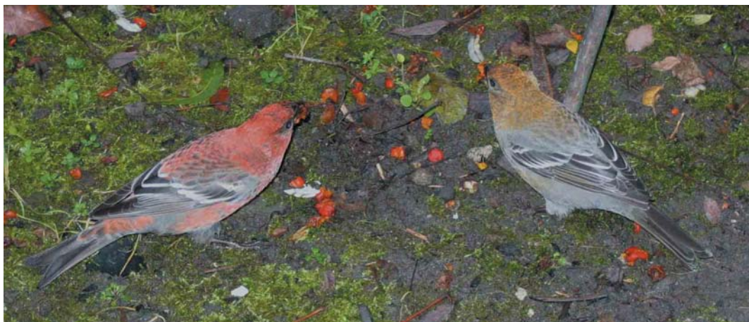
394 Haakbekken / Pine Grosbeaks Pinicola enucleator , adult mannetje en vermoedelijk adult vrouwtje, Beijum, Groningen, Groningen, 18 november 2004 (Roland Jansen) 395 Haakbekken / Pine Grosbeaks Pinicola enucleator , adult mannetje en vermoedelijk adult vrouwtje, Beijum, Groningen, Groningen, 17 november 2004 (Enno B Ebels)

foeragerend, meestal op de grond en soms in struiken tot enkele meters hoogte. Meestal dicht bij elkaar, vaak op minder dan 1 m onderlinge afstand. Foeragerend op bessen van Gewone Lijsterbes Sorbus aucuparia , zowel op afgevalen bessen op grasveld als aan boom; inhoud van bessen werd opgegeten (voornamelijk zaden), schil werd niet opgegeten. Beide vogels zeer tam, tot op minder dan 1 m en soms zelfs tot op enkele centimeters te benaderen. Vogels schijnbaar ongestoord door aanwezigheid van talloze waarnemers en fotografen. Wel alert bij langlopen van honden en katten, dan boom of struik invliegend en vaak roepend.