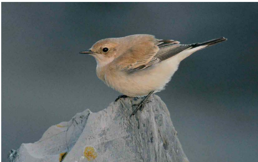
382 Westelijke Blonde Tapuit / Western Black-eared Wheatear Oenanthe hispanica , vrouwtje, Eemshaven, Groningen, 7 november 2004