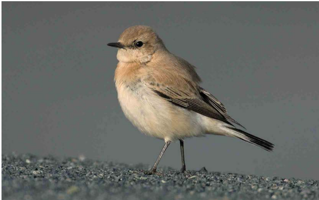
381 Westelijke Blonde Tapuit / Western Black-eared Wheatear Oenanthe hispanica , vrouwtje, Eemshaven, Groningen, 21 november 2004