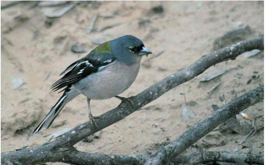
363 Atlas Chaffinch / Atlasvink Fringilla coelebs africana , male, Oued Massa, Souss, Morocco, 19 March 2004 (Arnoud B van den Berg)