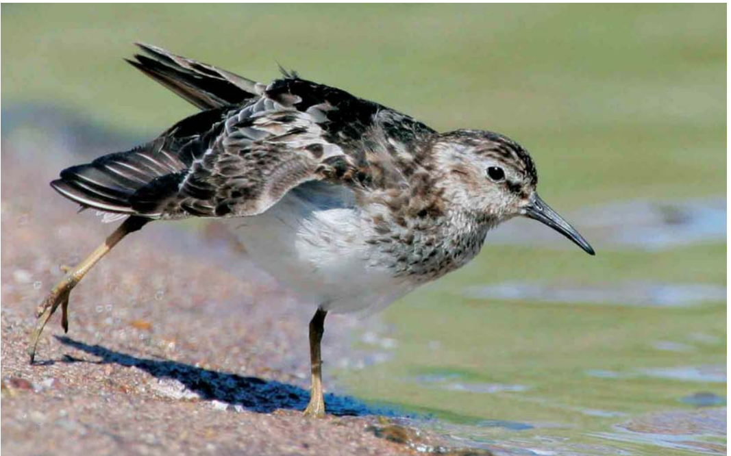
417 Least Sandpiper / Kleinste Strandloper Calidris minutilla , adult, South Milton Ley, Devon, England, August 2005 (John Lee)