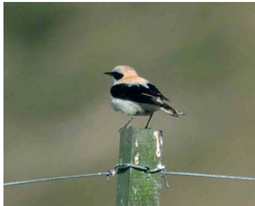
379-380 Westelijke Blonde Tapuit / Western Black-eared Wheatear Oenanthe hispanica , eerste-zomer mannetje, Lies, Terschelling, 11 mei 2001

Tapuit. Lengte van zichtbare handpennen ongeveer tweederde van lengte van tertiaals. Vleugeltop niet voorbij helft van staart komend.