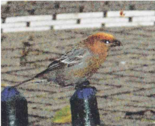
388 Haakbek / Pine Grosbeak Pinicola enucleator , vrouwtje of eerste-winter mannetje, Zandkreek, Alkmaar, Noord-Holland, 17 november 2004 ( Cora Seijbel )

werd hij dood aangetroffen. De vogel is inmiddels opgezet en bevindt zich nu in het Natuurmuseum Fryslân in Leeuwarden. AH meldde per telefoon dat het niet zeker is dat de vogel tegen het raam is gevlogen. Dat was alleen haar veronderstelling toen ze hem versuft aantrof. Bij inspectie in het museum bleek hij de rechterhelft van zijn staart te missen. Het kan dus ook zijn dat er een kat in het spel is geweest (Peter Koomen in litt). Bij inspectie werd verder geconstateerd dat de vogel vermagerd was en geen vet-reserves had. Op 18 februari 2005 heeft Bert de Bruin de inmiddels opgezette vogel bestudeerd en gefotografeerd.