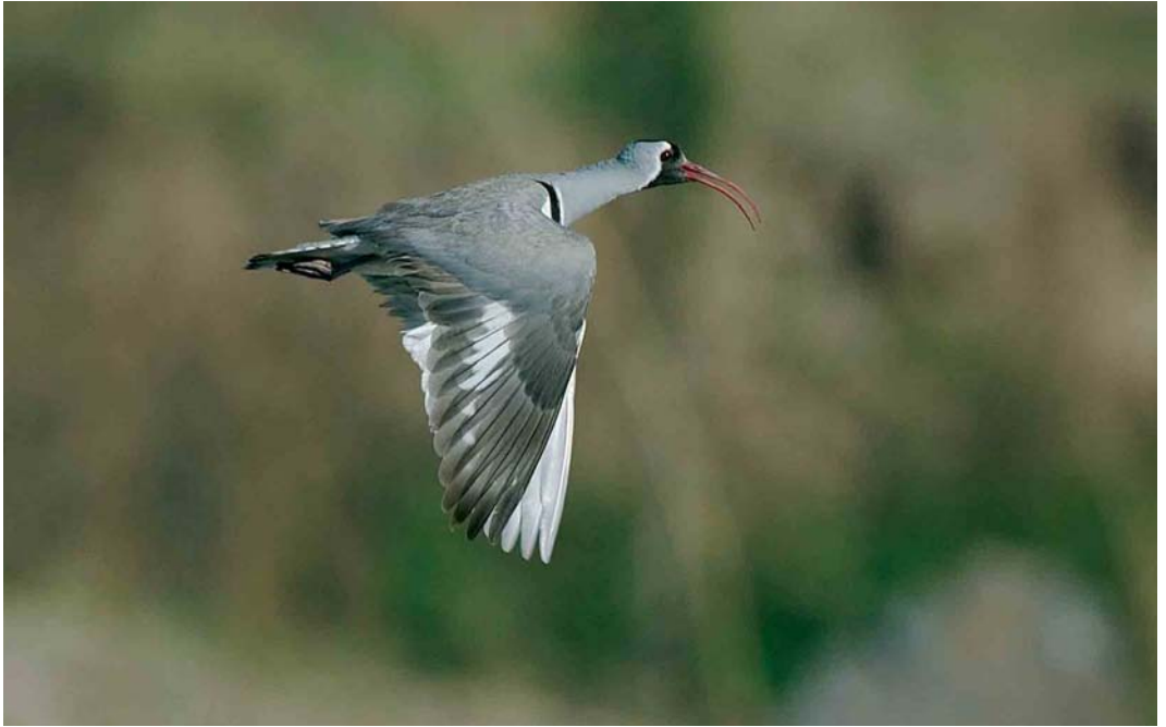
407-408 Ibisbill / Ibisnavel Ibidorhyncha struthersii , Baihe, north of Huairou, Beijing, China, 1 May 2005