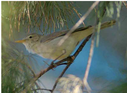
374-375 Saharan Olivaceous Warbler / Saharaanse Vale Spotvogel Acrocephalus pallidus reiseri , Arram, Gabès, Tunisia, 1 May 2005

Olivaceous, while Western Olivaceous keeps its tail still (Parkin et al 2004, Jiguet 2005, Ottoson et al 2005). Both Western Olivaceous and Saharan Olivaceous use similar tac calls but they differ in song. The latter's more monotonous and somewhat coarse sounding song has a structure characteristic of Eastern Olivaceous as parts of a few seconds in length are repeated ('cycling') while the more pleasing song of Western Olivaceous is not characterized by repetitions of such long sections (Ottoson et al 2005, Magnus Robb in litt).