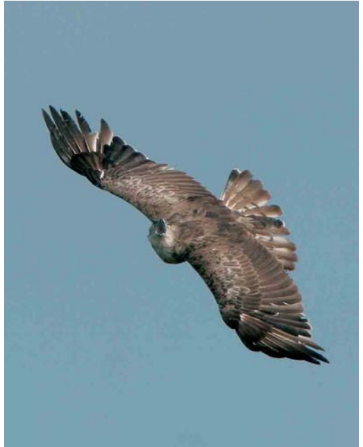
437 Slangenarend / Short-toed Eagle Circaetus gallicus (onder), met Buizerd / Common Buzzard Buteo buteo , Fochteloërveen, Friesland, 11 juli 2005 ( Jan Bosch ) 438 Slangenarend / Short-toed Eagle Circaetus gallicus , Fochteloërveen, Friesland, 11 juli 2005 ( Jan Bosch ) 439 Grote Burgemeester / Glaucous Gull Larus hyperboreus , eerste-zomer, Katwijk, Zuid-Holland, 2 september 2005 ( Menno van Duijn )