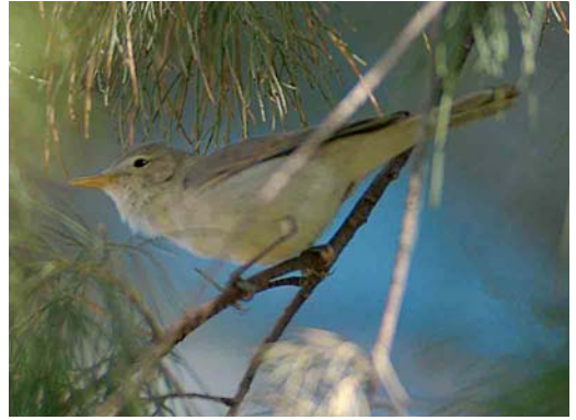
374-375 Saharan Olivaceous Warbler / Saharaanse Vale Spotvogel Acrocephalus pallidus reiseri , Arram, Gabès, Tunisia, 1 May 2005

Olivaceous, while Western Olivaceous keeps its tail still (Parkin et al 2004, Jiguet 2005, Ottoson et al 2005). Both Western Olivaceous and Saharan Olivaceous use similar tac calls but they differ in song. The latter's more monotonous and somewhat coarse sounding song has a structure characteristic of Eastern Olivaceous as parts of a few seconds in length are repeated ('cycling') while the more pleasing song of Western Olivaceous is not characterized by repetitions of such long sections (Ottoson et al 2005, Magnus Robb in litt).