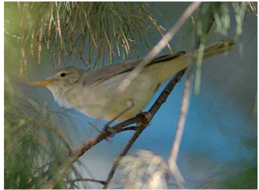
374-375 Saharan Olivaceous Warbler / Saharaanse Vale Spotvogel Acrocephalus pallidus reiseri , Arram, Gabès, Tunisia, 1 May 2005 (René Pop)

Olivaceous, while Western Olivaceous keeps its tail still (Parkin et al 2004, Jiguet 2005, Ottoson et al 2005). Both Western Olivaceous and Saharan Olivaceous use similar tac calls but they differ in song. The latter's more monotonous and somewhat coarse sounding song has a structure characteristic of Eastern Olivaceous as parts of a few seconds in length are repeated ('cycling') while the more pleasing song of Western Olivaceous is not characterized by repetitions of such long sections (Ottoson et al 2005, Magnus Robb in litt).