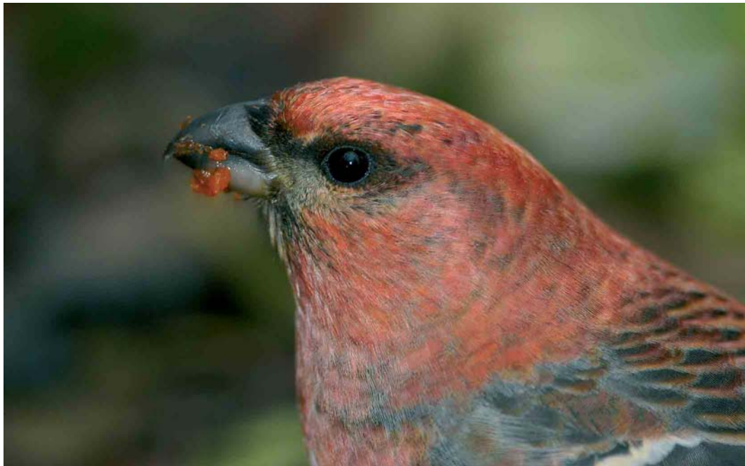
390 Haakbek / Pine Grosbeak Pinicola enucleator , adult mannetje, Beijum, Groningen, Groningen, 18 november 2004 ( Marten van Dijl )