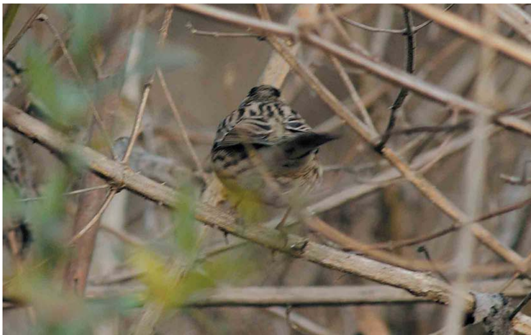
Mystery photograph IV (February)