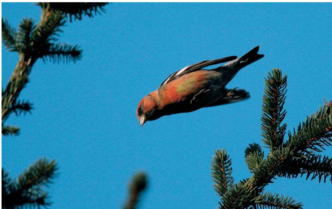
182 Witbandkruisbek / Two-barred Crossbill Loxia leucoptera bifasciata , mannetje, Wateren, Drenthe, februari 2005