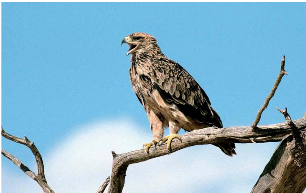
Mystery photograph III (March)