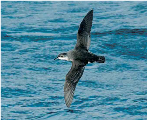
113 Little Shearwater / Kleine Pijlstormvogel Puffinus assimilis elegans , Crozet Island, March 2004 (Hadoram Shirihai)