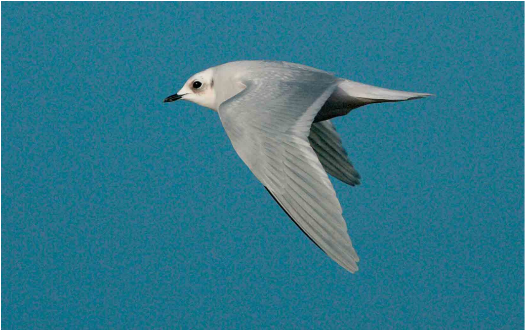
168 Ross's Gull / Ross' Meeuw Rhodostethia rosea , adult, Brow Marsh, Shetland, Scotland, January 2005