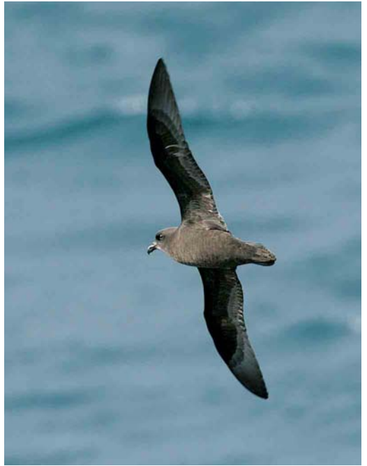
107 Light-mantled Albatross / Roetkopalbatros Phoebastria palpebrata , off Crozet Islands, March 2004 ( Hadoram Shirihai ) 108 Great-winged Petrel / Langvleugelstormvogel Pterodroma macroptera , off Crozet Islands, March 2004 ( Hadoram Shirihai ) 109 Salvin's Prion / Salvins Prion Pachyptila salvini , off Crozet Islands, March 2004 ( Hadoram Shirihai )