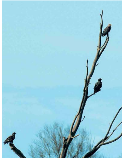
179 Zeereyden / White-tailed Eagles Haliaeetus albicilla , Oostvaardersplassen, Flevoland, 25 januari 2005

ding van een Dikbekfuut Podilymbus podiceps op 17 en 18 februari in het centrum van Den Haag. Winterwaarnemingen van Grauwe Pijlstormvogels Puffinus griseus werden verricht langs Scheveningen, Zuid-Holland, op 9 en 14 januari. Een Vaal Stormvogeltje Oceanodroma leucorhoa werd op 20 januari eveneens bij Scheveningen gezien. Maximaal vijf Kuifaalscholvers Phalacrocorax aristotelis verbleven tot 22 januari bij Neeltje Jans. Verspreid langs de kust werden er nog eens 15 gemeld van 10 locaties. Twee Koereigers Bubulcus ibis vlogen op 15 januari langs Goes, Zeeland, en op 21 februari verbleef er één bij Hem, Noord-Holland. Het hoogste aantal Kleine Zilverreigers Egretta garzetta betrof 34 op 22 januari bij Ouwerkerk, Zeeland. Wintertellingen van Grote Zilverreigers Casmerodius albus in december en januari leverden in totaal 26 slaappleaatsen op met maar liefst 445 exemplaren, waaronder zes locaties met meer dan 30 en als absoluut maximum 58 in Botshol, Utrecht; overigens is dit beeld niet volledig. De Zwarte Ibis Plegadis falcinellus van Huisduinen, Noord-Holland, bleef tot 5 februari. In januari werden vijf Rode Wouwen Milvus milvus gemeld en nog eens vijf in februari. In totaal werden 16 Zeereyden Haliaeetus albicilla doorgegeven, waaronder geregeld drie in de Oostvaardersplassen, Flevoland. Toendraslechtsvalken Falco peregrinus calidus werden op 16 januari gemeld bij Hellevoetsluis, Zuid-Holland, en op 24 januari bij