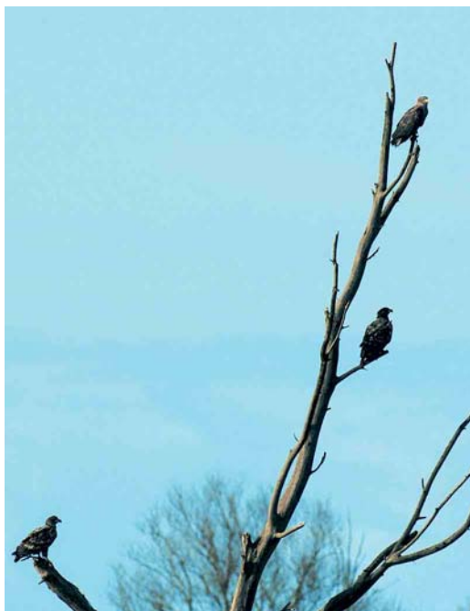
179 Zeerenden / White-tailed Eagles Haliaeetus albicilla , Oostvaardersplassen, Flevoland, 25 januari 2005

ding van een Dikbekfuut Podilymbus podiceps op 17 en 18 februari in het centrum van Den Haag. Winterwaarnemingen van Grauwe Pijlstormvogels Puffinus griseus werden verricht langs Scheveningen, Zuid-Holland, op 9 en 14 januari. Een Vaal Stormvogeltje Oceanodroma leucorhoa werd op 20 januari eveneens bij Scheveningen gezien. Maximaal vijf Kuifaalscholvers Phalacrocorax aristotelis verbleven tot 22 januari bij Neeltje Jans. Verspreid langs de kust werden er nog eens 15 gemeld van 10 locaties. Twee Koereigers Bubulcus ibis vlogen op 15 januari langs Goes, Zeeland, en op 21 februari verbleef er één bij Hem, Noord-Holland. Het hoogste aantal Kleine Zilverreigers Egretta garzetta betrof 34 op 22 januari bij Ouwerkerk, Zeeland. Wintertellingen van Grote Zilverreigers Casmerodius albus in december en januari leverden in totaal 26 slaappleaatsen op met maar liefst 445 exemplaren, waaronder zes locaties met meer dan 30 en als absoluut maximum 58 in Botshol, Utrecht; overigens is dit beeld niet volledig. De Zwarte Ibis Plegadis falcinellus van Huisduinen, Noord-Holland, bleef tot 5 februari. In januari werden vijf Rode Wouwen Milvus milvus gemeld en nog eens vijf in februari. In totaal werden 16 Zeerenden Haliaeetus albicilla doorgegeven, waaronder geregeld drie in de Oostvaardersplassen, Flevoland. Toendraslechtvalken Falco peregrinus calidus werden op 16 januari gemeld bij Hellevoetsluis, Zuid-Holland, en op 24 januari bij