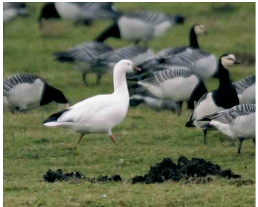
184 Bronskopeend / Falcated Duck Anas falcata , mannetje, Engbertsdijkvenen, Overijssel, 2 maart 2005 ( Richard Gerritsen ) 185 Kleine Sneeuwgangs / Lesser Snow Goose Anser caerulescens caerulescens , adult, blauwe vorm, Hekslootpolder, Haarlem, Noord-Holland, 27 februari 2005 ( Enno B Ebels ) 186 Zwarte Rotgans / Black Brant Branta nigricans , adult, Banckspolder, Schiermonnikoog, Friesland, 27 december 2004 ( Enno B Ebels ) 187 Ross' Gans / Ross's Goose Anser rossii , Oosterpoel, Waterland-Oost, Noord-Holland, 3 februari 2005 ( Ronald van Dijk )

Kamperland, Zeeland. Een Giervalk F rusticolus zou op 12 februari gezien zijn bij Nes, Friesland.