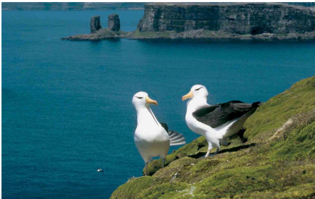
127 Black-browed Albatrosses / Wenkbrauwalbatrossen Thalassarche melanophrys , displaying in front of the 'Arche', Baie de l'Oiseau, Kerguelen Islands, 1997 (Olivier Duriez)