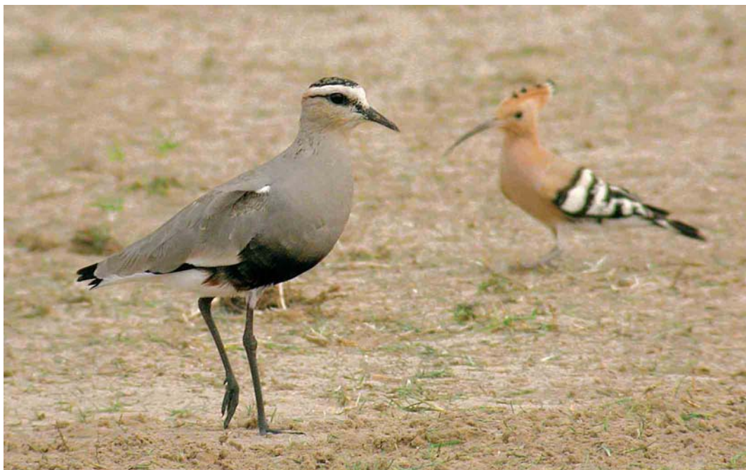
165 Sociable Lapwing / Steppekievit Vanellus gregarius , with Eurasian Hoopoe / Hop Upupa epops , Dubai pivot fields, Dubai, United Arab Emirates, 23 February 2005