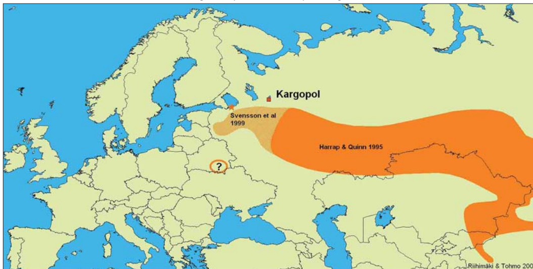
FIGURE 1 Breeding range of Azure Tit / Azuurmees Parus cyanus , after Harrap & Quinn (1995a) and Svensson et al (1999). The breeding attempt on the Novaja Ladoga is marked with *.

The total number of bird species recorded during the Kargopol expedition in 2003 was 168 (106 in 2002). Of these, 37 are included on the Annex of the European Union's Bird Directive. Almost all of the species recorded occur in Scandinavia and central Europe as well but their occurrence and numbers differ. Species common in Finland, such as Great Spotted Woodpecker D major , Goldcrest Regulus regulus , Crested Tit P cristatus , Willow Tit P montanus and Coal Tit P ater were very uncommon. Species uncommon or rare in other European countries were recorded at many sites: Great Snipe Gallinago media , Terek Sandpiper Xenus cinereus , White-backed Woodpecker D leucotos and Citrine Wagtail Motacilla citreola . The team found out that for many species even the most recent distribution maps were inaccurate. At least the following species either breed or occur regularly in the Kargopol area and this should be taken into account when new distribution maps are made: Gadwall Anas strepera , Great Bittern Botaurus stellaris , Grey Heron Ardea cinerea , Pallid Harrier Circus macrourus , Montagu's Harrier C pygargus , Common Quail Coturnix coturnix (which is nowadays rather