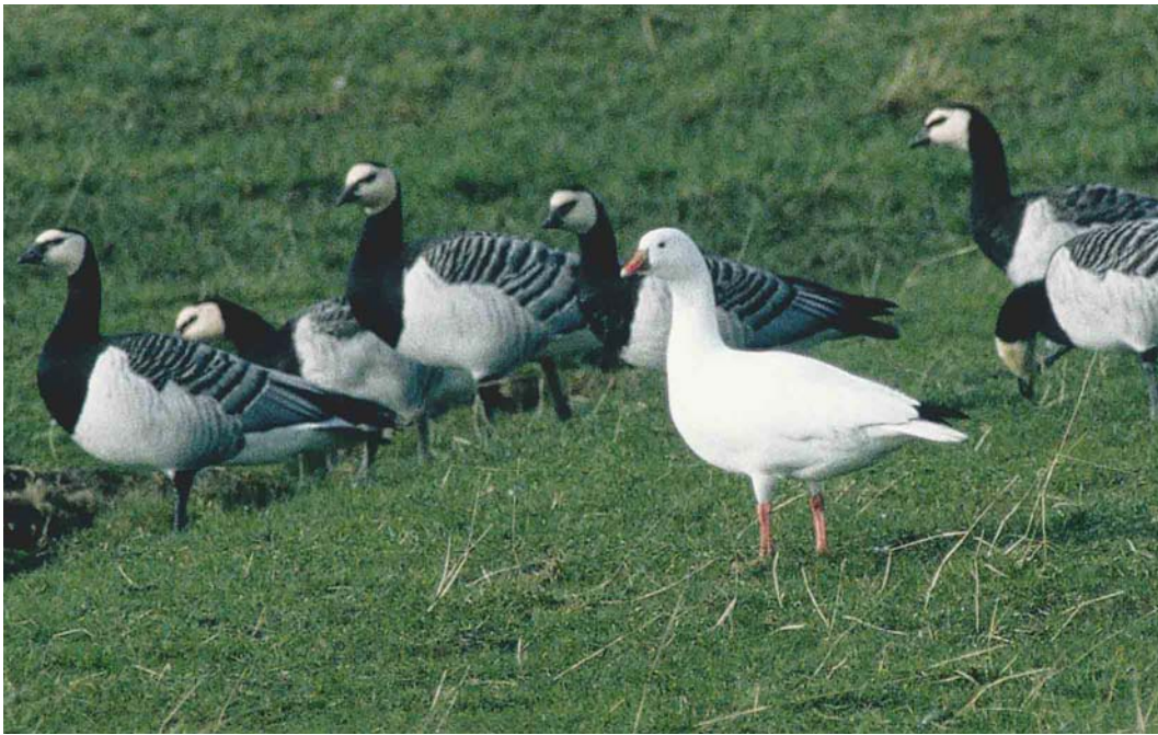
164 Ross' Gans / Ross's Goose Anser rossii , Anjumerkolken, Friesland, 26 februari 2000