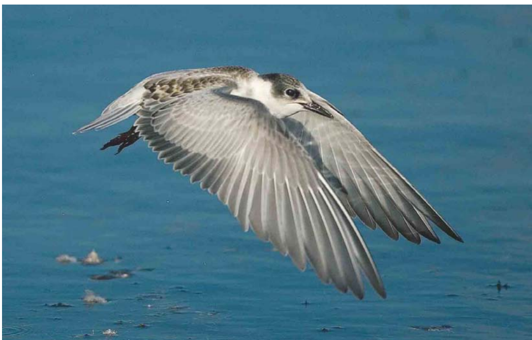
593 Witwangstern / Whiskered Tern Chlidonias hybrida , juveniel, Hoornse Meer, Drenthe, 10 oktober 2004