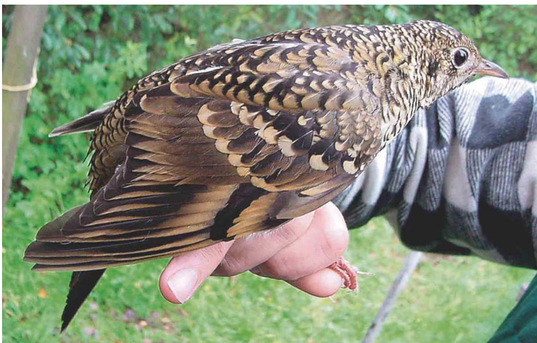
575 White's Thrush / Goudlijster Zoothera aurea , first-year, Schiermonnikoog, Friesland, Netherlands, 4 October 2004 (Henri Bouwmeester)