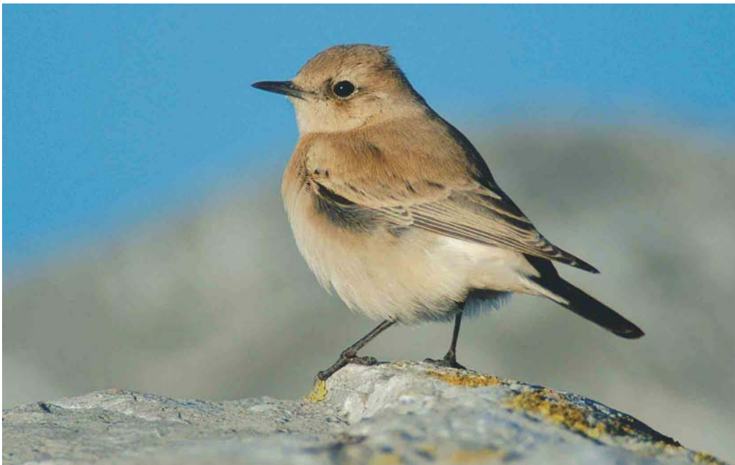
573 Western Black-eared Wheatear / Westelijke Blonde Tapuit Oenanthe hispanica , female, Eemshaven-Oost, Groningen, Netherlands, 7 November 2004 ( Marten van Dijk )