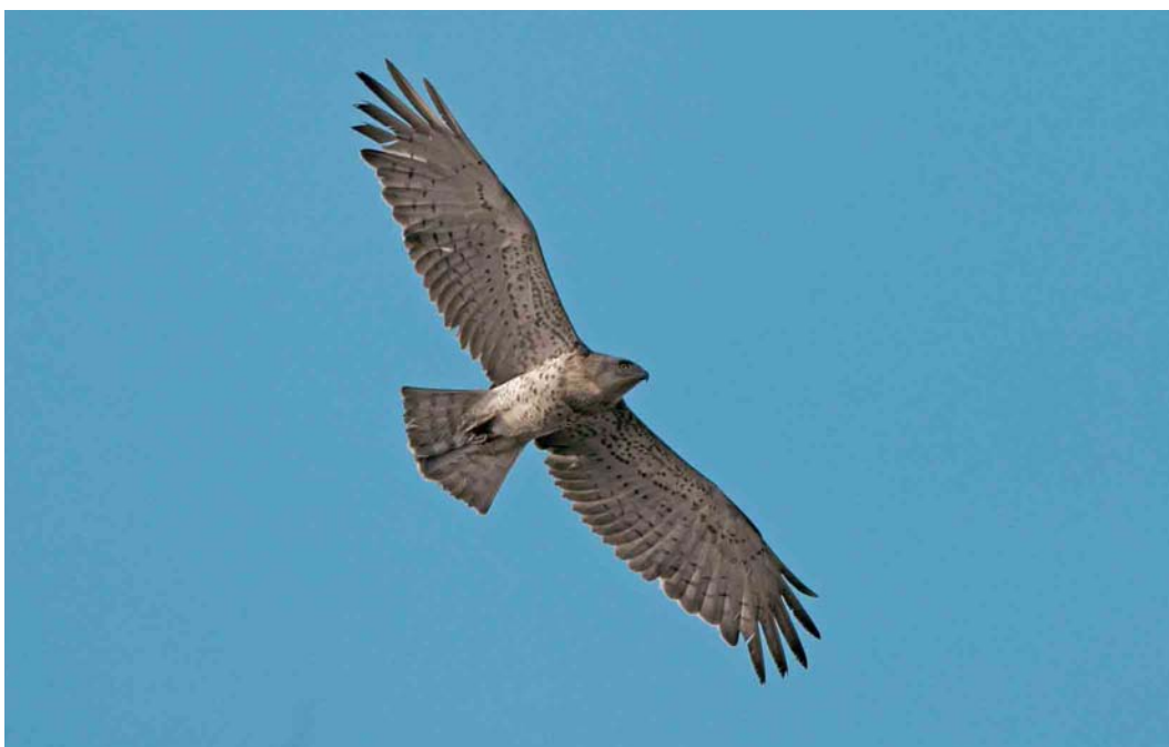
523 Short-toed Eagle / Slangenarend Circaetus gallicus , second calendar-year, De Hamert, Limburg, 14 August 2003