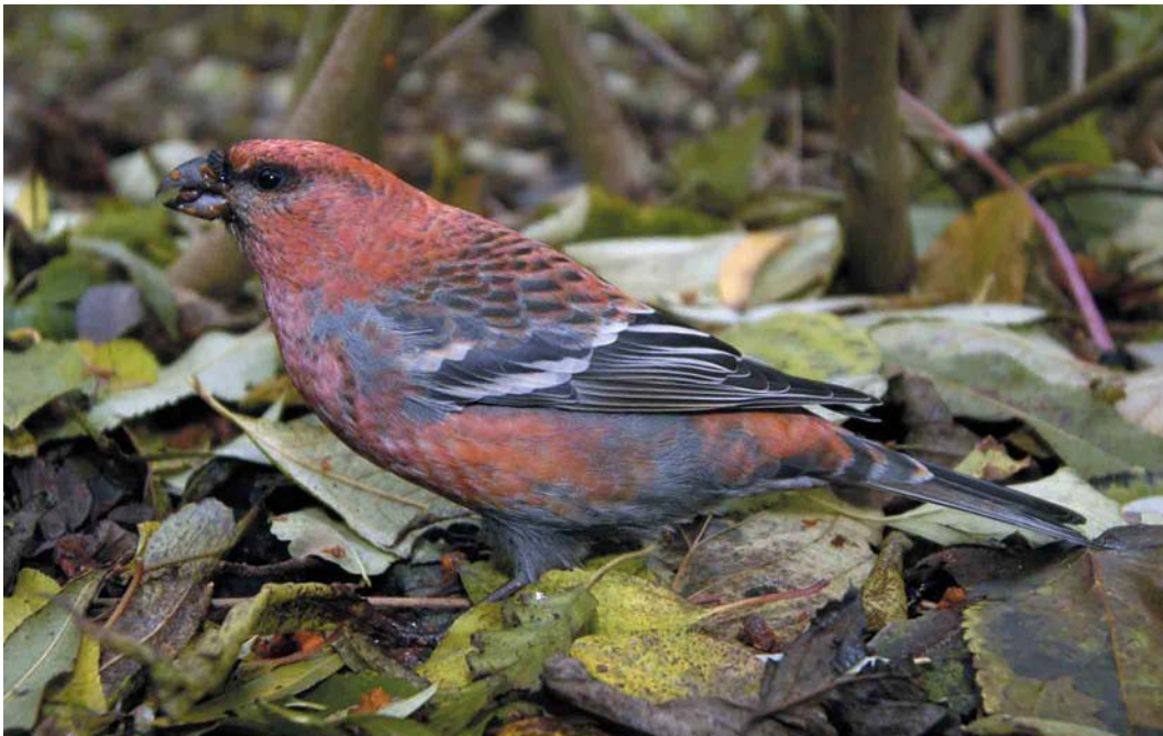
612 Haakbek / Pine Grosbeak Pinicola enucleator , adult mannetje, Groningen, Groningen, 18 november 2004