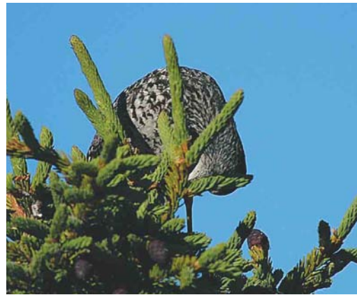
Mystery photograph XII (June)

scribed to Dutch Birding. From those entrants having identified both mystery birds correctly, one person will be drawn who will receive a free one year subscription for 2005 of the birding journal Alula donated by the Alula editorial