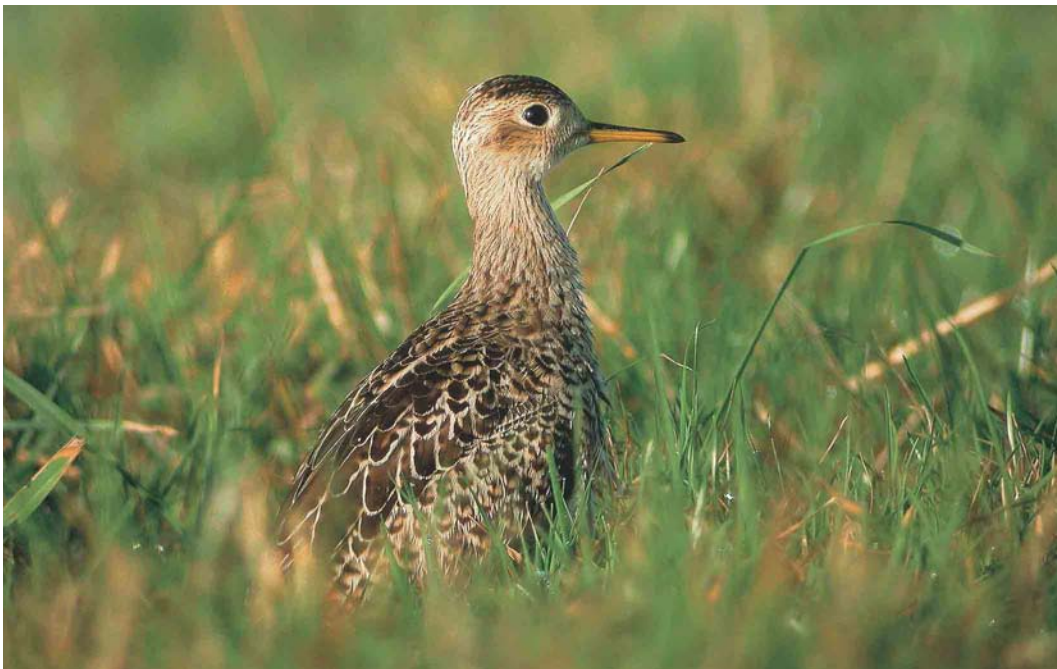
551 Upland Sandpiper / Bartrams Ruitter Bartramia longicauda , Ouessant, Finistère, France, 1 October 2004