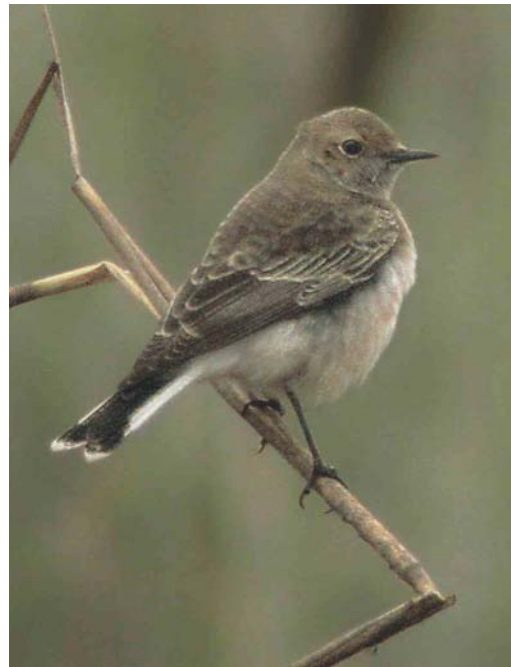
596-597 Bonte Tapuit / Pied Wheatear Oenanthe pleschanka , eerstejaars mannetje, Schiermonnikoog, Friesland, 31 oktober 2004 (Marnix Jonker)

Zoothera aurea met de eerste op 1 oktober door vele waarnemers bekeken in de Kunstenaarsduintjes bij IJmuiden, en daarna op 3 oktober een overvliegende bij Doornenburg, Gelderland, en een melding op Vlieland, op 4 oktober een vangst op Schiermonnikoog (de volgende dag teruggevangen), en ten slotte op 9 en 10 oktober langsvliegende exemplaren bij Den Haag. Vermeldenswaard is het aantal van ruim 100 000 Koperwieken Turdus iliacus dat op 9 oktober telpost de Nolle bij Vlissingen passeerde. Cetti's Zangers Cettia cetti werden waargenomen tot 17 oktober maximaal twee bij Stellendam, Zuid-Holland, op 13 oktober weer eens bij de Groedsche Duintjes bij Breskens, Zeeland, en op 30 oktober bij Oostvoorne, Zuid-Holland. Vangsten vonden plaats op 4 september in het Verdrongen Land van Saefthinghe, op 9 oktober bij Almere en op 26 september, 27 en 28 oktober en 14 november bij Castricum, Noord-Holland. Tot 19 oktober werden nog 11 Graszangers Cisticola juncidis gemeld. De vijfde Siberische Sprinkhaanzanger Locustella certhiola werd gevangen bij Bloemendaal op 30 september; voor het eerst op een andere ringbaan dan die bij Castricum. Waterrietzangers Acrocephalus paludicola werden gezien op 4 en 5 september bij Katwijk aan Zee, en op 12 september bij Zwolle, Overijssel. Vangsten vonden plaats op 3 september in het Verdrongen Land van Saefthinghe en op 6 september bij Budel-Dorplein, Noord-Brabant. De tweede najaarswaarneming van een Baardgrasmus Sylvia cantillans voor Nederland