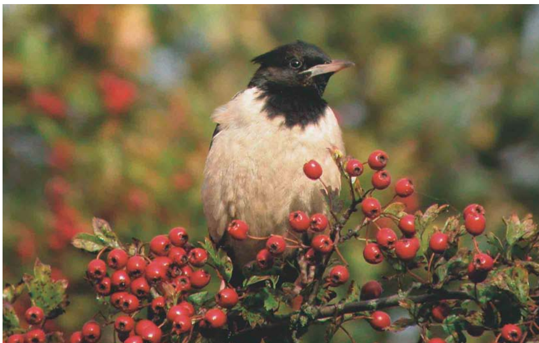
600 Roze Spreeuw / Rose-coloured Starling Sturnus roseus , adult, Noorderstreek, Schiermonnikoog, Friesland, september 2004