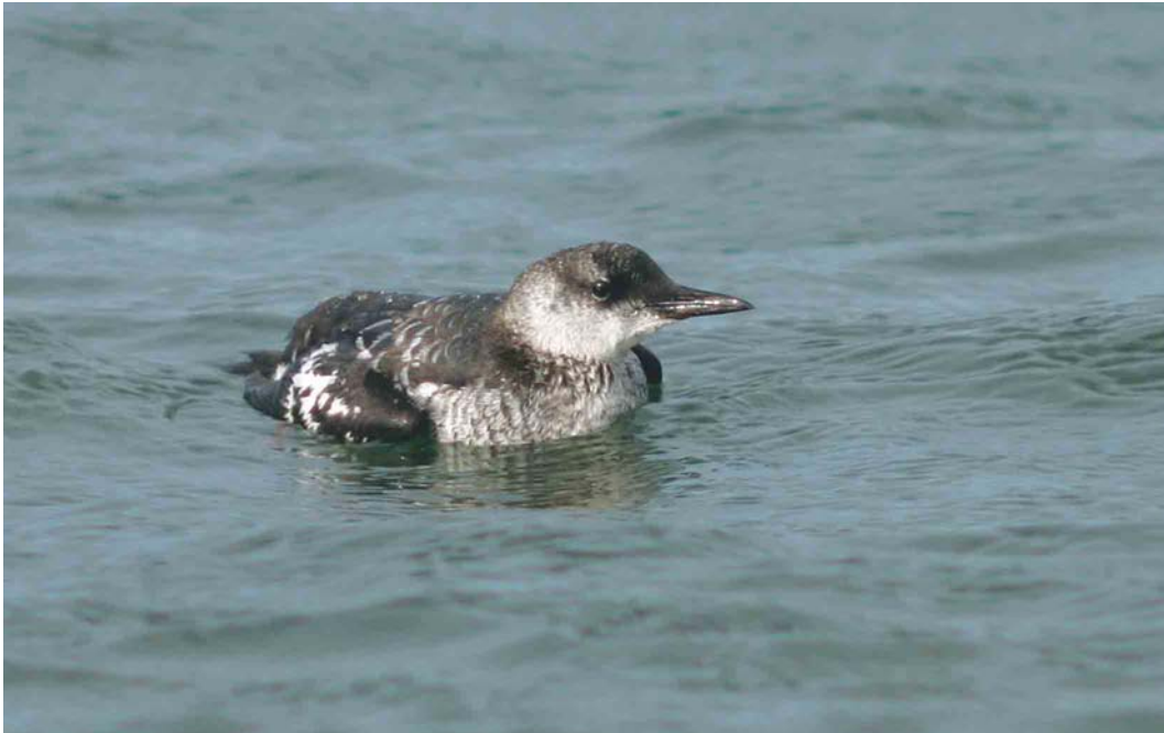
590 Zwarte Zeekoet / Black Guillemot Cephus grylle , eerstejaars, Maasvlakte, Zuid-Holland, 11 september 2004 (Chris van Rijswijk)