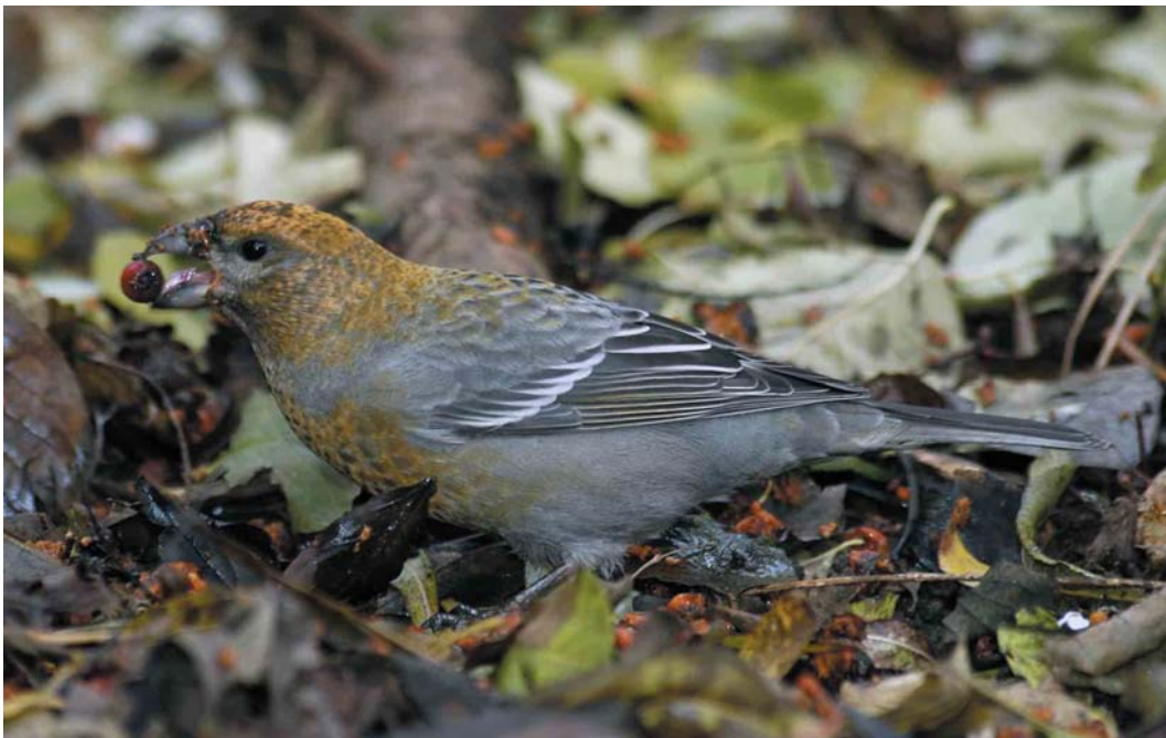
613 Haakbek / Pine Grosbeak Pinicola enucleator , eerste-winter mannetje of vrouwtje, Groningen, Groningen, 18 november 2004