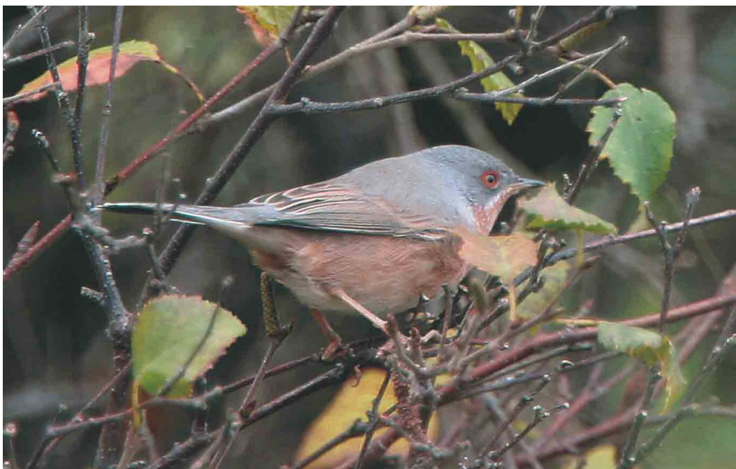
598 Baardgrasmus / Subalpine Warbler Sylvia cantillans , Vlieland, Friesland, 3 oktober 2004 (Han Zevenhuizen)