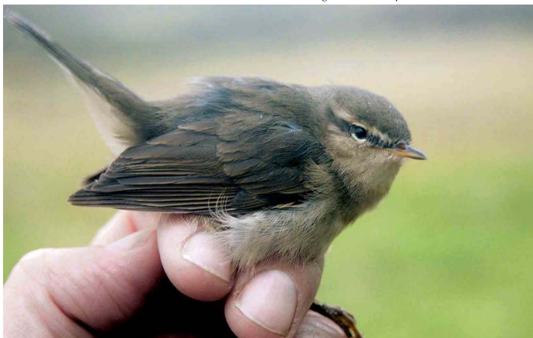
605 Bruine Boszanger / Dusky Warbler Phylloscopus fuscatus , Kennemerduinen, Bloemendaal, Noord-Holland, 20 oktober 2004