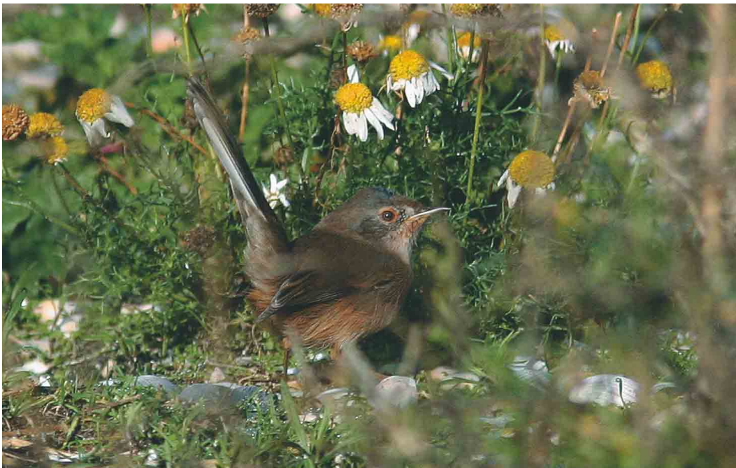
608 Provençaalse Grasmus / Dartford Warbler Sylvia undata , Zeebrugge, West-Vlaanderen, oktober 2004 (Koen Verbanck)

grote afstand in de vroege uurtjes gezien. Op 3 september pleisterde een Hop Upupa epops in een tuin in Sint-Huibrechts-Hern, Limburg. Er werden 62 Draaihalzen Jynx torquilla doorgegeven, de meeste tussen 1 en 5 september. Op 8 oktober was er na een leegte van enkele jaren weer een waarneming van een Middelste Bonte Specht Dendrocopos medius in Pulderbos, Antwerpen. Vanaf 3 oktober verschenen de eerste Strandleeuweriken Eremophila alpestris maar het bleef telkens bij één tot maximaal acht exemplaren. Grote Piepers Anthus richardi werden vanaf 29 september waargenomen op volgende plaatsen: Essen; Heist (twee); Knokke (twee); Nieuwpoort; Oostduinkerke, West-Vlaanderen; Oudenburg, West-Vlaanderen; Rijkvorsel, Antwerpen; en Tienen (twee). Pleisterende vogels werden weer voornamelijk vastgesteld in het Zeebrugse met c negen in de Achterhaven en drie in de Voorhaven. Er werden nog 47 Duinpiepers A campestris opgemerkt, waarvan 38 tussen 1 en 10 september. De laatste waarnemingen gebeurden in Perwez, Namur, en in Houthalen, Limburg, op 3 oktober. De 11 waargenomen Roodkeelpiepers A cervinus trokken alle langs tussen 13 september en 13 oktober. Op 19 oktober trok een late Gele Kwikstaart Motacilla flava over Tienen. De eerste Pestvogel Bombycilla garrulus trok op 22 oktober over Koksijde, West-Vlaanderen; daarna volgden waarnemingen in Blankenberge op 27 oktober; in Zeebrugge op 28 oktober (drie) en 29 oktober; over Boekhoute op 30 oktober; en over Dilsen-