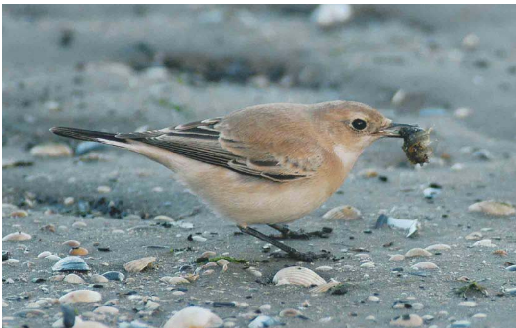
594 Westelijke Blonde Tapuit / Western Black-eared Wheatear Oenanthe hispanica , vrouwtje, Eemshaven-Oost, Groningen, 7 november 2004