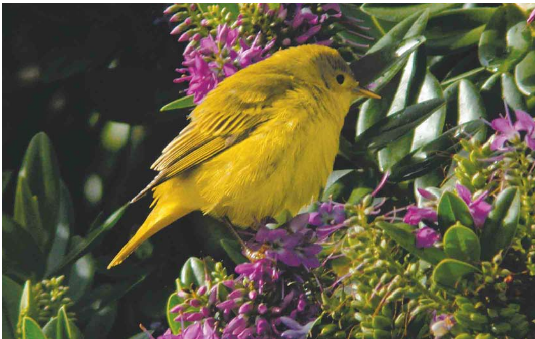
579 Yellow Warbler / Gele Zanger Dendroica petechia , Brevig, Barra, Outer Hebrides, Scotland, 4 October 2004