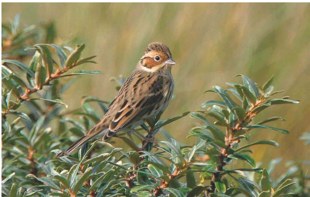
604 Dwerggors / Little Bunting Emberiza pusilla , Vlieland, Friesland, 30 september 2004 (Han Zevenhuizen)