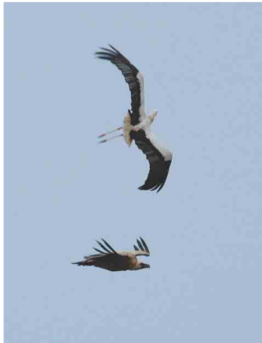
519-520 Eurasian Griffon Vulture / Vale Gier Gyps fulvus , immature, with White Stork / Ooievaar Ciconia ciconia , De Wijk, Drenthe, 14 June 2003 (Wolter van Dijk)