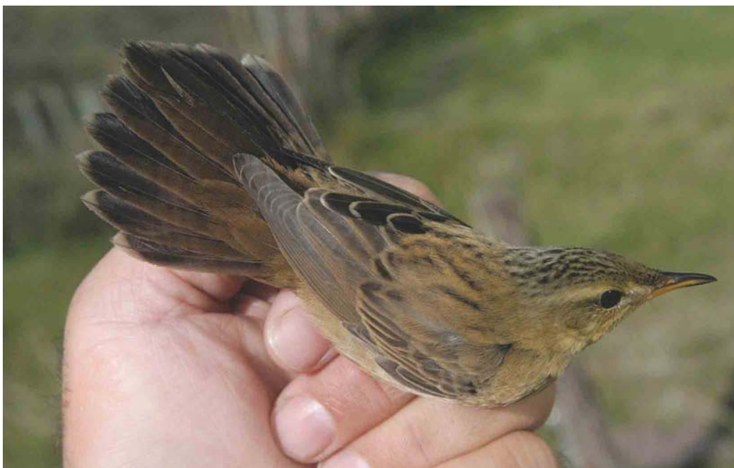
602 Siberische Sprinkhaanzanger / Pallas's Grasshopper Warbler Locustella certhiola , eerstejaars, Kennemerduinen, Bloemendaal, Noord-Holland, 30 september 2004