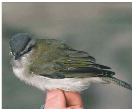
539 Paddyfield Warbler / Veldrietzanger Acrocephalus paludicola , Castricum, Noord-Holland, 12 September 2003 (Arnold Wijker) 540 Pallas's Grasshopper Warbler / Siberische Sprinkhaanzanger Locustella certhiola , Castricum, Noord-Holland, 12 September 2003 (Arnold Wijker) 541 Dusky Warbler / Bruine Boszanger Phylloscopus fuscatus , Castricum, Noord-Holland, 16 October 2003 (Arnold Wijker) 542 Red-eyed Vireo / Roodoogvireo Vireo olivaceus , Castricum, Noord-Holland, 22 October 2003 (Arnold Wijker)