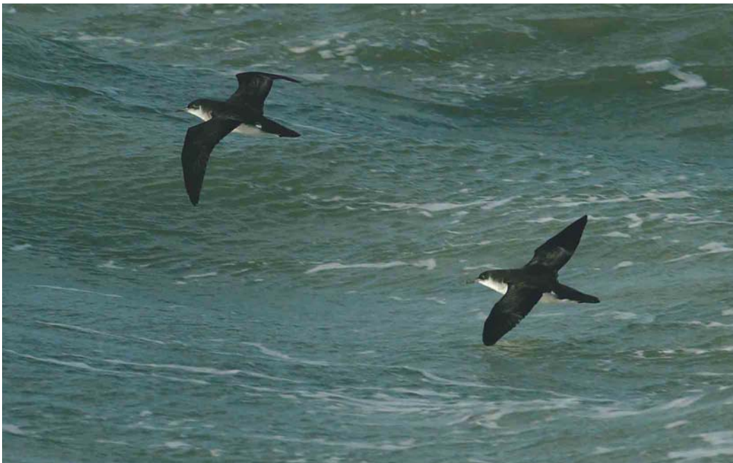
607 Noordse Pijlstormvogels / Manx Shearwaters Puffinus puffinus , Oostende, West-Vlaanderen, 21 september 2004 (Roland François)