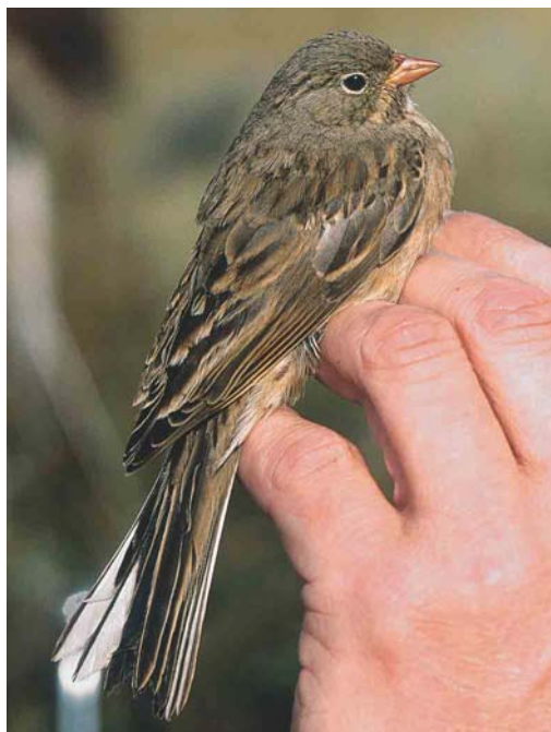
610 Steenortolaan / Grey-necked Bunting Emberiza buchanani , Castricum, Noord-Holland, 16 oktober 2004 (Arnold Wijker)

'hout'). Zowel RR als AW bevonden zich buiten de vinkershut maar snelden naar binnen om via het kijkgat te zien waar de gors gebleven was. Pas na enige tijd ontdekten ze de vogel, niet zoals verwacht in het hout maar op een dakpan tussen het gras. AW, die alleen een kopje boven het gras zag uitsteken, pakte zijn kijker en riep 'Het lijkt wel een Ortolaan!' RR liep bij het kleine kijkgat van de druip vandaan om ook via een openstaand raam te kijken of het inderdaad om een Ortolaan ging. Juist op dat moment zag AW de vogel door zijn kijker opvliegen en laag over het eerste deel van het slagnet verdwijnen, zodat hij een lelijk woord aan RR toevoegde, omdat naar zijn mening de vogel met het slagnet gevangen had kunnen worden. RR haastte zich weer naar het kijkgat om te zien waar de gors was gebleven. Hij zag de vogel nergens meer en deze leek weg te zijn. JV, die al die tijd achter in de hut aan het ringen was geweest, keek ook eens door het kijkgat en vroeg 'Zit-ie niet gewoon op de baan?'. Hij had gelijk en RR trok het net dicht. Allen snelden naar buiten; RR haalde de vogel onder het net vandaan en riep 'Toch een Ortolaan, maar wel een rare!' Deels op basis van het uiterlijk maar vooral voor de grap zei AW 'Het is een Steenortolaan!' Natuurlijk werd er echter van uitgegaan dat het gewoon een Ortolaan E hortolana was. Op basis van de kleur van de onderzijde en het vrijwel ontbreken van enige duidelijke streping werd (voorlopig) geconcludeerd dat het een adulte