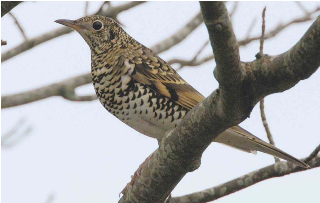
576 White's Thrush / Goudlijster Zosterorhina aurea , Swining, Mainland, Shetland, Scotland, 12 October 2004 (Hugh Harrop)