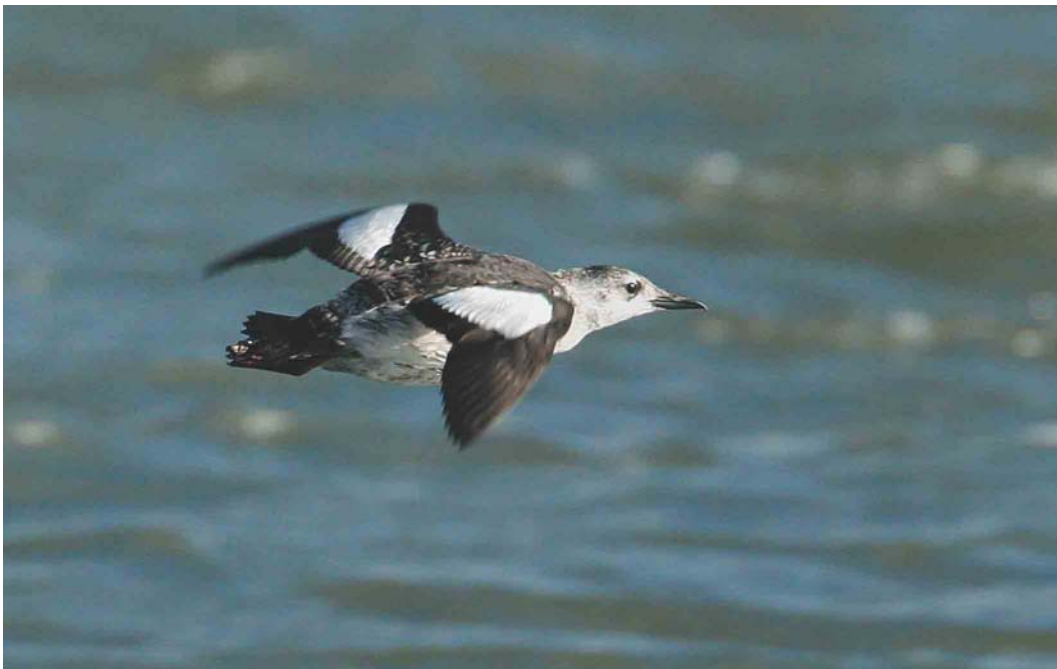
591 Zwarte Zeekoet / Black Guillemot Cephus grylle , adult-winter, West-Terschelling, Terschelling, Friesland, oktober 2004