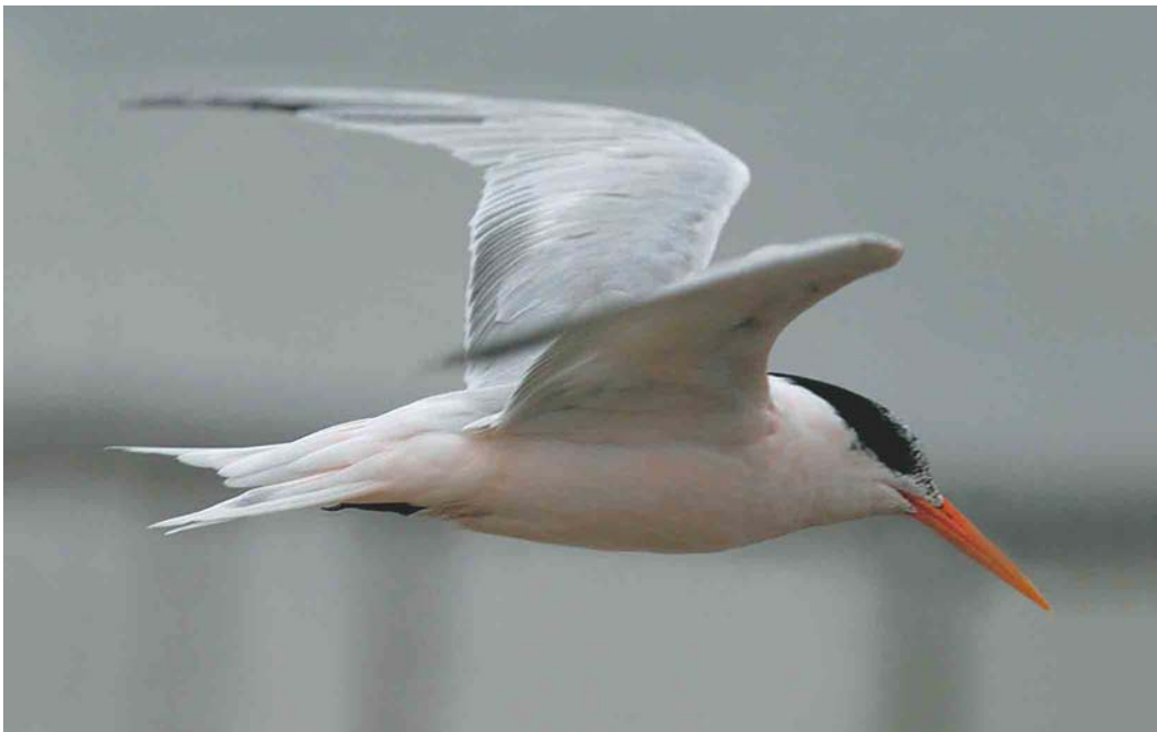
569 Presumed Elegant Tern / vermoedelijke Sierlijke Stern Sterna elegans , Brokdorf, Schleswig-Holstein, Germany, September 2004