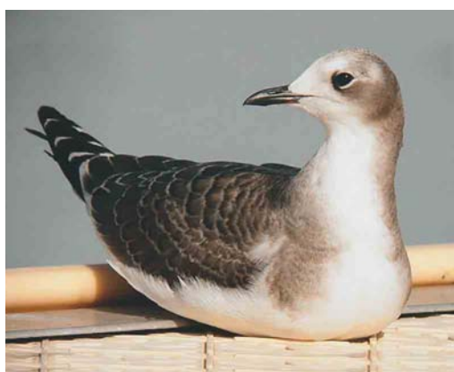
556-557 Pallid Swift / Vale Gierzwaluw Apus pallidus , Helgoland, Schleswig-Holstein, Germany, 27 October 2004 558 Wilson's Storm-petrel / Wilsons Stormvogeltje Oceanites oceanicus , off Galicia, Spain, 21 August 2004 559 Snowy Egret / Amerikaanse Kleine Zilverreiger Egretta thula , Horta, Azores, 6 October 2004 560 Purple Gallinule / Amerikaans Purperhoen Porphyryla martinica , first-year, Mogán, Gran Canaria, Canary Islands, 19 October 2004 561 Sabine's Gull / Vorkstaartmeeuw Larus sabini , juvenile, Lac du Der-Chantecoq, Giffaumont-Campaubert, Marne, France, October 2004