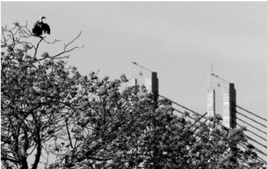
521 Eurasian Griffon Vulture / Vale Gier Gyps fulvus , Zaltbommel, Gelderland, 22 May 2001 (Cor de Kock)