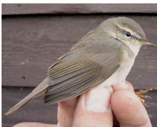
562 Blyth's Reed Warbler / Struikrietzanger Acrocephalus dumetorum , Canal Vell, Ebro delta, Tarragona, Spain, 22 October 2004 563 Eastern Orphean Warbler / Oostelijke Orpheusgrasmus Sylvia crassirostris , first-year male, Sula, Sør-Trøndelag, Norway, 3 October 2004 564 Brown Shrike / Bruine Klauwier Lanius cristatus , Ile de Noirmoutier, Vendée, France, 5 November 2004 565 Pallas's Grasshopper Warbler / Siberische Sprinkhaanzanger Locustella certhiola , first-year, Utsira, Norway, 30 September 2004 566 Dusky Warbler / Bruine Boszanger Phylloscopus fuscatus , Björns fyr, Uppland, Sweden, 2 October 2004. This bird was retrapped on Vlieland, Friesland, the Netherlands, on 12 October. 567 Dusky Warbler / Bruine Boszanger Phylloscopus fuscatus , Kroonspolders, Vlieland, Friesland, Netherlands, 12 October 2004. Same bird as in plate 566!