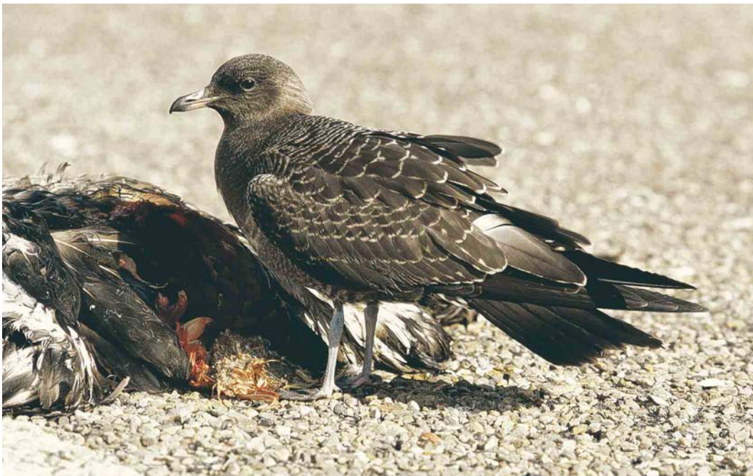
589 Kleinste Jager / Long-tailed Jaeger Stercorarius longicaudus , juveniel, Petten, Noord-Holland, 26 september 2004