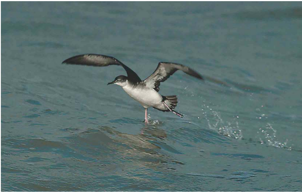
606 Noordse Pijlstormvogel / Manx Shearwater Puffinus puffinus , Oostende, West-Vlaanderen, 21 september 2004