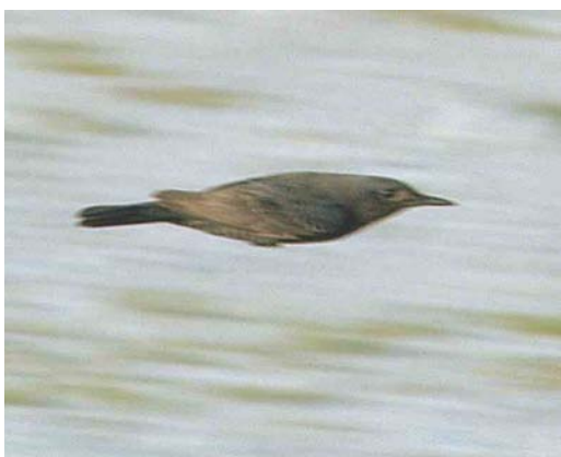
547 Blauwe Rotslijster / Blue Rock Thrush Monticola solitarius , eerstejaars, vermoedelijk mannetje, Westkapelle, Zeeland, 20 september 2003