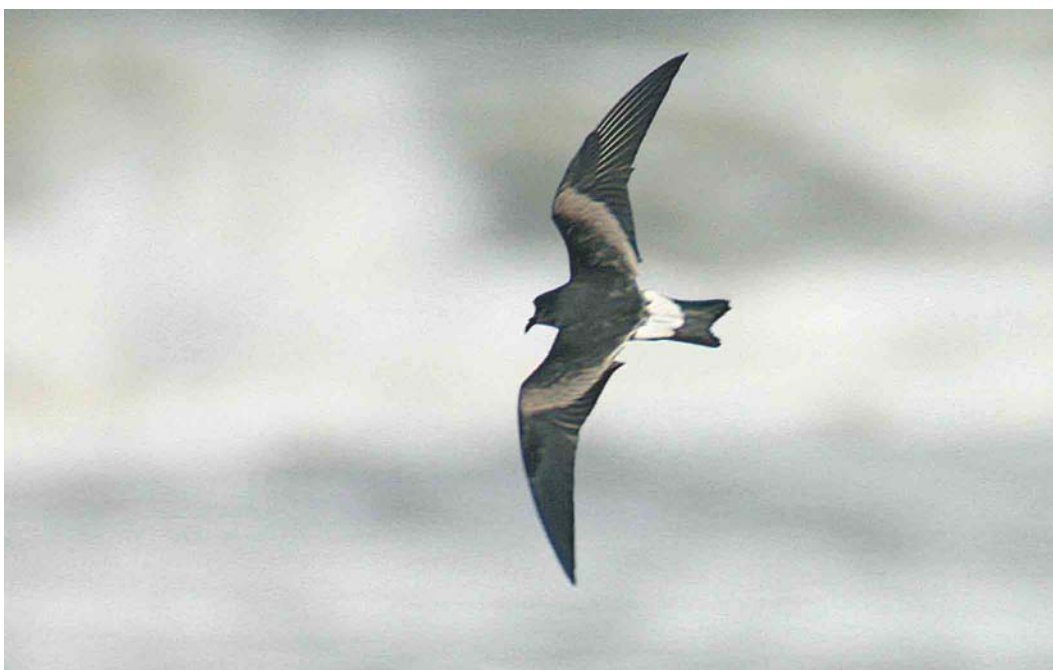
587 Vaal Stormvogeltje / Leach's Storm-petrel Oceanodroma leucorhoa , Katwijk aan Zee, Zuid-Holland, 23 september 2004