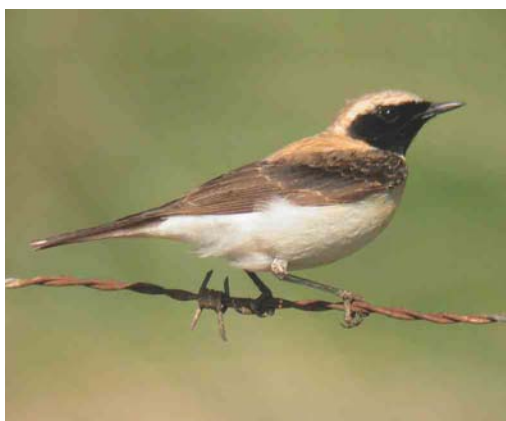
531 Red-rumped Swallow / Roodstuitzwaluw Hirundo daurica , Eijsderbeemden, Limburg, 19 April 2003 532 Daurian Shrike / Daurische Klauwier Lanius isabellinus , Texel, Noord-Holland, 25 September 2003 533 White-throated Robin / Perzische Roodborst Irania gutturalis , first-year, Budel-Dorplein, Limburg, 30 August 2003 534 Eastern Black-eared Wheatear / Oostelijke Blonde Tapuit Oenanthe melanoleuca , first-summer male, Texel, Noord-Holland, 4 May 2003

(S Sytma, E van Hijum; Dutch Birding 25: 272, plate 299, 2003).