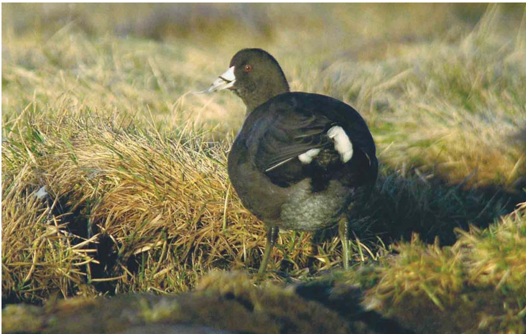
553 American Coot / Amerikaanse Meerkoet Fulica americana , Grindavík, Iceland, 20 October 2004