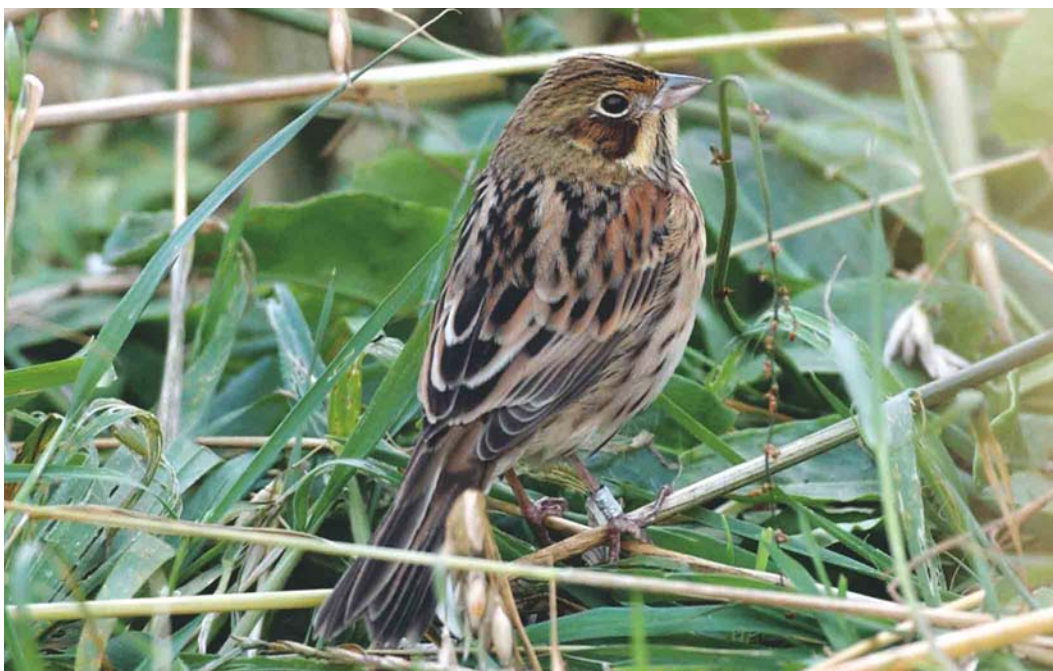
580 Chestnut-eared Bunting / Grijskoppogors Emberiza fucata , first-winter male, Fair Isle, Shetland, Scotland, October 2004 (Rebecca J Nason)