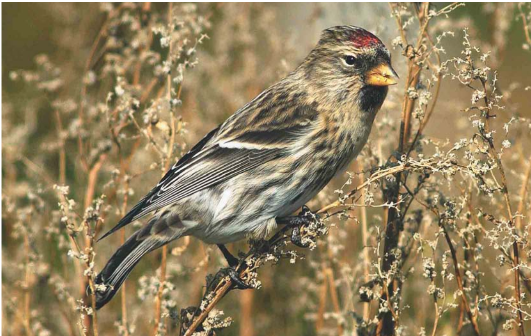
582 Greenland Redpoll / Groenlandse Barmsijs Carduelis flammea rostrata , Bryher, Scilly, England, October 2004