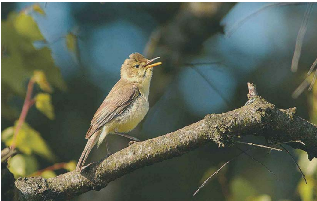
538 Melodious Warbler / Orpheusspotvogel Hippolais polyglotta , Mariapeel, Limburg, 15 June 2003 (Patrick Palmen)