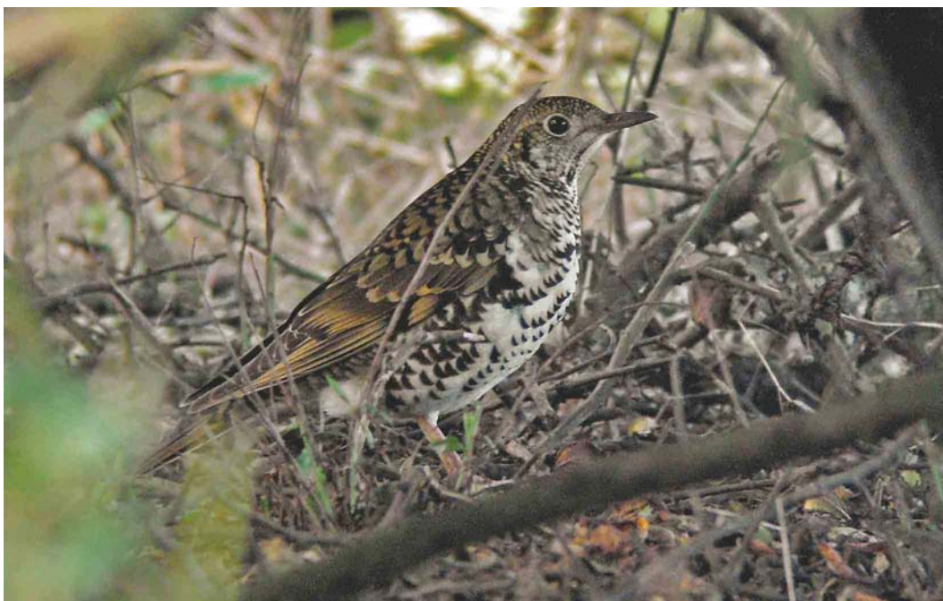
574 White's Thrush / Goudlijster Zoothera aurea , first-year, Easington, North Yorkshire, England, 10 October 2004