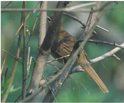
Mystery photograph XI (May)