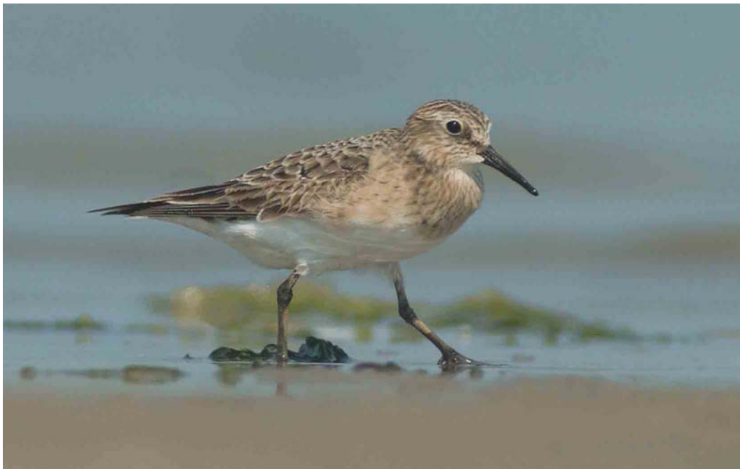
524 Baird's Sandpiper / Bairds Strandloper Calidris bairdii , adult, De Cocksdorp, Texel, Noord-Holland, 8 August 2003

8-9 May, Botgat, Groote Keeten, Zijpe , Noord-Holland, photographed (H Bouma, H Niessen, M Renden et al); 15 June, Otterlosche Zand, Ede , Gelderland, photo-