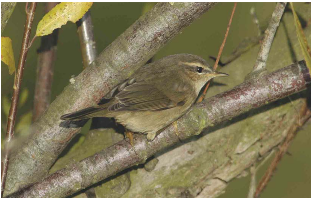
543 Dusky Warbler / Bruine Boszanger Phylloscopus fuscatus , Driel, Gelderland, 26 October 2003