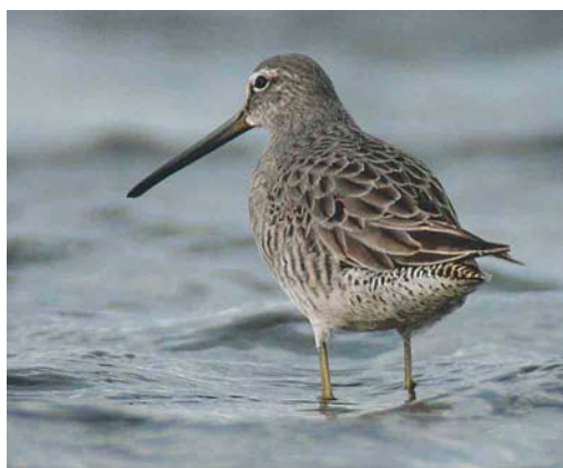
515 Lesser Scaup / Kleine Topper Aythya affinis , adult male, Scheelhoek, Zuid-Holland, 19 February 2003 ( Max Berlijn ) 516 Ring-necked Duck / Ringsnaveleend Aythya collaris , adult male, Hardenberg, Overijssel, 19 January 2003 ( Phil Koken ) 517 Greenland White-fronted Goose / Groenlandse Kogans Anser albifrons flavirostris , Slochteren, Groningen, 9 February 2003 ( Willem Hartholt ) 518 Long-billed Dowitcher / Grote Grijsje Snip Limnodromus scolopaceus , first-year, Veerse Meer, Zeeland, 8 March 2004 ( Marten van Dijk )

Several other reports have not (yet) been submitted (cf van Dongen et al 2003, 2004).