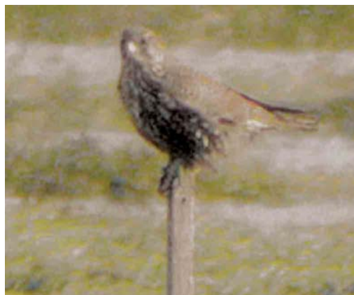
611 Giervalk / Gyr falcon Falco rusticolus , Holwerd, Friesland, 13 november 2004 (Martijn Bot)