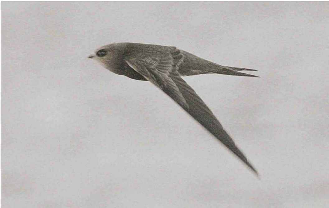
568 Pallid Swift / Vale Gierzwaluw Apus pallidus , Helsinki Pihlajasaari, Finland, 28 October 2004 (Pekka Komi)