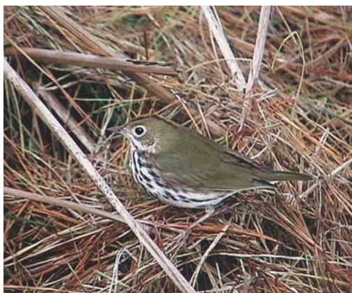
584-585 Ovenbird / Ovenvogel Seiurus aurocapilla , Trenoweth, St Mary's, Scilly, England, 26 October 2004