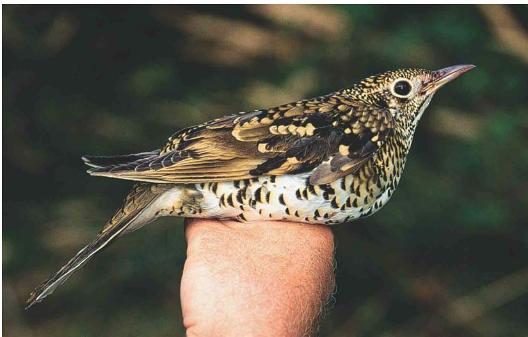
535 White's Thrush / Goudlijster Zoothera aurea , first-year, Korverskooi, Texel, Noord-Holland, 10 October 2003