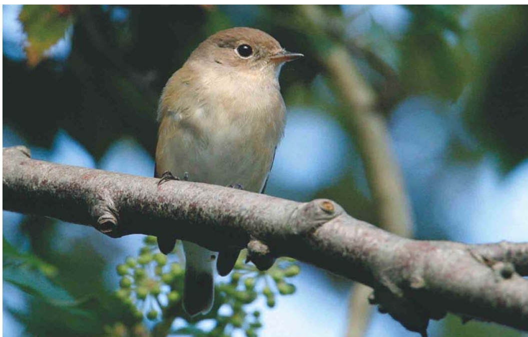
601 Kleine Vliegenvanger / Red-breasted Flycatcher Ficedula parva , Terschelling, Friesland, 8 oktober 2004