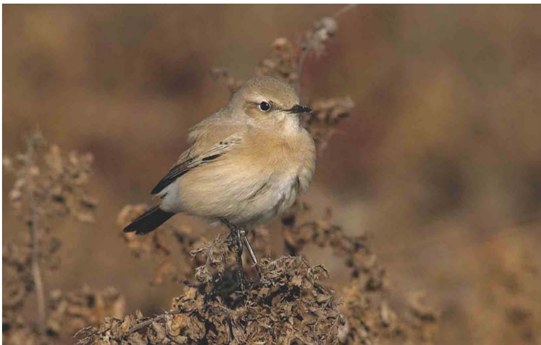
536 Desert Wheatear / Woestijntapuit Oenanthe deserti , female, De Cocksdorp, Texel, Noord-Holland, 9 November 2003