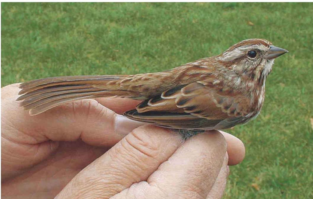
583 Song Sparrow / Zanggors Melospiza melodia , first-year, Sint-Laureins, Oost-Vlaanderen, Belgium, 30 September 2004 (Dominique Verbelen)