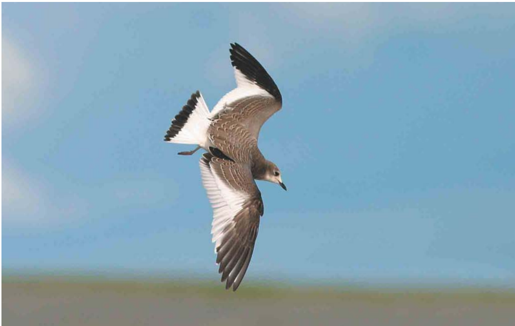
588 Vorkstaartmeeuw / Sabine's Gull Larus sabini , juveniel, Eemshaven, Groningen, 30 september 2004 (Reint Jakob Schut)