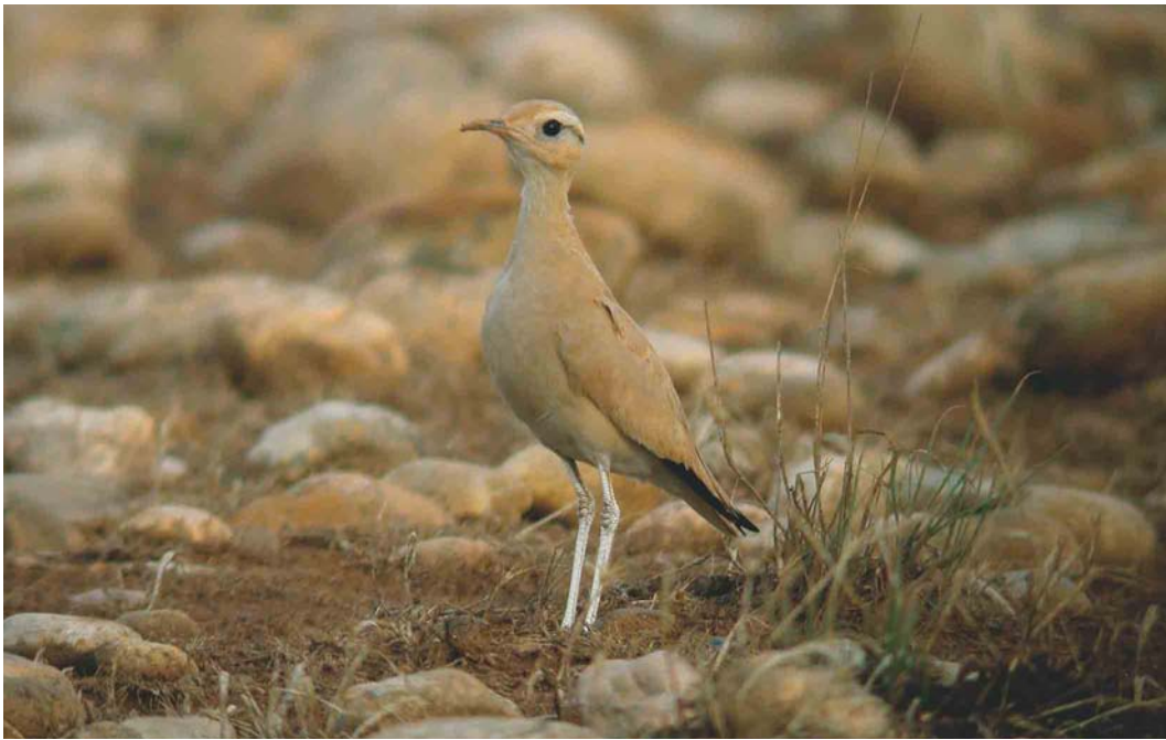
552 Cream-coloured Courser / Renvogel Cursorius cursor , first-year, Crau, Bouches-du-Rhône, France, 12 September 2004 (Marc Thibault)