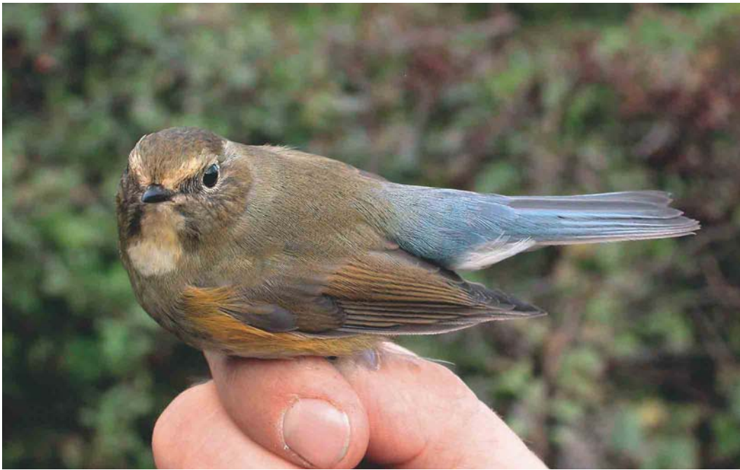
572 Red-flanked Bluetail / Blauwstaart Tarsiger cyanurus , first-year, Hanstholm, Nordjylland, Denmark, 5 October 2004 ( Ole Krogh )