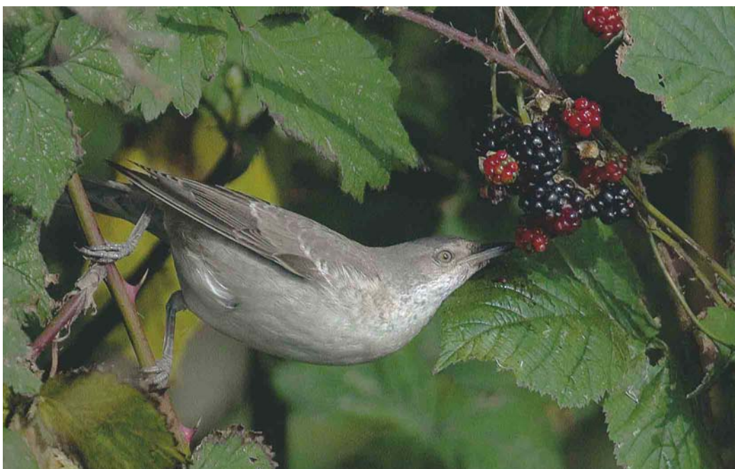
599 Sperwergrasmus / Barred Warbler Sylvia nisoria , eerstejaars, Texel, Noord-Holland, 7 oktober 2004