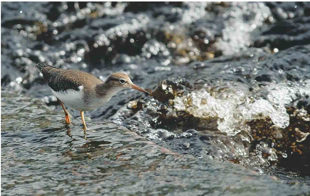
555 Spotted Sandpiper / Amerikaanse Oeverloper Actitis macularius , juvenile, Listowel, Kerry, Ireland, September 2004