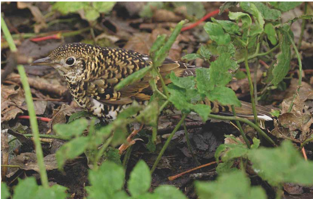
577 White's Thrush / Goudlijster Zosterorhina aurea , Kergord, Mainland, Shetland, Scotland, 6 October 2004