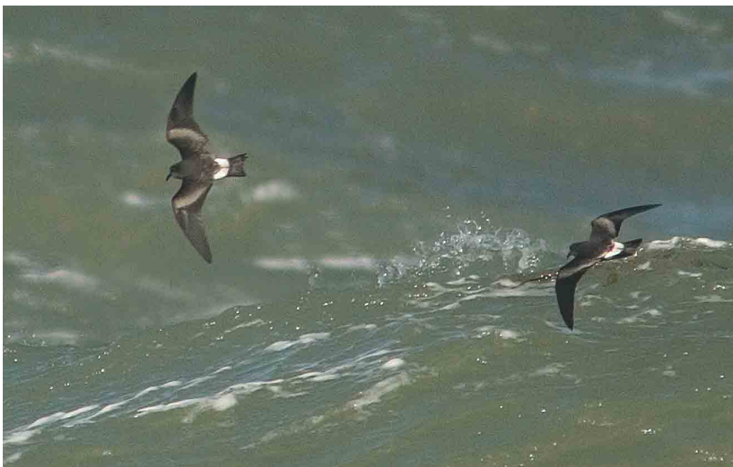
586 Vale Stormvogeltjes / Leach's Storm-petrels Oceanodroma leucorhoa , Westkapelle, Zeeland, september 2004