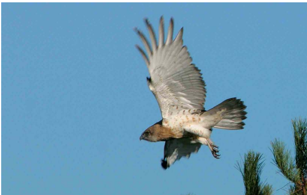
592 Slangenarend / Short-toed Eagle Circaetus gallicus , eerste-kalenderjaar, IJmeerdijk, Almere, Flevoland, 29 oktober 2004 (Karel A Mauer)