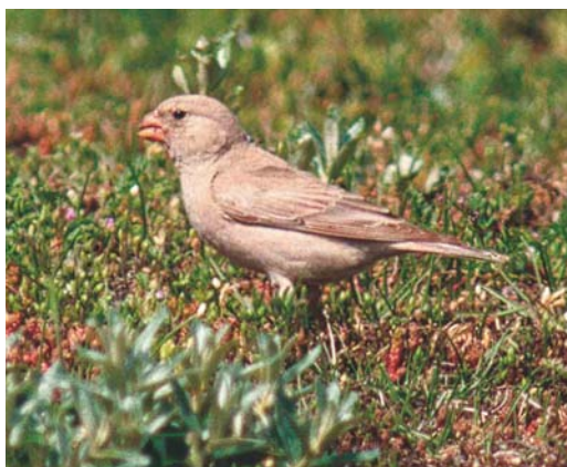
545 Trumpeter Finch / Woestijnvink Bucanetes githagineus , Maasvlakte, Zuid-Holland, 31 May 2003 (Harm Niesen)

The seventh record of this Nearctic passerine. October is the best month, with five records. All records fall between 24 September and 22 October and only one (October 1996) concerns a bird not trapped or found dead.