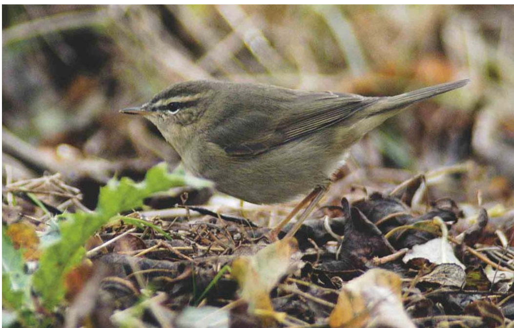
544 Dusky Warbler / Bruine Boszanger Phylloscopus fuscatus , Maasvlakte, Zuid-Holland, 24 October 2003