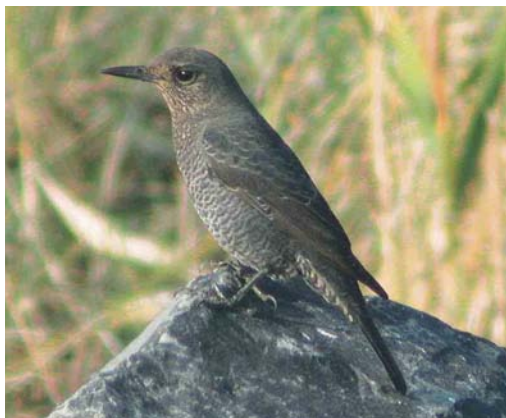
548 Blauwe Rotslijster / Blue Rock Thrush Monticola solitarius , eerstejaars, vermoedelijk mannetje, Westkapelle, Zeeland, 20 september 2003

vele 10-tallen vogelaars om hem verstoringsvrij te kunnen bekijken met de zon in de rug. Binnen een uur na de ontdekking waren ruim 20 lokale vogelaars gearriveerd en in de loop van de middag kwamen in totaal c 200 vogelaars de rotslijster bewonderen. Om 20:05, 20 min na zons- ondergang, werd de vogel voor het laatst gezien voordat hij achter de basalthopen verdween. Na een heldere nacht was hij de volgende ochtend verdwenen (van Gilst 2003).