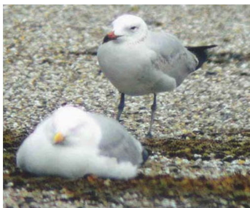
525 Baird's Sandpiper / Bairds Strandloper Calidris bairdii , adult, De Cocksdorp, Texel, Noord-Holland, 8 August 2003 ( Han Zevenhuizen ) 526 Forster's Tern / Forsters Stern Sterna forsteri , first-summer, Colijnsplaat, Zeeland, 18 July 2003 ( Phil Koken ) 527 Pygmy Cormorant / Dwergaalscholver Phalacrocorax pygmeus , adult, Eijsderbeemden, Limburg, 9 March 2003 ( Max Berlijn ) 528 Audouin's Gull / Audouins Meeuw Larus audouinii , second-summer, Neeltje Jans, Zeeland, 1 May 2003 ( Willem van Rijswijk )

graphed (I van der Brugge, J van der Louw et al; Dutch Birding 25: 278, plate 317, 2003). 2002 29-30 April, Laarderheide, Nederweert , Limburg, adult, videoed (T Hoeben, J Sieben, M Berlijn et al).