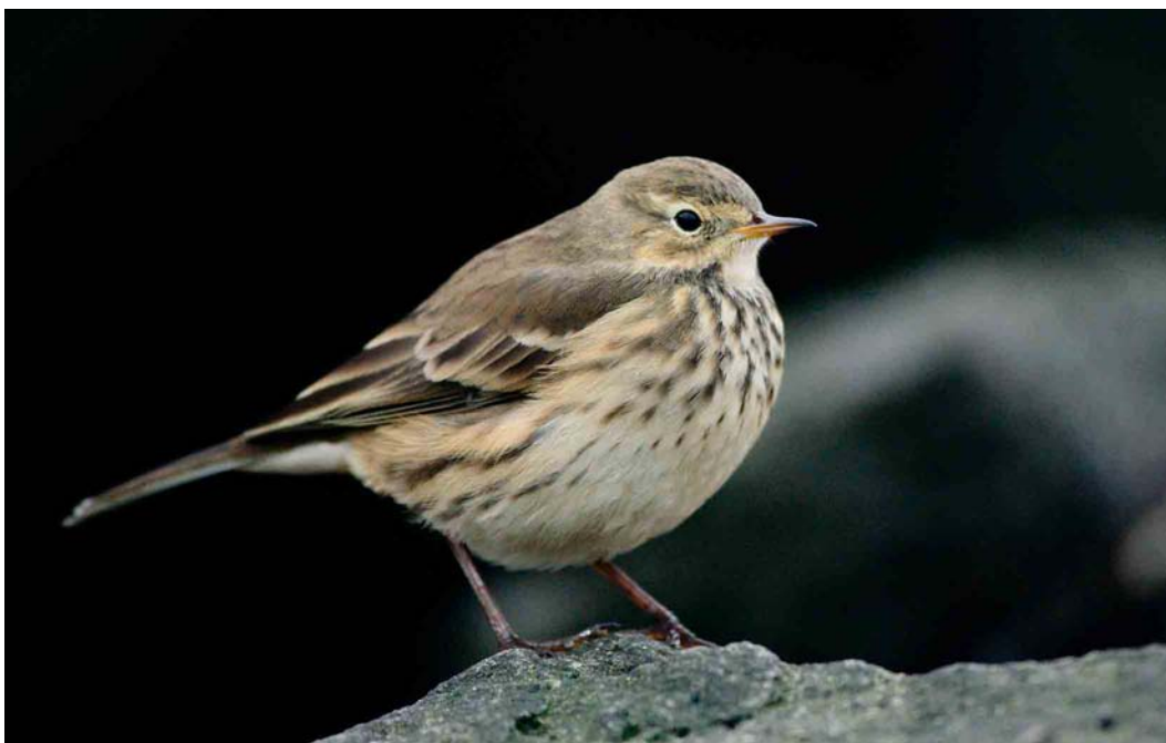
570 Buff-bellied Pipit / Pacifische Waterpieper Anthus rubescens , Garður, Iceland, 7 October 2004