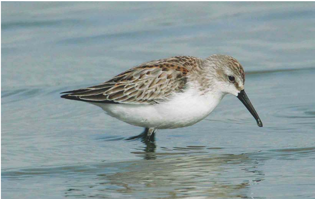
550 Western Sandpiper / Alaskastrandloper Calidris mauri , juvenile, Brownsea Island, Dorset, England, October 2004