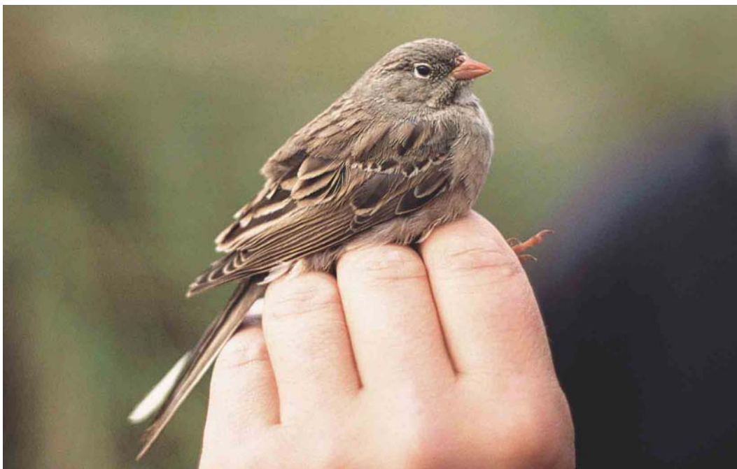
581 Grey-necked Bunting / Steenortolaan Emberiza buchanani , first-winter male, Castricum, Noord-Holland, Netherlands, 16 October 2004