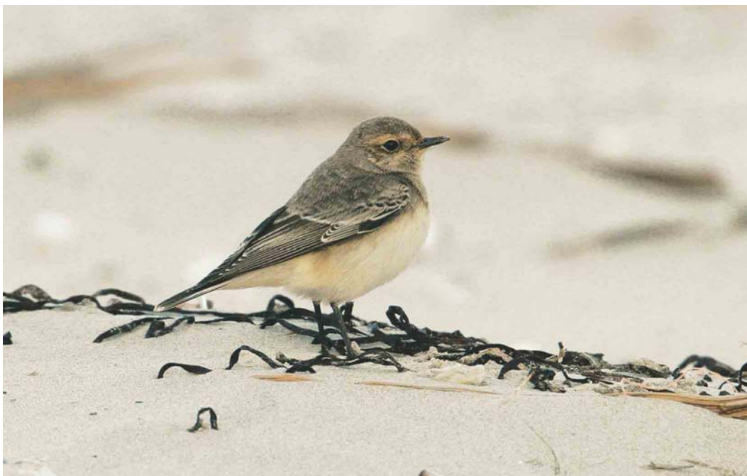
595 Bonte Tapuit / Pied Wheatear Oenanthe pleschanka , paal 22, Terschelling, Friesland, 16 oktober 2004 (Arie Ouwerkerk)