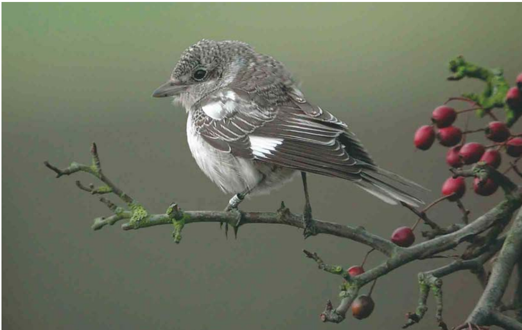
578 Masked Shrike / Maskerklauwier Lanius nubicus , juvenile, Killrenny, Fife, Scotland, 5 November 2004