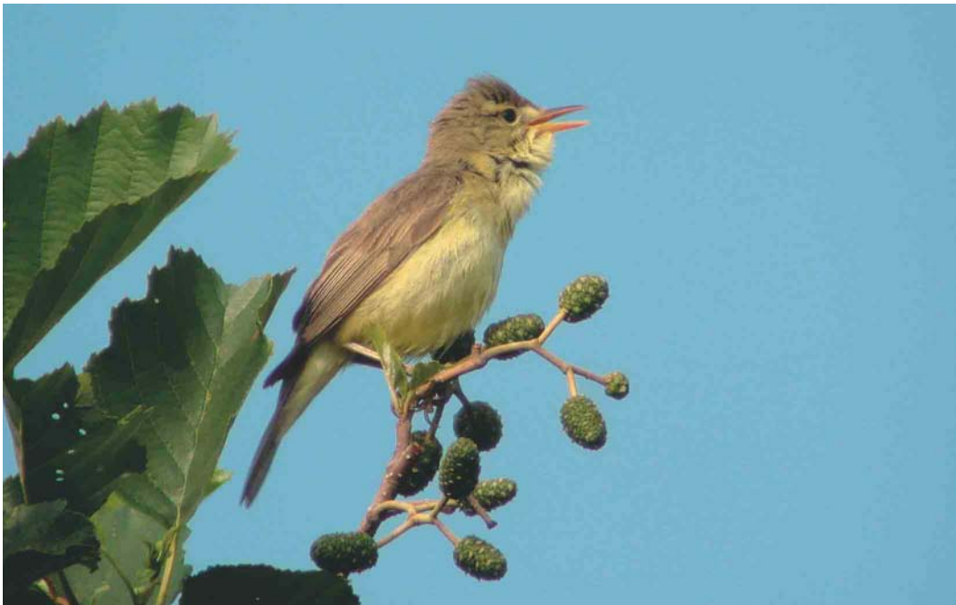
537 Melodious Warbler / Orpheusspotvogel Hippolais polyglotta , Zoetermeer, Zuid-Holland, 16 June 2003