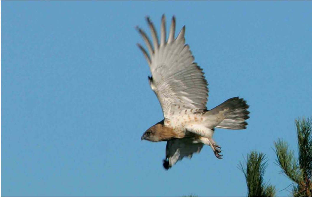
592 Slangenarend / Short-toed Eagle Circaetus gallicus , eerste-kalenderjaar, IJmeerdijk, Almere, Flevoland, 29 oktober 2004 (Karel A Mauer)