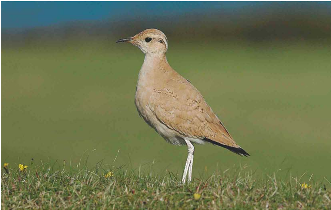
554 Cream-coloured Courser / Renvogel Cursorius cursor , first-winter, St Martin's, Scilly, England, 19 October 2004