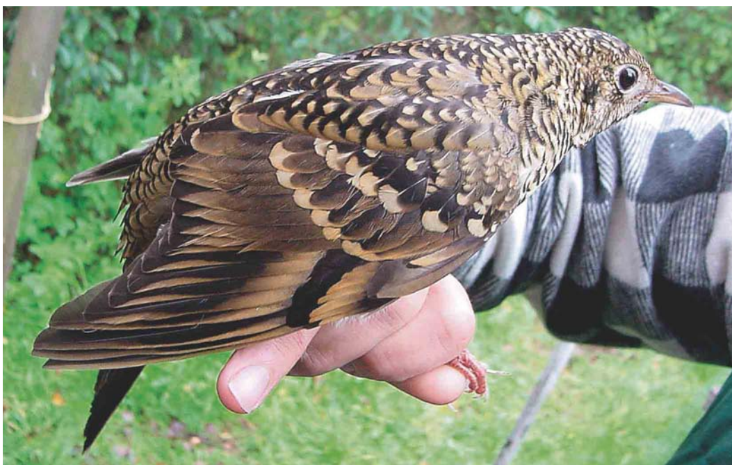
575 White's Thrush / Goudlijster Zoothera aurea , first-year, Schiermonnikoog, Friesland, Netherlands, 4 October 2004