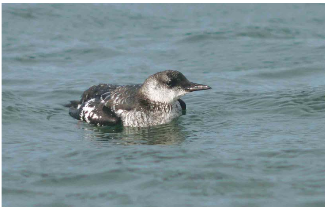
590 Zwarte Zeekoet / Black Guillemot Cephus grylle , eerstejaars, Maasvlakte, Zuid-Holland, 11 september 2004 (Chris van Rijswijk)