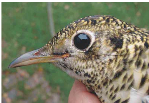
609 Goudlijster / White's Thrush Zoothera aurea , eerstejaars, Groene Glop, Schiermonnikoog, Friesland, 4 oktober 2004

Later diezelfde dag arriveerde Rik Winters rond 11:30 in de Klompenwaard bij Doornenburg, Gelderland, voor een wandeling met het gezin. Na het plasje te hebben aangewezen waar in augustus een Marmereend Marmaronetta angustirostris zwom, liepen ze over de dijk naar het voormalige fort Sterrenschans en werd duidelijk dat het geen rustige wandeling zou worden: groepen Buizerds Buteo buteo kwamen overal omhoog en binnen een half uur stond de teller op 30. Toen begonnen de Gaaien Garrulus glandarius te vliegen; de eerste groep telde ruim 60 vogels, gevolgd door meer groepen van enkele 10-tallen. Al Gaaien tellend kwamen ze rond 12:30 bij het fort. Een Rode Wouw Milvus milvus die vanuit het oosten naderde liet RW los om weer een groep Gaaien te tellen – toen hij bij de derde vogel van de groep was aangekomen verscheen plotseling voor de Gaaien een zwart-wit-zwart gebandeerde ondervleugel in beeld die bleek vast te zitten aan een nogal grote lijsterachtige vogel. Zijn adem stakte: dit kon niet waar zijn! Het moest een witte ondervleugel zijn, want dit was toch zeker een Grote Lijster T. viscivorus !? Weer en weer en weer toonde de vogel de ondervleugel en steeds was het gebandeerde patroon opvallend. Ook de spechtachtige