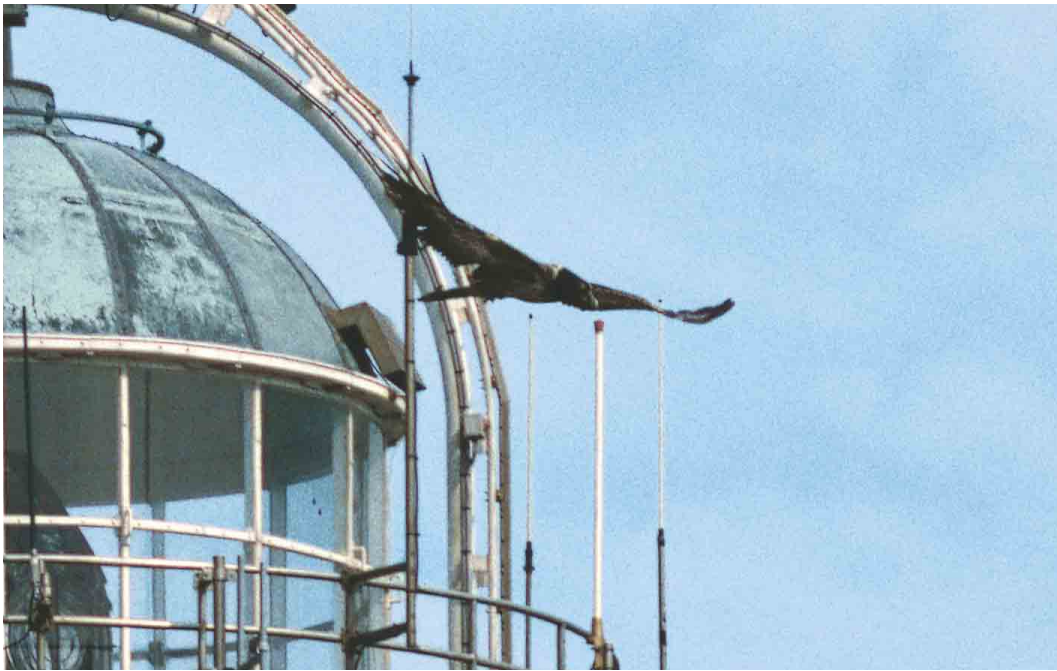
522 Lammergeier / Lammergier Gypaetus barbatus , third calendar-year, Eierlandse Duinen, Texel, Noord-Holland, 3 June 2002 ( Chris van Rijswijk )