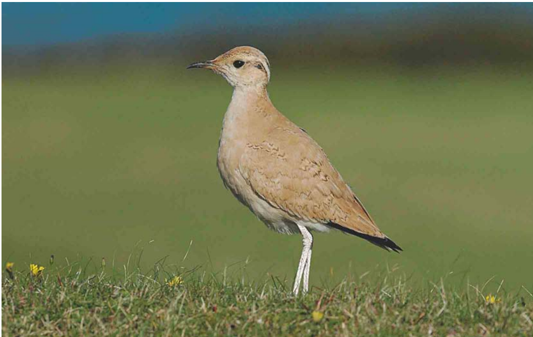
554 Cream-coloured Courser / Renvogel Cursorius cursor , first-winter, St Martin's, Scilly, England, 19 October 2004