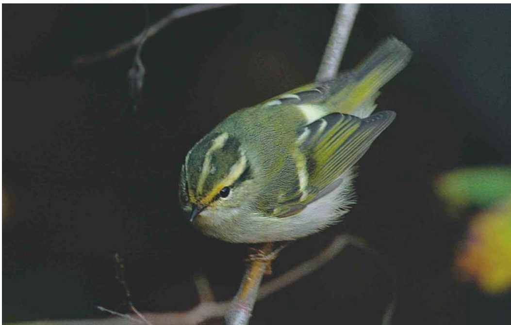
603 Pallas' Boszanger / Pallas's Leaf Warbler Phylloscopus proregulus , Lauwersoog, Groningen, 10 oktober 2004 ( Thor Veen )