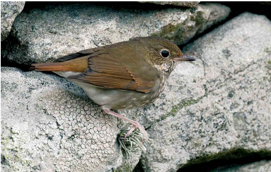
571 Rufous-tailed Robin / Snornachtegaal Luscinia sibilans , first-year, Fair Isle, Shetland, Scotland, 23 October 2004