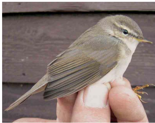
562 Blyth's Reed Warbler / Struikrietzanger Acrocephalus dumetorum , Canal Vell, Ebro delta, Tarragona, Spain, 22 October 2004 563 Eastern Orphee Warbler / Oostelijke Orpheusgrasmus Sylvia crassirostris , first-year male, Sula, Sør-Trøndelag, Norway, 3 October 2004 564 Brown Shrike / Bruine Klauwier Lanius cristatus , Ile de Noirmoutier, Vendée, France, 5 November 2004 565 Pallas's Grasshopper Warbler / Siberische Sprinkhaanzanger Locustella certhiola , first-year, Utsira, Norway, 30 September 2004 566 Dusky Warbler / Bruine Boszanger Phylloscopus fuscatus , Björns fyr, Uppland, Sweden, 2 October 2004. This bird was retrapped on Vlieland, Friesland, the Netherlands, on 12 October. 567 Dusky Warbler / Bruine Boszanger Phylloscopus fuscatus , Kroonspolders, Vlieland, Friesland, Netherlands, 12 October 2004. Same bird as in plate 566!