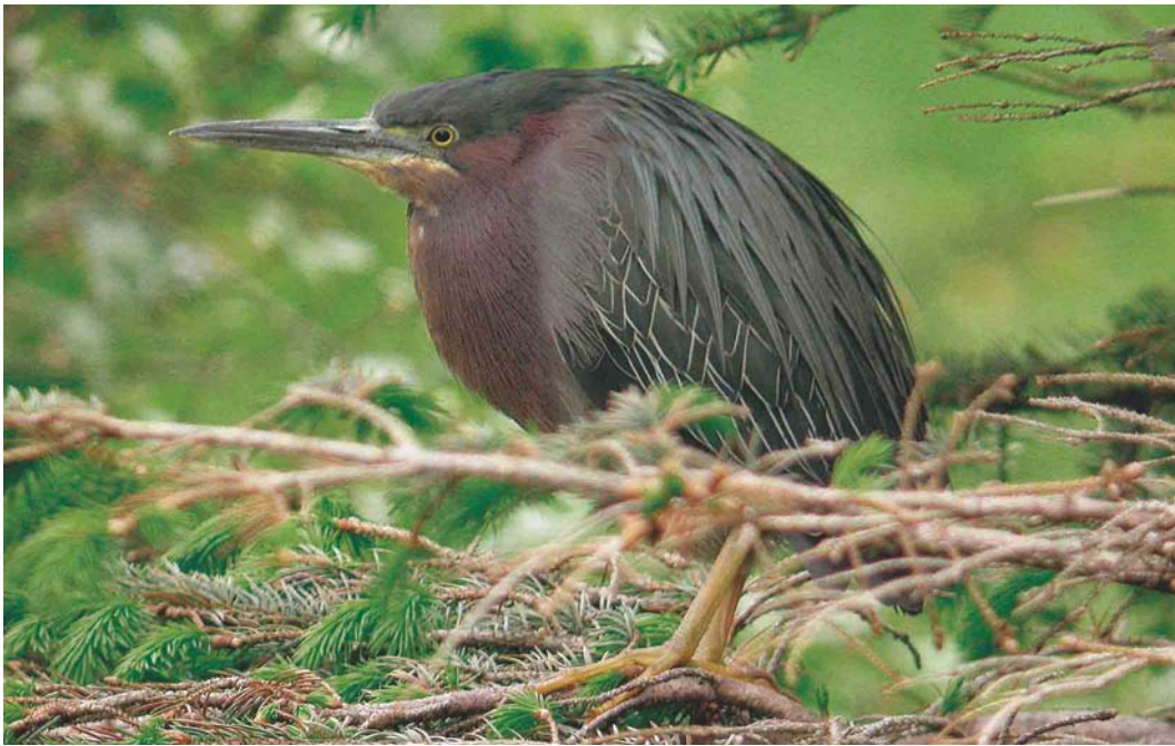
467 Green Heron / Groene Reiger Butorides virescens , Hali, Suðursveit, Iceland, 3 June 2004 (Yann Kolbeinnsson)