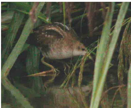
509 Klein Waterhoen / Little Crane Porzana parva , Hologne, Liège, 27 augustus 2004 (Vincent Legrand)