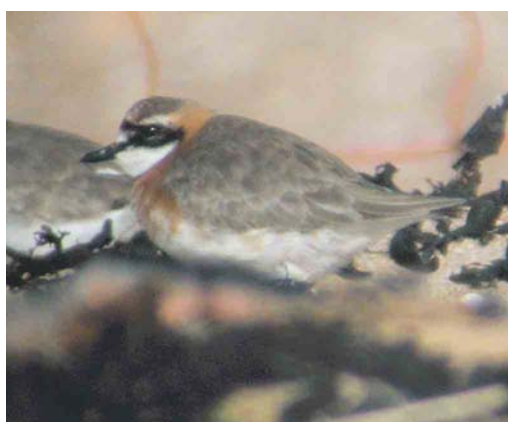
478 Masked Booby / Maskergent Sula dactylatra , adult, Rishon Letzion, Israel, 16 July 2004 479 Pallas's Gull / Reuzenzwartkopmeeuw Larus ichthyaetus , second-winter, Bugaj fish ponds, Zator, Poland, 16 September 2004 480-481 Great Knot / Grote Kanoet Calidris tenuirostris , adult, Skipool Creek, Lancashire, England, 16 August 2004 482 Greater Sand Plover / Woestijnplevier Charadrius leschenaultii , Battenoord, Zuid-Holland, Netherlands, 16 September 2004 483 Lesser Sand Plover / Mongoolse Plevier Charadrius mongolus , Aberlady Bay, Lothian, Scotland, 8 July 2004