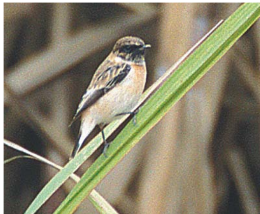
432 Breeding site of Brown Fish Owl Ketupa zeylonensis , Gaz, south of Sirik, Hormozgan, Iran, 18 January 2004 (Rob Felix). The nest cavity is the black spot right below the tree just left of the centre. 433 Black-winged Kite / Grijze Wouw Elanus caeruleus , juvenile, Karun fish ponds, Khuzestan, Iran, 22 January 2004 (Harvey van Diek) 434 Mesopotamian Crow / Mesopotaamse Kraai Corvus cornix capellanus , near Hoveyzeh, Khuzestan, Iran, 19 January 2004 (Harvey van Diek) 435 Caspian Stonechat / Kaspische Roodborsttapuit Saxicola maurus variegatus , Amir Kabir sugar cane farm, Ahvaz, Khuzestan, Iran, 15 January 2004 (Harvey van Diek)