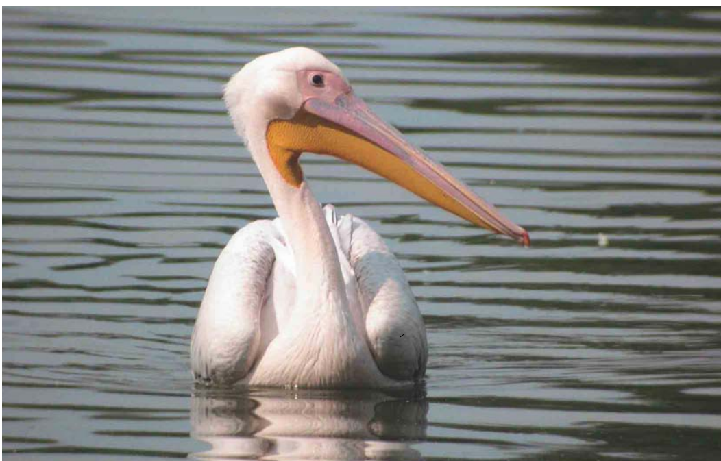
468 Great White Pelican / Roze Pelikaan Pelecanus onocrotalus , Raszyn fish ponds, Warszawa, Poland, 6 August 2004