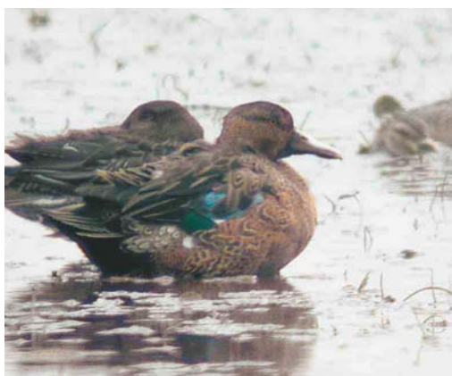
439 Trumpeter Swan / Trompetzwaan Cygnus buccinator , adult, Sophiapolder, Zeeland, 27 June 2004 (Pieter Dhaluin) 440 Emperor Goose / Keizergans Anser canagicus and Barnacle Geese / Brandganzen Branta leucopsis , Den Bommel, Zuid-Holland, 6 February 1999 (Arnoud B van den Berg) 441 Cinnamon Teal / Kaneeltaling Anas cyanoptera , first-year male, De Bijland, Gelderland, 19 October 2002 (Rik Winters) 442 Cinnamon Teal / Kaneeltaling Anas cyanoptera , second-year male, De Bijland, Gelderland, 28 September 2003 (Rik Winters). Probably the same bird as in plate 441.

18-19 October 2002, De Bijland, Rijnwaarden , Gelderland, juvenile or first-winter male, unringed, photographed (A Poelmans, R Winters et al).