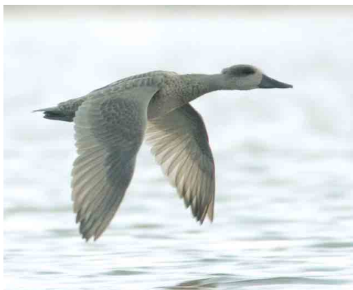
512-513 Marmereend / Marbled Duck Marmaronetta angustirostris , juveniel, Pannerden, Gelderland, 15 augustus 2004 (Patrick Palmen)

De eend was inmiddels gaan slapen, waardoor het wachten op versterking lang leek te duren. Pas tegen 16:00 arriveerden de eerste vogelaars. Rond 16:15 zagen c 10 man hoe de vogel – waarschijnlijk door verstoring – opvloog en achter de dijk van het Pannerdensch Kanaal verdween, pas later gevolgd door de andere eenden in de plas. Zoeken in de omgeving leverde in eerste instantie niets op. Inmiddels was RK gearriveerd en samen met Erik Ernens en Reinoud Vermoolen ging ook hij zoeken, niet in de Lobber-