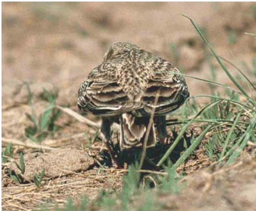
Mystery photograph IX (May)

web. Using these characters, the mystery bird can be safely identified as a Red-throated Pipit.