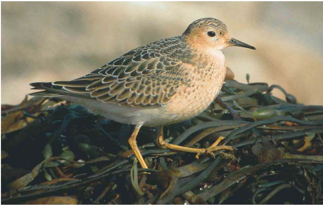
471 Buff-breasted Sandpiper / Blonde Rويتر Tryngites subruficollis , juvenile, Sein, Finistère, France, 13 September 2004