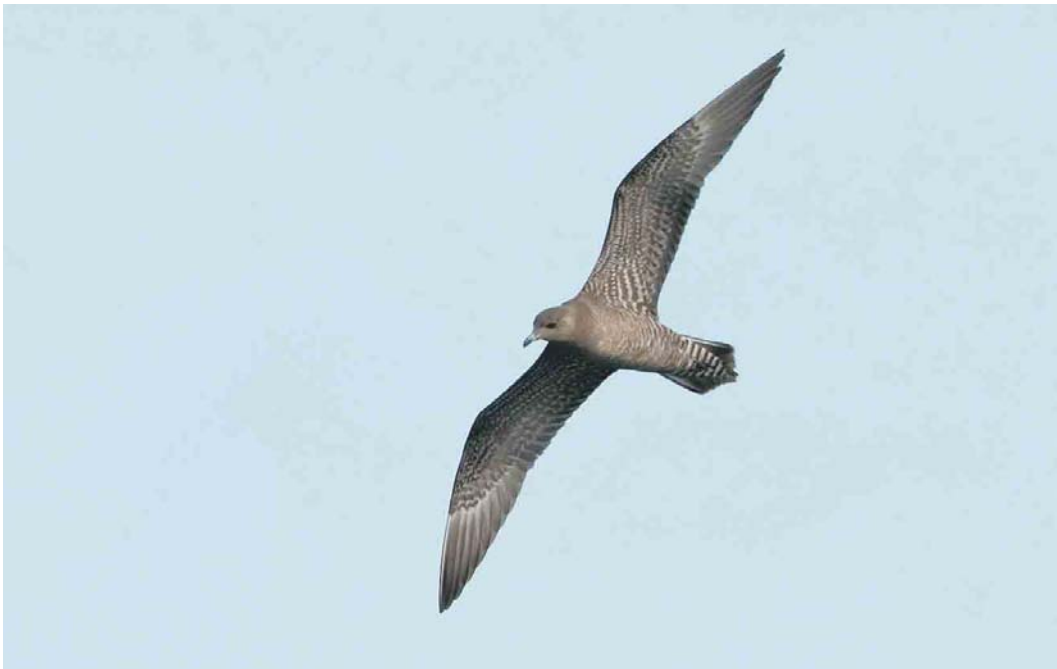
497 Kleinste Jager / Long-tailed Jaeger Stercorarius longicaudus , juveniel, Budel-Dorplein, Noord-Brabant, 21 augustus 2004 ( Ran Schols )