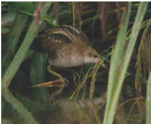
509 Klein Waterhoen / Little Crane Porzana parva , Hologne, Liège, 27 augustus 2004 (Vincent Legrand)