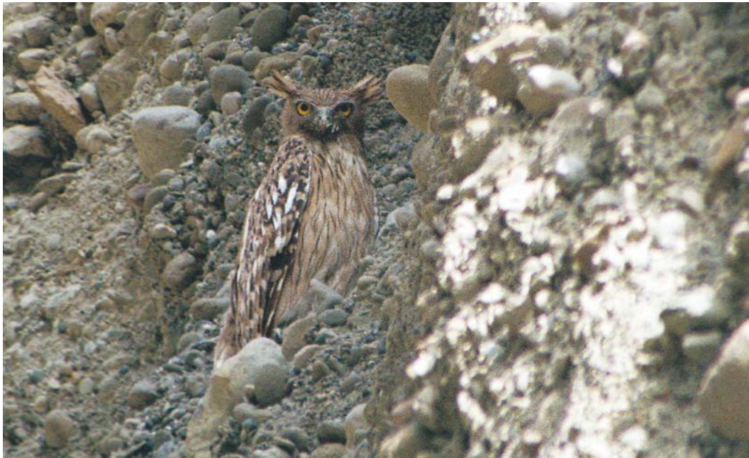
431 Brown Fish Owl / Bruine Visuil Ketupa zeylonensis , Gaz, south of Sirik, Hormozgan, Iran, 8 April 2004 (Babak Musavi)

After three weeks, we had seen many birds and counted most of them. The search for Slender-billed Curlew failed but more surveys are needed to make sure whether the species still exists. In addition, waterbird counts are paramount in the next years since Iran is very important for wintering waders and ducks.