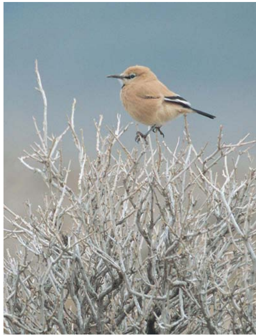
426 Goliath Heron / Reuzenreiger Ardea goliath , Khalasi, Hormozgan, Iran, 20 January 2004 427 Pleske's Ground Jay / Perzische Steppegaai Podocees pleskei , Touran, Semnan, Iran, 27 January 2004 428 Pleske's Ground Jay / Perzische Steppegaai Podocees pleskei , Touran, Semnan, Iran, 27 January 2004