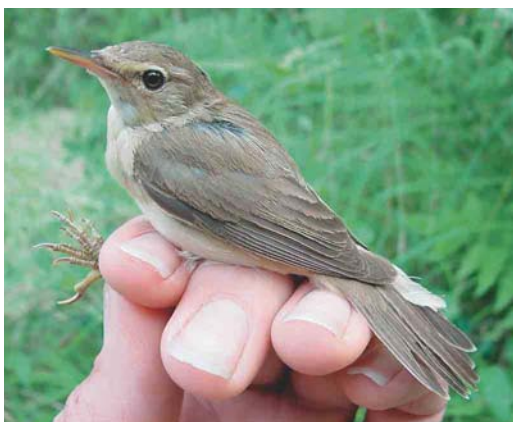
507 Struikrietzanger / Blyth's Reed Warbler Acrocephalus dumetorum , Groene Glop, Schiermonnikoog, Friesland, 29 juli 2004

men op 18 en van 29 tot 31 augustus bij Stellendam, op 23 augustus in het Zwanenwater, Noord-Holland, en op 29 augustus bij Cadzand-Bad, Zeeland. De vogel van het Zwanenwater was daar naar verluidt al vanaf april aanwezig. Er waren Graszangers Cisticola juncidis aanwezig op 7 en 21 juli en 3 en 28 augustus bij Westkapelle, op 16 juli – maar vermoedelijk de hele periode – in het Verdronken Land van Saeftinge, vanaf 18 juli één en in augustus minstens vier op het schor bij Hoofdplaat en het Paulinaschor, Zeeland, op 24 juli in de Lauwersmeer, en op 4 en 11 augustus bij Westenschouwen, Zeeland. De drie Orpheusspottvogels Hippolais polyglotta bleven tot 4 juli bij De Weerribben, Overijssel, en bij Terziet, Limburg, en tot 5 juli bij Ter Apel, Groningen. Op 29 juli werd een Struikrietzanger Acrocephalus dumetorum geringd op Schiermonnikoog. Vanaf die datum werden c 40 Waterrietzangers A. paludicola vastgesteld waarvan er 18 werden gevangen en geringd; de hotspot wat betreft vangsten was het Verdronken Land van Saeftinge. De Bakkersdam bij Petten, Noord-Holland, en het Kennemermeer waren de plaatsen waar er meerdere werden gezien, met dagmaxima van drie. Sperwergrasmussen Sylvia nisoria werden vastgesteld op 2 augustus (vangst) te Westenschouwen, op 9 augustus (vangst) op Schiermonnikoog, op 11 augustus (vangst) in De Kennemerduinen, Noord-Holland, op 14, 15 en 16 augustus bij Westkapelle, op 15 augustus op Texel, op