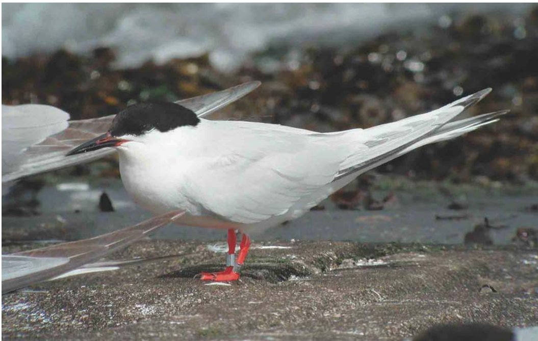
490 Dougalls Stern / Roseate Tern Sterna dougallii , adult, Neeltje Jans, Zeeland, 13 augustus 2004