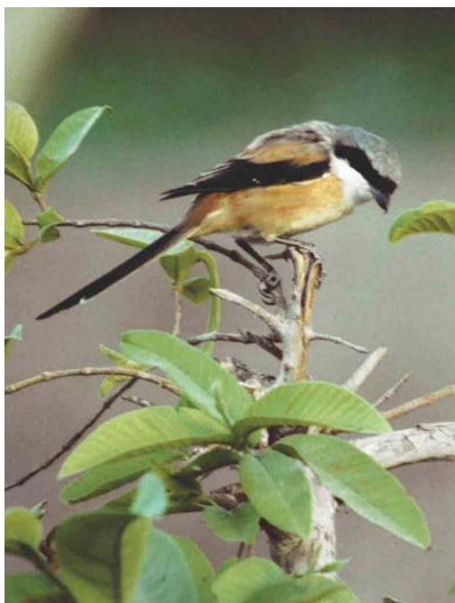
475 Long-legged Buzzard / Arendbuizerd Buteo rufinus , Espoo, Finland, 2 August 2004 ( Sami Tuomela ) 476 Long-tailed Shrike / Langstaartklauwier Lanius schach , adult, Aqaba, Jordan, April 2004 ( Guy Conrady & Edouard Melchior ) cf Dutch Birding 25: 207, 2004 477 Paddyfield Warbler / Veldrietzanger Acrocephalus agricola , Brekka, Lón, Iceland, 18 September 2004 ( Daniel Bergmann )