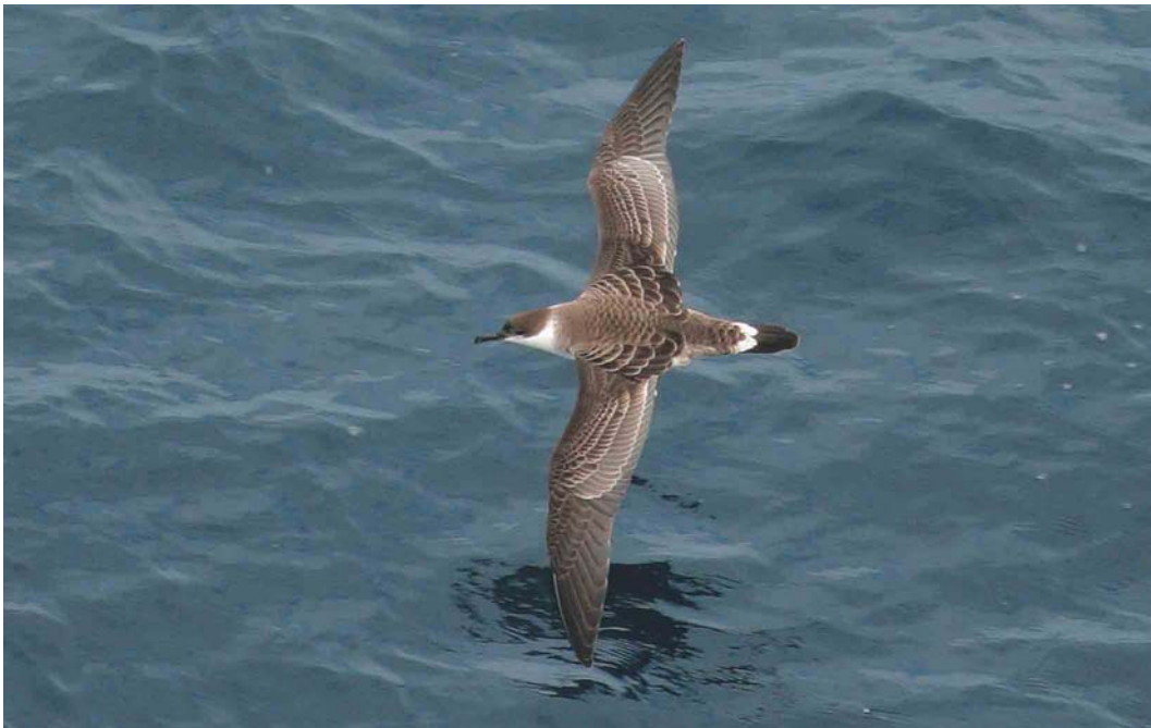
473 Great Shearwater / Grote Pijlstormvogel Puffinus gravis , Bay of Biscay, 10 miles north-west of Bilbao, Spain, 23 August 2004