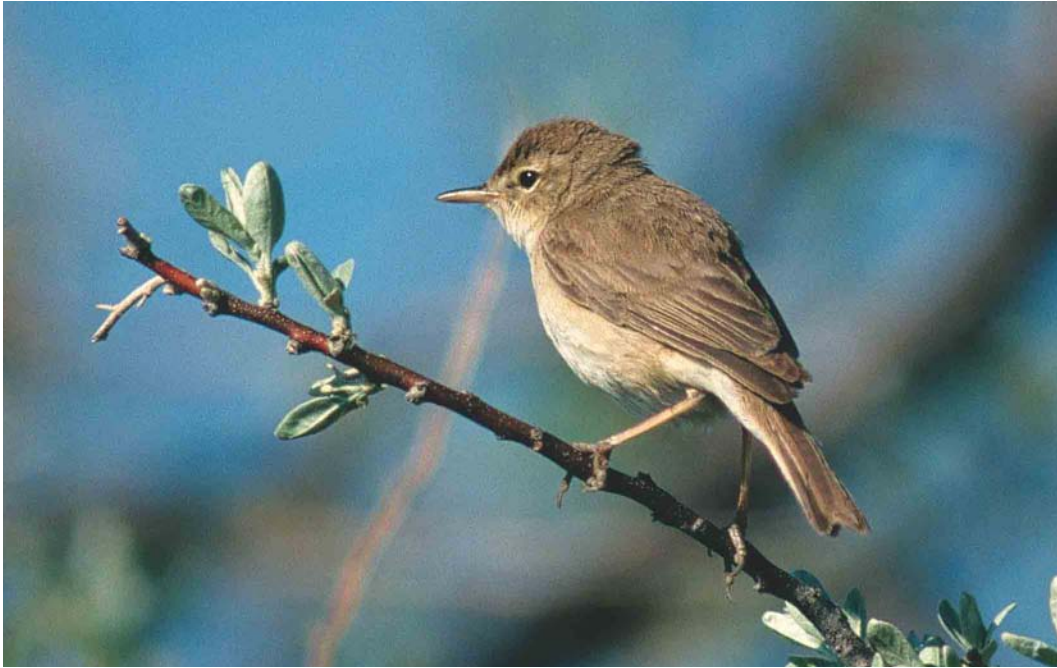
465 Booted Warbler / Kleine Spotvogel Acrocephalus caligatus , Karazhar, Tengiz, Aqmola Oblast, Kazakhstan, 20 May 2003. Note contrasting tertials and rusty-tinged flanks and upperbreast.

Note, however, that the dark crown-sides may be influenced shadow effects and that dark crown-sides can also appear faintly in Sykes's. In addition, in Sykes's, the supercilium is often shorter and ending just behind the rear edge of the eye.