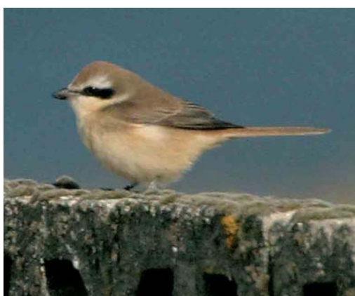
484-485 Purple Martin / Purperzwaluw Progne subis , juvenile, Butt of Lewis, Lewis, Outer Hebrides, Scotland, 6 September 2004 486-487 Purple Martin / Purperzwaluw Progne subis , juvenile, Butt of Lewis, Lewis, Outer Hebrides, Scotland, 6 September 2004 488 White-winged Lark / Witvleugelleeuwerik Melanocorypha leucoptera , female, Vardø, Finnmark, Norway, 19 July 2004 489 Brown Shrike / Bruine Klauwier Lanius cristatus , Skaw, Whalsay, Shetland, 22 September 2004