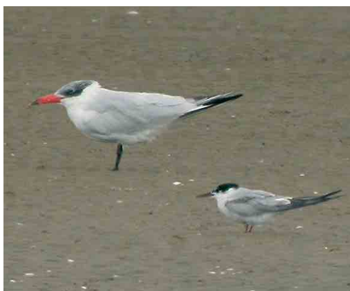
499 Witwangstern / Whiskered Tern Chlidonias hybrida , adult, Budel-Dorplein, Noord-Brabant, 12 augustus 2004 (Rob G Bouwman) 500 Lachstern / Gull-billed Tern Gelocheilidon nilotica , Schagerbrug, Noord-Holland, 17 augustus 2004 (Harm Niesen) 501 Ringsnavelmeeuw / Ring-billed Gull Larus delawarensis , adult, Goes, Zeeland, 23 augustus 2004 (Harm Niesen) 502 Reuzenster / Caspian Tern Sterna caspia , met Visdief / Common Tern S hirundo , Stellendam, Zuid-Holland, 30 augustus 2004 (Rudi Dujardin)

slag, op 7 augustus op het Kennemermeer bij IJmuiden, op 22 en 26 augustus bij de Bokkedoorns en op 31 augustus langs de Maasvlakte. De eerste Lachstern Gelocheilidon nilotica werd vanaf 6 juli gezien in de polders bij 't Zand, Noord-Holland. Hier waren regelmatig exemplaren aanwezig, met van 15 tot 22 augustus een maximum van 13 vogels. Vanaf 17 juli werden elders in het land 18 langsvliegende en 10 ter plaatse gezien. Aan de Friese IJsselmeerkust pleisterden vanaf 4 juli meerdere Reuzenster Sterna caspia waarvan het aantal in de loop van augustus toenam tot maximaal c 75 (verspreid over de locaties Makkum, Piaam, Workumerwaard en Steile Bank). Het hoogste aantal op één plek was 71 op 21 augustus in de Makkumerzuidwaard. Andere pleisterplaatsen (met maxima in augustus) waren: 13 in het Lauwersmeergebied, eveneens 13 in het gebied Drontermeer-Vossemeer, Flevo-