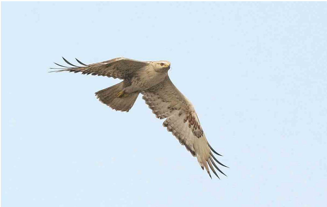
469 Long-legged Buzzard / Arendbuizerd Buteo rufinus , Espoo, Finland, 8 July 2004, 21 July 2004