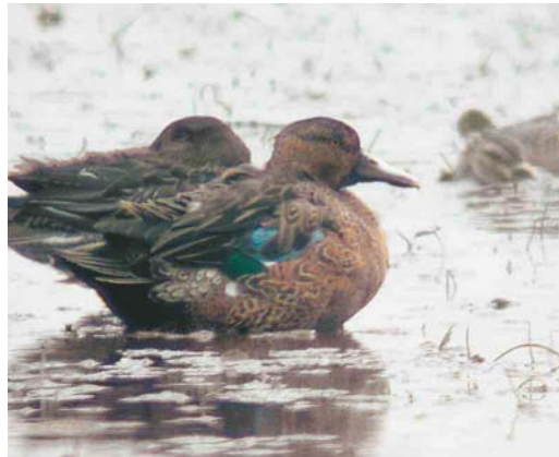
439 Trumpeter Swan / Trompetzwaan Cygnus buccinator , adult, Sophiapolder, Zeeland, 27 June 2004 (Pieter Dhaluin) 440 Emperor Goose / Keizergans Anser canagicus and Barnacle Geese / Brandganzen Branta leucopsis , Den Bommel, Zuid-Holland, 6 February 1999 (Arnoud B van den Berg) 441 Cinnamon Teal / Kaneeltaling Anas cyanoptera , first-year male, De Bijland, Gelderland, 19 October 2002 (Rik Winters) 442 Cinnamon Teal / Kaneeltaling Anas cyanoptera , second-year male, De Bijland, Gelderland, 28 September 2003 (Rik Winters). Probably the same bird as in plate 441.

18-19 October 2002, De Bijland, Rijnwaarden , Gelderland, juvenile or first-winter male, unringed, photographed (A Poelmans, R Winters et al).