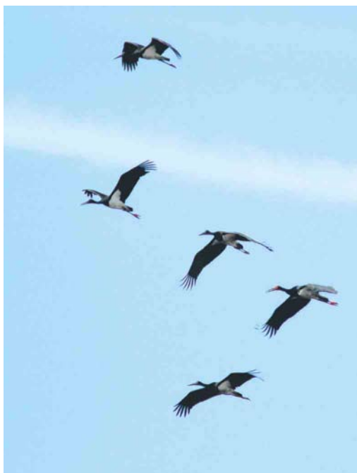
493 Woudaap / Little Bittern Ixobrychus minutus , adult mannetje, Zevenhuizen, Zuid-Holland, 30 augustus 2004 494 Zwarte Ooievaars / Black Storks Ciconia nigra , Strabrechtse Heide, Noord-Brabant, 9 september 2004 495 Zwarte Ooievaar / Black Stork Ciconia nigra , juveniel, Larserweg, Flevoland, 6 september 2004 496 Griel / Stone-curlew Burhinus oedicanus , Westkapelle, Zeeland, 7 juli 2004