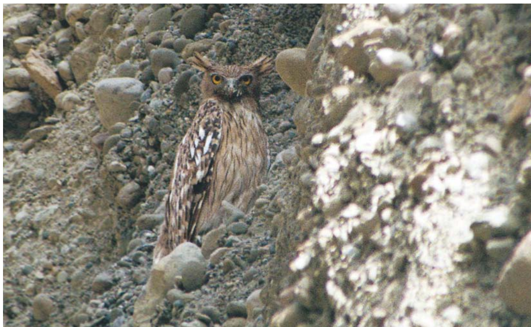
431 Brown Fish Owl / Bruine Visuil Ketupa zeylonensis , Gaz, south of Sirik, Hormozgan, Iran, 8 April 2004

After three weeks, we had seen many birds and counted most of them. The search for Slender-billed Curlew failed but more surveys are needed to make sure whether the species still exists. In addition, waterbird counts are paramount in the next years since Iran is very important for wintering waders and ducks.