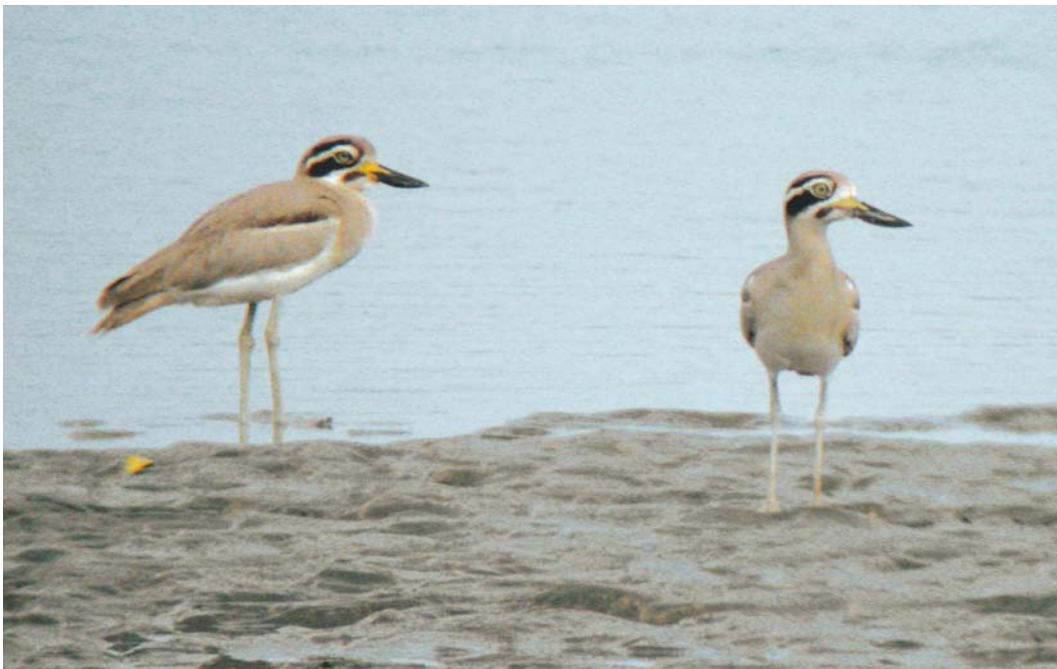
424 Great Thick-knees / Grote Grielen Esacus recurvirostris , Rud-e-Shur, Hormozgan, Iran, 14 January 2004 (Rob Felix)