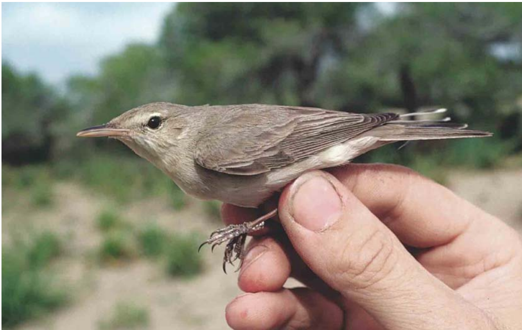
463 Eastern Olivaceous Warbler / Oostelijke Vale Spotvogel Acrocephalus pallidus elaeicus , Adana, Turkey, 23 April 1987 ( Arnoud B van den Berg ). Note greyish upperparts, slightly down-curved bill-tip, long primary projection, whitish tip to folded secondaries and hint of pale wing-panel. 464 Booted Warbler / Kleine Spotvogel Acrocephalus caligatus , first-winter, Kyzylkol, Kazakhstan, September 2003 ( Arend Wassink ). Note contrasting tertials with dark shaft and short bill with fine tip and dark spot on tip of lower mandible.