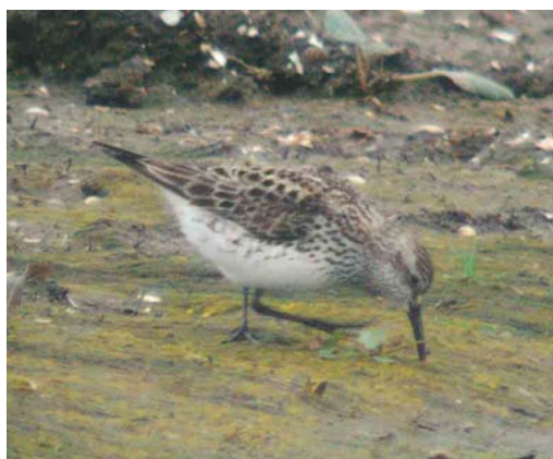
503 Zwarte Wouw / Black Kite Milvus migrans , Kennemermeer, IJmuiden, Noord-Holland, 10 augustus 2004 504 Ortolaan / Ortolan Bunting Emberiza hortulana , Zuidpier, IJmuiden, Noord-Holland, 18 augustus 2004 505 Breedbekstrandloper / Broad-billed Sandpiper Limicola falcinellus , adult, IJdoorn, Noord-Holland, 12 juli 2004 506 Bonapartes Strandloper / White-rumped Sandpiper Caldidris fuscicollis , Ezumakeeg, Friesland, 12 juli 2004

en voornamelijk in het IJsselmeergebied. Pleisterplaatsen (met maxima in augustus) waren bijvoorbeeld 13 bij Delfzijl, Groningen, zes in de Workumerwaard, vier op de Steile Bank en vier bij Den Oever. Op 29 juli vloog een Zwarte Zeekoet Cephus grylle langs Camperduin.