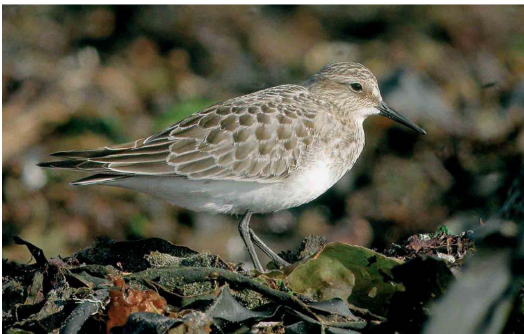
472 Baird's Sandpiper / Bairds Strandloper Calidris bairdii , juvenile, Sein, Finistère, France, 14 September 2004 (Aurélien Audevard)