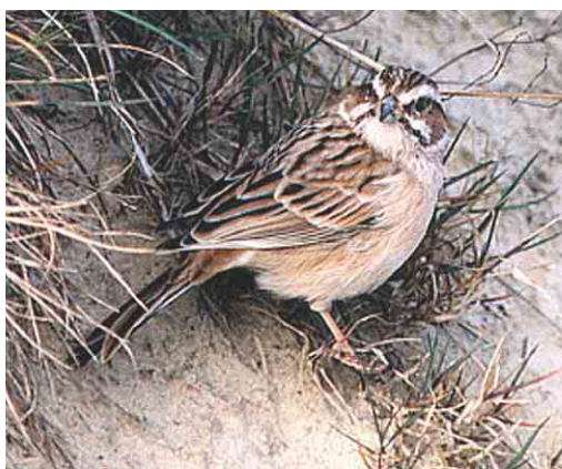
453 Purple-backed Starling / Daurische Spreeuw Sturnus sturninus , Duiven, Gelderland, 5 November 1999 454 Zijdespreeuw / Red-billed Starling Sturnus sericeus , Rottumerplaat, Groningen, August 2004 455 Long-tailed Rosefinch / Langstaartroodmus Uragus sibiricus , first-winter male, Hoek van Holland, Zuid-Holland, 31 October 1999 456 Meadow Bunting / Weidegors Emberiza cioides , Castenray, Limburg, 16 April 2000

third British records, also placed in Category D1, concern males at Ponteland, Northumberland, England, from 26 August to 5 September 1997 and at Durness, Highland, Scotland, on 24- 27 September 1998.