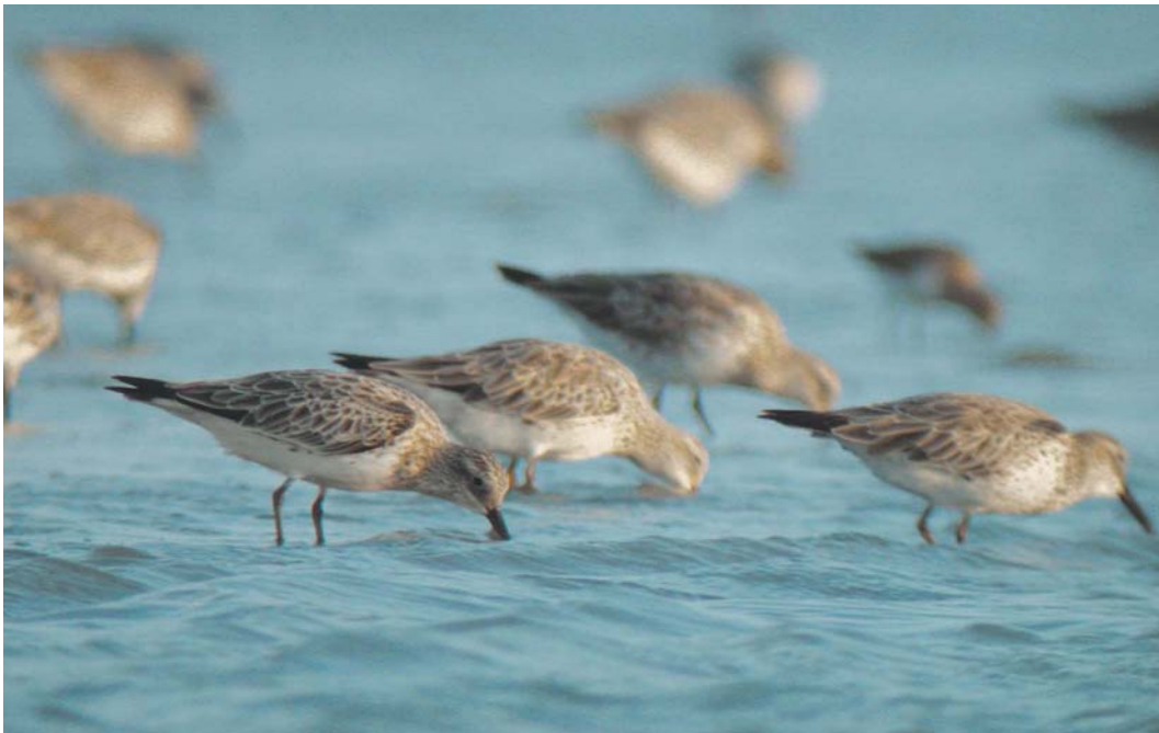
423 Great Knots / Grote Kanoeten Calidris tenuirostris , Tiab, Hormozgan, Iran, 15 January 2004