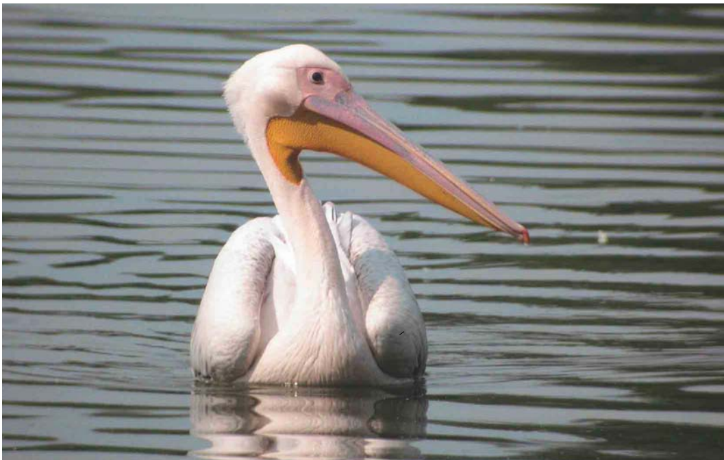
468 Great White Pelican / Roze Pelikaan Pelecanus onocrotalus , Raszyn fish ponds, Warszawa, Poland, 6 August 2004