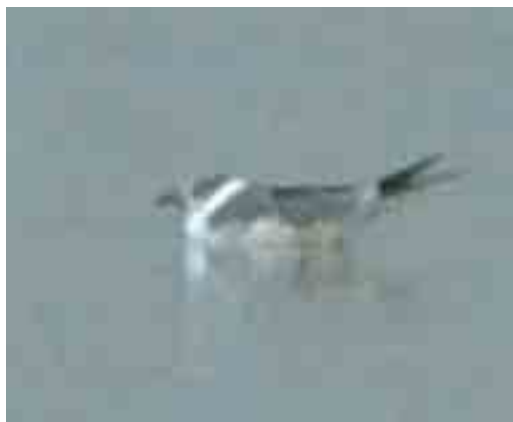
437 Lachmeeuw / Laughing Gull Larus atricilla , adult, Arnhem, Gelderland, 16 augustus 2000

Duitsland, c 1 km over de grens bij Groenlo, Gelderland. De vogel werd op 1 juni 2001 gevangen en geringd (rechts: witte PVC-ring (tarsus) en aluminiumring (tibia)). De Lachmeeuw gedroeg zich zeer vocaal en territoriaal. Regelmatig werd de zogeheten 'long-call' waargenomen waarbij hij de vleugels enigszins liet afhangen, de kop omhoog gooide en een luid, lachend geluid voortbracht. De aanwezige Kokmeeuwen leken hierop niet te reageren (pers obs). Op grond van zijn gedrag werd vastgesteld dat het om een mannetje ging. Enige aanwijzingen voor een (gemengd) broedgeval zijn niet gevonden. Wel had de Lachmeeuw in juni een nest gemaakt of bezet en werd gezien dat hij een pas uitgekomen Kokmeeuw naar het nest sleepte om het dier vervolgens te verorberen. Ook de overblijfselen van Kokmeeuwenkuikens die na het vertrek van de vogel in het nest werden aangetroffen waren waarschijnlijk van dergelijke maaltijden afkomstig. De Lachmeeuw was hier aanwezig tot ten minste 3 juli 2001 (Andreas Buchheim in litt).