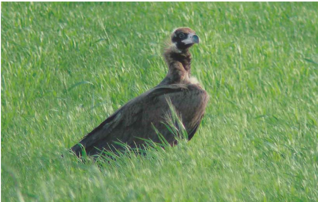
470 Eurasian Black Vulture / Monniksgier Aegypius monachus , Lancenieki, Tukums, Latvia, 16 June 2004 (Karlis Millers)