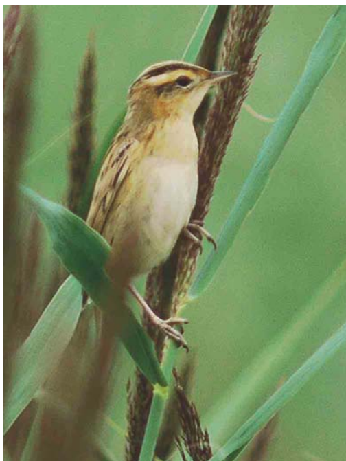
508 Waterrietzanger / Aquatic Warbler Acrocephalus paludicola , Bakkersdam, Petten, Noord-Holland, 7 augustus 2004

men op 18 en van 29 tot 31 augustus bij Stellendam, op 23 augustus in het Zwanenwater, Noord-Holland, en op 29 augustus bij Cadzand-Bad, Zeeland. De vogel van het Zwanenwater was daar naar verluidt al vanaf april aanwezig. Er waren Graszangers Cisticola juncidis aanwezig op 7 en 21 juli en 3 en 28 augustus bij Westkapelle, op 16 juli – maar vermoedelijk de hele periode – in het Verdronken Land van Saeftinge, vanaf 18 juli één en in augustus minstens vier op het schor bij Hoofdplaat en het Paulinaschor, Zeeland, op 24 juli in de Lauwersmeer, en op 4 en 11 augustus bij Westenschouwen, Zeeland. De drie Orpheusspottvogels Hippolais polyglotta bleven tot 4 juli bij De Weerribben, Overijssel, en bij Terziet, Limburg, en tot 5 juli bij Ter Apel, Groningen. Op 29 juli werd een Struikrietzanger Acrocephalus dumetorum geringd op Schiermonnikoog. Vanaf die datum werden c 40 Waterrietzangers A. paludicola vastgesteld waarvan er 18 werden gevangen en geringd; de hotspot wat betreft vangsten was het Verdronken Land van Saeftinge. De Bakkersdam bij Petten, Noord-Holland, en het Kennemermeer waren de plaatsen waar er meerdere werden gezien, met dagmaxima van drie. Sperwergrasmussen Sylvia nisoria werden vastgesteld op 2 augustus (vangst) te Westenschouwen, op 9 augustus (vangst) op Schiermonnikoog, op 11 augustus (vangst) in De Kennemerduinen, Noord-Holland, op 14, 15 en 16 augustus bij Westkapelle, op 15 augustus op Texel, op