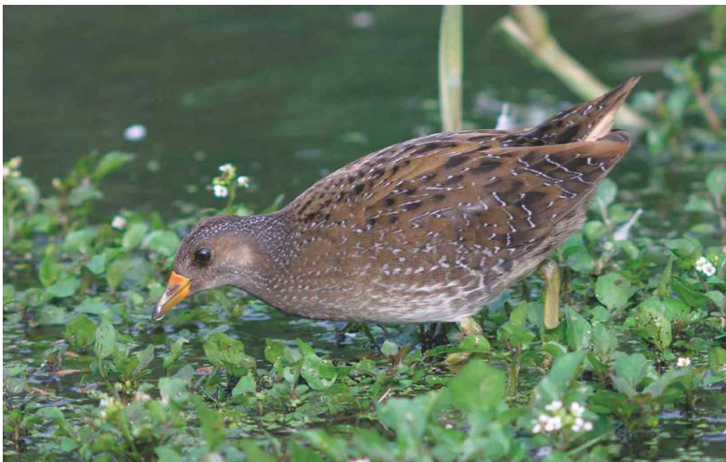
492 Porseleinhoen / Spotted Crake Porzana porzana , Starrevaart, Leidschendam, Zuid-Holland, 18 augustus 2004 (Chris van Rijswijk)