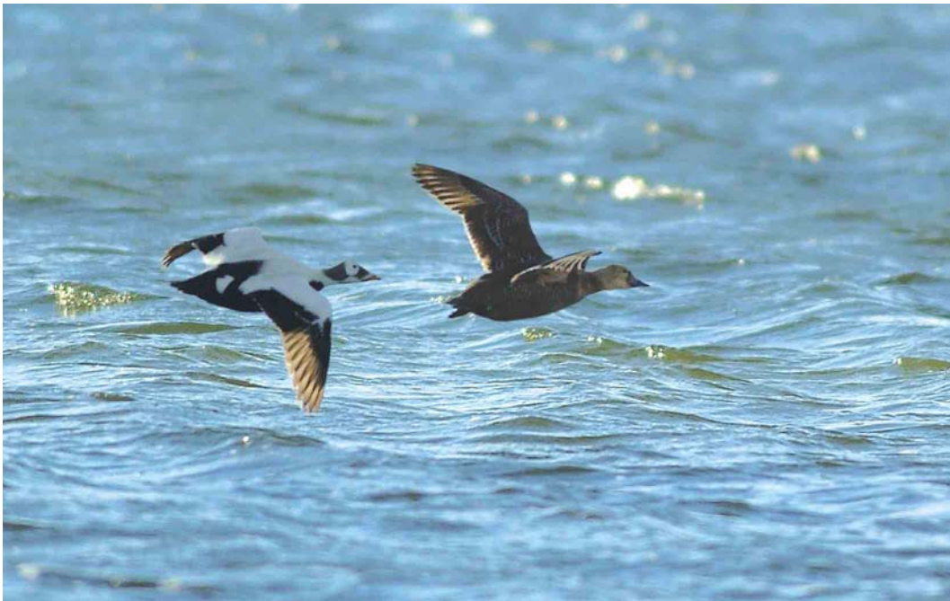
461 Spectacled Eiders / Brileiders Somateria fischeri , pair, Deadhorse, Prudhoe Bay, Alaska, USA, 12 June 2004 (René Pop)