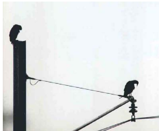
443-444 Turkey Vulture / Roodkopgier Cathartes aura , Ellerhuizen, Groningen, 21 June 2000 ( Theo Bakker/Cursorius ) 445 American Black Vulture / Zwarte Gier Coragyps atratus , Knardijk, Oostvaardersplassen, Flevoland, 20 May 1997 ( Wim Jautze ) 446 American Black Vultures / Zwarte Gieren Coragyps atratus , Knardijk, Oostvaardersplassen, Flevoland, 20 May 1997 ( Wim Jautze )