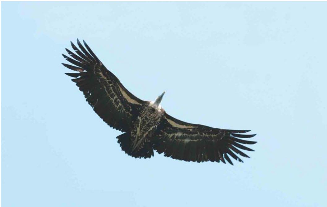
447-448 Rüppell's Griffon Vulture / Rüppells Gier Gyps rueppellii , Reeuwijk, Zuid-Holland, 21 April 2004 (Leo J R Boon/Cursorius)

Probable escapes in the Netherlands: part 2