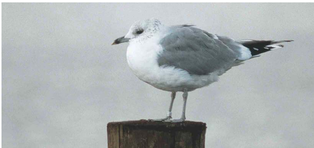
438 Stormmeeuw / Common Gull Larus canus canus , Hoornsemeer, Groningen, eind december 2003. Deze vogel werd geringd in Sjælland, Denemarken, op 24 juni 1970; op het moment dat deze foto werd gemaakt was de vogel 33 jaar en 6 maanden oud.

nen bij Zandvoort, Noord-Holland, en dat op 17 december 2002 door een ringer werd gevangen nabij Hoogstraten, Antwerpen, België, 29 jaren, vijf maanden en 12 dagen na de ringdatum. Vermeldenswaard is dat DH de ring van een andere 29-jarige Stormmeeuw heeft afgelezen. Deze werd op 22 juni 1971 als nestjong geringd in de duinen bij Schoorl en op 16 juli 2000 door DH in Schoorl gezien, 29 jaren en 24 dagen na de ringdatum. Alle 12 meldingen van levende vogels hebben betrekking op exemplaren die in of na 1969 zijn geboren en het is goed mogelijk dat ze nog in leven zijn. Gezien het relatief hoge aandeel ringaflezingen van nog levende individuen bij de terugmeldingen is het waarschijnlijk dat in de toekomst Stormmeeuwen worden teruggemeld die ouder zijn dan het in dit artikel besproken geval.