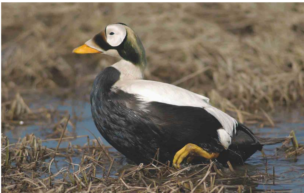
459 Spectacled Eider / Brileider Somateria fischeri , adult male, Deadhorse, Prudhoe Bay, Alaska, USA, 14 June 2004