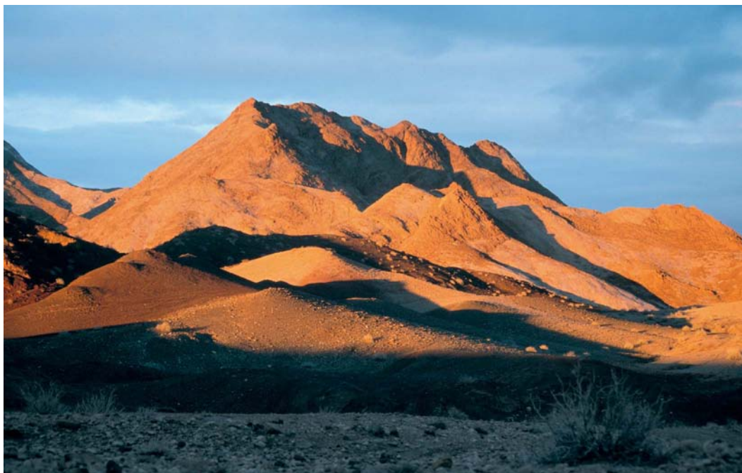
422 Sunset near Touran, Semnan, Iran, 27 January 2004

The national language is Farsi and, although only few people speak English, Iran appears to be a very hospitable country. Travelling must be done by public transport or organized tours, since car rental is almost impossible and traffic is