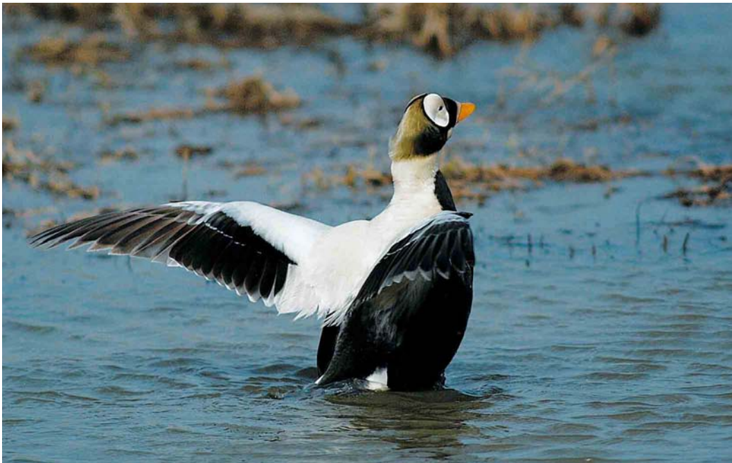
457 Spectacled Eider / Brileider Somateria fischeri , adult male, Deadhorse, Prudhoe Bay, Alaska, USA, 14 June 2004