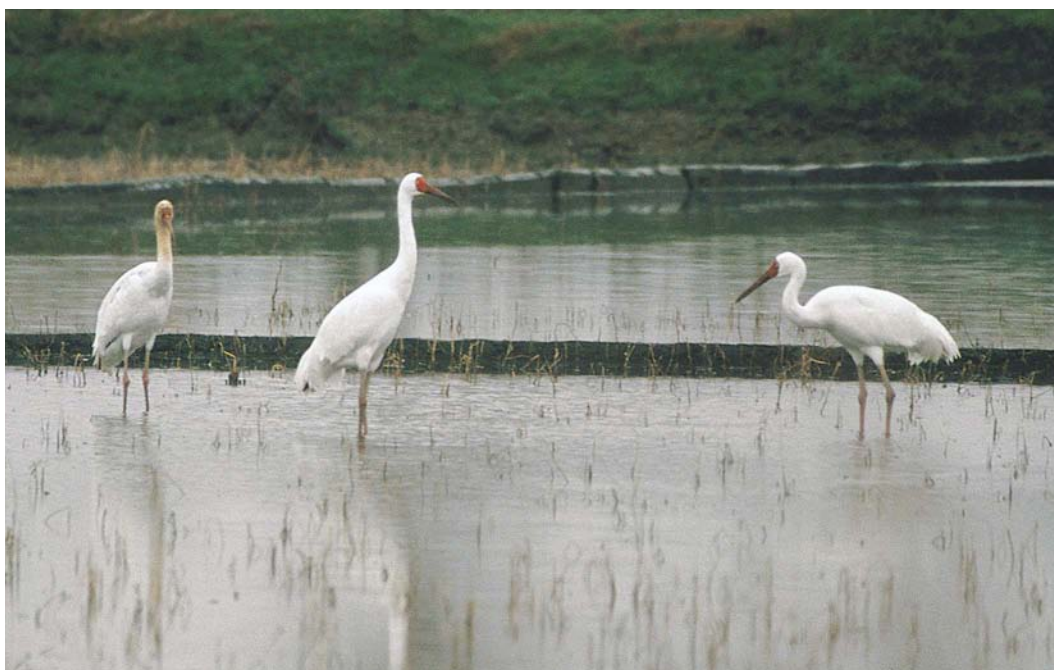
430 Siberian Cranes / Siberische Witte Kraanvogels Grus leucogeranus , pair with young, Fereidoonkenar Damgah, Mazandaran, Iran, 19 January 2004 (Mark Zekhuis)