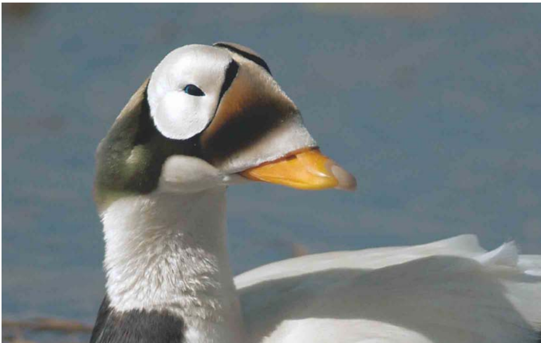
458 Spectacled Eider / Brileider Somateria fischeri , adult male, Deadhorse, Prudhoe Bay, Alaska, USA, 14 June 2004