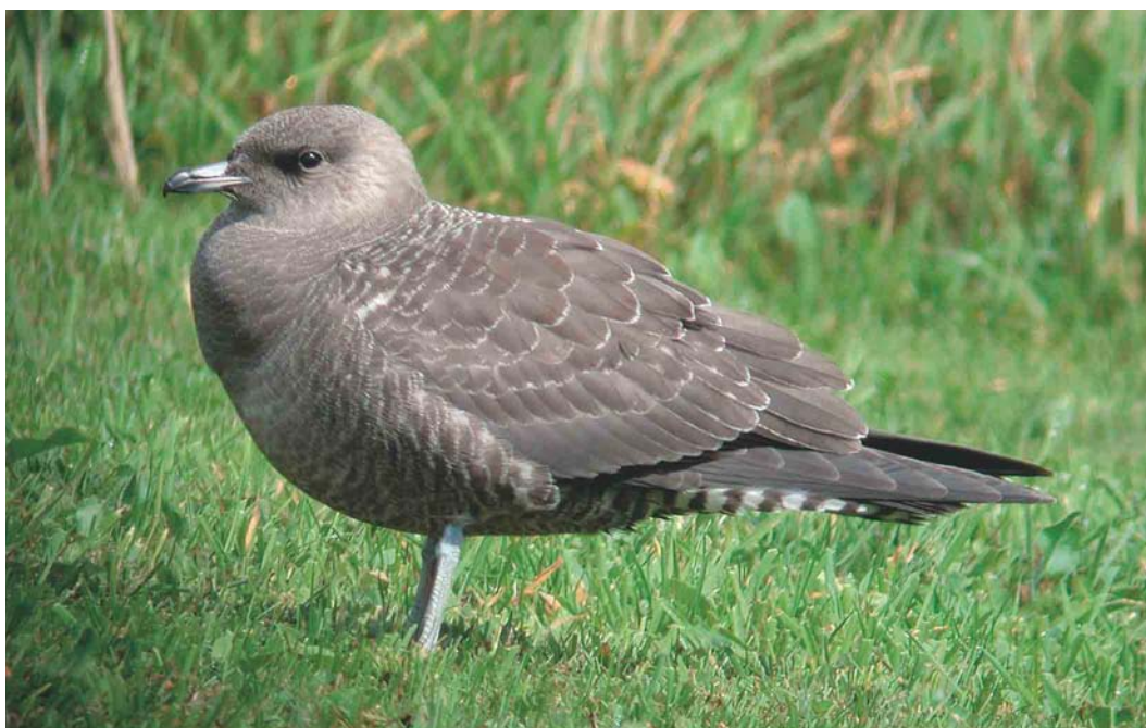
498 Kleinste Jager / Long-tailed Jaeger Stercorarius longicaudus , juveniel, Budel-Dorplein, Noord-Brabant, 26 augustus 2004