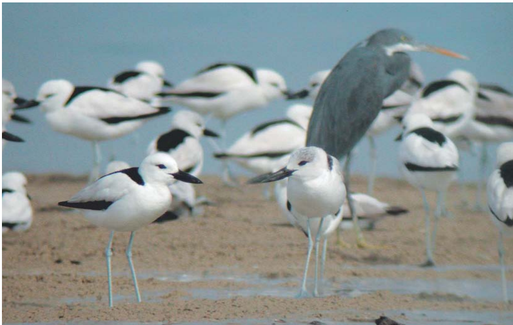
425 Crab-plovers / Krabplevieren Dromas ardeola , with Indian Reef Egret / Rode-Zeerifreiger Egretta gularis schistacea , Hara protected area, Hormozgan, Iran, 11 January 2004

den Berg 2004). Up to 12 Caspian Stonechats Saxicola maurus variegatus , 10 Plain Leaf Warblers Phylloscopus neglectus and 242 Dead Sea Sparrows Passer moabiticus were recorded. Surprisingly, 35 Mesopotamian Crows Corvus cornix capellanus were seen. This taxon, sometimes treated as a separate species, is restricted to an area along the Euphrates in south-eastern Iraq and south-western Iran and has a contrasting black-and-white plumage, with the grey parts of Hooded Crow C. c. cornix much paler and almost white (cf Madge & Burn 1993). Near Bostan, an Oriental Pratincole Glareola maldivarum was discovered on 18 January, providing the first observation for Iran. It was studied for c 20 min under good light conditions. Unfortunately, the distance was too large to take photographs and to see subtle identification characters as primary pattern, colour of the underparts, leg length and bill pattern. A description is given in appendix 1. At Aflok basin, a probable Basra Reed Warbler Acrocephalus griseldis was observed. This would be the second sighting in winter after one reported in February 1998. The bird was observed for c 2 min at a distance of 20 m. A description is given in appendix 2. At Karun fishponds, a juve-