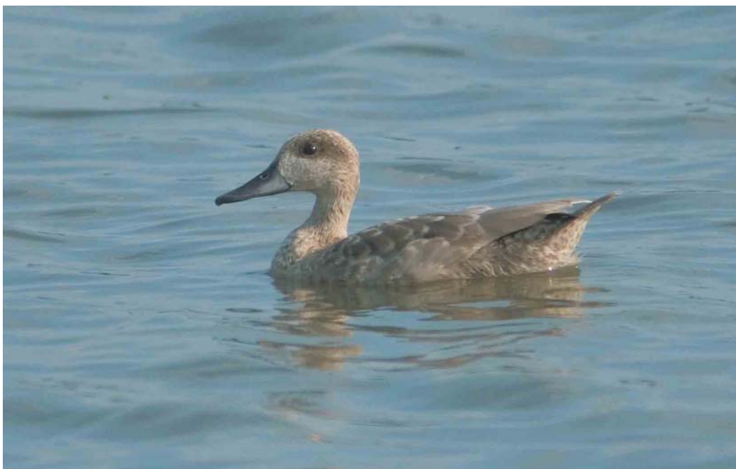
491 Marmereend / Marbled Duck Marmaronetta angustirostris , juveniel, Pannerden, Gelderland, 15 augustus 2004 (Patrick Palmen)