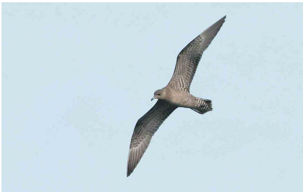
497 Kleinste Jager / Long-tailed Jaeger Stercorarius longicaudus , juveniel, Budel-Dorplein, Noord-Brabant, 21 augustus 2004 ( Ran Schols )