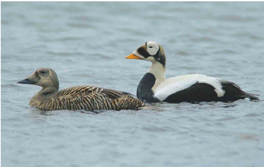
462 Spectacled Eiders / Brileiders Somateria fischeri , pair, Deadhorse, Prudhoe Bay, Alaska, USA, 13 June 2004 (René Pop)