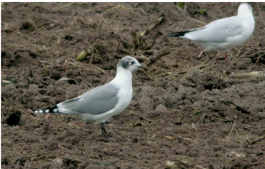
514 Franklins Meeuw / Franklin's Gull Larus pipixcan , Kesteren, Gelderland, 18 september 2004 (Toy Janssen)

densche Waard waar iedereen al keek, maar bij het plasje ten noorden van het pontje. Hier vonden zij de vogel zittend op de kant en zo werden vele 10-tallen vogelaars in de gelegenheid gesteld om hem te bekijken. Vroeg in de avond verdween hij om teruggevonden te worden langs het kanaal; later op de avond keerde hij terug naar het plasje bij de veerpont. Hier was hij de hele volgende dag en ook op maandag tot laat in de avond aanwezig. Op dinsdag 17 augustus werd hij niet meer aangetroffen en uitgebreide zoekacties in de omgeving leverden niets op.