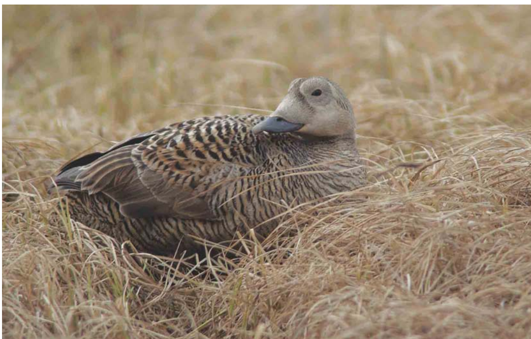
460 Spectacled Eider / Brileider Somateria fischeri , adult female, on nest, Deadhorse, Prudhoe Bay, Alaska, USA, 14 June 2004