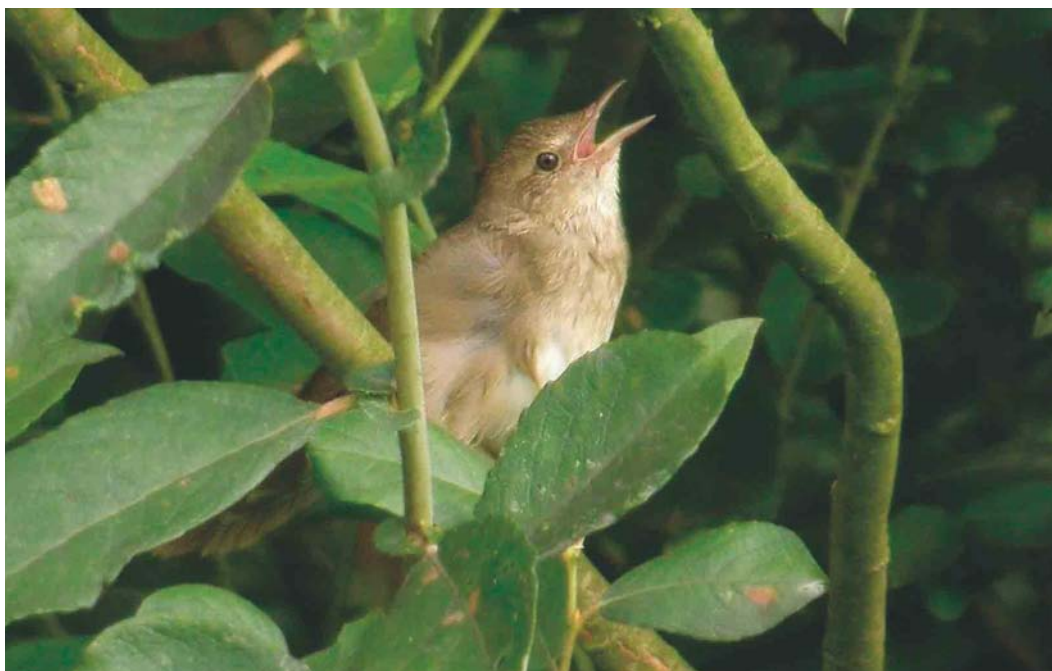
5211 Krekelzanger / River Warbler Locustella fluviatilis , Viersels Gebroekt, Antwerpen, 9 juli 2004

drie waarnemingen van solitaire vogels. De enige Vorkstaartmeeuw L. sabini vloog op 15 augustus langs Oostende; het ging om een adulte. Op 17 juli werden in de Maasvallei bij Amay, Liège, meer dan 40 Geelpootmeeuwen L. michahellis geteld. In augustus waren er gespreid over Vlaanderen nog 13 waarnemingen. Er verbleven Pontische Meeuwen L. cachinnans in Gaurain-Ramecroix, Hainaut, op 27 juli; in Lier-Duffel op 4 en 5 augustus (twee); in Nieuwpoort op 21 augustus en in Drongen op 27 augustus. Op 14 en 15 augustus pleisterde er verrassend een juveniele Drieteenmeeuw Rissa tridactyla op Blokkesdijk. Dezelfde vogel bezocht op 14 augustus het Noordelijk Eiland in Wintam en op 16 augustus vloog hij boven de Schelde in Antwerpen, Antwerpen. Over zee bij Oostende passeerden op 15 augustus twee adulte Lachsterns Gelochelidon nilotica en op 21 augustus trok er één langs De Haan. De adulte Dougalls Stern Sterna dougallii werd op 22 juli nog een laatste maal gezien in de Voorhaven van Zeebrugge. Op 4 en 5 juli vertoefde een adulte Witwangstern Chlidonias hybrida in zomerkleed op het Noordelijk Eiland in Wintam. Langs De Panne vloog op 14 augustus zowel een adulte als een juveniele Witvleugelstern C. leucopterus . Een dode Alk Alca torda werd op 14 augustus opgeraapt in de Voorhaven van Zeebrugge. Een Zwarte Zeekoet Cephus grylle in juveniel kleed of winterkleed vloog op 30 augustus langs De Panne.