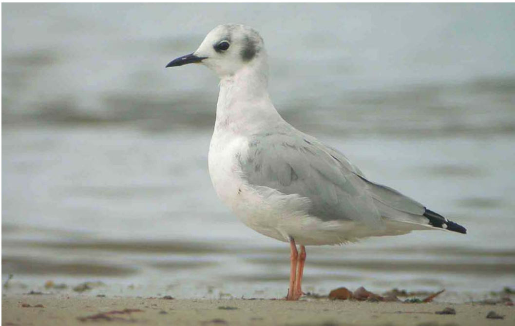
474 Bonaparte's Gull / Kleine Kokmeeuw Larus philadelphia , Porspaul, Lampaul-Plouarzel, Finistère, France, 19 September 2004