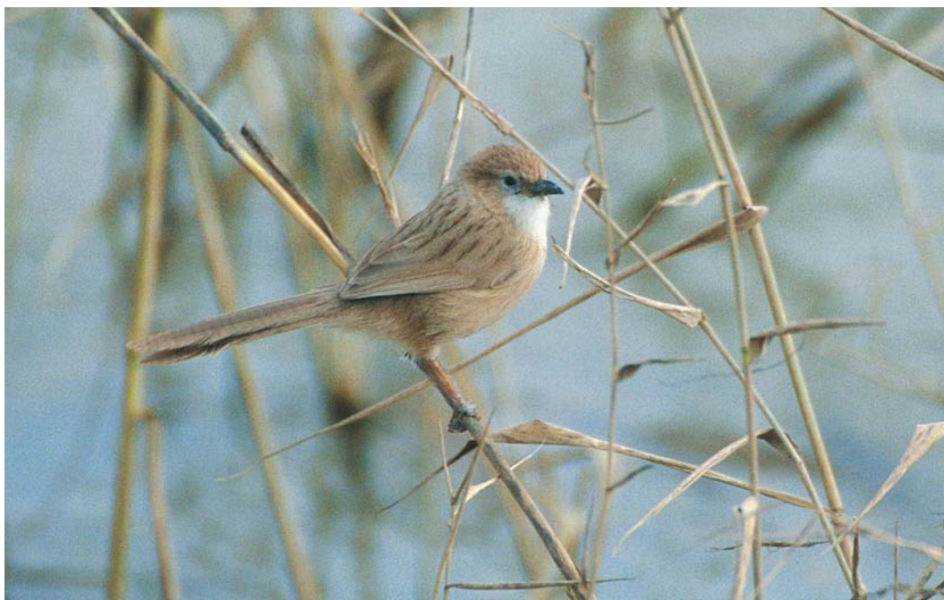
429 Iraq Babbler / Iraakse Babbelaar Turdoidea altirostris , Horeh Bamdej, Khuzestan, Iran, 23 January 2004 (Harvey van Diek)