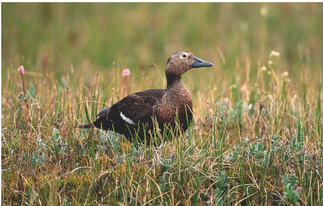
351 Steller's Eider / Stellers Eider Polysticta stelleri , female, Indigirka delta, Yakutia, Siberia, Russia, June 1999