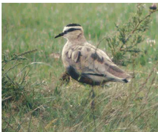
386 White-rumped Sandpiper / Bonapartes Strandloper Calidris fuscicollis , Rømø, Denmark, 12 July 2004 ( Ole Krogh ) 387 African Long-legged Buzzard / Afrikaanse Arendbuiser Buteo rufinus cirtensis , second calendar-year, Pantelleria, Italy, April 2004 ( Andre Corso ) 388 Great Snipe / Poelsnip Gallinago media , Kerkin, Greece, April 2004 ( Killian Mullarney ) 389 Sociable Lapwing / Steppekievit Vanellus gregarius , Holtgaster See, Rheiderland, Niedersachsen, Germany, 12 July 2004 ( Dušan M Brinkhuizen )

reservoir near Wrocław, Silesia, Poland, on 25 February remained through June. A first-summer Laughing Gull L atricilla was reported from Gibraltar on 5 May. The first for Bulgaria was an adult at Shabla lake on 3-7 June. From 10 July, a second-year stayed at Lough Beg, Cork. If accepted, an adult Franklin's Gull L pipixcan in the Dombes, Ain, on 16-17 May will be the 16th for France. The fifth for Shetland was an adult on Foula on 10 June. A long-stayer at Vélez-Málaga, Spain, remained until at least 15 May. An adult turned up in Lincolnshire, England, on 12 July. First-summer Bonaparte's Gulls L philadelphia were seen in Sandgerði, Iceland, from 25 April to at least late May, in Ceredigion, Wales, on 7 May, at Valdoviño, A Coruña, Spain, on 19 May and at Bowling Green Marsh, Devon, England, on 9-18 June. At least two adults were briefly observed in Britain during May, in Cheshire and