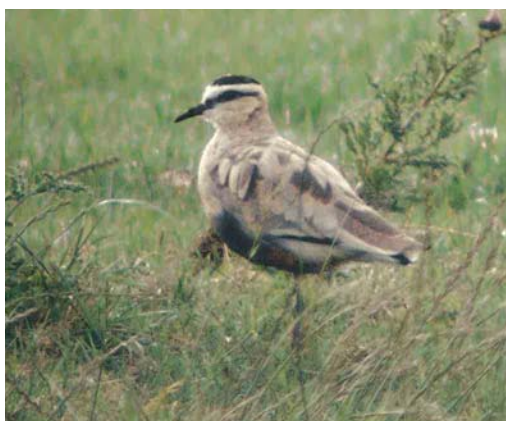
386 White-rumped Sandpiper / Bonapartes Strandloper Calidris fuscicollis , Rømø, Denmark, 12 July 2004 ( Ole Krogh ) 387 African Long-legged Buzzard / Afrikaanse Arendbuiser Buteo rufinus cirtensis , second calendar-year, Pantelleria, Italy, April 2004 ( Andre Corso ) 388 Great Snipe / Poelsnip Gallinago media , Kerkin, Greece, April 2004 ( Killian Mullarney ) 389 Sociable Lapwing / Steppekievit Vanellus gregarius , Holtgaster See, Rheiderland, Niedersachsen, Germany, 12 July 2004 ( Dušan M Brinkhuizen )

reservoir near Wrocław, Silesia, Poland, on 25 February remained through June. A first-summer Laughing Gull L atricilla was reported from Gibraltar on 5 May. The first for Bulgaria was an adult at Shabla lake on 3-7 June. From 10 July, a second-year stayed at Lough Beg, Cork. If accepted, an adult Franklin's Gull L pipixcan in the Dombes, Ain, on 16-17 May will be the 16th for France. The fifth for Shetland was an adult on Foula on 10 June. A long-stayer at Vélez-Málaga, Spain, remained until at least 15 May. An adult turned up in Lincolnshire, England, on 12 July. First-summer Bonaparte's Gulls L philadelphia were seen in Sandgerði, Iceland, from 25 April to at least late May, in Ceredigion, Wales, on 7 May, at Valdoviño, A Coruña, Spain, on 19 May and at Bowling Green Marsh, Devon, England, on 9-18 June. At least two adults were briefly observed in Britain during May, in Cheshire and