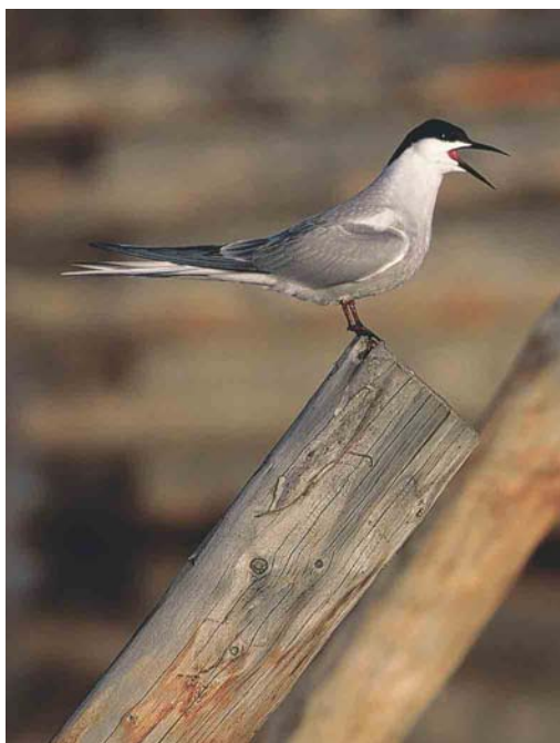
352 Little Curlew / Kleine Regenwulp Numenius minutus , Yakutia, Siberia, Russia, June 1999 (Chris Schenk) 353 Eastern Common Tern / Oostelijke Visdief Sterna hirundo longipennis/tibetana , Chukotka, Siberia, Russia, June 1999 (Chris Schenk) 354 Baikal Teal / Siberische Taling Anas formosa , male, Yakutia, Siberia, Russia, June 1999 (Chris Schenk)