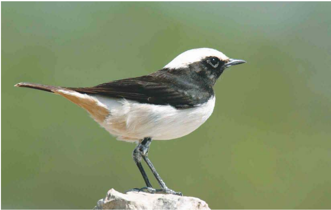
330 Arabian Wheatear / Arabische Rouwtapuit Oenanthe lugentoides , male, Dhofar mountains, Oman, 28 November 2003 (Hanne & Jens Eriksen)