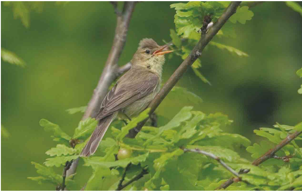
414 Orpheusspotvogel / Melodious Warbler Hippolais polyglotta , Nieuw-Bergen, Limburg, 15 mei 2004 (Patrick Palmen)