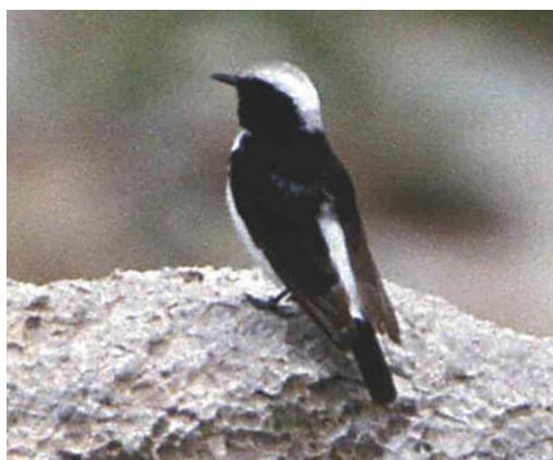
323 Eastern Mourning Wheatear / Oostelijke Rouwtafuit Oenanthe lugens lugens , adult, Eilat, Israel, December 1992 (Koen van Dijken/Cursorius) 324 Eastern Mourning Wheatear / Oostelijke Rouwtafuit Oenanthe lugens persica , first-summer male, Mizpe Ramon, Central Negev, Israel, 28 February 2004 (James P Smith). Probably the second record of O l persica for Israel. 325-326 Eastern Mourning Wheatear / Oostelijke Rouwtafuit Oenanthe lugens persica , Persepolis, c 50 km north-east of Shiraz, Iran, 20 April 1998 (Jacob Wijpkema)