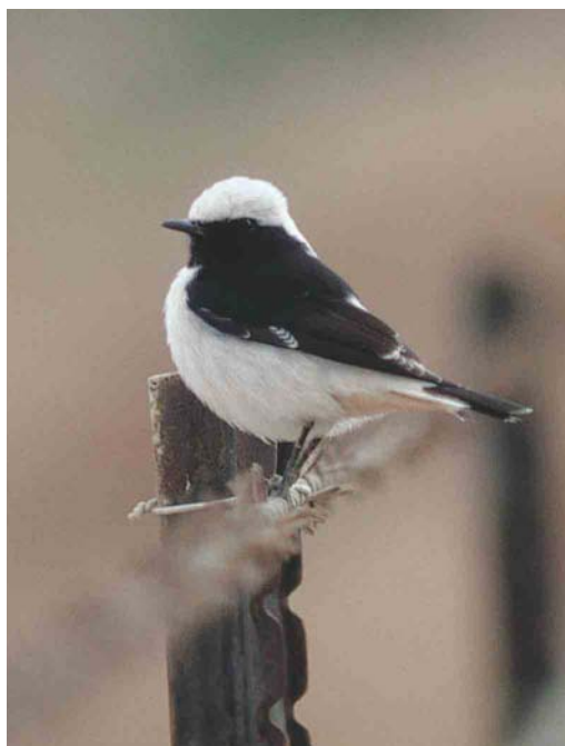
319-320 Eastern Mourning Wheatear / Oostelijke Rouwtaapuit Oenanthe lugens lugens , first-winter, Eilat, Israel, 21 December 1992 (Leo JR Boon/Cursorius) 321 Eastern Mourning Wheatear / Oostelijke Rouwtaapuit Oenanthe lugens lugens , adult, Shams Alam, Red Sea, Egypt, 6 December 2003 (Hans Bister)