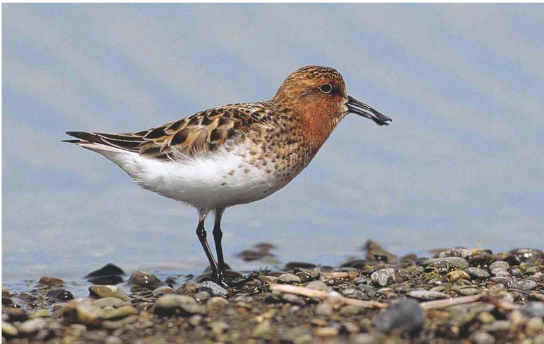
362 Spoon-billed Sandpiper / Lepelbekstrandloper Eurynorhynchus pygmeus , Chukotka, Siberia, Russia, June 2001