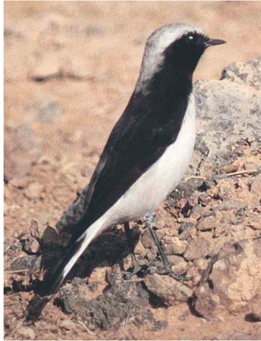
327-329 Eastern Mourning Wheatear / Oostelijke Rouwtapuit Oenanthe lugens , As Safawi, Jordan, December 1999. The dark-streaked crown indicates O. l. persica .