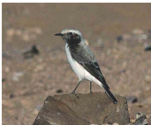
315-316 Western Mourning Wheatear / Westelijke Rouwtapuit Oenanthe halophila , male, c 25 km east of Boumalne Dadès, Morocco, 27 January 2004 317 Western Mourning Wheatear / Westelijke Rouwtapuit Oenanthe halophila , female, Amezgane, Ouarzazate, Morocco, 12 April 1997 318 Western Mourning Wheatear / Westelijke Rouwtapuit Oenanthe halophila , female, Zagora, Morocco, 29 December 1993

and the consequent recognition of four species within the group of mourning wheatears will probably stimulate this research.