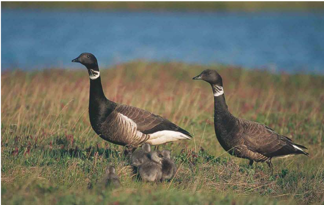
348 Black Brants / Zwarte Rotganzen Branta nigricans , Chukotka, Siberia, Russia, June 2000. See text for comments on right bird.