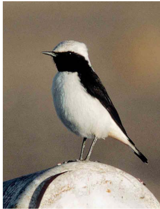
305-306 Western Mourning Wheatear / Westelijke Rouwtapuit Oenanthe halophila , male, Erfoud, Morocco, 25 December 1993 ( Theo Bakker/Cursorius ) 307 Western Mourning Wheatear / Westelijke Rouwtapuit Oenanthe halophila , male, Amezgane, Ouarzazate, Morocco, 12 April 1997 ( Arnoud B van den Berg )