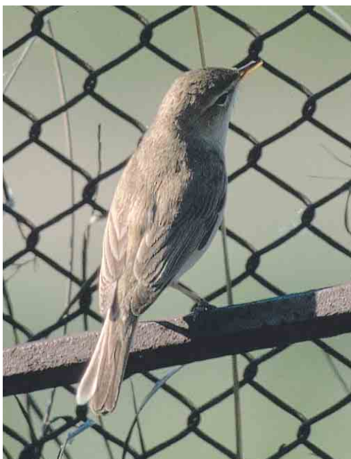
Mystery photograph VII (May)