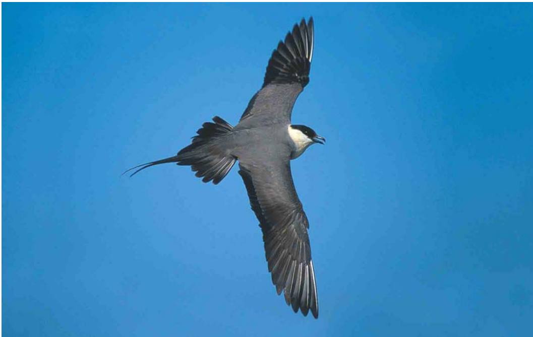
369 Long-tailed Jaeger / Kleinste Jager Stercorarius longicaudus , Chukotka, Siberia, Russia, June 2000