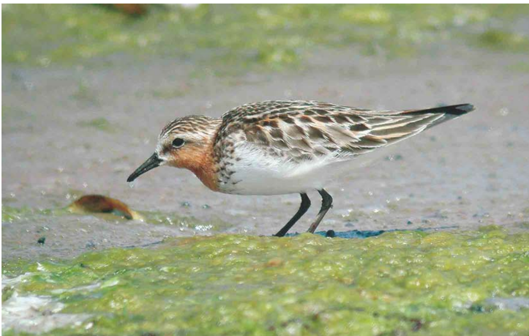
381 Red-necked Stint / Roodkeelstrandloper Calidris ruficollis , adult, Slikken van Flakkee, Zuid-Holland, Netherlands, 6 July 2004