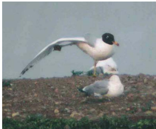
390-391 American Black Duck / Amerikaanse Zwarte Eend Anas rubripes , male, Sodankylä, Finland, 28 May 2004 (Markku Saarinen) 392 Gull-billed Tern / Lachstern Gelochelidon nilotica , adult, Opole, Silesia, Poland, 11 June 2004 (Pawel GebSKI) 393 Pallas's Gull / Reuzenzwartkopmeeuw Larus ichthyæetus , adult, Mietkow reservoir, Wrocław, Silesia, Poland, 10 June 2004 (Pawel GebSKI)

galensis ringed in 2001 was present at Banc d'Arguin, Gironde, from 23 May through June paired with a Sandwich Tern S sandvicensis but not breeding. Also present here was the unidentified orange-billed tern first seen in summer 2002 and ringed in 2003; this spring, as in 2003, the latter was paired with a Sandwich Tern raising one chick. An Elegant Tern S elegans was reported at Fouesnant, Finistère, on 9-14 May and another adult was photographed at Banc d'Arguin on 10 June (present for one day, possibly the same individual as the one photographed on 19 July 2003). On 3 July, at least 10 adult Chinese Crested Terns S bernsteini were encountered on an islet in the Taiwanese held Matsu group within 10 km from the Chinese mainland; before its rediscovery in 2000, this species had not been reliably seen since 1937 (cf Dutch Birding 22: 248-249, plate 249, 2000, 23: 300,