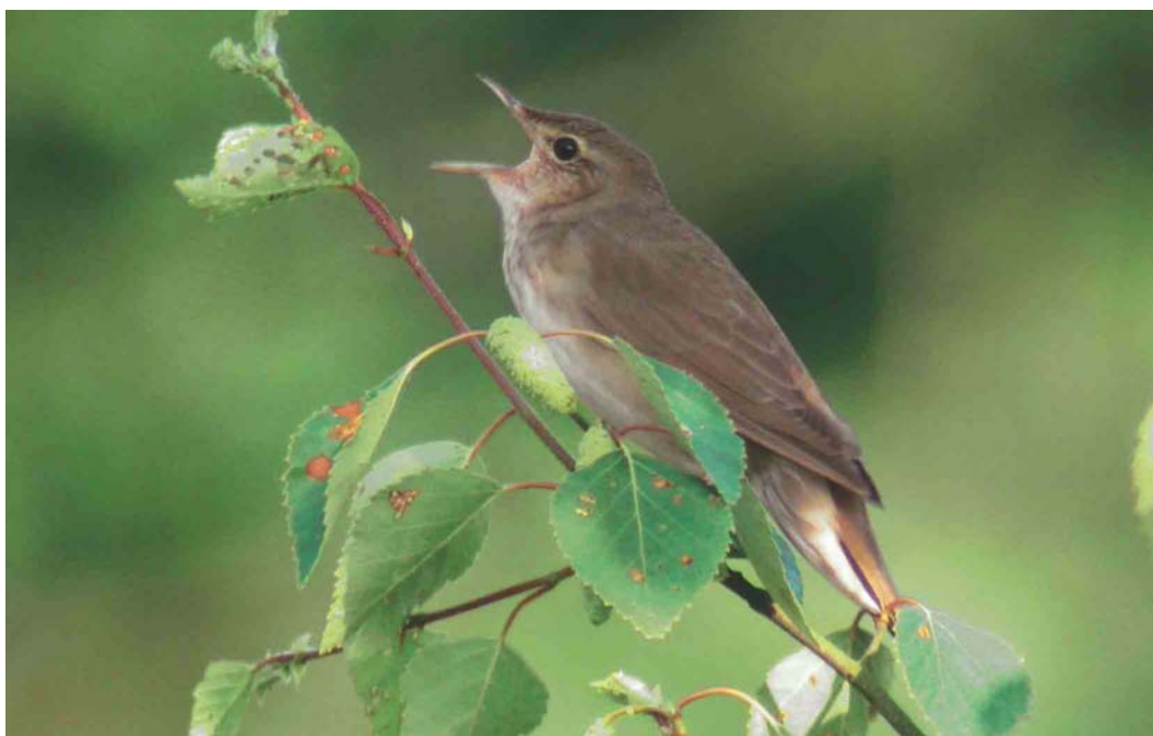
415 Krekelzanger / River Warbler Locustella fluviatilis , De Wieden, Overijssel, 10 juni 2004