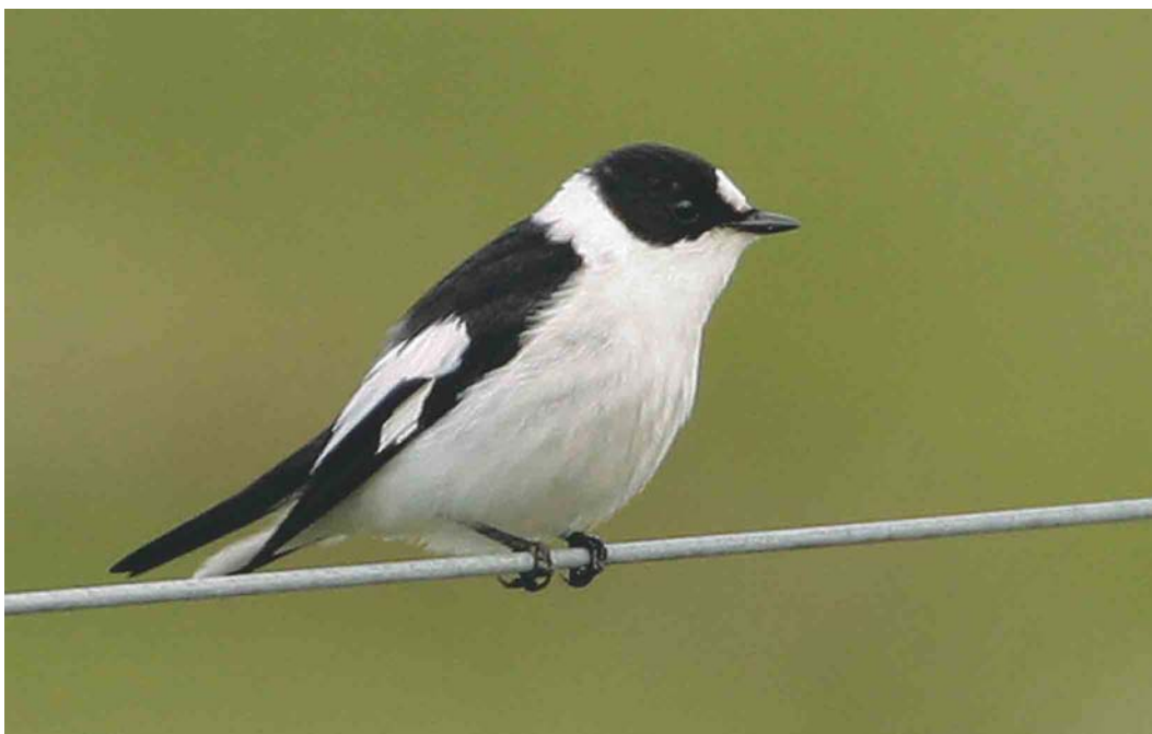
400 Collared Flycatcher / Withalsvliegenvanger Ficedula albicollis , adult male, Muness, Unst, Shetland, Scotland, 2 June 2004 (Hugh Harrop)