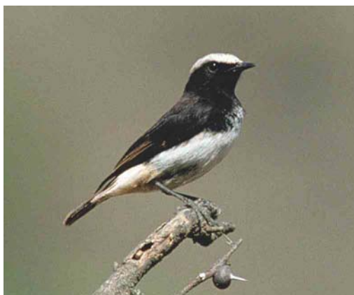
339-340 Abyssinian Black Wheatear / Schalows Rouwtapuit Oenanthe lugubris schalowi , Hell's Gate NP, Kenya, 13 July 1995 341 Abyssinian Black Wheatear / Schalows Rouwtapuit Oenanthe lugubris schalowi , Hell's Gate NP, Kenya, 07 November 2003