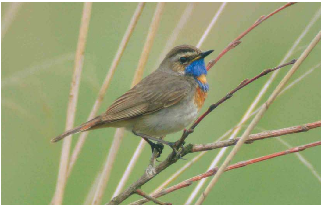
412 Roodsterblauwborst / Red-spotted Bluethroat Luscinia svecica svecica , Ooijpolder, Gelderland, 31 mei 2004