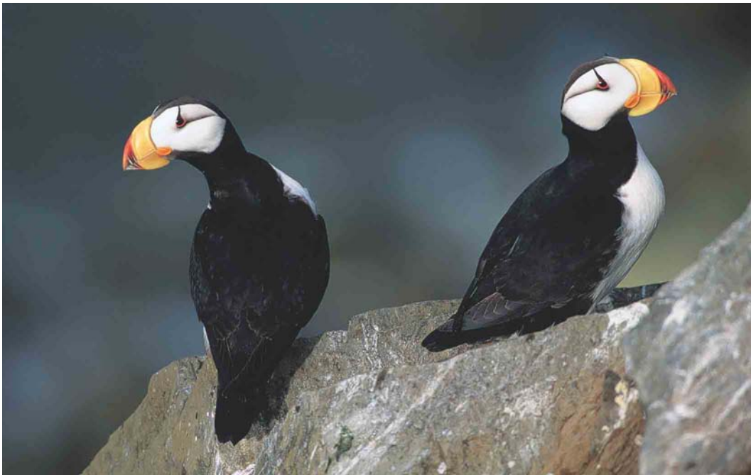
367 Horned Puffin / Gehoornde Pagegaaiduiker Fratercula corniculata , Chukotka, Siberia, Russia, July 2000