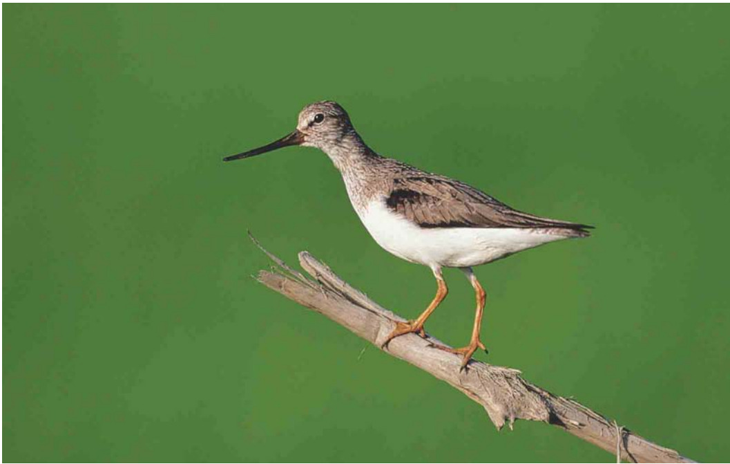
365 Terek Sandpiper / Terekruiter Xenus cinereus , Yakutia, Siberia, Russia, June 1999