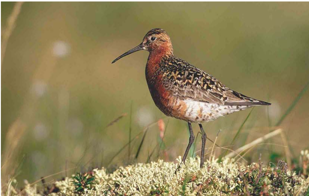
360 Curlew Sandpiper / Krombekstrandloper Calidris ferruginea , Yakutia, Siberia, Russia, June 1999