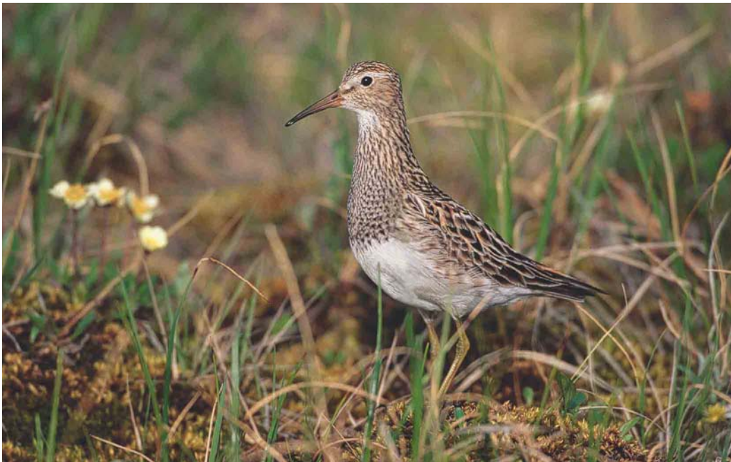
359 Pectoral Sandpiper / Gestreepte Strandloper Calidris melanotos , Yakutia, Siberia, Russia, July 1999