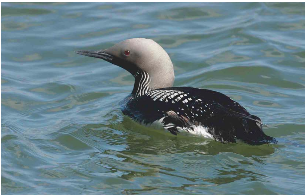
417 Parelduiker / Black-throated Loon Gavia arctica , Oostende, West-Vlaanderen, 5 juni 2004

UILEN TOT GORZEN Een Oehoe Bubo bubo bezocht in mei het begijnhof van Arendonk, Antwerpen. De periode was nog goed voor 17 Velduilen Asio flammeus . Op