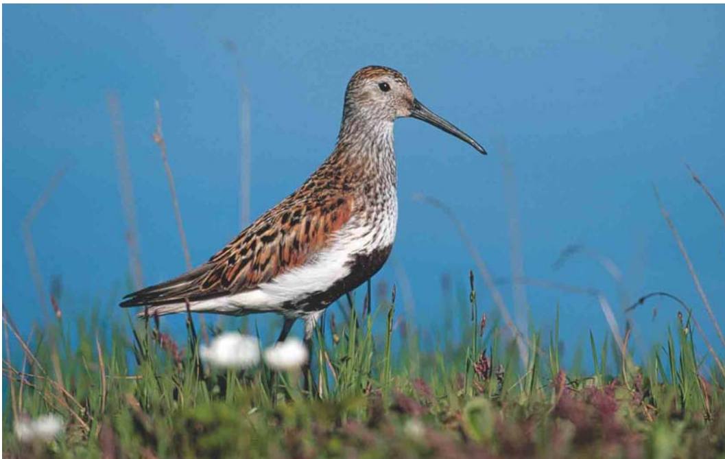
364 Pacific Dunlin / Pacifische Bonte Strandloper Calidris alpina pacifica , Chukotka, Siberia, Russia, June 2000