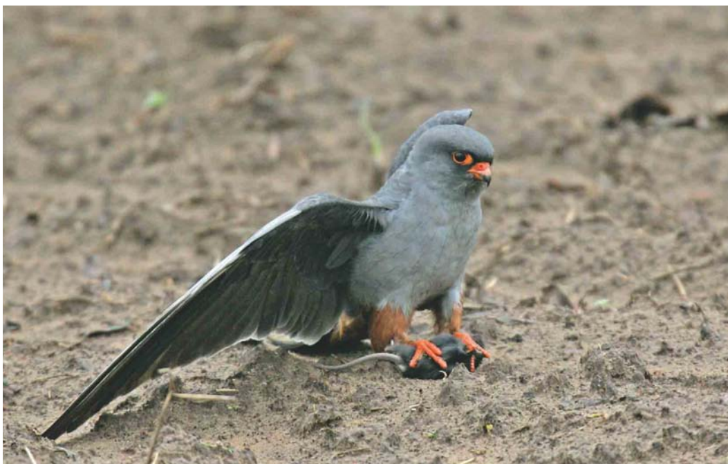
382 Red-footed Falcon / Roodpootvalk Falco vespertinus , adult male, Muhos, Oulu, Finland, 24 May 2004