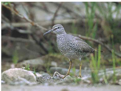
373 Spoon-billed Sandpiper / Lepelbekstrandloper Eurynorhynchus pygmeus , chick, Chukotka, Siberia, Russia, July 2000 (Chris Schenk) 374 Long-toed Stint / Taigastrandloper Calidris subminuta , Chukotka, Siberia, Russia, July 2001 (Chris Schenk) 375 Grey-tailed Tattler / Siberische Grijze Ruitter Heteroscelus brevipes , Chukotka, Siberia, Russia, July 2001 (Chris Schenk) 376 Wandering Tattler / Amerikaanse Grijze Ruitter Heteroscelus incanus , Chukotka, Siberia, Russia, 18 July 2001 (Chris Schenk)

the first documented breeding record for Russia and for the entire Palearctic region (Pavel Tomkovich in litt; Lappo & Syroechkovski 2002). Previous reports and unproven records were mentioned by Gill et al (2002). Normally, this species breeds only in Alaska, USA. Grey-tailed Tattler H. brevipes , on the other hand, is a common breeder in eastern Siberia and can be found in vegetated areas along rivers and streams.