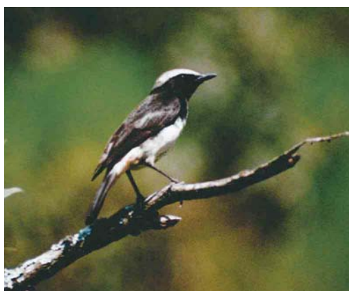
335-336 Abyssinian Black Wheatear / Schalows Rouwtapuit Oenanthe lugubris lugubris , black morph, near Awasa, Ethiopia, 2 December 1996 ( Jacob Wijpkema ) 337 Abyssinian Black Wheatear / Schalows Rouwtapuit Oenanthe lugubris schalowi , Hell's Gate NP, Kenya, 18 April 2003 ( Rick van der Weijde ) 338 Abyssinian Black Wheatear / Schalows Rouwtapuit Oenanthe lugubris schalowi , Hell's Gate NP, Kenya, 22 May 2003 ( Rick van der Weijde )