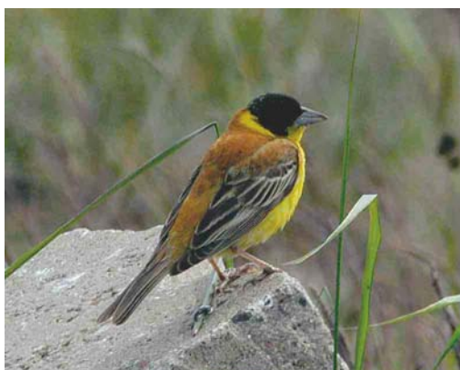
394 Lesser Grey Shrike / Kleine Klapekster Lanius minor , Gotland, Sweden, 14 May 2004 ( Thor Veen ) 395 Asian White-winged Scoters / Aziatische Grote Zee-eenden Melanitta deglandi stejnegeri , male and female, Yuanmingyuan Park, Beijing, China, 8 May 2004 ( Liu Yang ) 396 Pied Wheatear / Bonte Tapuit Oenanthe pleschanka , male, Kramnitse, Lolland, Denmark, 30 May 2004 ( Ole Zoltan Göller ) 397 Citrine Wagtail / Citroenkwikstaart Motacilla citreola , female, Pag, Croatia, 28 April 2004 ( Dare Sere ) 398 Western Orphean Warbler / Westelijke Orpheusgrasmus Sylvia hortensis , male, Helgoland, Schleswig-Holstein, Germany, June 2004 ( Felix Jachmann ) 399 Black-headed Bunting / Zwartkopgors Emberiza melanocephala , male, Helgoland, Schleswig-Holstein, Germany, 30 May 2004 ( Felix Jachmann )