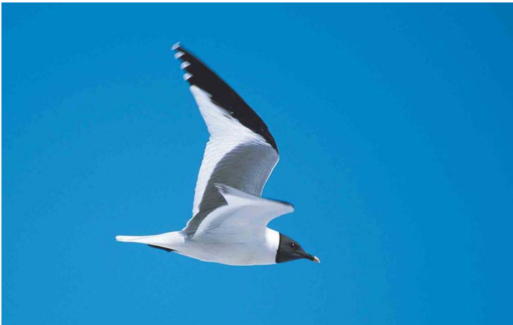
370 Sabine's Gull / Vorkstaartmeeuw Larus sabini , Chukotka, Siberia, Russia, June 2000