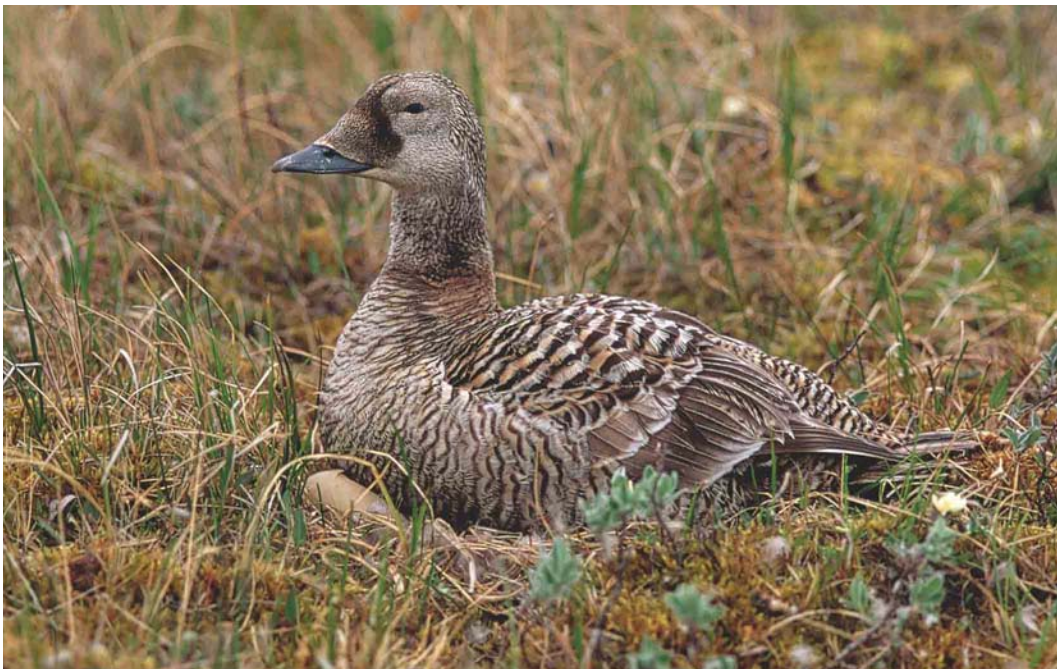
349 Spectacled Eider / Brileider Somateria fischeri , female, Yakutia, Siberia, Russia, July 1999