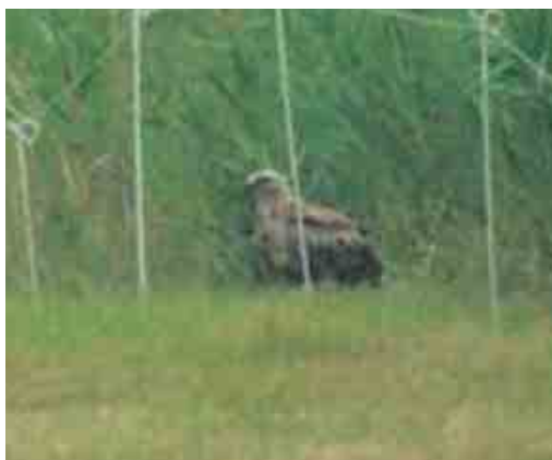
421 Arendbuizerd / Long-legged Buzzard Buteo rufinus , Ezumakeeg, Friesland, 9 juli 2004 (Oane Tol)

afwezigheid van zichtbare bandering op de staartpennen en de grootte in vergelijking met Zwarte Kraaien Corvus corvus goed zien. De vogel verplaatste zich enkele keren met rasse schreden naar de Zwarte Kraaien wanneer deze te dichtbij kwamen. Hij vloog op met volle krop en verdween achter een bomenrij – waarschijnlijk is hij hier opnieuw geland want toen ik na c 10 min in zuidelijke richting wegreed van de Ezumakeeg pikte ik hem nogmaals vliegend op samen met een Zwarte Kraai en een Buizerd die enkele keren op de Arendbuizerd sloeg. Hierdoor kon ik nu ook de vergeleken met Buizerd grotere vleugellengte zien. De vogel cirkelde steeds hoger en vloog vervolgens in een rechte lijn weg in zuidwestelijke richting. Hierna hebben Rommert en ik nog het gebied Wouddijk en het noorden van Engwierum en Ee afgezocht, echter zonder resultaat.