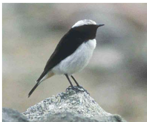
332-333 Arabian Wheatear / Arabische Rouwtapuit Oenanthe lugentoides , female, Ash Shafa, Saudi Arabia, March 1997 (Steve Young) 334 Arabian Wheatear / Arabische Rouwtapuit Oenanthe lugentoides , male, Ash Shafa, Saudi Arabia, March 1997 (Steve Young)