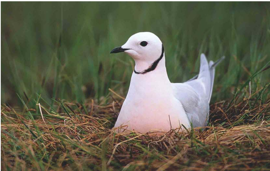
372 Ross's Gull / Ross Meeuw Rhodostethia rosea , Indigirka delta, Yakutia, Siberia, Russia, June 1999