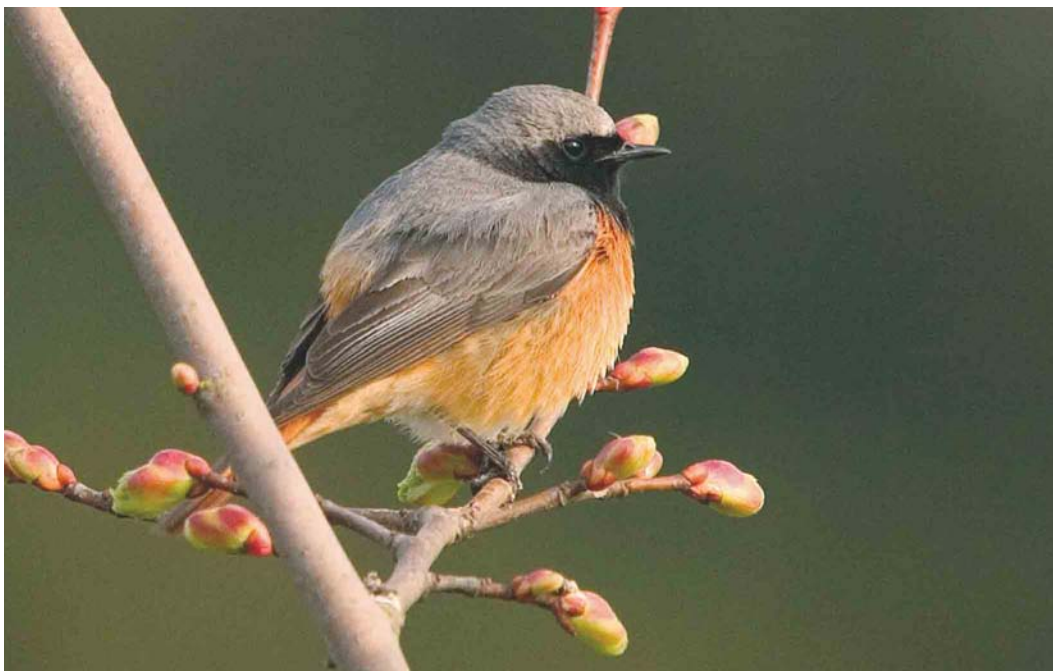
413 Hybride Zwarte x Gekraagde Roodstaat / hybrid Black x Common Redstart Phoenicurus ochrurus x phoenicurus , Groote Peel, Ospel, Limburg, 17 april 2004 (Otto Plantema) cf Dutch Birding 26: 215, 2004