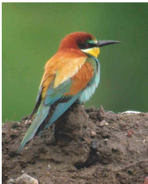
418 Bijeneter / European Bee-eater Merops apiaster , Wachtebeke, Oost-Vlaanderen, 21 mei 2004 (Kris De Rouck)

niet onbetuigd met waarnemingen in Oud-Turnhout rond 25 mei; bij Manhay, Luxembourg van 27 tot 29 mei; in Kalmthout op 9 en 10 juni; en in Sint-Lambrechts-Woluwe, Vlaams-Brabant, op 9 juni. Van 21 tot ten minste 31 mei bevonden zich twee Huis-kraaien Corvus splendens bij Wachtebeke; het gaat hier om de eerste waarneming voor België. Europese Kanaries Serinus serinus verschenen op 16 mei in Viersel, op 31 mei in Wachtebeke en op 2 juni in Gent. Vanaf 1 juni meldden de eerste Kruisbekken Loxia curvirostra zich aan, als voorbode van een kleine invasie. Een Roodmus Carpodacus erythrinus pleisterde van 29 mei tot 5 juni bij De Panne, West-Vlaanderen. Opmerkelijk laat was de Ijsgors Calcarius lapponicus bij Turnhout op 27 mei. Op 1 mei was er kortstondig een Ortolaan Emberiza hortulana in Leefdaal, Vlaams-Brabant, op 2 mei werden er twee gezien bij Jamoigne, Luxembourg, op 8 mei één in Kallo-Doel, op 9 mei één in Tienen, op 10 mei één langstrekkend bij Eghezée-Longchamps, Liège, en op 28 mei opnieuw één in Kallo-Doel.