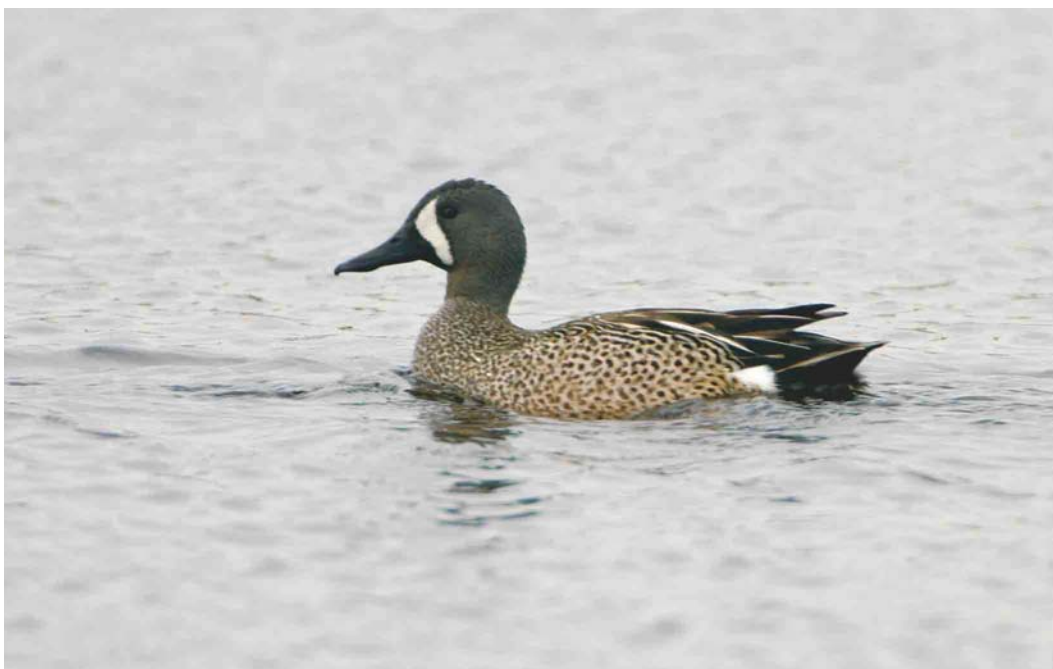
404 Blauwvleugeltaling / Blue-winged Teal Anas discors , mannetje, Groote Vlak, Texel, Noord-Holland, 20 mei 2004 ( Bas van den Boogaard )