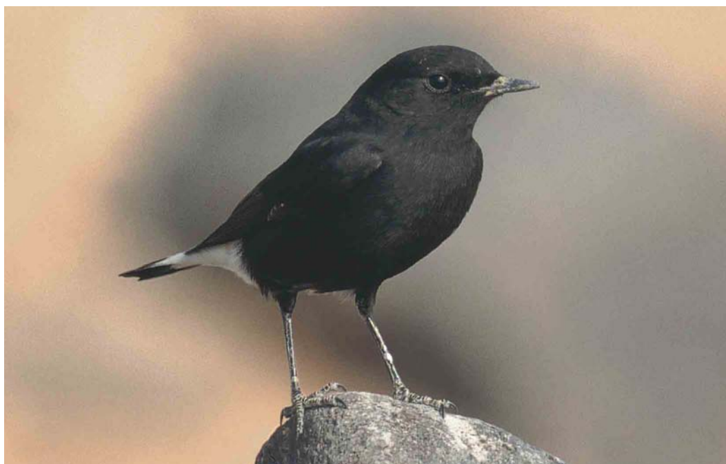
322 'Basalt Wheatear' / 'Basalttapuit', dark morph of Eastern Mourning Wheatear / Oostelijke Rouwtapuit Oenanthe lugens lugens , As Safawi, Jordan, 6 December 1999

rufous or pale cinnamon. Males have a dark crown, often distinctly streaked blackish, resembling lugentoides . There is a distinct black-bellied morph of nominate lugubris resembling 'Basalt Wheatear' (see above) although it also shows a rufous tail and rump. The mantle, back, rump and scapulars of males nominate lugubris are black; the crown and nape are dirty brown and heavily streaked black. Male vauriei differs from white-bellied male nominate lugubris in having the crown and nape pale greyish-buff with black streaks. Male schalowi looks very much like white-bellied male nominate lugubris but the back is very dark brown, instead of pure black, with a less streaked crown which appears uniform dirty brown in many birds. Females of all three taxa are rather different from males as well as from females of all other taxa. They are sooty brown on the throat and chest with darker streaks and have sooty brown upperparts. The underparts are dusky white and, as with the males, the rump, undertail-coverts and tail base are rufous.