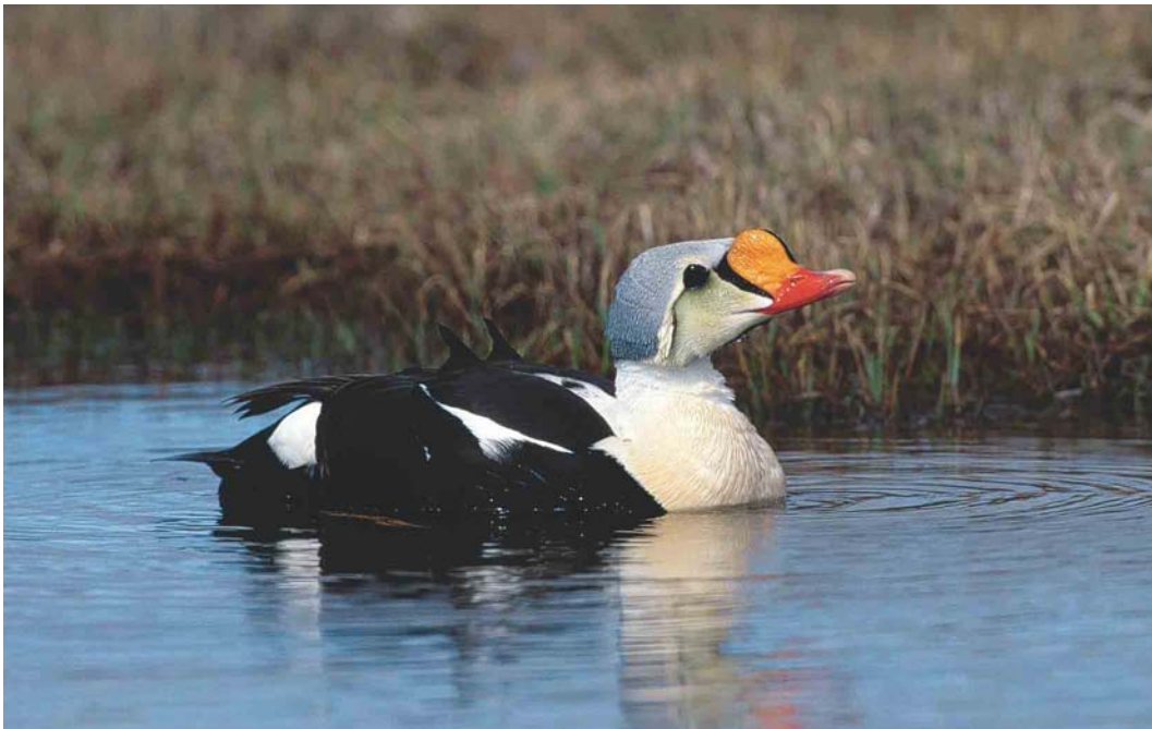
350 King Eider / Koningseider Somateria spectabilis , male, Chukotka, Siberia, Russia, June 2000 (Chris Schenk)