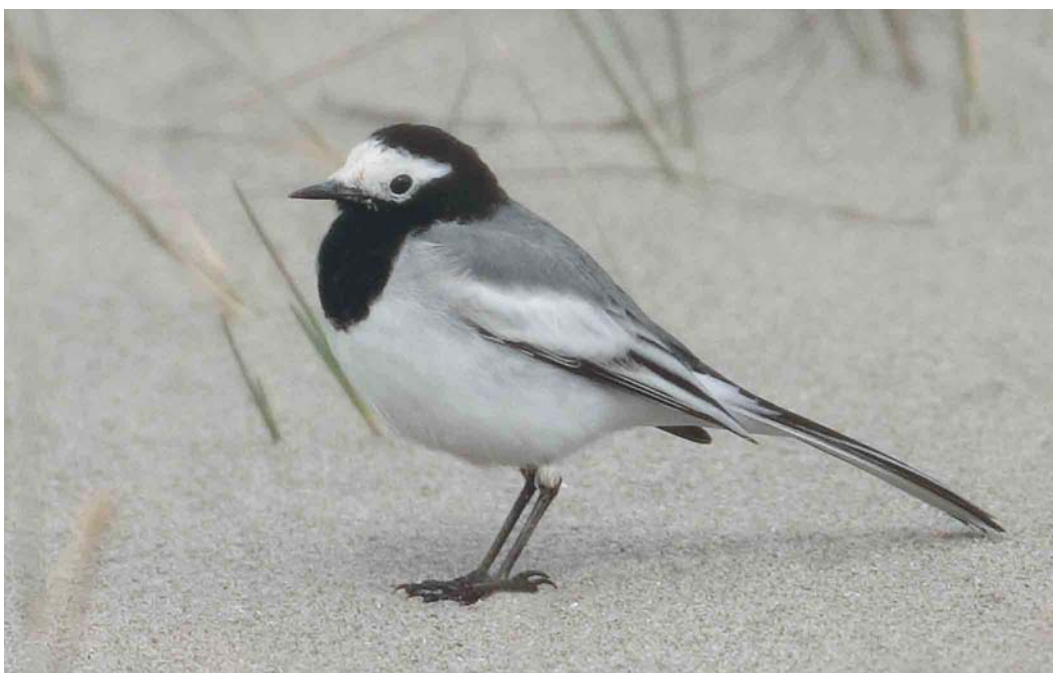
401 Masked Wagtail / Maskerkwikstaart Motacilla personata , first-summer male, Lista, Vest-Agder, Norway, 7 April 2004