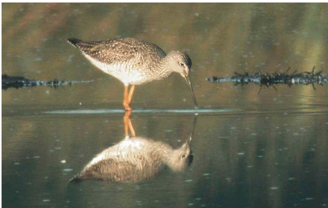
402 Grote Geelpootruiter / Greater Yellowlegs Tringa melanoleuca , Hilversumse Bovenmeent, Noord-Holland, 25 mei 2004 (Tommy Frandsen/Cursorius)