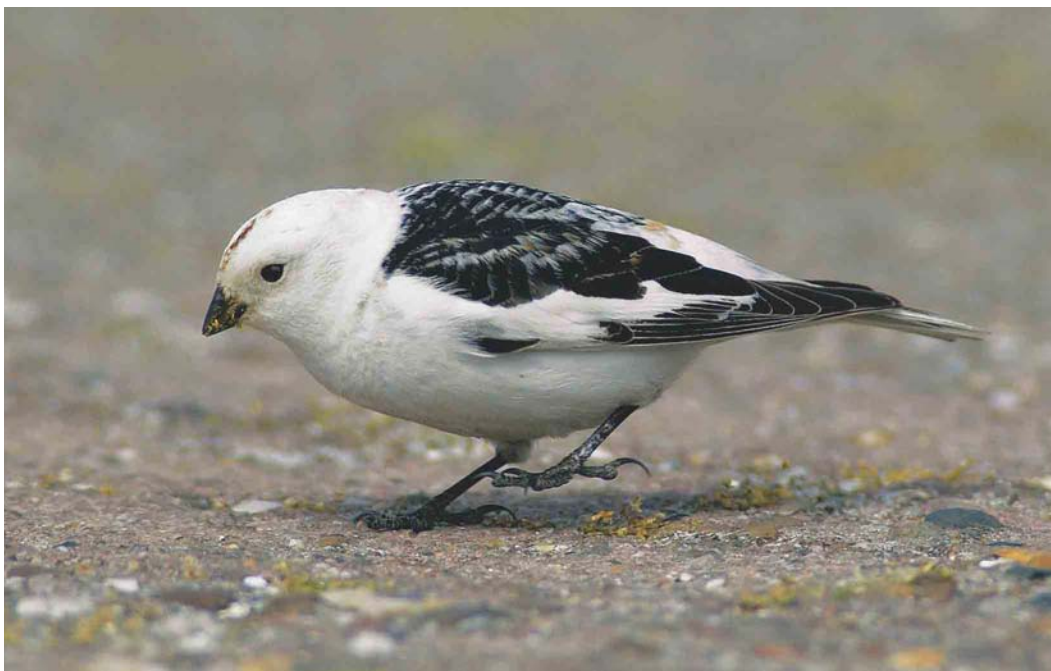
416 Sneeuwgors / Snow Bunting Plectrophenax nivalis , mannetje, Hoornderslag, Texel, Noord-Holland, 23 mei 2004

soorten – waaronder drie exemplaren in de provincie Utrecht (in Maarssenveen, Maartensdijk en de wijk Lunetten, Utrecht) en één in het Vliegenbos in Amsterdam-Noord. Er waren Kleine Vliegenvangers Ficedula parva op 16 mei op Texel en op 18 mei bij Groet, Noord-Holland. In het natuurontwikkelingsgebied Bentwoud nabij Boskoop, Zuid-Holland, werd in de avond van 3 juni een Kleine Klapekster Lanius minor waargenomen, waarvan enkele 10-tallen vogelaars konden meegenieten. Roodkopklauwieren L senator verschenen op 12 en 13 mei op Schiermonnikoog, op 22 mei bij Itteren, Limburg, op 27 mei (een vangst) aan het Veluwemeer bij Elburg, Gelderland, op 29 mei bij Hierden, Gelderland, en in Berkheide bij Wasse-naar, op 30 en 31 mei op De Boschplaat op Terschelling en op 5 juni bij de Lepelaarsplassen, Flevoland. Een adulte Roze Spreeuw Sturnus roseus verbleef van 7 tot 11 mei op Schiermonnikoog en twee adulte pas-seerden op 10 juni telpost Eemshaven. Dit jaar werden tussen 20 mei en half juni c 20 Roodmussen Carpodacus erythrinus vastgesteld, het merendeel in Noord-Holland, Friesland en Groningen. Een exemplaar in Kollum, Friesland, bleef in ieder geval tot 19 juni. In de categorie vermeldenswaard hoort het mannetje Sneeuwgors Plectrophenax nivalis in zomerkleed dat van 21 tot 27 mei op de parkeerplaats aan de Hoornderslag op Texel verbleef. De waarneming van een Grijze Gors Emberiza cia op Rottumerplaat op 30