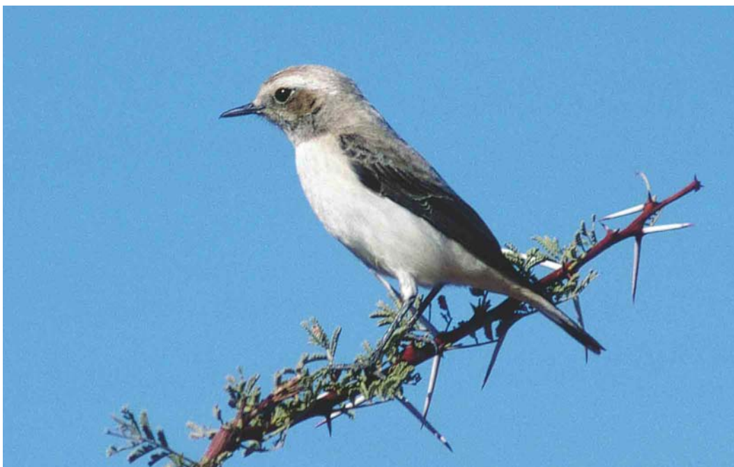
312 Western Mourning Wheatear / Westelijke Rouwtapuit Oenanthe halophila , female, Zagora, Morocco, 29 December 1993 313 Western Mourning Wheatear / Westelijke Rouwtapuit Oenanthe halophila , female, Merzouga, Morocco, 28 January 2004 314 Western Mourning Wheatear / Westelijke Rouwtapuit Oenanthe halophila , female, Merzouga, Morocco, 28 January 2004