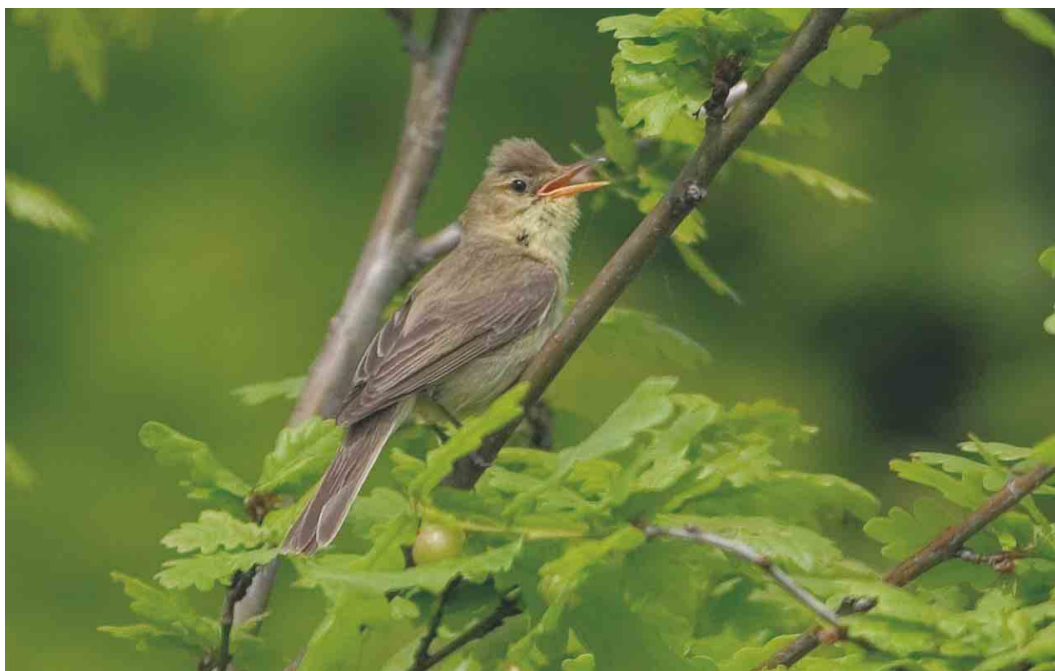
414 Orpheusspotvogel / Melodious Warbler Hippolais polyglotta , Nieuw-Bergen, Limburg, 15 mei 2004