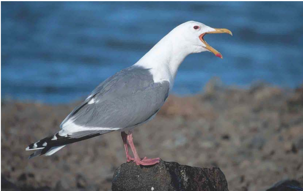
371 Vega Gull / Vegameeuw Larus mongolicus vegae , Chukotka, Siberia, Russia, June 2000 (Chris Schenk)