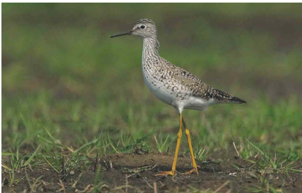
403 Kleine Geelpootruiter / Lesser Yellowlegs Tringa flavipes , Annermoeras, Spijkerboor, Drenthe, 21 mei 2004 (Bas van den Boogaard)