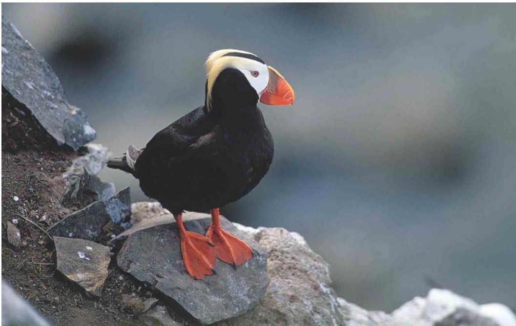
368 Tufted Puffin / Kuifpapegaaiduiker Fratercula cirrhata , Chukotka, Siberia, Russia, July 2000 (Chris Schenk)