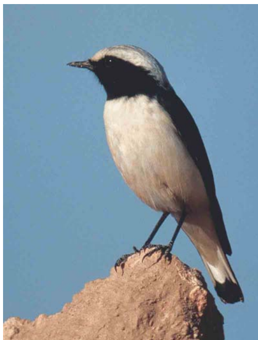
308 Western Mourning Wheatear / Westelijke Rouwtapuit Oenanthe halophila , male, c 25 km east of Boumalne Dadès, Morocco, 27 January 2004 ( Ran Schols ) 309 Western Mourning Wheatear / Westelijke Rouwtapuit Oenanthe halophila , male, El Hamma, Tunisia, 12 December 2003 ( Harm Niesen ) 310 Western Mourning Wheatear / Westelijke Rouwtapuit Oenanthe halophila , female, Zagora, Morocco, 29 December 1993 ( Theo Bakker/Cursorius ) 311 Western Mourning Wheatear / Westelijke Rouwtapuit Oenanthe halophila , female, Merzouga, Morocco, 28 January 2004 ( Ran Schols )