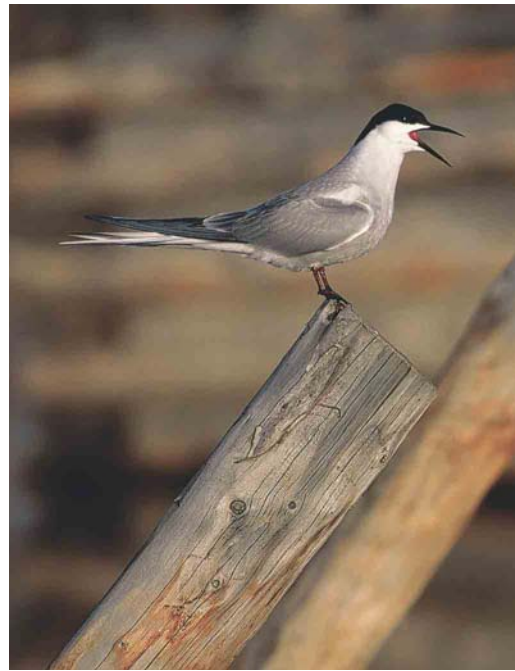
352 Little Curlew / Kleine Regenwulp Numenius minutus , Yakutia, Siberia, Russia, June 1999 (Chris Schenk) 353 Eastern Common Tern / Oostelijke Visdief Sterna hirundo longipennis/tibetana , Chukotka, Siberia, Russia, June 1999 (Chris Schenk) 354 Baikal Teal / Siberische Taling Anas formosa , male, Yakutia, Siberia, Russia, June 1999 (Chris Schenk)