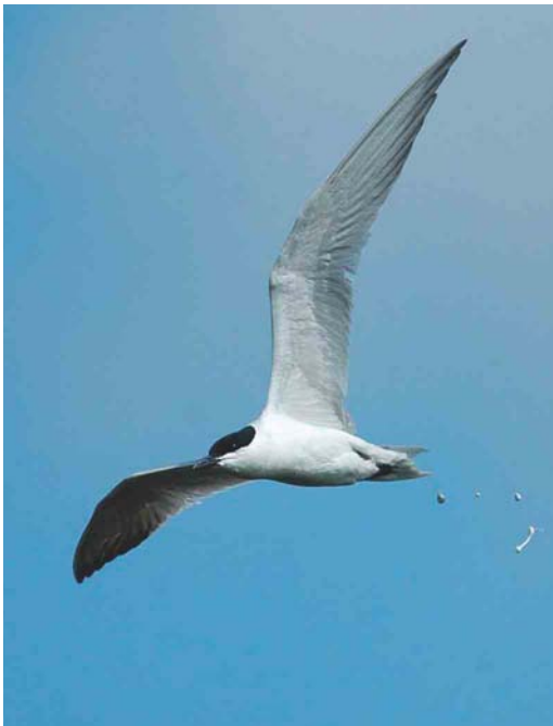
384 Gull-billed Tern / Lachstern Gelochelidon nilotica , Wexford, Ireland, July 2004 (John Murphy)