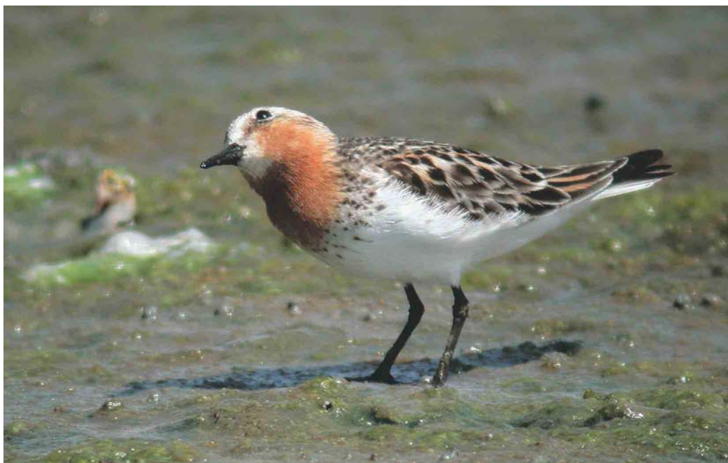
420 Roodkeelstrandloper / Red-necked Stint Calidris ruficollis , adult, Slikken van Flakkee, Zuid-Holland, 6 juli 2004

deel van dit onderzoek is het bepalen van het broedsucces van Bontbekplevieren Charadrius hiaticula en Strandplevieren C alexandrinus op de Slikken van Flakkee, Goeree-Overflakkee, Zuid-Holland. Na een rustig begin van de telling op 6 juli 2004 zagen René van Loo en ik omstreeks 14:00 ter hoogte van het zogeheten Zanddepot de eerste grote groep met c 40 Bontbekken en c 35 Strandplevieren. Dergelijke groepen worden altijd omzichtig benaderd en al van grote afstand afgezocht op de aanwezigheid van gekleurde exemplaren en net 'uitgevlogen' jongen. Tijdens het telwerk zag ik in de groep een kleinere strandloper waarna de woorden 'hé René, daar staat een adulte Roodkeelstrandloper' een voorlopig einde aan de telling maakten. De determinatie als Roodkeelstrandloper Calidris ruficollis was eenvoudig. De combinatie van rode wang, keel en bovendeel van de borst (kleur als van zomerkleed Krombekstrandloper C ferruginea ), omzoomd door bruinzwarte vlekjes op een helderwitte ondergrond, met een grotendeels grijze vleugel sloot alle andere Calidris -soorten uit. Buiten de kleedkenmerken vielen ook de bouw en manier van foerageren op. In zijaanzicht bleek de vogel erg langgerekt en recht van voren bijzonder 'plat' en ovaal, een bouw die eerder aan een Bonapartes Strandloper C fuscicollis dan aan een Kleine Strandloper C minuta deed denken. Tijdens het foerageren viel de meer plevierachtige manier van lopen op. Na een kort telefoontje haastten