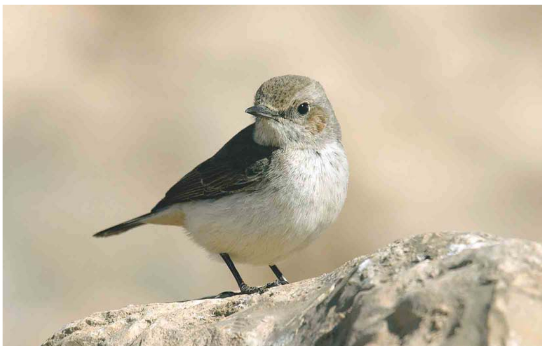
331 Arabian Wheatear / Arabische Rouwtapuit Oenanthe lugentoides , female, Dhofar mountains, Oman, 23 January 2004