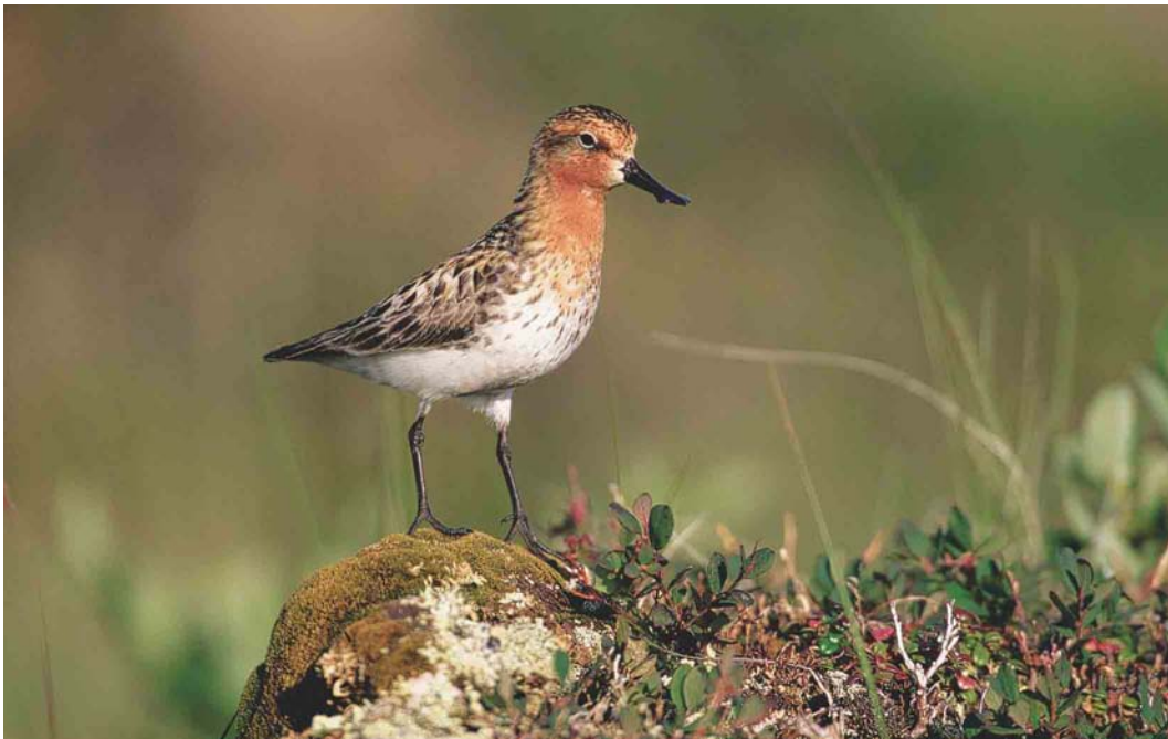
361 Spoon-billed Sandpiper / Lepelbekstrandloper Eurynorhynchus pygmeus , Chukotka, Siberia, Russia, July 2000