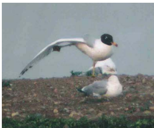
390-391 American Black Duck / Amerikaanse Zwarte Eend Anas rubripes , male, Sodankylä, Finland, 28 May 2004 (Markku Saarinen) 392 Gull-billed Tern / Lachstern Gelochelidon nilotica , adult, Opole, Silesia, Poland, 11 June 2004 (Pawel GebSKI) 393 Pallas's Gull / Reuzenzwartkopmeeuw Larus ichthyæetus , adult, Mietkow reservoir, Wrocław, Silesia, Poland, 10 June 2004 (Pawel GebSKI)

galensis ringed in 2001 was present at Banc d'Arguin, Gironde, from 23 May through June paired with a Sandwich Tern S. sandvicensis but not breeding. Also present here was the unidentified orange-billed tern first seen in summer 2002 and ringed in 2003; this spring, as in 2003, the latter was paired with a Sandwich Tern raising one chick. An Elegant Tern S. elegans was reported at Fouesnant, Finistère, on 9-14 May and another adult was photographed at Banc d'Arguin on 10 June (present for one day, possibly the same individual as the one photographed on 19 July 2003). On 3 July, at least 10 adult Chinese Crested Terns S. bernsteini were encountered on an islet in the Taiwanese held Matsu group within 10 km from the Chinese mainland; before its rediscovery in 2000, this species had not been reliably seen since 1937 (cf Dutch Birding 22: 248-249, plate 249, 2000, 23: 300,