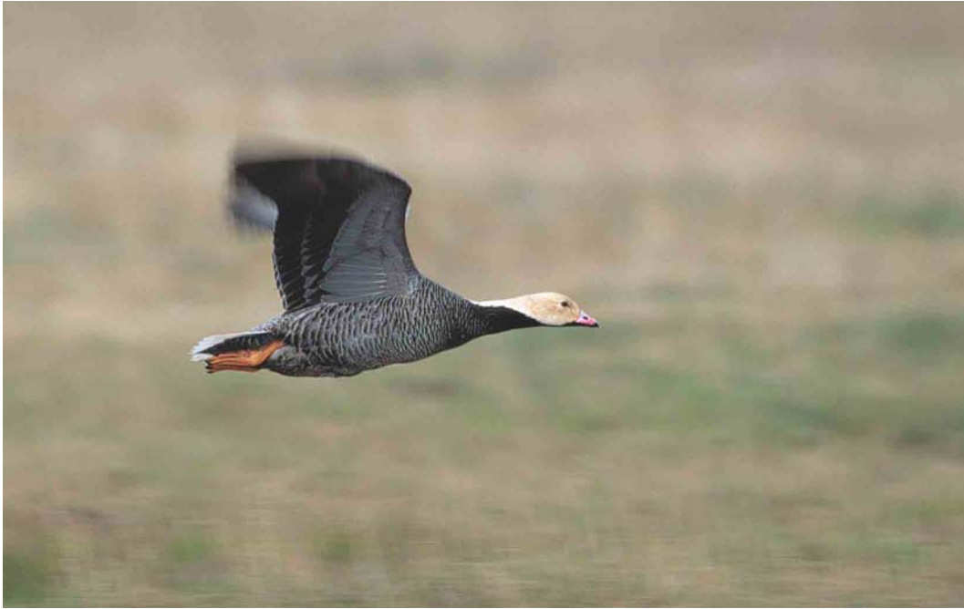
346-347 Emperor Goose / Keizergans Anser canagicus , Chukotka, Siberia, Russia, June 2000 (Chris Schenk)