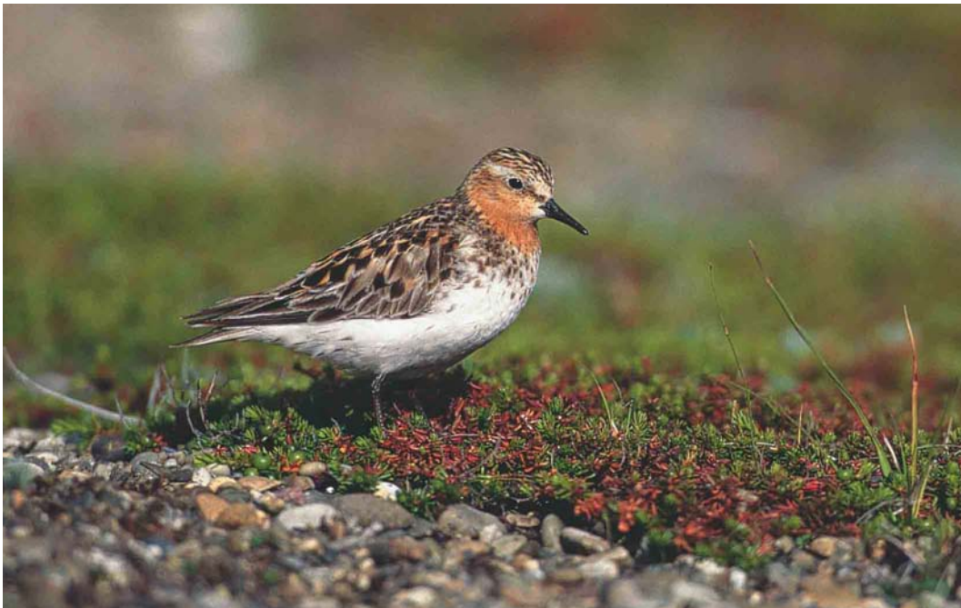
363 Red-necked Stint / Roodkeelstrandloper Calidris ruficollis , Chukotka, Siberia, Russia, July 2001