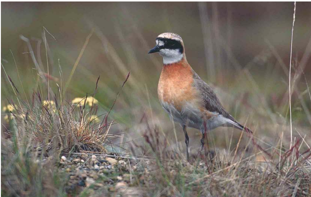
356 Lesser Sand Plover / Mongoolse Plevier Charadrius mongolus , Chukotka, Siberia, Russia, June 2001