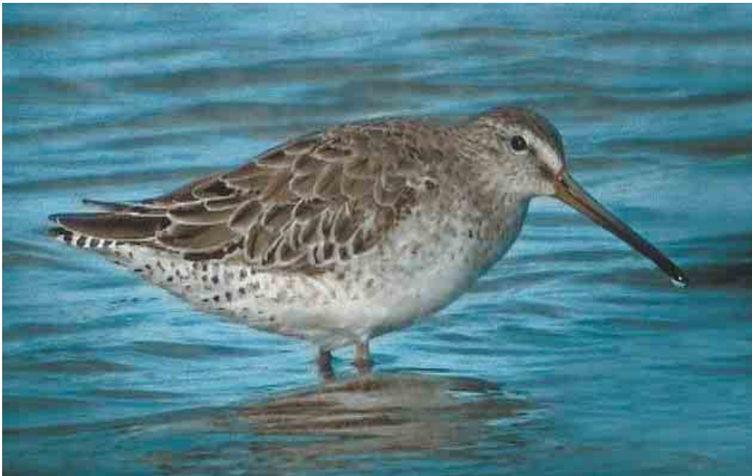
380 Short-billed Dowitcher / Kleine Grijze Snip Limnodromus griseus , first-summer, Lady's Island Lake, Wexford, Ireland, 2 July 2004 (Killian Mullarney)