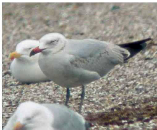
342-343 Audouins Meeuw / Audouin's Gull Larus audouinii , tweede-zomer, Neeltje Jans, Zeeland, 1 mei 2003 (Willem van Rijswijk)

zwarte punt snavel dieprood. Uiterste punt lichter, vooral in vooraanzicht opvallend.