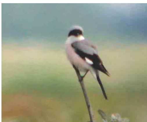
406 Iberische Tjiftjaf / Iberian Chiffchaff Phylloscopus ibericus , Vliegenbos, Amsterdam-Noord, Noord-Holland, 5 mei 2004 (Garry Bakker) 407 Blauwvleugeltaling / Blue-winged Teal Anas discors , mannetje, Grootte Vlak, Texel, Noord-Holland, 18 mei 2004 (Willem Hartholt) 408 Bonapartes Strandloper / White-rumped Sandpiper Calidris fuscicollis , De Hamert, Limburg, 22 mei 2004 (Ran Schols) 409 Steltstrandloper / Stilt Sandpiper Calidris himantopus , met Kempphaan / Ruff Philomachus pugnax , Ezumakeeg, Friesland, 16 mei 2004 (Bart-Jan Prak) 410 Roodkopklauwier / Woodchat Shrike Lanius senator , Itteren, Limburg, 22 mei 2004 (Ran Schols) 411 Kleine Klapekster / Lesser Grey Shrike Lanius minor , Bentwoud, Zuid-Holland, 3 juni 2004 (Adri de Groot)