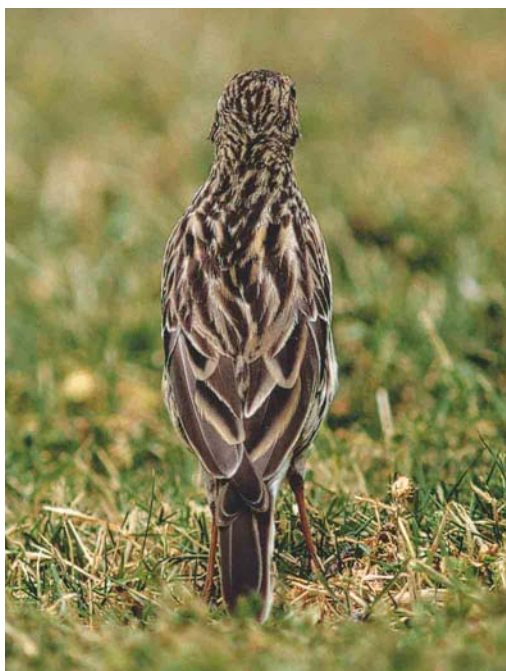
Mystery photograph VIII (March)

tion, harriers show a yellow cere, unlike the mystery bird. Due to the large variation of plumage colouration in both honey buzzards and buzzards, distinguishing these species on plumage features is rather difficult. The bluish cere of the mystery bird, however, leads to an easy elimination of buzzards, as these would show a yellow cere.