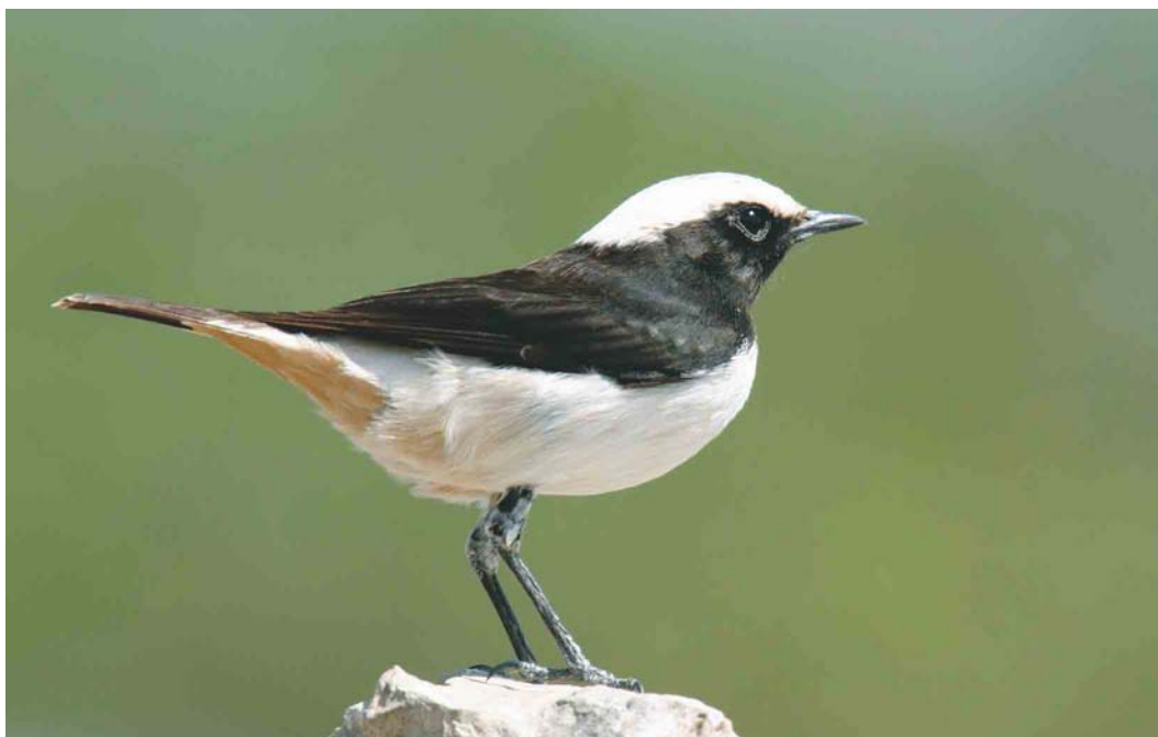
330 Arabian Wheatear / Arabische Rouwtapuit Oenanthe lugentoides , male, Dhofar mountains, Oman, 28 November 2003