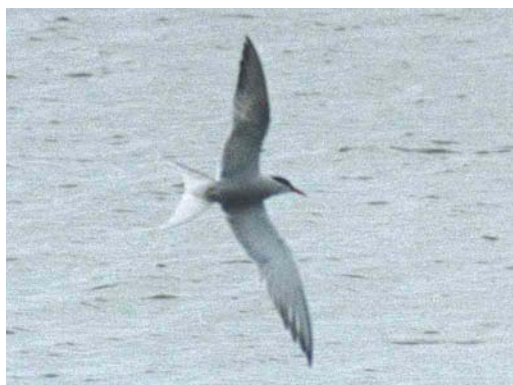
344-345 Melanistische Visdief / melanistic Common Tern Sterna hirundo , tussen Deventer en Olst, Overijssel, april 2001

MELANISTIC COMMON TERN NEAR DEVENTER IN APRIL 2001 In late April 2001, an unusually dark Common Tern Sterna hirundo was photographed among normally coloured Common Terns near Deventer, Overijssel, the Netherlands. Melanism in terns is rare and has only