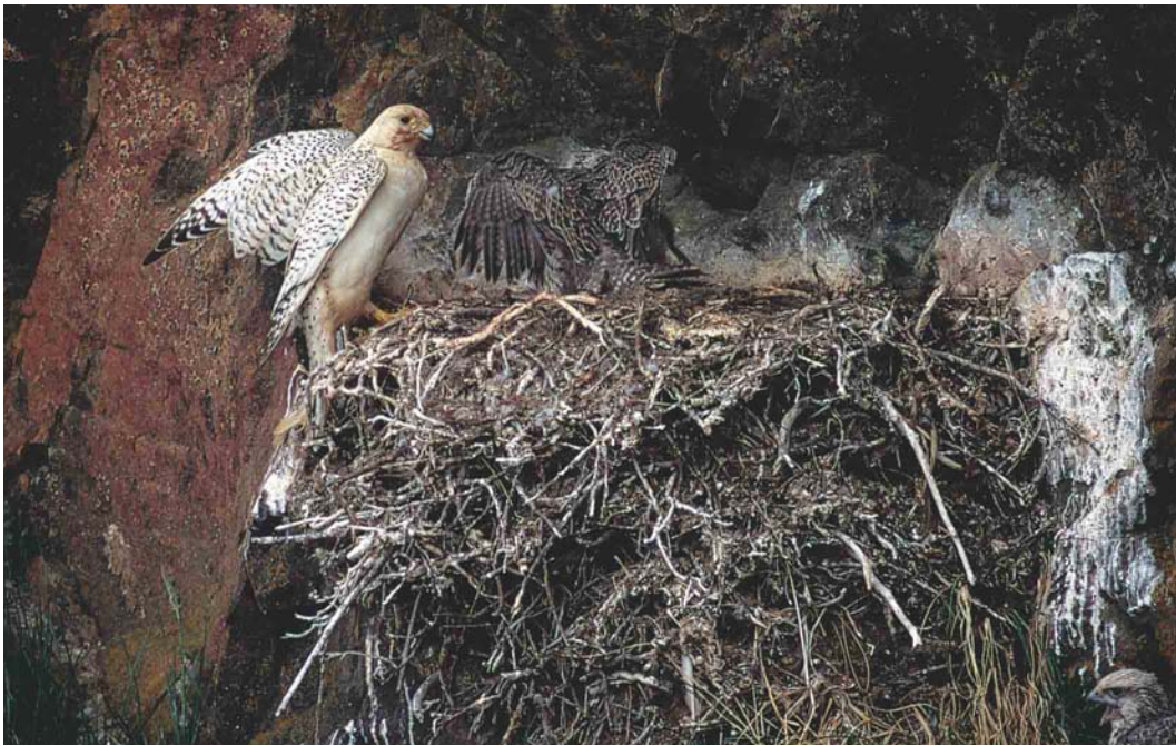
355 Gyr Falcons / Giervalken Falco rusticolus , Anadyr, Chukotka, Siberia, Russia, June 2000