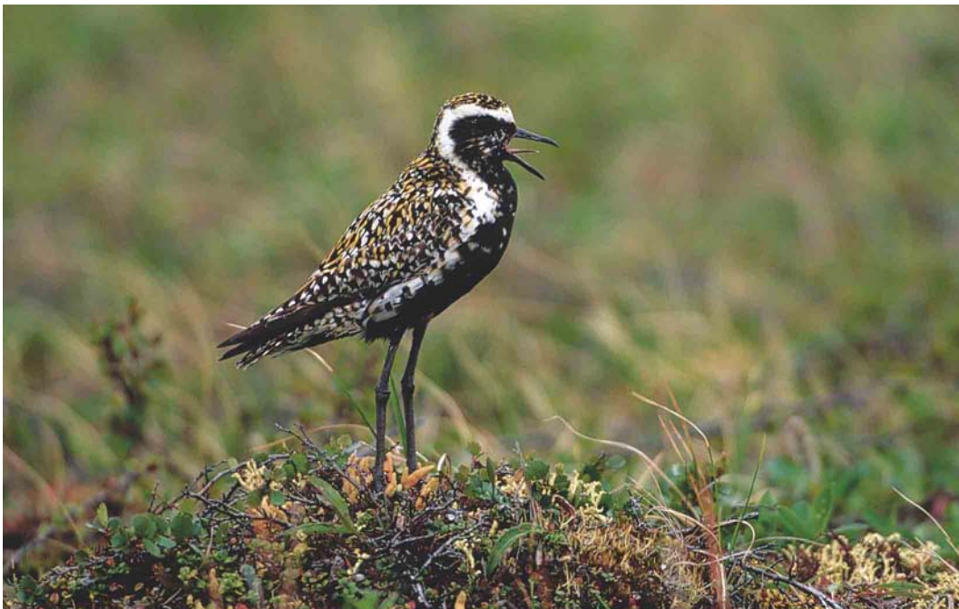
358 Pacific Golden Plover / Aziatische Goudplevier Pluvialis fulva , Yakutia, Siberia, Russia, July 1999