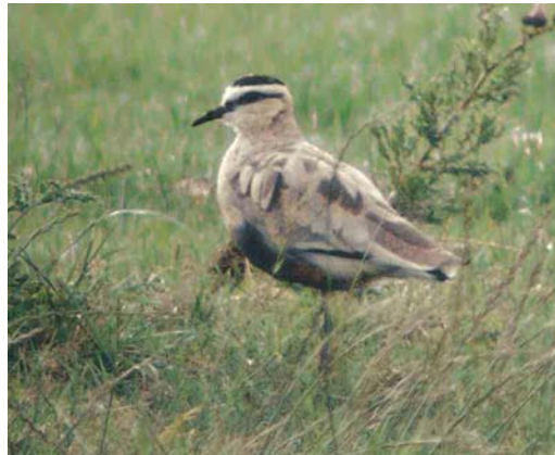
386 White-rumped Sandpiper / Bonapartes Strandloper Calidris fuscicollis , Rømø, Denmark, 12 July 2004 387 African Long-legged Buzzard / Afrikaanse Arendbuiser Buteo rufinus cirtensis , second calendar-year, Pantelleria, Italy, April 2004 388 Great Snipe / Poelsnip Gallinago media , Kerkin, Greece, April 2004 389 Sociable Lapwing / Steppekievit Vanellus gregarius , Holtgaster See, Rheiderland, Niedersachsen, Germany, 12 July 2004

reservoir near Wrocław, Silesia, Poland, on 25 February remained through June. A first-summer Laughing Gull L atricilla was reported from Gibraltar on 5 May. The first for Bulgaria was an adult at Shabla lake on 3-7 June. From 10 July, a second-year stayed at Lough Beg, Cork. If accepted, an adult Franklin's Gull L pipixcan in the Dombes, Ain, on 16-17 May will be the 16th for France. The fifth for Shetland was an adult on Foula on 10 June. A long-stayer at Vélez-Málaga, Spain, remained until at least 15 May. An adult turned up in Lincolnshire, England, on 12 July. First-summer Bonaparte's Gulls L philadelphia were seen in Sandgerði, Iceland, from 25 April to at least late May, in Ceredigion, Wales, on 7 May, at Valdoviño, A Coruña, Spain, on 19 May and at Bowling Green Marsh, Devon, England, on 9-18 June. At least two adults were briefly observed in Britain during May, in Cheshire and