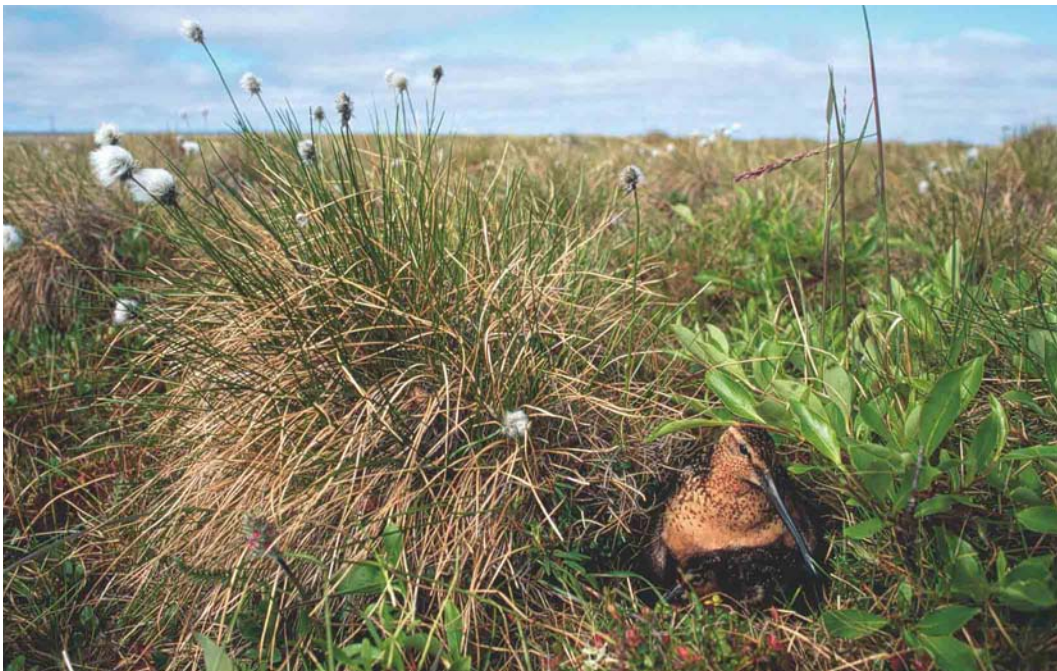
366 Long-billed Dowitcher / Grote Grijze Snip Limnodromus scolopaceus , Yakutia, Siberia, Russia, July 1999