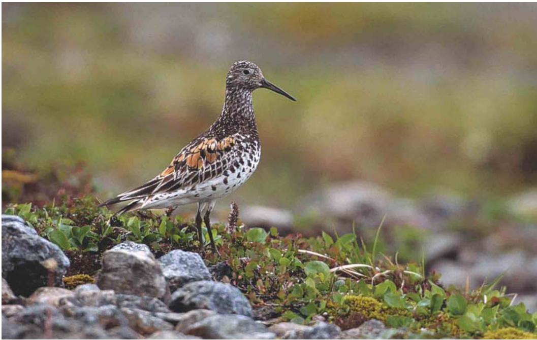
357 Great Knot / Grote Kanoet Calidris tenuirostris , Chukotka, Siberia, Russia, July 2001