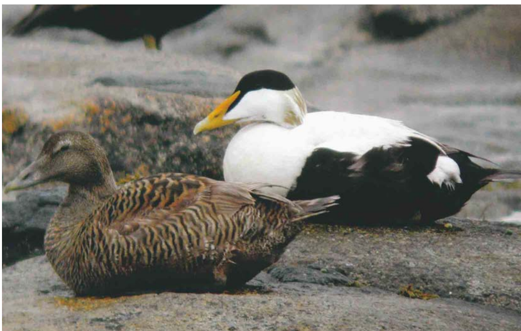
383 Boreal Eider / Noordelijke Eider Somateria mollissima borealis , male, Fanad Head, Donegal, Ireland, 6 June 2004 (Martin Garner)