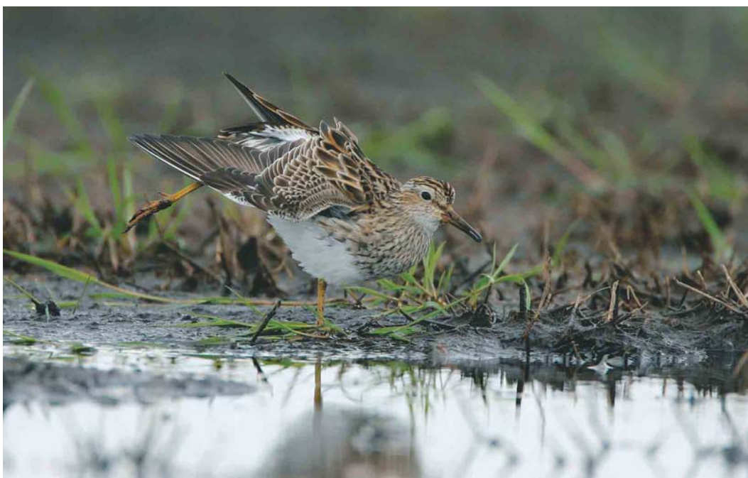
405 Gestreepte Strandloper / Pectoral Sandpiper Calidris melanotos , Annermoeras, Spijkerboor, Drenthe, 4 mei 2004